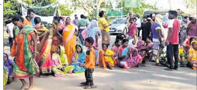
ମହିଳାମାନେ ରାସ୍ତା ଅବରୋଧ କରିଛନ୍ତି।

ବାରିପଦା ପୌର ନିର୍ବାଚନ ପ୍ରଚାର ସମୟରେ ଦଳୀୟ କର୍ମକର୍ତ୍ତାଙ୍କ ଅଶ୍ରାବ୍ୟ ଭାଷା ପ୍ରୟୋଗ ଅଭିଯୋଗରେ ଶନିବାର ମହିଳାମାନେ ବିରୋଧ ପ୍ରଦର୍ଶନ କରିଛନ୍ତି। ମହିଳାଙ୍କୁ ଅସମ୍ମାନ କରିବା ଘଟଣାକୁ ନେଇ ଖାରବେଳା ରାସ୍ତାରେ କୋର୍ଟ ଘର ଉଭୟ ପକ୍ଷରେ ବିରୋଧ ହୋଇଥିଲା। ଘଟଣା ସ୍ଥଳରେ ଗାଉଁର ପୋଲିସ୍ ପହଞ୍ଚି ବୁଝାଖୁଣି କରିବା ପରେ ପରିସ୍ଥିତି ସ୍ଵାଭାବିକ ହୋଇଛି। ଅନ୍ୟପକ୍ଷରେ ଭାଜପାକୁ ସମର୍ଥନ ଜଣାଇଥିବା ଯୁବକଙ୍କ ବୋକାଳ ଘରକୁ ବୁର୍ବୁରମାନେ ନିଆଁ ଲାଗାଇଛନ୍ତି। ଏନେଇ