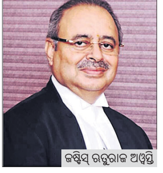
କିଷ୍ଟିଏ ଗରୁଡ଼ାକ ଅପ୍ରେଡି

ବହୁଚର୍ଚ୍ଚିତ ହିଜାବ ବିବାଦ ମାମଲାରେ ରାୟ ଦେଇଥିବା କର୍ମଚର ହାଇକୋର୍ଟର ବିଚାରପତିଙ୍କୁ ହତ୍ୟା ଧମକ ମିଳିବା ପରେ ସେମାନଙ୍କୁ 'ଡ୍ରାଇ' ସୁରକ୍ଷା ବ୍ୟବସ୍ଥା ଯୋଗାଇଦେବାକୁ ପୁଣ୍ୟମନ୍ତ୍ରୀ ବାସବରାଜ ବୋମାଲ ଘୋଷଣା କରିଛନ୍ତି। ରାୟ ପ୍ରଦାନ କରିଥିବା ୩ ଜଣ ବିଚାରପତିଙ୍କୁ ଏହି ସୁରକ୍ଷା ଯୋଗାଇଦେବାକୁ ପୁଣ୍ୟମନ୍ତ୍ରୀ କହିବା ସହ ହତ୍ୟା ଧମକ ଘଟଣାର ଉପଯୁକ୍ତ ତଦନ୍ତ ଲାଗି ପୋଲିସ୍ ଡିଡି ଏବଂ ଆଇଜିଙ୍କୁ ନିର୍ଦ୍ଦେଶ ଦେଇଛନ୍ତି।