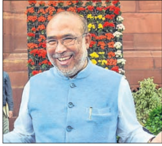
ଏବଂ ବୀରେନ୍ ସିଂ