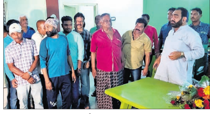
ନୂତନ କର୍ମୀଙ୍କୁ ସ୍ଵାଗତ କରାଯାଇଛି।

ଭଞ୍ଜନଗର, ୨୦୧୨(ବି.ଏନ୍.ଏ.) ଭଞ୍ଜନଗର ନଗର ବିଜେଡି ପକ୍ଷରୁ ଉପସାଧାରଣ ସଭାକୁ ସ୍ଵୀକୃତି ସଂସଦ ଭବନ ପରିସରରେ ଏକ ମିଶ୍ରଣ ପର୍ବ ଅନୁଷ୍ଠିତ ହୋଇଯାଇଛି। ଏଥିରେ ଭାଜପା ଏବଂ କଂଗ୍ରେସର ଶତାଧିକ ନେତା କର୍ମୀ ଦଳ ତ୍ୟାଗ କରି ବିଜେଡିରେ ମିଶିଛନ୍ତି। ସେମାନଙ୍କୁ ଜଙ୍ଗଲ ଓ ପରିବେଶ ମନ୍ତ୍ରୀ ବିକ୍ରମ କେଶରୀ ଆରୁଣ୍ୟ ସ୍ଵାଗତ କରିବା ସହ