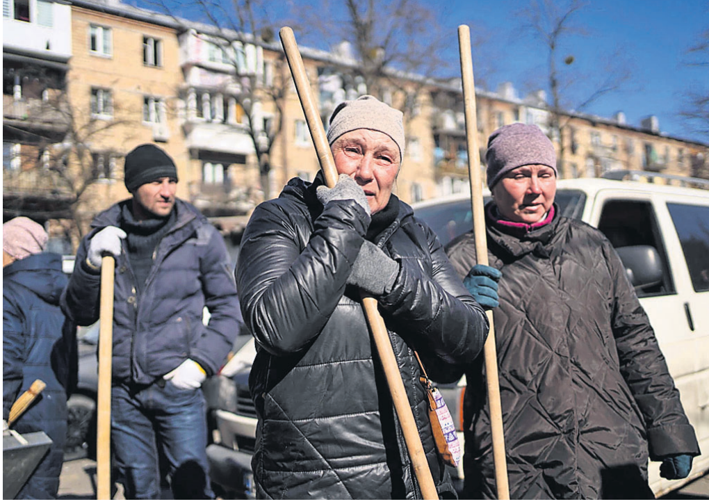
ରୁଷିଆ ଆକ୍ରମଣରେ କିଭ୍ରେ ଧ୍ୟ ସ ହୋଇଥିବା ରେସିଡେନ୍ସିଆଲ ବିଲ୍ଡିଂର ଉଦ୍ଧାରକର୍ତ୍ତା ସମାଜ କର୍ମୀଙ୍କୁ ଆସିଥିବା ଜଣେ ମହିଳା କାହୁଁଛନ୍ତି।

ୟୁକ୍ରେନ୍ ଉପରେ ୨୫ ଦିନ ଧରି ଆକ୍ରମଣ କରି ରଖୁଥିବା ରୁଷିଆ ସେଠାକାର ସାଧାରଣ ନାଗରିକଙ୍କୁ କ୍ରମାଗତ ଚାର୍ଟର୍ଡ଼ କରୁଛି। ଗତ ସପ୍ତାହରେ ପ୍ରାୟ ୧୪ ଶହ ଲୋକ ଆଶ୍ରୟ ନେଇଥିବା ମାରିଡ଼ପୋଲର ଏକ ଥିଏଟର ଉପରେ ରୁଷିଆ ବୋମା ପକାଇଥିବାବେଳେ ଏବେ ସେଠାରେ ଥିବା ଏକ ଆର୍ଟ୍ ସ୍କୁଲ ଉପରେ ଆକ୍ରମଣ କରିଛି। ଉକ୍ତ ସ୍କୁଲରେ ପ୍ରାୟ ୪୦୦ ଲୋକ ରୁଷିଆ ଆକ୍ରମଣରେ ଭୟଭୀତ ହୋଇ ଲୁଚି ରହିଥିଲେ ବୋଲି ୟୁକ୍ରେନ୍ ପକ୍ଷରୁ ଜଣାଯାଇଛି। ତେବେ ଏହି ଆକ୍ରମଣରେ କେତେଜଣ ମୃତ୍ୟୁ ହୋଇଛନ୍ତି, ସେ ନେଇ କୌଣସି ସୂଚନା ଦିଆଯାଇନାହିଁ। ଥିଏଟର ଆକ୍ରମଣରେ ବିଲ୍‌ରେ ପସିରହିଥିବା ୧୩୦ ଜଣଙ୍କୁ ଉଦ୍ଧାର କରାଯାଇପାରିଛି। ଆଜୋଭ୍ ସାଗର ନିକଟରେ ଥିବା ବନ୍ଦର ସହର ମାରିଡ଼ପୋଲ ଉତ୍ତରରେ ଥିବା ଦୁଷ୍ଟିଏ ଏକ ଗୁରୁତ୍ୱପୂର୍ଣ୍ଣ ସ୍ଥାନ। ସେଠାରେ ରୁଷିଆ ୩ ସପ୍ତାହ ହେଲାଣି ମିଶାଇଲ, ବୁମ୍‌ବୁମ୍ ଆଦି କରୁଛି ମୌଳିକ