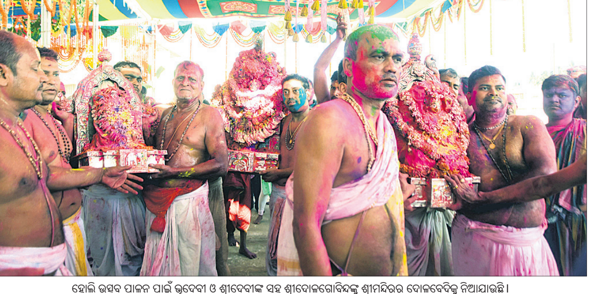
ହୋଲି ଉତ୍ସବ ପାଳନ ପାଇଁ ଭୁବନେଶ୍ୱର ଓ ଶ୍ରୀଦେବୀଙ୍କ ସହ ଶ୍ରୀଦେବୀଙ୍କୋଦିବଙ୍କୁ ଶ୍ରୀମନ୍ଦିରର ବୋଇବେଦିକୁ ନିଆଯାଉଛି।