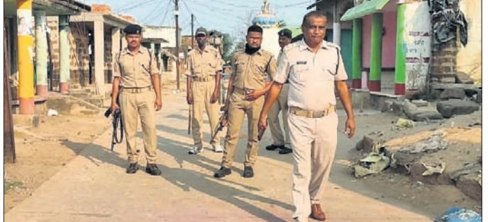
ଦଣ୍ଡୁଆସିପଡ଼ାରେ ପୋଲିସ୍ ଯୁଦ୍ଧ ମାର୍ଚ୍ଚ।

ବ୍ରହ୍ମଗିରି, ୨୦୧୨(ବି.ଏନ୍.ଏ) ରାଜନୈତିକ ବିବାଦ ତଥା ପୂର୍ବ ଶତ୍ରୁତା ଏବଂ ହୋଲିଖେଳକୁ କେନ୍ଦ୍ରକରି ପୁରୀ ଜିଲା ବ୍ରହ୍ମଗିରି ଥାନା ଅନ୍ତର୍ଗତ ଦଣ୍ଡୁଆସିପଡ଼ା ଗ୍ରାମରେ ଶନିବାର ପୁଣି ଗୋଷ୍ଠୀ ସଂଘର୍ଷ ସହ ବୋମା ମାଡ଼ ହୋଇଛି। ୩୦ରୁ ଊର୍ଦ୍ଧ୍ଵ ବୋମାମାଡ଼ରେ କେତେକ ଘର କ୍ଷତିଗ୍ରସ୍ତ ହୋଇଥିବାବେଳେ ଦୁଇଜଣ ଆହତ ହୋଇଛନ୍ତି। ପୋଲିସ୍ ଭୟରେ ଗାଁ ଏବେ ପୁରୁଣାଶୂନ୍ୟ ହୋଇପଡ଼ିଛି। ସୁନା ଅନୁଯାୟୀ, ବ୍ରହ୍ମଗିରି ବ୍ଲକ୍ ଅନ୍ତର୍ଗତ ମଣିପାଡ଼ା ଗ୍ରାମପଞ୍ଚାୟତର ଦଣ୍ଡୁଆସିପଡ଼ା ଗ୍ରାମରେ ଗତ ୯ ତାରିଖରେ ଏକ ରାଜନୈତିକ ଶୋଭାଯାତ୍ରାକୁ ନେଇ