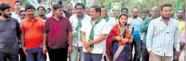
ବିଧାୟକଙ୍କ ସହ ତେନ୍ଦ୍ରାବନପାଳ ଓ କାଉନସିଲର ପ୍ରାର୍ଥୀ।

ବନ୍ଧପଲ୍ଲୀ ୨୧୩ (ଡି.ଏନ.ଏ.) ପୌର ନିର୍ବାଚନ ନିମନ୍ତେ ବନ୍ଧପଲ୍ଲୀ ଏନ୍-ଏସିରେ ବିକେଡ଼ି ପକ୍ଷରୁ ନିର୍ବାଚନ ପ୍ରସାର ପ୍ରଚାର ହୋଇଛି।