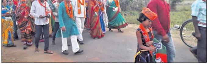
ଭାଜପା ପକ୍ଷରୁ ପ୍ରଚାର କରାଯାଇଛି।

ସାଧାରଣ ପ୍ରାର୍ଥୀ ମଧ୍ୟ ନୟାଗଡ଼ ପ୍ରସାରରେ ଭାଜପା ଟଙ୍କା ଦେଇ ପାରୁ ନ ଥିବାରୁ ପ୍ରାର୍ଥୀମାନେ ବିରୋଧୀ ପ୍ରାର୍ଥୀଙ୍କୁ ସମର୍ଥନ ଦେଇଛନ୍ତି।