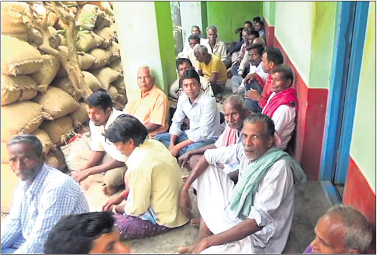
ଗୌରାଙ୍ଗପୁର ପ୍ରାଥମିକ କୃଷି ସମବାୟ ସମିତି ଆଗରେ ଧାନ ବସ୍ତା ରଖି ଗାଷ୍ଟାକ ଧାରଣା।

ନୟାଗଡ଼ ଜିଲ୍ଲା ରଣପୁର ବ୍ଲକ ଗୌରାଙ୍ଗପୁର ପ୍ରାଥମିକ କୃଷି ସମବାୟ ସମିତିରେ ମିଳିତ, ସମ୍ପାଦକ, ବିଭାଗୀୟ ଅଧିକାରୀଙ୍କ ଅପାରଗତାକୁ ୮୩ ଗାଷ୍ଟାକ ଗୋକନ ଲାସୁ ହୋଇଯାଇଛି।