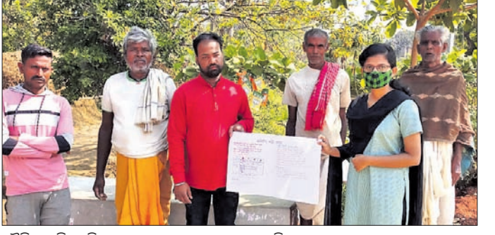
ଜୈବିକ କୃଷି ଲାଗି ଛାତ୍ରୀ ଚାଷୀଙ୍କୁ ସଚେତନ କରୁଛନ୍ତି।

ନୟାଗଡ଼ ବ୍ଲକ ମାନ୍ଦିପଡ଼ା ଗାଁରେ ଜୈବିକ କୃଷି ଉପରେ ଏକ ସଚେତନତା କାର୍ଯ୍ୟକ୍ରମ ଅନୁଷ୍ଠିତ ହୋଇଯାଇଛି।