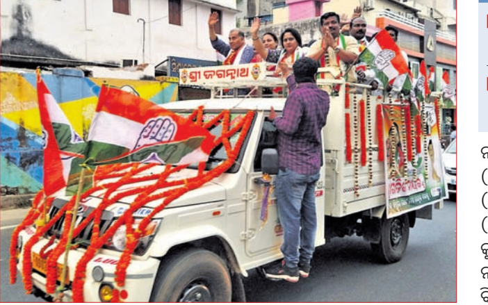
କଂଗ୍ରେସ ପକ୍ଷରୁ ପ୍ରାର୍ଥୀଙ୍କୁ ନେଇ ରୋଡ଼ ଶୋ' କରାଯାଇଛି।