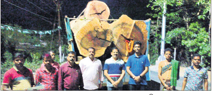
ରୁକୁଣା ରଥ କାଠକୁ ଟ୍ରକ୍ ଯୋଗେ ପଠାଯାଇଛି।

ଚଳିତବର୍ଷ ପ୍ରଭୁ ଶ୍ରୀଲିଙ୍ଗରାଜଙ୍କ ରୁକୁଣା ରଥ ନିର୍ମାଣ ନିମନ୍ତେ ସୋମବାର ଖଣ୍ଡପଡ଼ା ଅଞ୍ଚଳରୁ ୮ ଗୋଟି ଖଣ୍ଡର ଗଣ୍ଡି (କାଠ) ଭୁବନେଶ୍ୱର ପଠାଯାଇଛି।