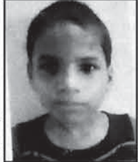
ଏତଦ୍ୱାରା ସର୍ବସାଧାରଣ ଅବଗତ ନିମନ୍ତେ ଜଣାଇ ଦିଆଯାଉଅଛି କି ଯେ, ନିମ୍ନଲିଖିତ ଶିଶୁମୁଖ ଉଦ୍ଧାରଣ ହୋଇ ଚିକିତ୍ସା ଶିଶୁମୁଖ ସମ୍ପର୍କରେ କରାଯାଇଛି...