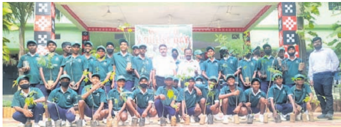
ସବୁଜ ବାହିନୀ ଛାତ୍ରାଛାତ୍ରୀ