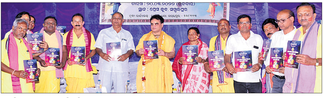
ସ୍ମରଣିକା ଉନ୍ନତ କରିବାକୁ ଅତିଥିବୁଦ।

ଭଗବାନଙ୍କ ନାମ ସଂକୀର୍ତନରେ ଅପାର ଶକ୍ତି ରହିଛି। କଳି ଯୁଗରେ ହରିନାମ ସଂକୀର୍ତନ ସଂସାର ବନ୍ଧନକୁ ଖଣ୍ଡନ କରି ମୋକ୍ଷ ପ୍ରାପ୍ତି କରାଇବାରେ ସହାୟକ ହୋଇଥାଏ। ତେଣୁ ଜୀବନର ପ୍ରତି ମୁହୂର୍ତ୍ତ ହରି ରସାୟନରେ ରସଶିଳ୍ପ କରିବା ଜରୁରୀ। ସମ୍ବଲପୁର ପ୍ରେସ କ୍ଲବ୍ ସଭାକକ୍ଷରେ ଆୟୋଜିତ ପଣ୍ଡିମ ପ୍ରତିଯୋଗୀଙ୍କୁ ପୁରସ୍କୃତ କରାଯାଇଥିଲା।