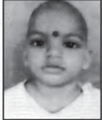
ଏତଦ୍ୱାରା ସର୍ବସାଧାରଣ ଅବଗତ ନିମନ୍ତେ ଜଣାଇ ଦିଆଯାଉଅଛି କି ଯେ, ନିମ୍ନଲିଖିତ ଶିଶୁମୁଖ ଉଦ୍ଧାରଣ ହୋଇ ଚିକିତ୍ସା ଶିଶୁମୁଖ ସମ୍ପର୍କରେ କରାଯାଇଛି...