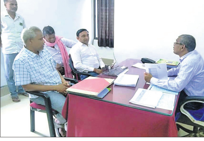
ଗାଷୀ ପ୍ରତିନିଧିମାନେ ଜିଲ୍ଲା ମୁଖ୍ୟ ଯୋଗାଣ ଅଧିକାରୀଙ୍କୁ ଭେଟୁଛନ୍ତି।

ବରଗଡ଼ ଅଧିକ, ୨୧।୩: ଟାରିକ୍ଷ ଏବଂ କୁଳ ୧୭ ୟୁଏସଡିଏଏଏ ଟୋକନ ଅବଧି ରହିଛି। ଟାରିକ୍ଷ ଏବଂ କୁଳ ୧୭ ୟୁଏସଡିଏଏଏ ଟୋକନ ଅବଧି ରହିଛି। ଟାରିକ୍ଷ ଏବଂ କୁଳ ୧୭ ୟୁଏସଡିଏଏଏ ଟୋକନ ଅବଧି ରହିଛି।