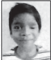
ଏତଦ୍ୱାରା ସର୍ବସାଧାରଣ ଅବଗତ ନିମନ୍ତେ ଜଣାଇ ଦିଆଯାଉଅଛି କି ଯେ, ନିମ୍ନଲିଖିତ ଶିଶୁମୁଖ ଉଦ୍ଧାରଣ ହୋଇ ଚିକିତ୍ସା ଶିଶୁମୁଖ ସମ୍ପର୍କରେ କରାଯାଇଛି...