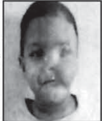
ଏତଦ୍ୱାରା ସର୍ବସାଧାରଣ ଅବଗତ ନିମନ୍ତେ ଜଣାଇ ଦିଆଯାଉଅଛି କି ଯେ, ନିମ୍ନଲିଖିତ ଶିଶୁମୁଖ ଉଦ୍ଧାରଣ ହୋଇ ଚିକିତ୍ସା ଶିଶୁମୁଖ ସମ୍ପର୍କରେ କରାଯାଇଛି...