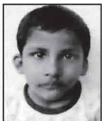
ଏତଦ୍ୱାରା ସର୍ବସାଧାରଣ ଅବଗତ ନିମନ୍ତେ ଜଣାଇ ଦିଆଯାଉଅଛି କି ଯେ, ନିମ୍ନଲିଖିତ ଶିଶୁମୁଖ ଉଦ୍ଧାରଣ ହୋଇ ଚିକିତ୍ସା ଶିଶୁମୁଖ ସମ୍ପର୍କରେ କରାଯାଇଛି...