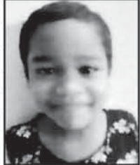
ଏତଦ୍ୱାରା ସର୍ବସାଧାରଣ ଅବଗତ ନିମନ୍ତେ ଜଣାଇ ଦିଆଯାଉଅଛି କି ଯେ, ନିମ୍ନଲିଖିତ ଶିଶୁମୁଖ ଉଦ୍ଧାରଣ ହୋଇ ଚିକିତ୍ସା ଶିଶୁମୁଖ ସମ୍ପର୍କରେ କରାଯାଇଛି...