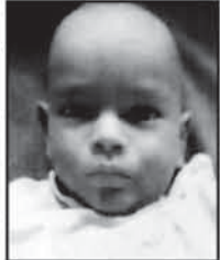
ଏତଦ୍ୱାରା ସର୍ବସାଧାରଣ ଅବଗତ ନିମନ୍ତେ ଜଣାଇ ଦିଆଯାଉଅଛି କି ଯେ, ନିମ୍ନଲିଖିତ ଶିଶୁମୁଖ ଉଦ୍ଧାରଣ ହୋଇ ଚିକିତ୍ସା ଶିଶୁମୁଖ ସମ୍ପର୍କରେ କରାଯାଇଛି...