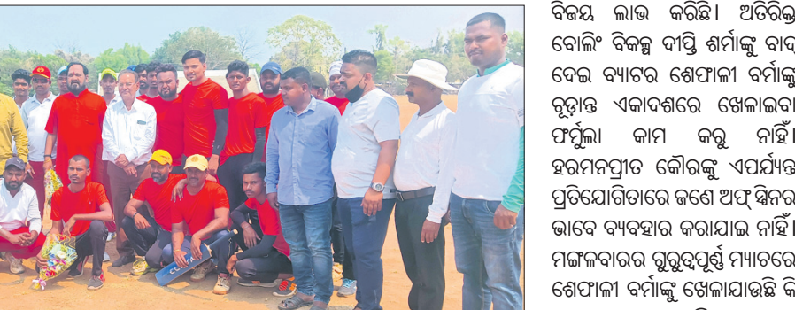
ପୁଷ୍ପାଅଧିକାରୀଙ୍କ ସହ ଖେଳାଳିମାନେ।

୪ର୍ଥ ନୂଆପଡ଼ା କପ ଚେମିସ୍ କଲ୍ କ୍ରିକେଟ୍ ଚୁନାମେଶ୍ୱ ଭିଲାଇ ନିର୍ବାସିତ ୧୦ ଓଭରରେ ସମସ୍ତ ଉଇକେଟ ହରାଇ ୬୯ ରନ ସଂଗ୍ରହ କରି ପରାସ୍ତ ହୋଇଥିଲା। ଦ୍ୱିତୀୟ ମ୍ୟାଚ ଏମ୍‌ଏମ୍‌ସିସି ସମ୍ବଲପୁର ଓ ବ୍ରୋକୋଡ଼ ନୂଆପଡ଼ା ମଧ୍ୟରେ ହୋଇଥିଲା। ଏମ୍‌ଏମ୍‌ସିସି ବ୍ୟାଟିଂ କରି ୧୦ ଓଭରରେ ୧୩୭ ରନ ସଂଗ୍ରହ କରିଥିଲା। ଜବାବରେ ନୂଆପଡ଼ା ନିର୍ବାସିତ ଓଭରରେ ସମସ୍ତ ଉଇକେଟ ହରାଇ ମାତ୍ର ୫୭ ରନ ସଂଗ୍ରହ କରି ପରାସ୍ତ ହୋଇଥିଲା।