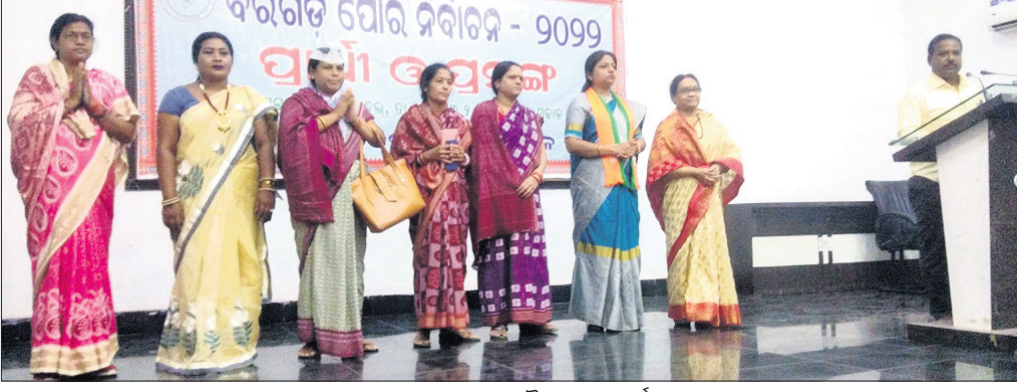
ଆଲୋଚନାତନ୍ତ୍ର ମଞ୍ଚରେ ପୌରାଧ୍ୟକ୍ଷା ପ୍ରାର୍ଥନାକୃତ।

ବରଗଡ଼ ଅଧିକ, ୨୧।୩: ପୌର ନିର୍ବାଚନକୁ ମାତ୍ର ୩ଦିନ ବାକି। ୨୪ତାରିଖରେ ଭୋଟ୍ ଗ୍ରହଣ ହେବ। ୨୨ତାରିଖ ନିର୍ବାଚନ ପ୍ରଚାର ଶେଷ ଦିବସ।