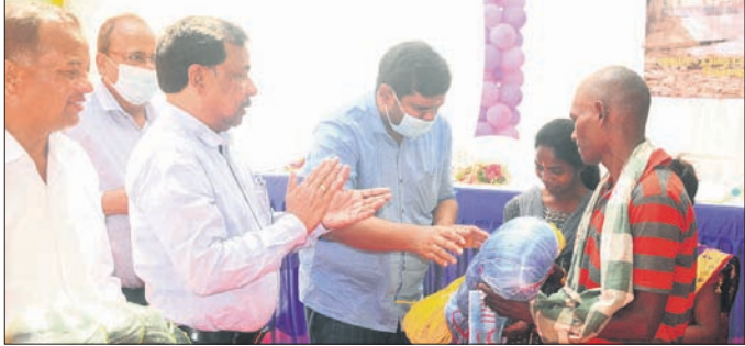
ଜିଲାପାଳ ମହ୍ୟଜୀବାଙ୍କୁ ଜାଲ ବିତରଣ କରୁଛନ୍ତି।