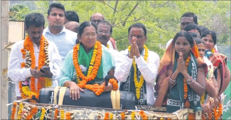
ଦେବଗଡ଼ରେ ମନ୍ତ୍ରୀ ସୁଶାନ୍ତ ସିଂ ଓ ଅନ୍ୟମାନେ ପ୍ରଚାର କରୁଛନ୍ତି।

ପୌର ପରିଷଦ ନିର୍ବାଚନ ପାଇଁ ଏବେ ଦେବଗଡ଼ ସହର ପଡ଼ୁଛି ଉତ୍ତୁକ। ମୁଖ୍ୟମନ୍ତ୍ରୀ ଦଳୀୟ ପ୍ରାର୍ଥୀଙ୍କ ବିଜୟ ପାଇଁ ସମସ୍ତ ରାଜନୈତିକ ଦଳ ଅଣ୍ଟା ଭିଡ଼ିଛନ୍ତି।