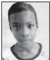
ଏତଦ୍ୱାରା ସର୍ବସାଧାରଣ ଅବଗତ ନିମନ୍ତେ ଜଣାଇ ଦିଆଯାଉଅଛି କି ଯେ, ନିମ୍ନଲିଖିତ ଶିଶୁମୁଖ ଉଦ୍ଧାରଣ ହୋଇ ଚିକିତ୍ସା ଶିଶୁମୁଖ ସମ୍ପର୍କରେ କରାଯାଇଛି...