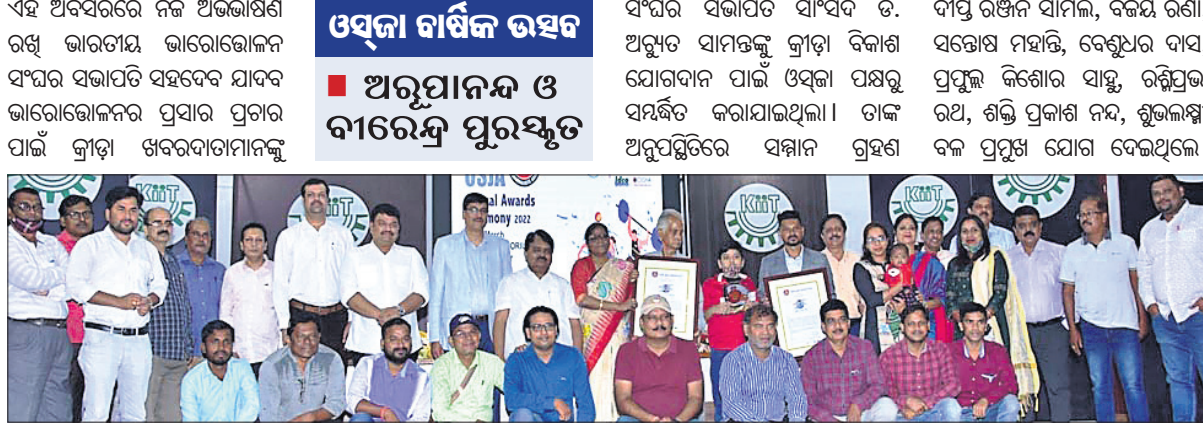
ପୁରସ୍କୃତ ଜ୍ରାଡ଼ାବିତ୍ ଓ ଅତିଥିଙ୍କ ସହ ଓଡ଼ିଶା ଓଡ଼ିଶା ଓଡ଼ିଶା ଆସୋସିଏସନ୍‌ର କର୍ମକର୍ମୀ।