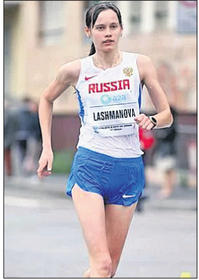
ଲଣ୍ଡନ, ୨୧ମ (ଏପି): ଚୋପି ପାଇଁ ରୁଷିଆ ରେସ୍ ଥ୍ରକର ଯେଲେନା ଲାଶ୍ଚିନୋଭା