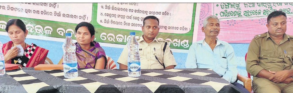
କାର୍ଯ୍ୟକ୍ରମରେ ଯୋଗଦେଇଥିବା ଅତିଥିମାନେ।