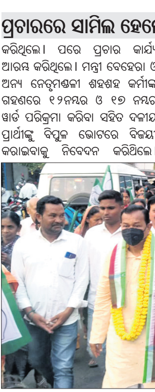
ରୁଝପାଲିଠାରେ ମନ୍ତ୍ରୀ ପଦ୍ମନାଭ ବେହେରା, ବିଧାୟକ ପ୍ରଦୀପ କୁମାର ଅମତ ଦଳୀୟ ନେତା ଓ କର୍ମୀଙ୍କ ସହ ପ୍ରଚାର କରୁଛନ୍ତି।

ପ୍ରଚାରରେ ସାମିଲ ହେଲେ ମନ୍ତ୍ରୀ ପଦ୍ମନାଭ ବେହେରା କରାଯାଇଛି। ପ୍ରଚାର କାର୍ଯ୍ୟ ଆରମ୍ଭ କରିଥିଲେ। ମନ୍ତ୍ରୀ ବେହେରା ଓ ଅନ୍ୟ ନେତୃମଣ୍ଡଳୀ ଶହଶହ କର୍ମୀଙ୍କ ସହ ଉପସ୍ଥାପନ କରାଯାଇଛି।