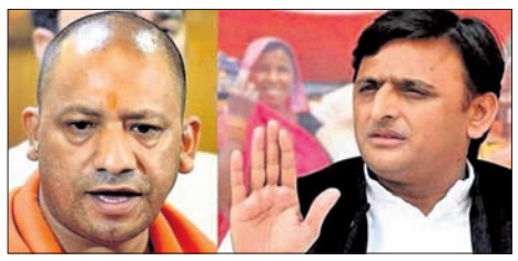
ଯୋଗୀ ଆଦିତ୍ୟନାଥ ଓ ଅଖିଲେଶ ଯାଦବ

ଲକ୍ଷ୍ନୌ/ନୂଆଦିଲ୍ଲୀ, ୨୨୩୩ ଭାରତୀୟ ପ୍ରଦେଶର କାମଗଜା ମୁଖ୍ୟମନ୍ତ୍ରୀ ଯୋଗୀ ଆଦିତ୍ୟନାଥ ସଦର ଗୋରଖପୁର ସଦର ବିଧାନସଭାରେ ନିର୍ବାଚିତ ହୋଇଥିବା ବିଧାନ ପରିଷଦ ସଦସ୍ୟତା ତ୍ୟାଗ କରିଛନ୍ତି। ସେ ମଙ୍ଗଳବାର ବିଧାନ ପରିଷଦ ଅଧ୍ୟକ୍ଷଙ୍କୁ ଦେଇଛନ୍ତି। ପ୍ରକାଶ ଯେ, ନିକଟରେ ପ୍ରଥମ ଥର ପାଇଁ କରହାଲ ଆସନରୁ ବିଧାନସଭାରେ ବିଧାନସଭା ପାର୍ଟି (ଏସପି) ଅଧ୍ୟକ୍ଷ ଅଖିଲେଶ ଯାଦବ ଆଜମ୍ ଖାନ୍ ଆସନରୁ ଏସପି ଭାବେ ଇସ୍ତଫା ଦେଇଛନ୍ତି। ଅଖିଲେଶ ଲୋକ ସଭା ନାଗରଠି ଓମ୍ ବିଳାକୁ ଇସ୍ତଫାପତ୍ର ଦେଇଛନ୍ତି। ରାମପୁର ନିର୍ବାଚନକ୍ଷେତ୍ରରୁ