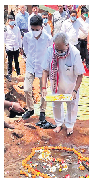
ରାଜ୍ୟପାଳ ଗଣେଶ ଲାଲ ସୀତାକୁଣ୍ଡରୁ ଜଳ ସଂଗ୍ରହ କରୁଛନ୍ତି ।

ମଙ୍ଗଳବାର ରାଜ୍ୟପାଳ ପ୍ରଫେସର ଗଣେଶ ଲାଲ ମାଲକାନଗିରି ଜିଲ୍ଲା ଖଜୁରପୁଟ ବ୍ଲକ୍‌ର ବନ୍ଧାଘାଟି ଗସ୍ତ କରିଛନ୍ତି । ଅଯୋଧ୍ୟାରେ ନିର୍ମାଣ ହେଉଥିବା ରାମମନ୍ଦିର ପାଇଁ ରାଜ୍ୟପାଳ ପୂର୍ବଦିଗରେ ଥିବା ସୀତାକୁଣ୍ଡରୁ ଜଳ ସଂଗ୍ରହ କରିଛନ୍ତି । ଉକ୍ତ ଜଳକଳସ ରାମନବମୀ ଦିନ ଅଯୋଧ୍ୟାରେ ପହଞ୍ଚିବ । ସୀତାକୁଣ୍ଡ ସହ ଏପରି ୧୩୦୦ ପବିତ୍ର ସ୍ଥାନରୁ ଜଳ ସଂଗ୍ରହ ଲାଗି ଲକ୍ଷ୍ୟ ରଖାଯାଇଛି । ବିଶେଷକରି ବନବାସ ସମୟରେ ଶ୍ରୀରାମଚନ୍ଦ୍ର ଯେଉଁ ସ୍ଥାନରେ ସମୟ ବିତାଇଥିଲେ ସେହି ପବିତ୍ର ସ୍ଥାନରୁ ଜଳ ସଂଗ୍ରହ କରାଯାଇଛି । ଶ୍ରୀରାମଚନ୍ଦ୍ରଙ୍କ ବନବାସ ସହ ବନ୍ଧାଘାଟିର ସୀତାକୁଣ୍ଡ ଜଡ଼ିତ ଥିବା କିମ୍ବଦନ୍ତୀ ରହିଛି । ତେଣୁ ଅଯୋଧ୍ୟା ଓ ଅନ୍ୟ ସ୍ଥାନରୁ ଆସିଥିବା ସାଧୁସନ୍ଥଙ୍କ ସହ ରାଜ୍ୟପାଳ ଜଳ