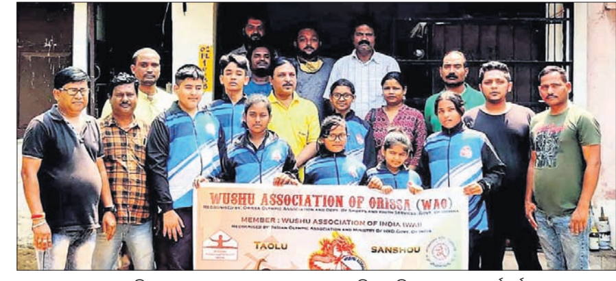
ଜାତୀୟ ସର୍ବଜୁନିୟର ଉତ୍ତୋଳନରେ ଭାରନେବକୁ ମନୋନୀତ ଓଡ଼ିଶା ପ୍ରତିଯୋଗୀମାନେ କର୍ମକର୍ତ୍ତା ସହ ।