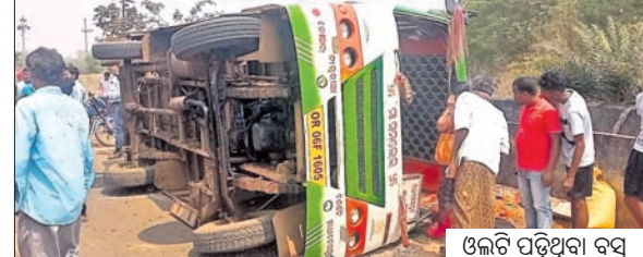
ଓଲଟି ପଡ଼ିଥିବା ବସ୍