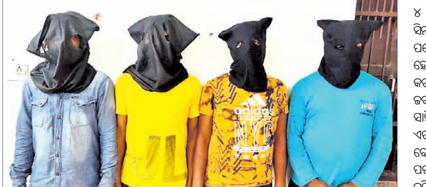
ଗିରଫ ୪ ଅଭିଯୁକ୍ତ।