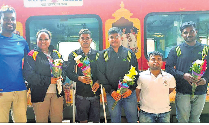
ରାଜ୍ୟ ପାରାସ୍ପୋର୍ଟ୍ କର୍ମକର୍ତ୍ତାଙ୍କ ସହ ଓଡ଼ିଶା ପ୍ରତିଯୋଗୀ ।