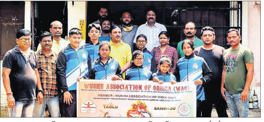
ଜାତୀୟ ସବ୍‌ଜୁନିୟର ଉତ୍ତରରେ ଭାରନେବାକୁ ମନୋନୀତ ଓଡ଼ିଶା ପ୍ରତିଯୋଗୀମାନେ କର୍ମକର୍ତ୍ତା ସହ ।