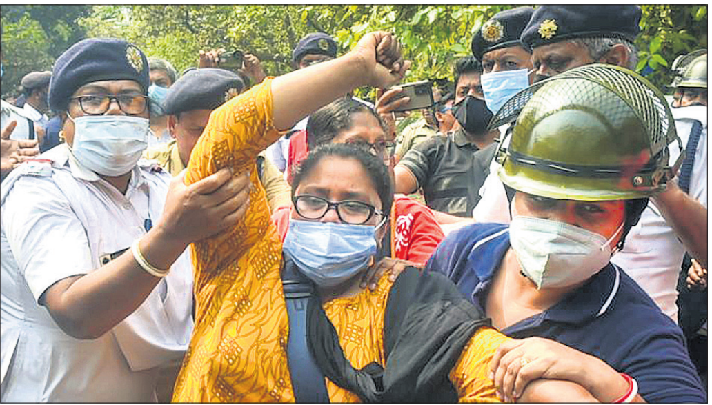
ରାମପୁରହାଟ ଗୃହଦାହ ଘଟଣାର ପ୍ରତିବାଦରେ ଏସ୍‌ପିଆଇ ପକ୍ଷରୁ ବିରୋଧ କେବଳ କଟଣ କର୍ମୀଙ୍କୁ କୋଲକାତା ପୋଲିସ୍ ଅଟକାଇଛି।