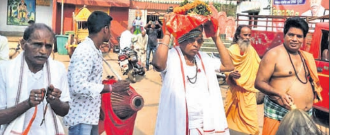
ଜଗନ୍ନାଥ ମନ୍ଦିରର ନୂତନ ବିଗ୍ରହ ପାଇଁ ଦାରୁ ଛେଦନ ପୂର୍ବରୁ ଆଜ୍ଞାମାଳ ନିଆଯାଇଛି।

କାମାକ୍ଷୀନଗର, ୨୩/୩(ଡି.ଏନ.ଏ.): ଦେଢ଼ାମାଳ ଜିଲା କଳତାହାଡ଼ କୁଳ ବଟଗାଁ ଗ୍ରାମରେ ଗୋଟିଏ ଗ୍ରାମର ବିଦ୍ୟୁତ୍ ବରାଳ ବୁଧବାର ଅଗୋ ଧକ୍କାରେ ଗୁରୁତର ହୋଇଛନ୍ତି। ଡିପ୍ରେସନ୍ ସମୟରେ ବିଦ୍ୟୁତ୍ ନିକ ବୋକାଳକୁ ଘରକୁ ଖାଲିବାକୁ ଯିବା ବେଳେ ଏକ ଅଗୋ ଧକ୍କା ହେବ ପଳାଯାଇଥିଲା। ଫଳରେ ସେ ଗୁରୁତର ହୋଇଥିଲେ। ସ୍ଥାନୀୟ ଲୋକେ ତାଙ୍କୁ ୧୦୮ ଆୟୁର୍ବିଦ୍ୟାଳୟରେ କାମାକ୍ଷୀନଗର ଉପଖଣ୍ଡ ଚିକିତ୍ସାଳୟରେ ଭର୍ତ୍ତି କରିଥିଲେ। ପ୍ରାଥମିକ ଚିକିତ୍ସା ପରେ ତାଙ୍କୁ କଟକ ବଡ଼ ମେଡିକାଲ ସ୍ଥାନାନ୍ତର କରାଯାଇଛି।