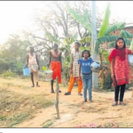
ପାଣି ସମସ୍ୟାର ସମ୍ମୁଖୀନ ହେଉଥିବା ବୈଷ୍ଣବସାହିବାସୀ।