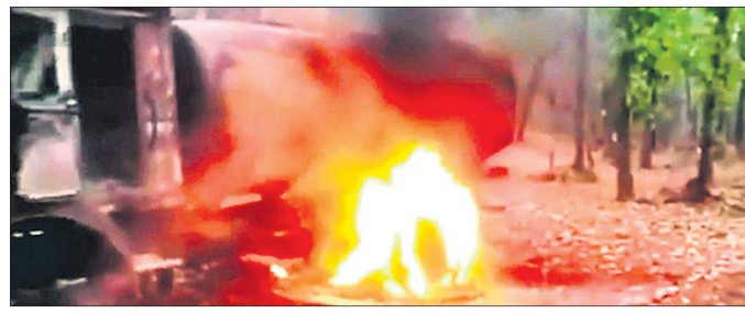
ମାଓବାଦୀ ଜାଳି ଦେଇଥିବା ଗାଡ଼ି ।

ମାଲକାନଗିରି, ୨୩୩୩ (ଡି.ଏନ.ଏ.) କଟିଆପୁଲ୍ଲୀ। ବୁଧବାର ଏହି କାମଳ ବନ୍ଦ କରିବା ପାଇଁ କେତେକଣ ସଶସ୍ତ୍ର ମାଓବାଦୀ କାର୍ଯ୍ୟସୂଚକରେ ପହଞ୍ଚି ରାସ୍ତାକାମରେ ନିୟୋଜିତ ୭ଟି ଗାଡ଼ିରେ ନିଆଁ ଲଗାଇ ଦେଇଥିଲେ।