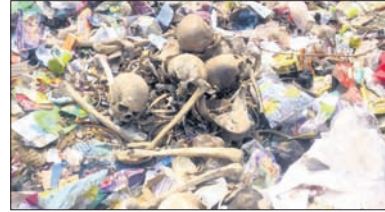
ଜବତ ହୋଇଥିବା ମଣିଷ ଖସୁରି ଓ ହାତୁ।

ଭୁବନେଶ୍ୱର, ୨୩୩୩(ସୁଧାରେ) ଭୁବନେଶ୍ୱରର ଏକ ଜନଗହଳପୂର୍ଣ୍ଣ ଅଞ୍ଚଳକୁ ମିଳିଛି ଏକାଧିକ ମଣିଷ ଖସୁରି ଓ କଳାକା। ମହେଶ୍ୱର ଥାନା ଅନ୍ତର୍ଗତ ପଟିଆ କଳାରାହାଙ୍ଗ ଇଞ୍ଜିଣା ପ୍ରାମ ନିକଟ ପୋଲ ତଳୁ ପୋଲିସ୍ ଗୋଟିଏ କି ବୁଲ୍‌ଟି ରୁହେ, ଏକାଧିକ ୧୪ ଖସୁରି ଓ ବହୁ ହାତୁ ଜବତ କରିଛି। ଏହି ଘଟଣା ରାଜଧାନୀରେ ଗାଞ୍ଜଲ ଖେଳାଇ ଦେଇଥିବାବେଳେ ଗୁମାସ୍ତ ଅଞ୍ଚଳରେ ଭୟର ବାତାବରଣ ସୃଷ୍ଟି କରିଛି। ତେବେ ଏତେଗୁଡ଼ିଏ କଳାକ କେଉଁଠୁ ଆସିଲା, କିଏ ପକାଇଲା, ହତ୍ୟା ନା ରୁଣିଗାରେଡ଼ି, ନା ଆଉ କ'ଣ ଉଦ୍ଦେଶ୍ୟ ରହିଛି, ଏଭଳି ଅନେକ ଅସଂପୂର୍ଣ୍ଣ ପ୍ରଶ୍ନ ଲୋକଙ୍କ ମନରେ ଉଠି ମାତ୍ରୁଥିବା ବେଳେ ପୋଲିସ୍ ଘଟଣାର ତଦନ୍ତ ଆରମ୍ଭ କରିଛି।