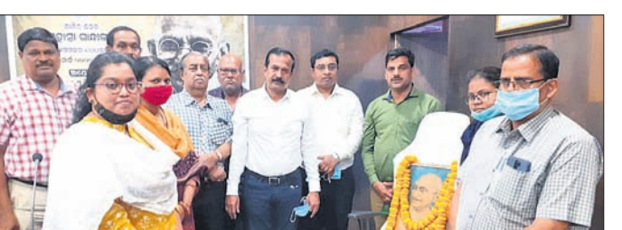
ଗାନ୍ଧିଜୀଙ୍କ ପ୍ରଥମ ଓଡ଼ିଶା ଆଗମନର ୧୦୦ବର୍ଷ ପୂର୍ତ୍ତି ପାଳନ ଅବସରରେ ଅତିଥିଙ୍କ ସହ ଅନ୍ୟମାନେ।