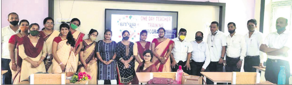
ଦକ୍ଷତା ବୃଦ୍ଧି ପ୍ରଶିକ୍ଷଣ ଶିବିରରେ ଯୋଗ ଦେଇଥିବା ଅତିଥି ଓ ଶିକ୍ଷୟିତ୍ରୀ ଶିକ୍ଷକମାନେ।

ଦେଢ଼ାମାଳ ବ୍ରହ୍ମମାଥ ବଡ଼ବେନା ସରକାରୀ ଉଚ୍ଚ ବିଦ୍ୟାଳୟ ସ୍ନାତ୍ତ ଶ୍ରେଣୀ ଗୃହରେ ବୁଧବାର ଲିଭାପ୍ରଦାନ ଏକଦିବସୀୟ ଦକ୍ଷତା ବୃଦ୍ଧି ପ୍ରଶିକ୍ଷଣ କାର୍ଯ୍ୟକ୍ରମ ଅନୁଷ୍ଠିତ ହୋଇଯାଇଛି।