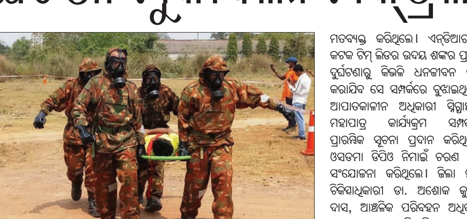
ରାସାୟନିକ ଗ୍ୟାସ୍ ଦୁର୍ଘଟଣା ମୁକାବିଲା ପାଇଁ ମକ୍ତଦ୍ୱାର କରାଯାଇଛି।