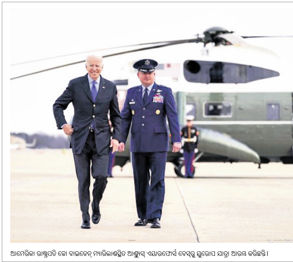
ଆମେରିକା ରାଷ୍ଟ୍ରପତି ଜୋ ବାଇଡେନ୍ ମ୍ୟାରିଲାଣ୍ଡସ୍ଥିତ ଆଷ୍ଟିନ୍ସ୍ ଏୟାରଫୋର୍ସ୍ ବେସ୍‌ରୁ ଯୁରୋପ ଯାତ୍ରା ଆରମ୍ଭ କରିଛନ୍ତି।