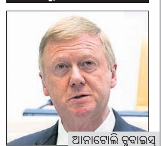
ରହି ପାଶ୍ଚାତ୍ୟ ଦେଶଗୁଡ଼ିକ ସହ ସମ୍ପର୍କ ବଜାୟ ରଖିଥିଲେ।