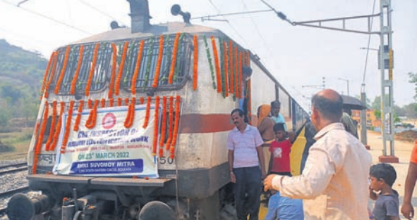
ରେଳପଥ ଯାତ୍ରା ପାଇଁ ଆସିଥିବା ଟ୍ରେନ।

ନୂଆଗାଁ, ୨୩୩୩ (ଡି.ଏନ୍.ଏ.): ଖୋର୍ଦ୍ଧା ରୋଡ୍-ବଲାଙ୍ଗୀର ରେଳପଥର ମହିପୁରଠାରୁ ନୂଆଗାଁ ଯାଏ ରେଳପଥ ନିର୍ମାଣ ସମ୍ପୂର୍ଣ୍ଣ ହୋଇଛି। କୁଧବାର ରେଳ ଯୁକ୍ତ ଆୟତ୍ତ (ସିଆରଏସ୍) ସେହି ରେଳପଥକୁ ଯାତ୍ରା କରିଛନ୍ତି। ପୂର୍ବରୁ ମହିପୁର ପର୍ଯ୍ୟନ୍ତ ରେଳ ଚଳାଚଳ କରୁଥିଲା। ଏବେ ନୂଆଗାଁ ପର୍ଯ୍ୟନ୍ତ ରେଳ ଚଳାଚଳ କରିବା ବୋଲି ସୂଚନା ମିଳିବା ପରେ ନୂଆଗାଁବାସୀ ସ୍ୱାଗତ କରିଛନ୍ତି। ମହିପୁରଠାରୁ ନୂଆଗାଁ ଯାଏ ୧୩.୨୫୦ କି.ମି. ରେଳପଥ ନିର୍ମାଣ କାର୍ଯ୍ୟ ଶେଷ ହୋଇଛି। ରେଳ ଚଳାଚଳ କରିବା ପୂର୍ବରୁ ରେଳ ଯୁକ୍ତ ଆୟତ୍ତ ଅନୁମୋଦନ କରକାର ଥିବାକୁ କୁଧବାର ସିଆରଏସ୍ ଉଦ୍ଦେଶ୍ୟରେ ମହିପୁର ସମେତ ବହୁ ଅଧିକାରୀ ସହି ରେଳପଥକୁ ଯାତ୍ରା କରିଛନ୍ତି। ଏଥିସହିତ ପରୀକ୍ଷାତ୍ମକ ଭାବେ ଗୋଟିଏ ଟ୍ରେନ ମଧ୍ୟ ଚଳାଚଳ କରିଛି। ସୁରକ୍ଷା ବ୍ୟବସ୍ଥା ଯାତ୍ରା ପରେ ରେଳ ଯାତାୟତ ପାଇଁ ଅନୁମତି ମିଳିବେ ଖୁବ୍ ଶୀଘ୍ର ସେହି ଭୂତଳ ଟ୍ରେନ ଚାଲିବ ବୋଲି ଅଧିକାରୀମାନେ କହିଛନ୍ତି।