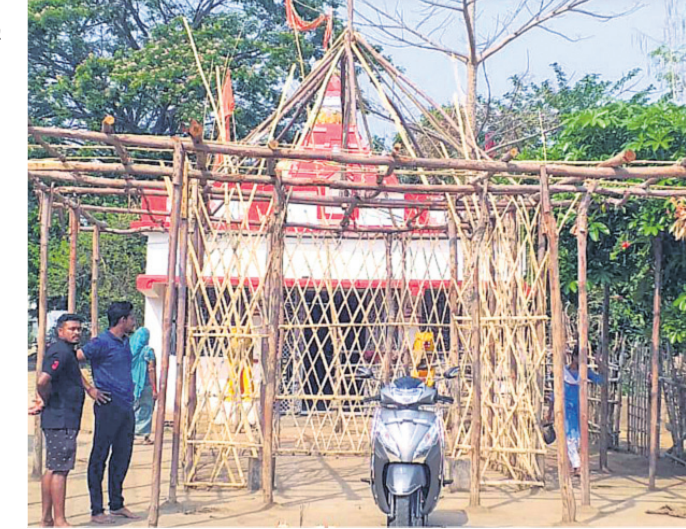
ଯାତ୍ରା ପାଇଁ ହୋଇଥିବା ପ୍ରସ୍ତୁତି ।