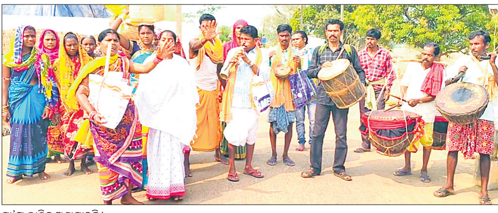
ମା'ଙ୍କ ଲାଠିକୁ ଅଣାଯାଇଛି ।

କୋରାପୁଟ ଜିଲ୍ଲା କୁନ୍ତୁରା ବ୍ଲକ୍ ବିଗାପୁର ପଞ୍ଚାୟତର ଖୁଲପୁଟପୋଡ଼ାଠାରେ ଦୀର୍ଘ ୫୦୦ ବର୍ଷ ପୁରୁଣା ମା' ବୁଢ଼ୀ ଠାକୁରାଣୀଙ୍କ ଦେବୀ ପୀଠ ରହିଛି । ଏବେ ମା'ଙ୍କ ଘଟଯାତ୍ରା ସମୟ । ଚେତ୍ରମାସର ଦ୍ୱିତୀୟ ମଙ୍ଗଳବାରରେ ଏହି ପୀଠରେ ଘଟଯାତ୍ରା ହୋଇଥାଏ । ୨୦୧୭ରେ ଘଟଯାତ୍ରା ବେଳେ ମା'ଙ୍କ ଲାଠି ଭାଙ୍ଗି ଯାଇଥିଲା । ଚଳିତ ଘଟଯାତ୍ରାକୁ ଦୃଷ୍ଟିରେ ରଖି ମା'ଙ୍କ ପୂଜକ ଶ୍ରୀମାତା, ଗୁରୁମାଳି, ହୁଣ୍ଡି ପୂଜାରୀ ଓ ଖୁଲପୁଟ, ଦିଗାପୁର, ନୂଆଗୁଡ଼ା, କଦମଗୁଡ଼ା, ପ୍ରଧାନାପୁଟର ଶତାଧିକ ଶ୍ରଦ୍ଧାଳୁ ମା' ଦେବୀରାଣୀଙ୍କ ଲାଠି ଆଣିବାକୁ ଦେପାଗାଡ଼ୀରୁ ବୁଲି କାଠପତା ପଞ୍ଚାୟତର କେନ୍ଦୁପୁଟ ଗ୍ରାମ ନିକଟସ୍ଥ ପାହାଡ଼କୁ ଯାଇଥିଲେ । ପରମ୍ପରା