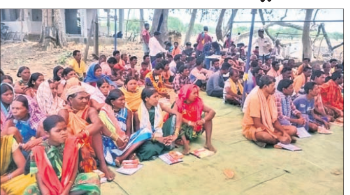
ଚାଳନା କାର୍ଯ୍ୟକ୍ରମରେ ଉପସ୍ଥିତ ଚାଷୀମାନେ।

ନବରଙ୍ଗପୁର, ୨୩ମାର୍ଚ୍ଚ(ବି.ପ୍ର.): ନବରଙ୍ଗପୁର ଜିଲ୍ଲା କୋଷାଗୁମୁଡ଼ା କୁଳ କୃଷିଗୁଡ଼ା ଗ୍ରାମରେ ସ୍ୱଳ୍ପ ଜଳ ପ୍ରୟୋଗରେ ଅଧିକ ଉତ୍ପାଦନ ଦେଉଥିବା ବୁଦ୍ଧି ଓ ସୂଚନା କଳାକାର ଉପରେ ଏକ ପ୍ରାକ୍ତିକ ପ୍ରଶିକ୍ଷଣ କାର୍ଯ୍ୟକ୍ରମ କରାଯାଇଛି। ଭାରତୀୟ ଜଳ ପରିଚାଳନା ପ୍ରତିଷ୍ଠାନ ଭୁବନେଶ୍ୱର ଶାଖା ପକ୍ଷରୁ ରାଷ୍ଟ୍ରୀୟ କୃଷି ବିକାଶ ଯୋଜନା ପ୍ରାୟୋଜିତ ବିଜ୍ଞାନ ଓ ପ୍ରଯୁକ୍ତିକ ପରିଯୋଜନା ଦ୍ୱାରା