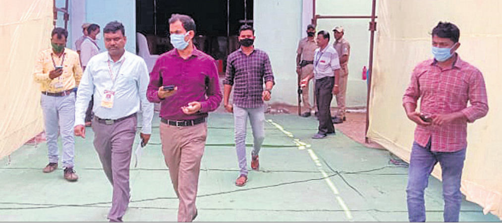
ପୋଲିଂ ପାର୍ଟି ବୁଥକୁ ଯିବା ପୂର୍ବରୁ ଜିଲ୍ଲାପାଳ ଓ ଉପଜିଲ୍ଲାପାଳ ଆଲୋଚନା କରୁଛନ୍ତି ।