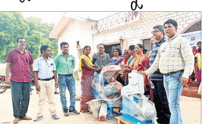
ଅଧିକାରୀମାନେ ଏସ୍‌ଏସ୍‌ଇ ମହିଳାଙ୍କୁ ଯନ୍ତ୍ର ଓ ଆବଶ୍ୟକ ସାମଗ୍ରୀ ପ୍ରଦାନ କରୁଛନ୍ତି।

କେନ୍ଦ୍ରୀୟ ମଧୁର କଳ ଗବେଷଣା କେନ୍ଦ୍ର ପକ୍ଷରୁ ତଙ୍ଗରିଆ ଏସ୍‌ଏସ୍‌ଇ ମାଛଦାନା ପ୍ରସ୍ତୁତ ଯନ୍ତ୍ର ଏବଂ ଏବଂ କିନ୍ତରଙ୍କ ସଂଖ୍ୟା ୧୨ ରହିଛି। ୨୮ ରୁପେ ମତଦାନ ବ୍ୟବସ୍ଥା କରାଯାଇଛି। ଗୁଣପୁର ନ୍ୟୁସିଟି ୫୨୯୯ ମତଦାତା ନିଜ ମତ ସାବ୍ୟସ୍ତ କରିବେ। ସେମାନଙ୍କ ମଧ୍ୟରୁ ୨୭୫୭ ମହିଳା, ୨୫୪୦ ପୁରୁଷ ଏବଂ ୨ କିନ୍ତର ଭୋଟର ଅଛନ୍ତି। ୧୧ ରୁପେ ମଧ୍ୟରୁ ୭ ଓ ୧୧ ନମ୍ବର ରୁପେ ଉପକ୍ରମ ସୁରକ୍ଷା ଦିଆଯାଇଛି। ଗୁଣପୁର ପ୍ରବଳ ଚିହ୍ନ କରାଯାଇଛି। ଗୁଣପୁର ସରକାରୀ ହାଲସ୍କୁଲରେ ରୁପେ କରାଯାଇଛି। ଯୁକ୍ତିବ୍ୟବସ୍ତା ସ୍କୁଲରେ ହୋଇଥିବା ଦୁଇଟି ରୁପେ ମଧ୍ୟରୁ ଗୋଟିଏ ଆଦର୍ଶ ରୁପେ ଓ ଅନ୍ୟ ଗୋଟିଏ ପିକ୍ଚୁ ରୁପେ ରହିଛି। ଶାନ୍ତିଗୃହରେ ଭୋଟ ଗ୍ରହଣ ପାଇଁ ସମସ୍ତ ସୁରକ୍ଷା ବ୍ୟବସ୍ଥା କରାଯାଇଛି।