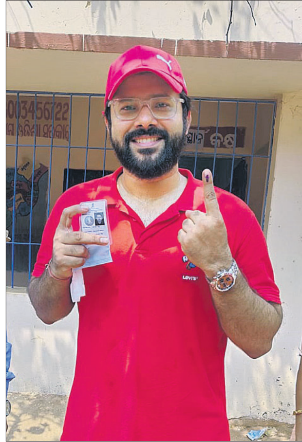
ଭୁବନେଶ୍ୱର ସୁନିଲ-ସ୍ମିତ ଗୋପବନ୍ଧୁ ବିଦ୍ୟାଳୟରେ ଅଭିନେତ୍ରୀ ଅର୍ଚ୍ଚିତା ସାହୁ ଏବଂ ଆଇରିଗିଆସ୍ତିତ ସରକାରୀ ଉପା ବିଦ୍ୟାଳୟରେ ଅଭିନେତା ସବ୍ୟସାଚୀ ମିଶ୍ର ମତଦାନ ଚିହ୍ନ ଦେଖାଉଛନ୍ତି ।