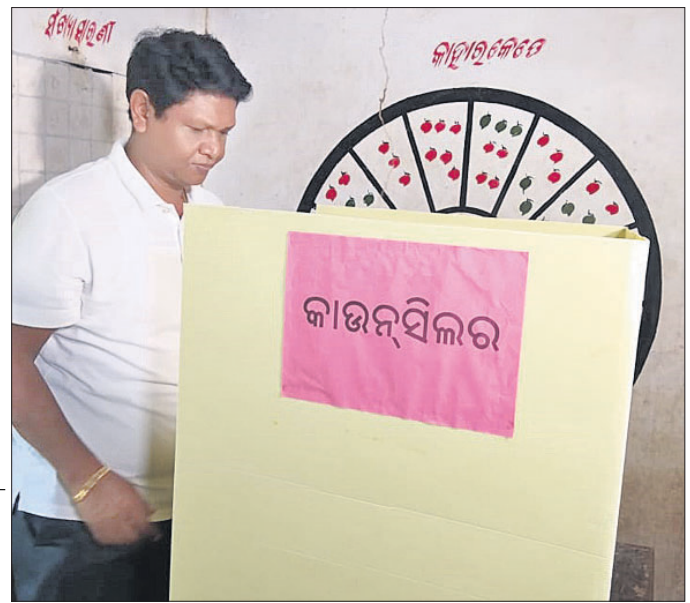
ଯାଜପୁର ପୌର ପରିଷଦ ଅଧୀନ ବାହାବଳପୁର ପ୍ରାଥମିକ ବିଦ୍ୟାଳୟର ୭ ନମ୍ବର ବୁଥରେ ବିଧାୟକ ତଥା ବିଜେଡି ସାଙ୍ଗଠନିକ ସମ୍ପାଦକ ପ୍ରଣବ ପ୍ରକାଶ ଦାସ ମତଦାନ କରୁଛନ୍ତି ।