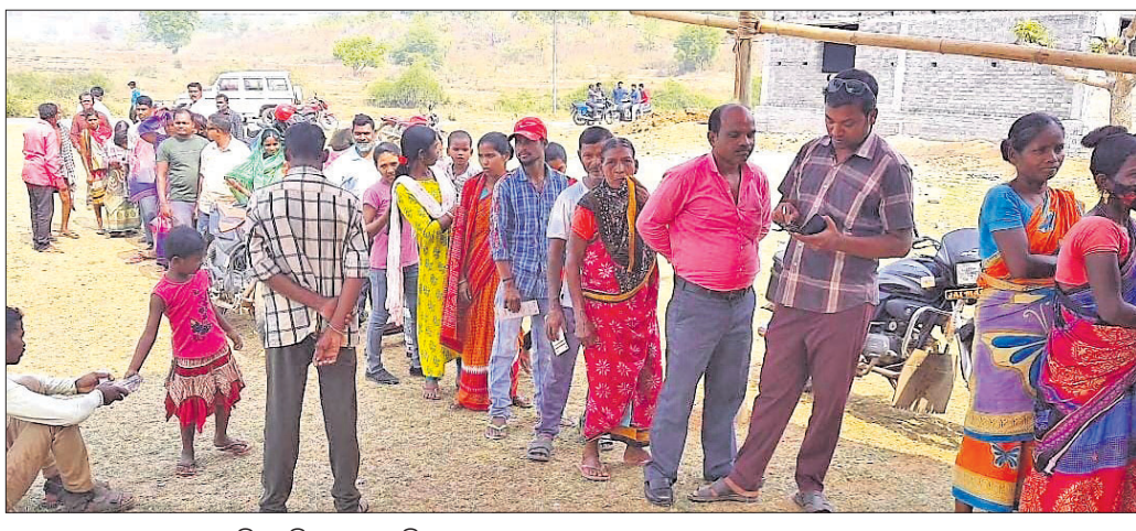
ଲୋକ ଭୋଟ ଦେବାକୁ ଧାଡ଼ିରେ ଛିଡ଼ା ହୋଇଛନ୍ତି।

ରକ୍ଷା ପାଇଁ ୪ ପ୍ଲୁଟ୍‌ର ପୋଲିସ୍ ମୁତୟନ କରାଯାଇଥିବାବେଳେ ପ୍ରତ୍ୟେକ ମତଦାନ କେନ୍ଦ୍ରରେ ଜଣେ ପୋଲିସ୍ ଅଧିକାରୀ ପକ୍ଷରୁ ପରିଚାଳନା ନିମନ୍ତେ ଜିଲ୍ଲା ପ୍ରଶାସନ ପକ୍ଷରୁ ପ୍ରତ୍ୟେକ କ୍ଷେତ୍ରରେ ଲୋକାର୍ଯ୍ୟ ପ୍ରକାଶିତ ନେହିନ ସହ ଜଣେ ଲୋକାର୍ଯ୍ୟ ପ୍ରକାଶିତ ଅଧିକାରୀ, ୪ ପୋଲିସ୍ ଅଧିକାରୀ ଏବଂ ଜଣେ ଲୋକାର୍ଯ୍ୟ ପୋଲିସ୍ କର୍ମଚାରୀଙ୍କୁ ନିଯୋଜିତ କରାଯାଇଥିଲା। ସେହିପରି ଶାନ୍ତିଶୁଖିଲା