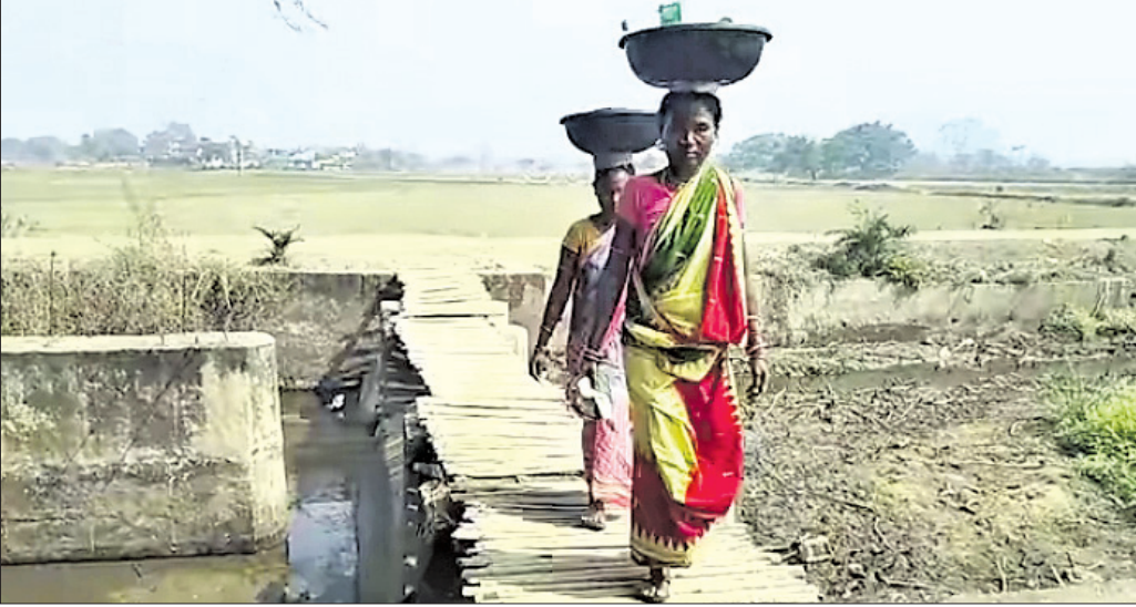
ବାଉଁଶ ପୋଲ ଉପରେ ଦୁଇ ମହିଳା ଚେକତ୍ୟାମ ପାର ହେଉଛନ୍ତି।