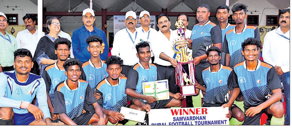
ଅତିଥିମାନଙ୍କ ଗହଣରେ ଉପସ୍ଥିତ ଖେଳାଳିବୃନ୍ଦ।