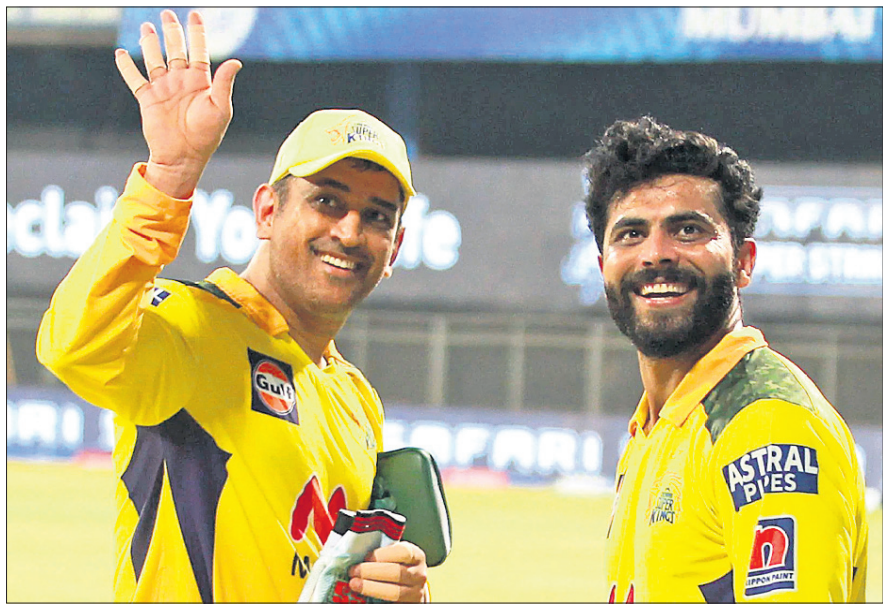
ମହେନ୍ଦ୍ର ସିଂ ଧୋନୀ ଓ ରବୀନ୍ଦ୍ର ଜାତେଜା।

୧୨ ସିକ୍ସନ, ୪ ଚାଲଟଲ ଓ ୫ଥର ରନସ୍ ଅପ୍ ପରେ ମହେନ୍ଦ୍ର ସିଂ ଧୋନୀ ଇଣ୍ଡିଆନ ପ୍ରିମିୟର ଲିଗ୍ (ଆଇପିଏଲ୍)ରେ ଚେନାଇ ସୁପରକିଙ୍ଗ୍ସ (ସିଏସ୍କେ) ଅଧିନାୟକ ପଦ ଛାଡ଼ିଛନ୍ତି। ଅଲରାଉଣ୍ଡର ରବୀନ୍ଦ୍ର ଜାତେଜା ସିଏସ୍କେର ନୂଆ ଅଧିନାୟକ ହୋଇଛନ୍ତି। ତେବେ ୪୦ ବର୍ଷୀୟ ଧୋନୀ ସିଏସ୍କେ ପକ୍ଷରୁ ଖେଳିବା ଜାରି ରଖିବେ ବୋଲି ପ୍ରାଞ୍ଛାଇବ