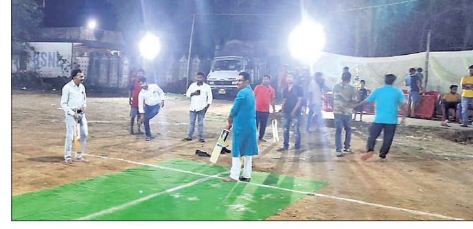
ଟୁର୍ନାମେଣ୍ଟ ଉଦ୍‌ଘାଟନା ଉତ୍ସବରେ ଅତିଥିକ ସହ ଖେଳାଳି ।