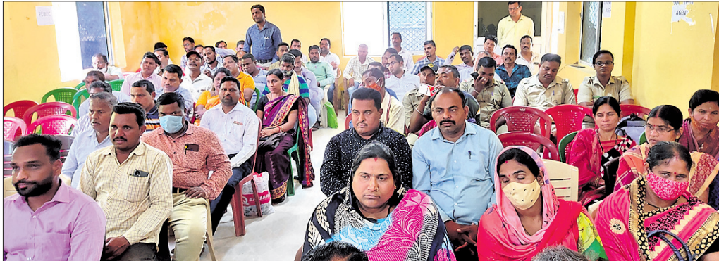
ଶିବିରରେ ଉପସ୍ଥିତ ବିଭିନ୍ନ ବିଭାଗୀୟ ଅଧିକାରୀ ଓ ଲୋକପ୍ରତିନିଧି।