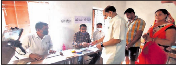
ରାଜ୍ୟସଭା ସଭ୍ୟ ପ୍ରସନ୍ନ ଆଚାର୍ଯ୍ୟ ମତଦାନ ପାଇଁ ବ୍ରହ୍ମଚାରୀ ସ୍ଥିତ ସରକାରୀ ସ୍କୁଲ ଭୋଟଗ୍ରହଣ କେନ୍ଦ୍ରରେ।

ବରଗଡ଼ ଜିଲ୍ଲାରେ ଗୁରୁବାର ପୌର ନିର୍ବାଚନ ପାଇଁ ମତଦାନ ଶେଷ ହୋଇଛି। ଜିଲ୍ଲାର ବରଗଡ଼ ପୁନିସିପାଲିଟି ସମେତ ବରପାଲି, ବିଜେପୁର ଏବଂ ପଦ୍ମପୁର ଏନ୍‌ଏସିରେ ସକାଳ ୮ଟାରୁ ସନ୍ଧ୍ୟା ୫ଟା ପର୍ଯ୍ୟନ୍ତ ଭୋଟ ଗ୍ରହଣ ଚାଲିଥିଲା। ଜିଲ୍ଲାରେ ମୋଟ ୭୧ ପ୍ରତିଶତ ମତଦାନ ହୋଇଥିବା ଜଣାପଡ଼ିଛି। ବିଜେପୁର ଏନ୍‌ଏସିରେ ସର୍ବାଧିକ ୮୪.୭୧ ଏବଂ ବରଗଡ଼ ପୁନିସିପାଲିଟିରେ ସର୍ବନିମ୍ନ ୬୧.୯୨ ପ୍ରତିଶତ ମତଦାନ ହୋଇଥିବା ସୂଚନା ମିଳିଛି। ଇତିହାସ (ଇଲେକ୍ଟୋନିକ୍ସ ଭୋଟିଂ ମେଶିନ)ରେ ପ୍ରାର୍ଥୀଙ୍କ ଭାଗ୍ୟ ବଦଳିଛି। ଶନିବାର ଭୋଟ ଗଣତି ହେବ ଏବଂ ମତଦାତା କାହାକୁ ସେମାନଙ୍କ ଜନ ପ୍ରତିନିଧି ଭାବେ