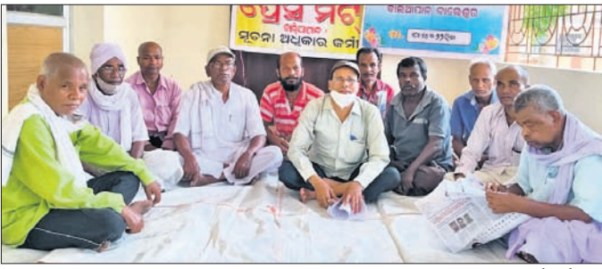
ଖବରଦାତା ସମ୍ମିଳନୀରେ ସୂଚନା ଆଧାର ଅଭିଯାନ ବାଲିଆପାଳ ଶାଖାର କର୍ମକର୍ତ୍ତା।

ବାଲିଆପାଳ ବ୍ଲକ୍ ଅଧୀନ ସମସ୍ତ ସରକାରୀ କାର୍ଯ୍ୟାଳୟରେ କର୍ମଚାରୀ ମରୁଡ଼ି ଦେଖାଦେଇଛି। ଫଳରେ ଲୋକେ ବିଭିନ୍ନ କାର୍ଯ୍ୟ ଆସି ନିରାଶ ହୋଇ ଫେରୁଛନ୍ତି।