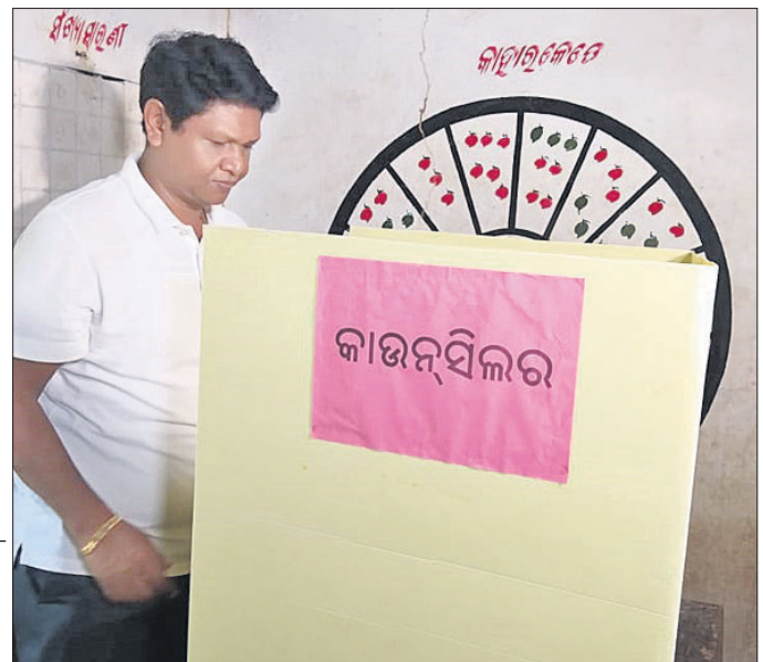
ଭୁବନେଶ୍ୱର ମହାନଗର ନିଗମର ୫୩ ନମ୍ବର ଓଡ଼ିଆରେ ମତ ସାଧ୍ୟତ୍ର ପରେ ପୁଞ୍ଜ୍ୟମଣ୍ଡା ନବୀନ ପଟ୍ଟନାୟକ ।