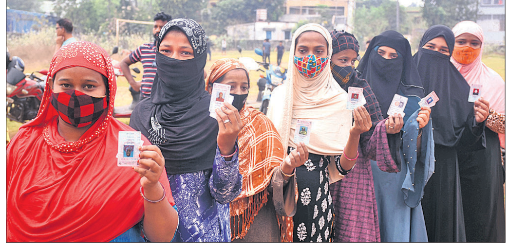
ଭୁବନେଶ୍ୱର ଝାରିପଡ଼ା ସରକାରୀ ଉପା ବିଦ୍ୟାଳୟର ମତଦାନକେନ୍ଦ୍ରରେ ଭୋଟ ଦେବା ପାଇଁ ମହିଳାମାନେ ଧାଡ଼ିରେ ରହିଛନ୍ତି ।