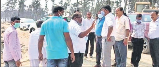
ତାଳସାରୀ-ଉଦୟପୁର ପର୍ଯ୍ୟଟନସ୍ଥଳୀକୁ ଅନୁଧ୍ୟାନ କରୁଥିବା କର୍ମଚାରୀ।

ବାଲେଶ୍ୱର ଜିଲ୍ଲା ଭୋଗରାଇ ବ୍ଲକ୍ ଉଦୟପୁର-ତାଳସାରୀ ବେଳାକୁଳି ଓ ପ୍ରସିଦ୍ଧ ଶୈବପୀଠ ଚନ୍ଦନେଶ୍ୱର ମନ୍ଦିର ପର୍ଯ୍ୟଟନସ୍ଥଳୀର ଉନ୍ନତୀକରଣ କରାଯିବ।