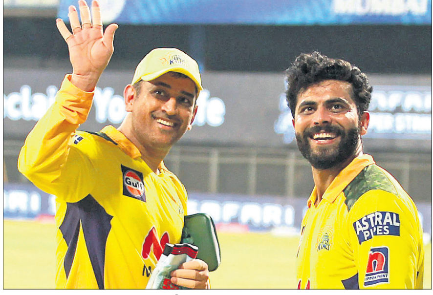
ମହେନ୍ଦ୍ର ସିଂ ଧୋନୀ ଓ ରବୀନ୍ଦ୍ର ଜାତେଜା।

ପୁରାଇ, ୨୪।୩ (ପି.ଟି.) ୧୨ ସିକ୍ସନ, ୪ ଟାଇମ୍‌ଉଟ୍ ଓ ୫ଥର ରନସ୍‌ଆଉଟ୍ ପରେ ମହେନ୍ଦ୍ର ସିଂ ଧୋନୀ ଇଣ୍ଡିଆନ୍ ପ୍ରିମିୟର ଲିଗ୍ (ଆଇପିଏଲ୍)ରେ ଚେନ୍ନାଇ ସୁପରକିଙ୍ଗ୍ସ୍ (ସିଏସ୍କେ) ଅଧିନାୟକ ପଦ ଛାଡ଼ିଛନ୍ତି। ଅଲରାଉଣ୍ଡର ରବୀନ୍ଦ୍ର ଜାତେଜା ସିଏସ୍କେର ନୂଆ ଅଧିନାୟକ ହୋଇଛନ୍ତି। ତେବେ ୪୦ ବର୍ଷୀୟ ଧୋନୀ ସିଏସ୍କେ ପକ୍ଷରୁ ଖେଳିବା ଜାରି ରଖିବେ ବୋଲି ପ୍ରାଞ୍ଛାଇବ୍