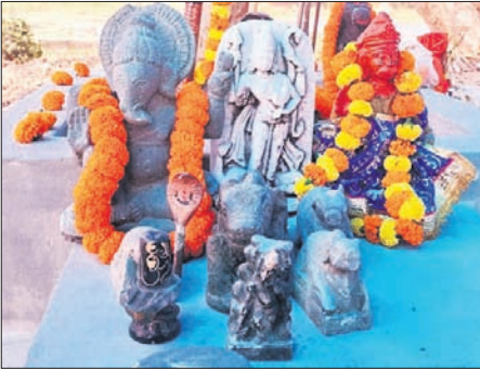
ମାଟିତଳୁ ଉଦ୍ଧାର ହୋଇଥିବା ବିଗ୍ରହ।