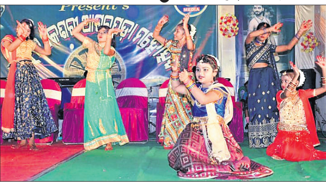
ମହୋତ୍ସବରେ ନୃତ୍ୟ ପରିବେଷଣ କରୁଥିବା କଳାକାର।

ଭଦ୍ରକ ଜିଲ୍ଲା ବନ୍ଦ ବ୍ଲକ୍ ଆଗରପଡ଼ା ସ୍ଥିତ ହେମପତ୍ରଗାଳାକ୍ଷିଠାରେ ଚାଲିଥିବା ଉତ୍ସବ କେଶରୀ ଆଗରପଡ଼ା ମହୋତ୍ସବର ୯ମ ସନ୍ଧ୍ୟା କୁସୁଧାର ଅନୁଷ୍ଠିତ ହୋଇଯାଇଛି।