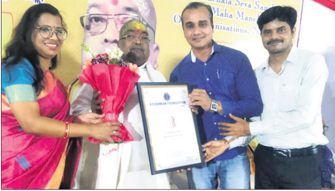
ଆୟୁଷ୍ମାନ ପାଠକେଶନ ଚରଫୁ ବାବା ବଳିଆକୁ ସମ୍ବର୍ଦ୍ଧିତ କରାଯାଇଛି।

ଖଜରା, ୨୪ମାର୍ଚ୍ଚ(ଡି.ଏନ.ଏ.): ଓଡ଼ିଶାରୁ ୪ ବିଶିଷ୍ଟ ବ୍ୟକ୍ତି ପଦ୍ମଶ୍ରୀ ଉପାଧିରେ ସମ୍ବର୍ଦ୍ଧିତ ହୋଇଛନ୍ତି।