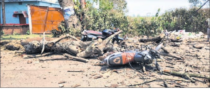
ଭାଙ୍ଗି ପଡ଼ିଥିବା ଗଛ ତାଳ।

ଝୁମୁରା, ୨୪ମାର୍ଚ୍ଚ(ଡି.ଏନ.ଏ.): କେନ୍ଦୁଝର ଜିଲ୍ଲା ଝୁମୁରା ପୁଞ୍ଜି ବନ୍ଦର ରାସ୍ତାରେ ଥାନା ଛକ ନିକଟରେ ଥିବା ଏକ ଶୁଖିଲା ବରଗଛର ତାଳ ଭାଙ୍ଗି ପଡ଼ିବାରୁ ୪ଜଣ ଆହତ ହୋଇଛନ୍ତି।