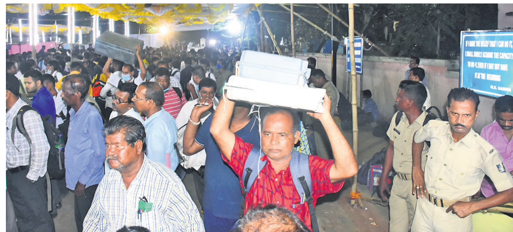
ମତଦାନ ପରେ ପୋଲିଂ ଅଧିକାରୀମାନେ ଭିକ୍ଷାମଗ୍ନ ଭୁବନେଶ୍ୱର ବିଜେଡି କଲେଜସ୍ଥିତ ଷ୍ଟୁଡିଓ ଭୁମକୁ ନେଉଛନ୍ତି ।