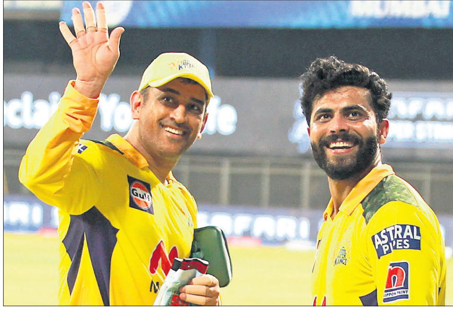
ମହେନ୍ଦ୍ର ସିଂ ଧୋନୀ ଓ ରବୀନ୍ଦ୍ର ଜାତେଜା ।