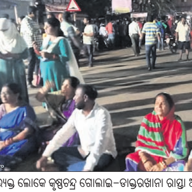
ଇତିଏମ୍ ସିଲକୁ ନେଇ ଉତ୍ତେଜନା ଦେଖାଦେଇଛନ୍ତି ।

ବାରପଦା ଅପିଏ, ୨୪ମାର୍ଚ୍ଚ ମୟୂରଭଞ୍ଜ ଜିଲ୍ଲା ବାରିପଦା ପୌର ପରିଷଦ ନିର୍ବାଚନ ସମ୍ପର୍କରେ ଇତିଏମ୍ ସିଲକୁ ନେଇ ଉତ୍ତେଜନା ଦେଖାଦେଇଛି । ଏକେଡ଼ିଏର ମୁଖ୍ୟମନ୍ତ୍ରୀ ଏ ପୋଲିସର ଅଣୀକାମ ବ୍ୟବହାର ପ୍ରତିବାଦରେ ଉଦ୍‌ଘୋଷଣା କରିଛନ୍ତି ।