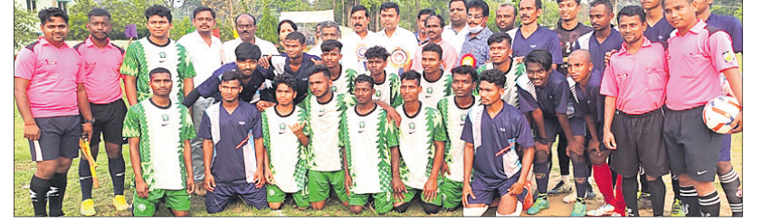
ଉଦ୍‌ଘାଟନୀ ମଧ୍ୟାତ ପୂର୍ବରୁ ଅତିଥିଙ୍କ ସମ୍ମାନରେ ଖେଳାଳି ଓ ଅତିଥିଆସି।

ଧର୍ମଶାଳା, ୨୪ମା (ଡି.ଏନ.ଏ.) ଯାକପୁର ଜିଲ୍ଲା ଧର୍ମଶାଳା ପୁସ୍ତକ ଆସୋସିଏସନର ଆନୁକୂଲ୍ୟରେ ୨୪ତମ ଡିପାକର୍ମ ଓ ଚତୁର୍ଥ ରଣଜିତ ସ୍ୱାଇଁ ସ୍ମାରକୀ ପୁସ୍ତକ ଚଳେଇ ପୂର୍ଣ୍ଣମେଶୁ ଗୁରୁବାର ବାଣୀପାଠ ଖେଳ ପଡ଼ିଆରେ ଉଦ୍‌ଘାଟିତ ହୋଇଯାଇଛି।