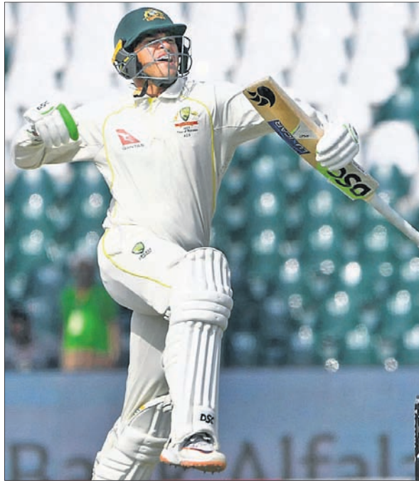
ଶତକ ହାସଲ ପରେ ଉତ୍ସାହୀ ଖୁଲିଆ।

ଲାହୋର, ୨୪ମା ଗୁଜରାଟ ଗୋଲ୍‌ଫ୍ ଷ୍ଟାଡ଼ିୟମରେ ଚାଲିଥିବା ଏସିଆ-ପାକିସ୍ତାନ ଦ୍ୱିତୀୟ ଟେଷ୍ଟ ଟେଷ୍ଟର ଚତୁର୍ଥ ଦିନର ପ୍ରଥମ ଦିନର ଖେଳ ଶେଷ ହୋଇଛି।