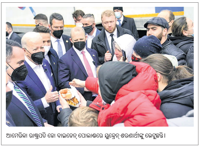
ଆମେରିକା ରାଷ୍ଟ୍ରପତି ଜୋ ବାଇଡେନ୍ ପୋଲଣ୍ଡରେ ୟୁକ୍ରେନ୍ ଶରଣାପୀଣୁ ଭେଟୁଛନ୍ତି।

କିଲ୍ ୨୬୩: ମାର୍ଚ୍ଚ ୨୭ରେ ଆୟୋଜନ ହେବାକୁ ଥିବା ଓଷ୍କାର-୨୦୨୨ ସମାରୋହରେ ୟୁକ୍ରେନ୍ ରାଷ୍ଟ୍ରପତି ଭୋଲୋଡିମିର ଜେଲେନ୍ସ୍କି ସାମିଲ ହୋଇପାରିବ ବୋଲି ରିପୋର୍ଟ ପ୍ରକାଶ ପାଇଛି। ଏକାଡେମୀ ଆର୍ଡ଼ର ପ୍ରତିନିଧି ଏ ନେଇ ଜେଲେନ୍ସ୍କିଙ୍କ ସହ କଥା ହୋଇଥିବା ଜଣାପଡ଼ିଛି। ଅଭିନେତା ରାଷ୍ଟ୍ରପତି ହୋଇଥିବା ଜେଲେନ୍ସ୍କି ଲାଭରୁ ବ୍ରୁକ୍ସାସ୍ ଯୋଗେ ସମାରୋହରେ ଉପସ୍ଥିତ ରହିପାରନ୍ତି କିମ୍ବା ତାଙ୍କ ରେକର୍ଡ ମେସେଜ୍ ଓଷ୍କାର ପ୍ରୋଗ୍ରାମରେ ଚାଲିଯାଉ। ତେବେ ଏ ବାବଦରେ ଜେଲେନ୍ସ୍କି କିମ୍ବା ଏକାଡେମୀ ପକ୍ଷରୁ ବିଧିବଦ୍ଧ ଭାବେ ଘୋଷଣା କରାଯାଇନାହିଁ। ଓଷ୍କାର କୋ-ହୋଷ୍ଟ ଆମି ଶୁମର ସାପେକ୍ସରୁ ଯୋଗାଯୋଗ ମାଧ୍ୟମରେ କାର୍ଯ୍ୟକ୍ରମରେ ଯୋଗଦେବା ନିମନ୍ତେ ପ୍ରସ୍ତାବ ଦେବା ପରେ ଏହା ଚର୍ଚ୍ଚାକୁ ଆସିଛି।