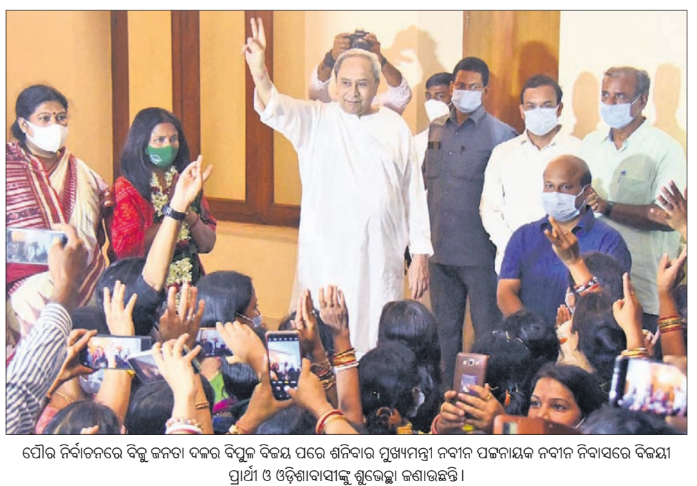
ପୌର ନିର୍ବାଚନରେ ବିଜୁ ଜନତା ଦଳର ବିପୁଳ ବିଜୟ ପରେ ଶନିବାର ମୁଖ୍ୟମନ୍ତ୍ରୀ ନବୀନ ପଟ୍ଟନାୟକ ନବୀନ ନିବାସରେ ବିଜୟା ପ୍ରାର୍ଥୀ ଓ ଓଡ଼ିଶାବାସୀଙ୍କୁ ଶୁଭେଚ୍ଛା ଜଣାଇଛନ୍ତି।