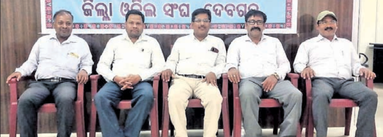
ଦେବଗଡ଼ ଓକିଲ ସଂଘର କର୍ମକର୍ମୀ ।