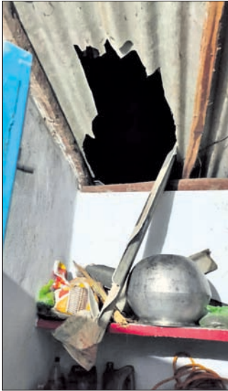
ଦନ୍ତାହାତୀ ଦ୍ୱାରା ନଷ୍ଟ ହୋଇଥିବା ଆବାସବାସପତ୍ର।

ସମ୍ବଲପୁର ଜିଲ୍ଲା ନାକଟିଦେଉଳ ବନାଞ୍ଚଳରେ ଗତ କିଛିଦିନ ହେଲା ଏକ ଦନ୍ତା ହାତୀ ଉପଦ୍ରବ ଘଟି ରହିଛି। ଶୁକ୍ରବାର ବିଳମ୍ବିତ ରାତ୍ରିରେ ଗୋଠିଠା ଦନ୍ତା ହାତୀ ବ୍ଲକର ବାଟରୁ ପଞ୍ଚାୟତ ଅନ୍ତର୍ଗତ କେଲୋବେର୍ଣ୍ଣା ଗ୍ରାମର ମଠ ସାହିରେ ପଶି ପ୍ରାୟ ୨ଘଣ୍ଟା ଧରି ଉପଦ୍ରବ ଚଳାଇଥିଲା। ହାତୀଟି ପ୍ରଥମେ ସାହିର ଅଞ୍ଚଳ ଧକ୍କା ଘର ଚାରିପାଖରେ ଦିଆ ଯାଇଥିବା ତାର ବାଡ଼ ଭାଙ୍ଗି ଭିତରକୁ ପଶିଥିଲା। ପରେ ସମ୍ପୂର୍ଣ୍ଣ ଫାଟକ ଗ୍ରାମ ଭାଙ୍ଗି ରୋଷେଇ ଘରର କବାଟ ଓ ଝରକା ଭାଙ୍ଗିଥିଲା। ଘର ଭିତରେ ଶୋଇଥିବା ଅଞ୍ଜଳିକ ବାପା, ମାଆ ଓ ପୁତ୍ରା ଶବ୍ଦ ଶୁଣି ଭୟରେ ମୁଖ୍ୟଦ୍ୱାର ଦେଇ ବାହାରକୁ ପଳାଇ ଯାଇଥିଲେ। ସେମାନେ ପାଟି