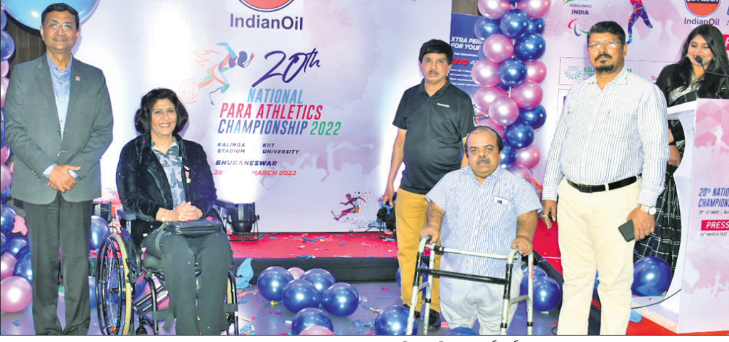
ଲୋଗୋ ଉଦ୍‌ଘାଟନ ଅବସରରେ ଉପସ୍ଥିତ ଅତିଥି ଓ କର୍ମକର୍ତ୍ତା।