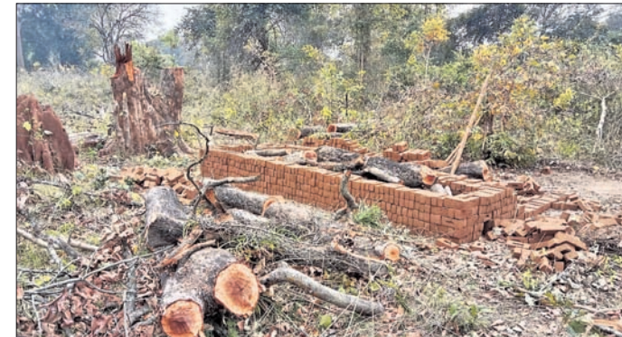
ଲଗା ଗଢ଼ିବା ପରେ ପୋଡ଼ିବା ପାଇଁ ଗଛ କଟାଯାଇଛି।

ଜମନକିରା ତହସିଲ ଅଧୀନ ୮ ସର୍କଲରେ ବେଆଇନ ଭାବେ ଲଗାଭାଟି ଗଢ଼ିଉଠୁଛି। ବନ ଓ ରାଜସ୍ୱ ବିଭାଗ ନାବବସ୍ତୁ ସାହୁଥିବାକୁ ଅସାଧୁ ବ୍ୟବସାୟ ଆବାସରେ ସେମାନଙ୍କ କାରବାର ଚଳାଉଥିବା ଅଭିଯୋଗ ହେଉଛି। ଜମନକିରା ତହସିଲ ଅଧୀନରେ ଜମନକିରା ସମେତ ଗଙ୍ଗାଗାଣା, ଭୋକପୁର, ଗୌଡ଼ପାଲି, ମୁଷ୍ଟେନପାଲି, ବଡ଼ମରା, ଫାଶିମାଲ ଓ ଗୁଣ୍ଡୁରୁପୁଆ ଆଦି ୮ ରାଜସ୍ୱ ସର୍କଲ ଓ ବାମଣା ବନ୍ୟପ୍ରାଣୀ ବନାଞ୍ଚଳ ଅଧୀନରେ ବଡ଼ମରା ଓ ଜମନକିରା ରେଞ୍ଜି ରହିଛି। ତେବେ ବିଭିନ୍ନ ହେବ ଲଗାଭାଟି ମାଫିଆଙ୍କ ଦ୍ୱାରା ବୃଦ୍ଧି ପାଇବାରେ ଲାଗିଛି। ସେମାନେ ବ୍ୟବସାୟ ଉଦ୍ଦେଶ୍ୟରେ ଶହ