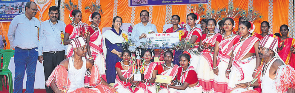
ଅତିଥିମାନଙ୍କ ଗହଣରେ ଉପସ୍ଥିତ ଚୁରସ୍ୱର ବିଜେତା ଲୋକ କଳାକାର।

ପ୍ରମୁଖ ଉପସ୍ଥିତ ଥିଲେ। ଏହି ଉତ୍ସବରେ ବିଭିନ୍ନ ଗାଁର ୩୦ଟି ନୃତ୍ୟ ଦଳ ଅଂଶଗ୍ରହଣ କରିଥିଲେ। ବିଶ୍ୱା ବ୍ଲକର କଦମ୍ବଗୋଲ ଦଳ ପ୍ରଥମ, ସାହୁବାହାଲ ଗ୍ରାମର ନୃତ୍ୟ ଦଳ ଦ୍ୱିତୀୟ ଏବଂ କେନ୍ଦୁଗୋଲ ଗ୍ରାମ ତୃତୀୟ ଦଳ ଭାବେ ଚୁରସ୍ୱର ହୋଇଥିଲେ। ଏଥିସହ ୨୭ଟି ନୃତ୍ୟ ଦଳକୁ ସାହୁବାହାଲ ଚୁରସ୍ୱର ପ୍ରଦାନ କରାଯାଇଥିଲା।