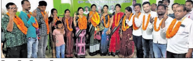
ବିଜୟ ବିଜେଡି କାର୍ଯ୍ୟକର୍ତ୍ତାମାନେ

ସରିଲା ପୌର ନିର୍ବାଚନ। ୧୯୯୦ ମସିହାରୁ ପାଟଣାଗଡ଼ ଏନଏସି ଅଧକ୍ଷ ପଦ ଭାଜପା ହାତରେ ଥିଲା। ତେବେ ବିଜେଡି ପୌର ନିର୍ବାଚନ ଫଳାଫଳ ସବୁ ଗଣିତକୁ ଓଲଟପାଲଟ କରିଦେଇଛି।