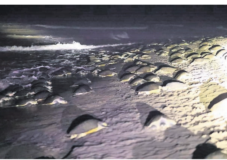
ଅଣ୍ଡାଦାନ ପାଇଁ ଗହୀରମଥାରେ କମା ହୋଇଥିବା ଅଲିଭରିଡ୍‌ଲେଙ୍କ କଲିକ୍ତ।

ରାଜନଗର, ୨୬ମାର୍ଚ୍ଚ (ଡି.ଏନ.ଏ.) ବିରଳ ଅଲିଭରିଡ୍‌ଲେ କଲିକ୍ତ ଏକାକୀ କେନ୍ଦ୍ରାପଡ଼ା ଉପକୂଳ ଗହୀରମଥାରେ କଲିକ୍ତ ଗଣ ଅଣ୍ଡାଦାନ ପ୍ରକ୍ରିୟା ଆରମ୍ଭ ହୋଇଛି।