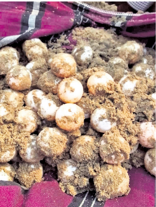
ତାଳସାରୀ ବେଳାଭୂମିରେ ଅଲିଭରିଡ୍‌ଲେ ଅଣ୍ଡା।

ଭୋଗରାଇ, ୨୬ମାର୍ଚ୍ଚ (ଡି.ଏନ.ଏ.) ବାଲେଶ୍ୱର ଜିଲ୍ଲା ତାଳସାରୀ ବେଳାଭୂମିରେ ବୁଦ୍ଧଦିନରେ ୪ ଅଲିଭରିଡ୍‌ଲେ ୪ଶହ ଉର୍ଦ୍ଧ୍ୱ ଅଣ୍ଡାଦାନ କରିଥିବା ଜଣାପଡ଼ିଛି।