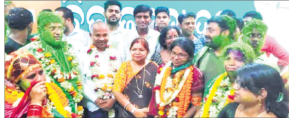
ଜିଲ୍ଲା ବିଜେଡି କାର୍ଯ୍ୟାଳୟରେ ବିଜୟ ଉତ୍ସବ ପାଳନ କରାଯାଉଛି।