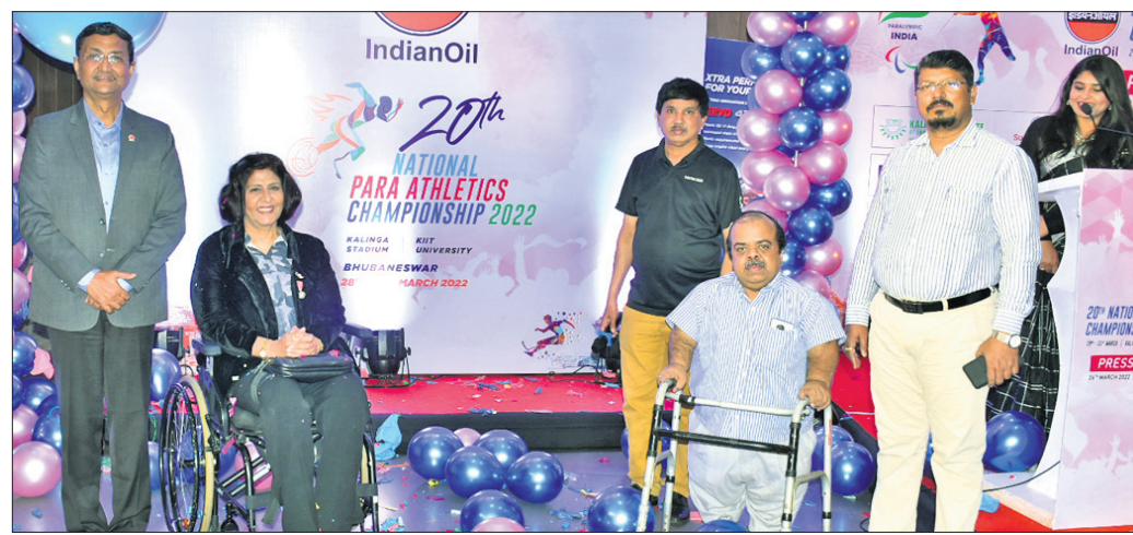
ଲୋଗୋ ଉଦ୍ଘୋଷଣ ଅବସରରେ ଉପସ୍ଥିତ ଅତିଥି ଓ କର୍ମଚାରୀ