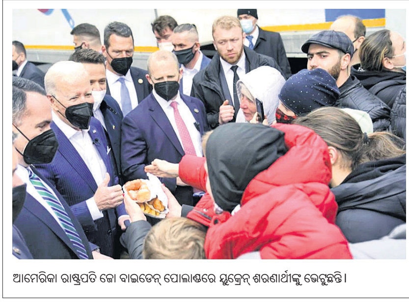
ଆମେରିକା ରାଷ୍ଟ୍ରପତି ଜୋ ବାଇଡେନ୍ ପୋଲାଣ୍ଡରେ ଯୁକ୍ତେନ୍ଦ୍ର ଶରଣାର୍ଥୀଙ୍କୁ ଭେଟୁଛନ୍ତି।