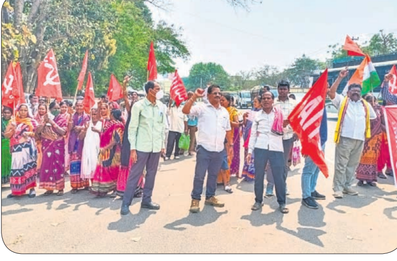
ଝାରପୁରୁ ଜିଲ୍ଲାପାଳଙ୍କ ଅଧିକାରୀଙ୍କ ସମ୍ମୁଖ