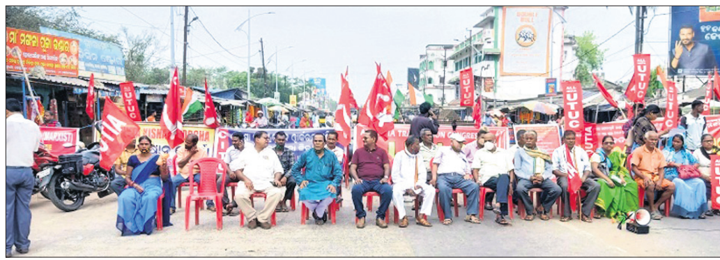
ରାସ୍ତାରେକୋରେ ସାମିଲ ହୋଇଥିବା ଶ୍ରମିକ ସଂଗଠନର ସଦସ୍ୟମାନେ।