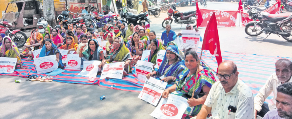
ଶ୍ରେଣିକ ସଂଗଠନ ପକ୍ଷରୁ ଦଶପଲ୍ଲୀ ବ୍ଲକ୍ କାର୍ଯ୍ୟାଳୟ ସମ୍ମୁଖରେ ରାସ୍ତାରେକୋ ।