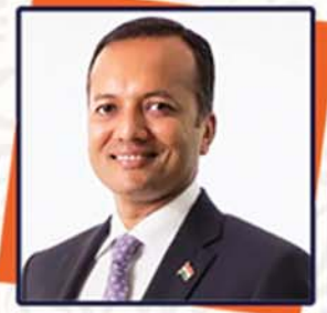
Chief Speaker Shri Naveen Jindal Chairman Jindal Steel and Power