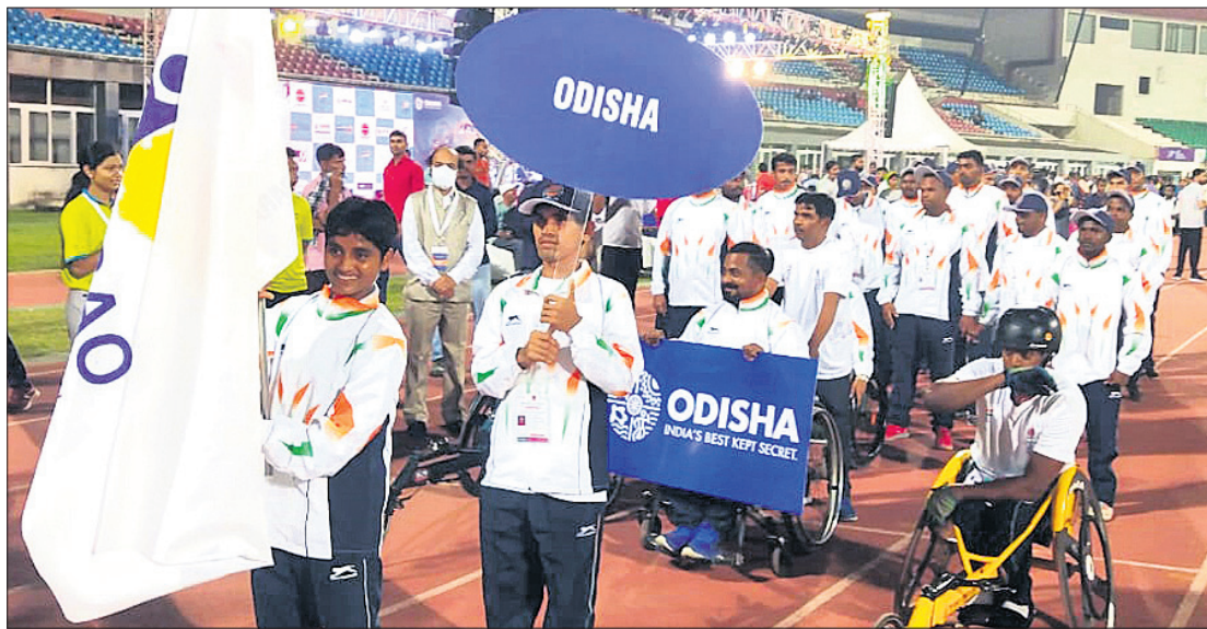
ପ୍ରତିଯୋଗିତାରେ ଭାଗ ନେବାକୁ ଯାଉଥିବା ଓଡ଼ିଶା ପ୍ରତିନିଧି ଦଳ ।