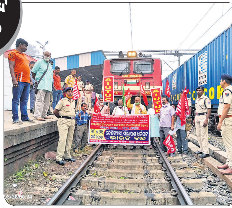
ବାଲେଶ୍ୱର ରେଳ ଷ୍ଟେସନ