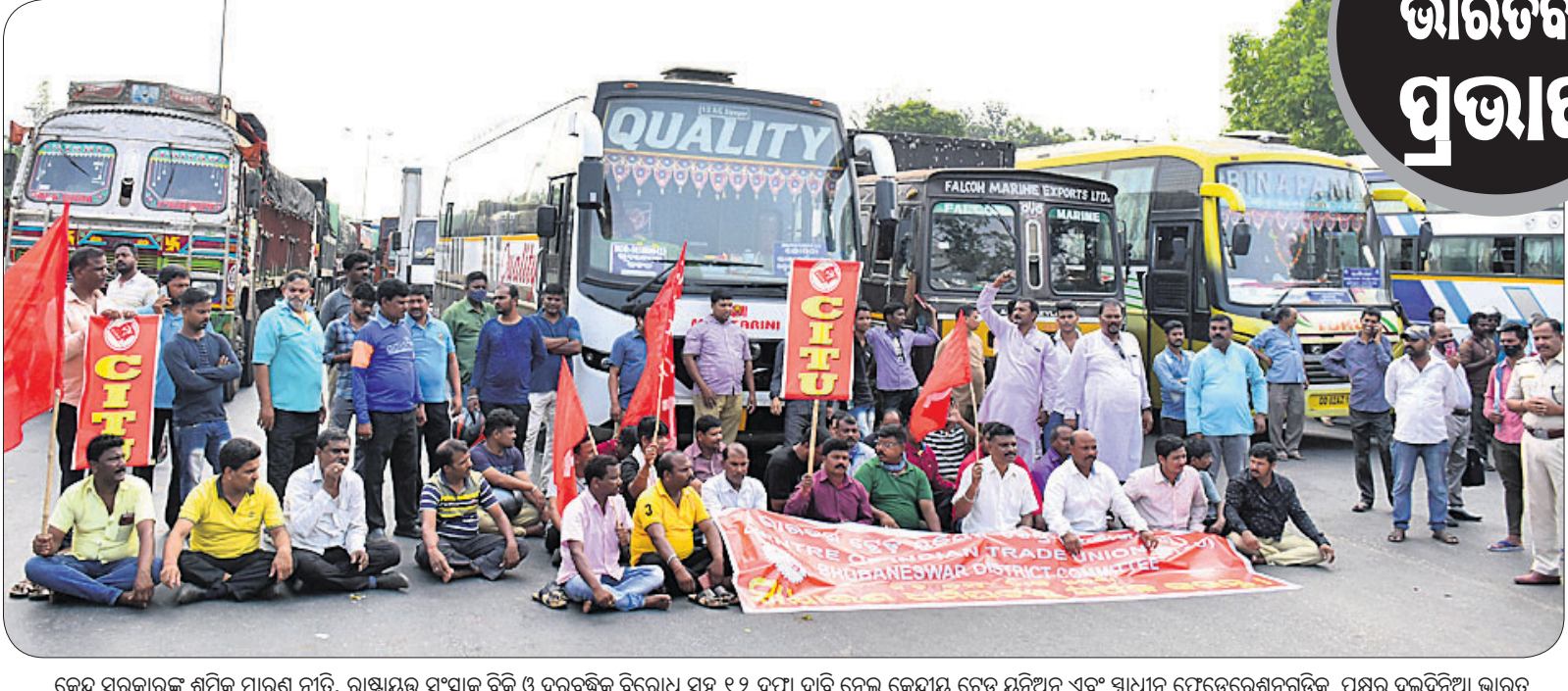
କେନ୍ଦ୍ର ସରକାରଙ୍କ ଶ୍ରମିକ ମାରଣ ନୀତି, ରାଷ୍ଟ୍ରୀୟ ସଂଗ୍ରାମୀ ଦଳ ଓ ଦରବୁକ୍ତି ବିରୋଧ ସହ ୧୨ ଦମ୍ପା ଦାବି ନେଇ କେନ୍ଦ୍ରୀୟ ଟ୍ରେଡ଼ ୟୁନିଅନ ଏବଂ ସ୍ୱାଧୀନ ଫେଡେରେଶନକୁ ନିକଟ ପକ୍ଷରୁ ଦୁଇଦିନିଆ ଭାରତ ବନ୍ଦର ସୋମବାର ପ୍ରଥମ ଦିନରେ ଭୁବନେଶ୍ୱର ଜୟଦେବବିହାର ନିକଟ ୧୬ ନଂ. ଲାଟାୟ ରାଜପଥରେ ଗୋଡ଼ିମୋଟର ଅଟକାଇଯାଇଛି।