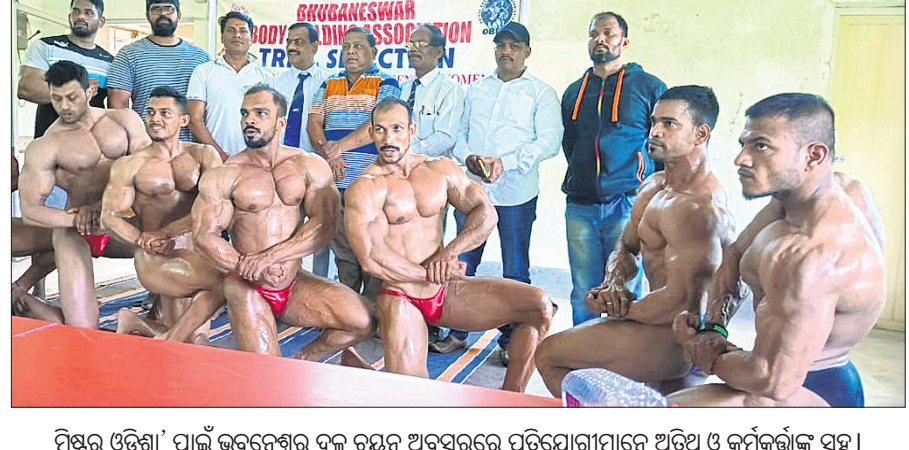
ମିଷ୍ଟର ଓଡ଼ିଶା ପାଇଁ ଭୁବନେଶ୍ୱର ଦଳ ଚୟନ ଅବସରରେ ପ୍ରତିଯୋଗୀମାନେ ଅତିଥି ଓ କର୍ମକର୍ତ୍ତାଙ୍କ ସହ ।