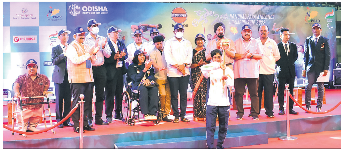
ଭୁବନେଶ୍ୱରରେ ଯୋଗଦାନ କାତାୟ ପାରା ଅଥଲେଟିକ୍ସ ଚାମ୍ପିୟନଶିପ୍ ଉଦ୍‌ଘାଟନା ଉତ୍ସବରେ କ୍ରୀଡ଼ାମନ୍ତ୍ରୀ ତୁଷାରକାନ୍ତି ବେହେରା ଓ ଅନ୍ୟ ଅତିଥିମାନେ ।