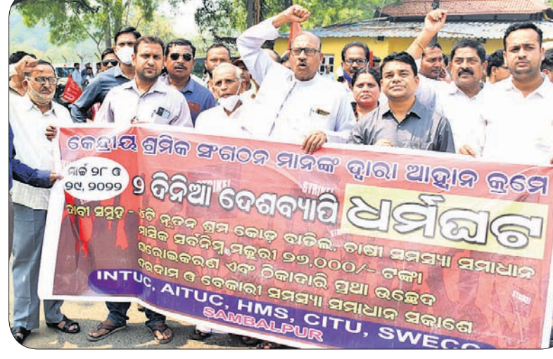
ସମ୍ବଲପୁର କଟେରି ଛକ