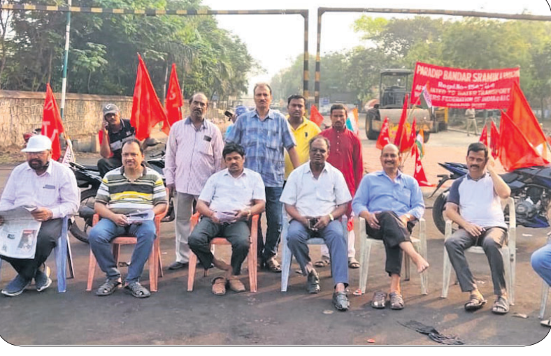
ପାରାମିପ ବନ୍ଦର ରେଡ଼ ନଂ-୪