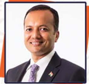
Chief Speaker Shri Naveen Jindal Chairman Jindal Steel and Power