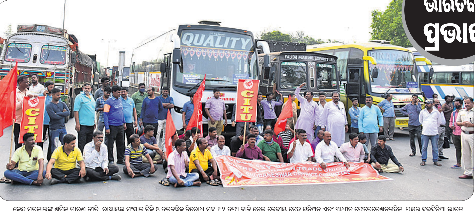
କେନ୍ଦ୍ର ସରକାରଙ୍କ ଶ୍ରମିକ ମାରଣ ନୀତି, ରାଷ୍ଟ୍ରୀୟ ସଂଗ୍ରାମୀଙ୍କୁ ବିରୋଧ ସହ ୧୨ ଦିନ ବାଦି ନେଇ କେନ୍ଦ୍ରୀୟ ଟ୍ରେଡ଼ ୟୁନିଅନ ଏବଂ ସ୍ୱାଧୀନ ଫେଡେରେଶନଗୁଡ଼ିକ ପକ୍ଷରୁ ବୁଲିଦିଆ ଭାରତ ବନ୍ଦର ସୋମବାର ପ୍ରଥମ ଦିନରେ ଭୁବନେଶ୍ୱର ଜୟଦେବବିହାର ନିକଟ ୧୬ ନଂ. ଲାଗଣା ରାଜପଥରେ ଗୋଡ଼ିମୋଟର ଅଟକାଇଯାଇଛି।