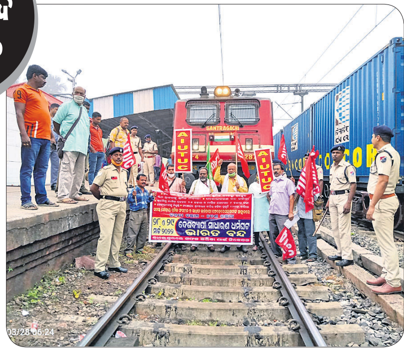
ବାଲେଶ୍ୱର ରେଳ ଷ୍ଟେଶନ