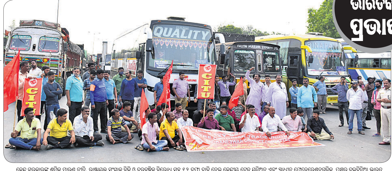
କେନ୍ଦ୍ର ସରକାରଙ୍କ ଶ୍ରମିକ ମାରଣ ନୀତି, ରାଷ୍ଟ୍ରୀୟ ସଂଗ୍ରାମୀ ଦଳ ଓ ଦରବୁକ୍ତି ବିରୋଧ ସହ ୧୨ ଦମ୍ପା ଦାବି ନେଇ କେନ୍ଦ୍ରୀୟ ଟ୍ରେଡ୍ ୟୁନିଅନ ଏବଂ ସ୍ୱାଧୀନ ଫେଡେରେଶନକୁ ଯୁକ୍ତି ପକ୍ଷରୁ ବୁଲିଦିଆ ଭାରତ ବନ୍ଦର ସୋମବାର ପ୍ରଥମ ଦିନରେ କ୍ରୁରନେଶ୍ୱର ଜୟଦେବବିହାର ନିକଟ ୧୬ ନଂ. ଲାଗାୟ ରାଜପଥରେ ଗୋଡ଼ିମୋଟର ଅଟକାଇଯାଇଛି।