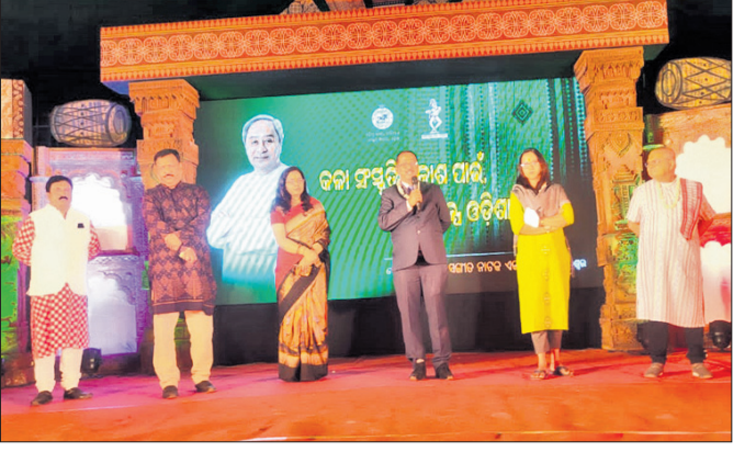
ଉଦ୍ଘାଟନା ଉତ୍ସବରେ ଅତିଥି ବୃନ୍ଦ।