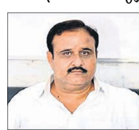
ପାକିସ୍ତାନ ପାଇଁ ପଞ୍ଚାବ ପ୍ରଦେଶର ମୁଖ୍ୟମନ୍ତ୍ରୀ ଇମ୍ରାନ୍ ଖାନ୍ ଅନାସ୍ତା ପ୍ରସ୍ତାବର ସମ୍ମୁଖୀନ ହୋଇଥିବାବେଳେ ଚାକ୍ ଦଳର ସହଯୋଗୀ ରହିଛି।

ସଦସ୍ୟ ଚପା ପଞ୍ଚାବ ପ୍ରଦେଶର ମୁଖ୍ୟମନ୍ତ୍ରୀ ଉତ୍ତମନ କୁଜର ସେମାନଙ୍କର ଇସ୍ତଫା ଦେଇଛନ୍ତି। କେବଳ ଉତ୍ତମନ କୁଜର, ହାର୍ଦ୍ଦି ମନ୍ତା ଚପା ପିଏନ୍‌ଏଲ୍-ଏନ୍ ନେତା ତାରିକ ବଶିର ତିପା ମଧ୍ୟ ସଂସଦୀୟ କ୍ୟାବିନେଟକୁ ଇସ୍ତଫା ଦେଇଥିବା ଜଣାପଡ଼ିଛି।