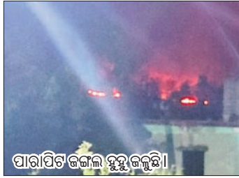
ପାରାମିତ ଜଙ୍ଗଲ ଝୁକୁଇଗଲୁଛି।