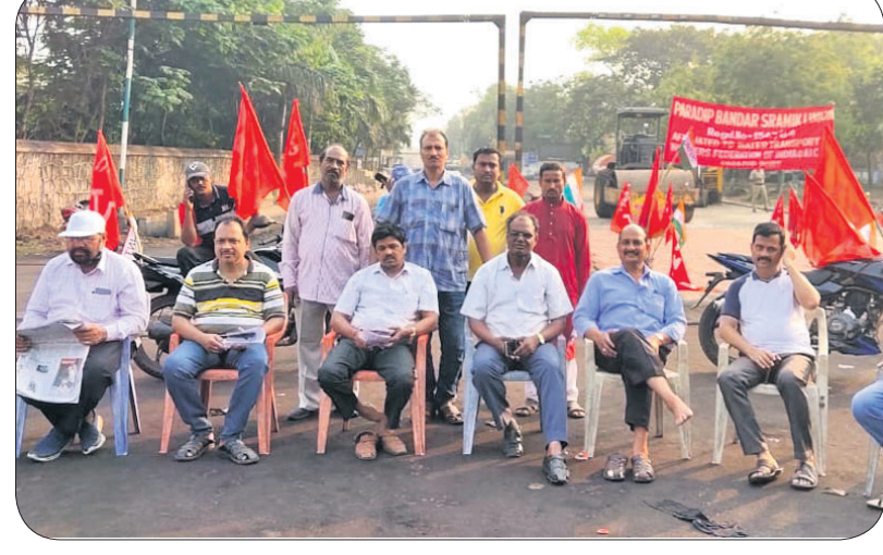
ପାରାମପ ବନ୍ଦର ରେଡ୍ ନଂ-୪