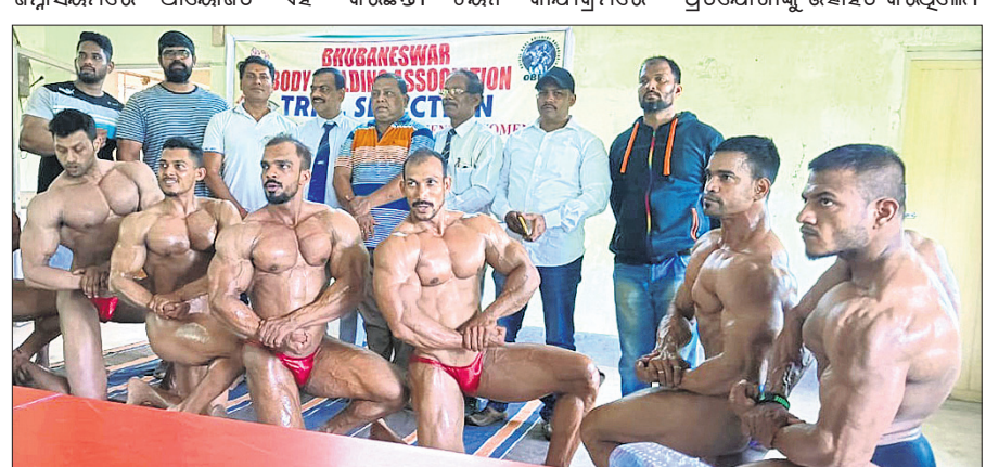
ମିଷ୍ଟର ଓଡ଼ିଶା ପାଇଁ ଭୁବନେଶ୍ୱରରୁ ଚୟନ ହେଉଥିବା ପ୍ରତିଯୋଗୀମାନେ ଅତିଥି ଓ କର୍ମଚାରୀଙ୍କ ସହିତ ।

କାର୍ଯ୍ୟକ୍ରମରେ ଭୁବନେଶ୍ୱରର ବିଭିନ୍ନ ଜିଲ୍ଲାସ୍ତରୀୟ ପାଖାପାଖି ୫୦ ପ୍ରତିଯୋଗୀ ଅଂଶଗ୍ରହଣ କରିଥିଲେ। ସେମାନଙ୍କ ମଧ୍ୟରୁ ୨୭ ଜଣ ରାଜ୍ୟ ପ୍ରତିଯୋଗୀ ପାଇଁ ଚୟନ ହୋଇଛନ୍ତି ବୋଲି ଭୁବନେଶ୍ୱର କାର୍ଯ୍ୟକ୍ରମ ଅନୁଷ୍ଠିତ ହୋଇଯାଇଛି। ପୁରୁଣା ଭୁବନେଶ୍ୱରରେ ବନ୍ଧନଗଡ଼ ଜିଲ୍ଲାସ୍ତରୀୟ ଆୟୋଜିତ ଏହି