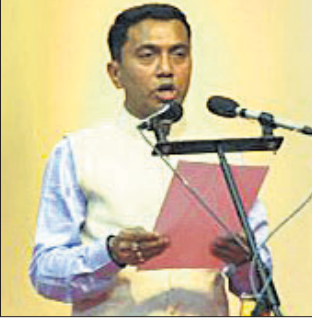
ପଟଣା, ୨୮ ମାର୍ଚ୍ଚ (ଆଇଏଏଏଏ)

ଭାଜପା ନେତା ପ୍ରମୋଦ ସାଢ଼ୁକ ସୋମବାର ରୋଆ ପୁଖ୍ୟମନ୍ତ୍ରୀ ଭାବେ ଶପଥ ଗ୍ରହଣ କରିବା ସହ ଡାକ୍ତର ବିତାୟ ଲକ୍ଷ୍ମଣ ଆରମ୍ଭ କରିଛନ୍ତି। ରାଜ୍ୟପାଳ ପି.ଏସ୍. ଶ୍ରୀଧରନ ପିଲାଳ ଡାକ୍ତର ପଦ ଓ ଗୋପନୀୟତା ଶପଥ ପାଠ କରାଇଥିଲେ। ଡ. ଶ୍ୟାମାପ୍ରସାଦ ମୁଖାର୍ଜୀ ସ୍ୱାଭିମ୍ବନରେ ଅନୁଷ୍ଠିତ ଶପଥଗ୍ରହଣ ଉତ୍ସବରେ ପ୍ରଧାନମନ୍ତ୍ରୀ ନରେନ୍ଦ୍ର ମୋଦି, ସ୍ୱରାଷ୍ଟ୍ରମନ୍ତ୍ରୀ ଅମିତ୍ ଶାହା, ଭାଜପା ରାଷ୍ଟ୍ରୀୟ ଅଧ୍ୟକ୍ଷ କେ.ପି. ନକ୍ଷା ସମେତ ଦଳର ବହୁ କେନ୍ଦ୍ରୀୟ ନେତୃତ୍ୱ ଯୋଗ ଦେଇଥିଲେ। ୪୦ ଆସନ ବିଶିଷ୍ଟ ରୋଆ ବିଧାନସଭା ନିର୍ବାଚନରେ ଭାଜପା ୨୦ ଆସନ ଜିତିଥିବାବେଳେ ୩ ସ୍ୱାଧୀନ ବିଧାୟକ ଏବଂ ମହାରାଷ୍ଟ୍ରବାଦୀ ଗୋପବନ୍ଧୁ ପାର୍ଟି (ଏମ୍‌ଜିପି)ର ୨ ବିଧାୟକ ଏହାକୁ ସମର୍ଥନ ଜଣାଇଛନ୍ତି। ପ୍ରମୋଦ ସାଢ଼ୁକଙ୍କ ନୂଆ କ୍ୟାବିନେଟରେ କେତେକ ନୂଆ ମୁହଁଙ୍କୁ ସାମିଲ କରାଯାଇଥିବାବେଳେ ପୁରୁଣାଙ୍କୁ ବାଦ ଦିଆଯାଇଛି। ପୂର୍ବ ମନ୍ତ୍ରୀମଣ୍ଡଳରେ ସାମିଲ ଥିବା ଏକମାତ୍ର ମହିଳା ଜେନିଫର ମୋନସେରାଟେଙ୍କୁ ବାଦ ଦିଆଯାଇଥିବାବେଳେ ତାଙ୍କ ସ୍ୱାମୀ ଆଗନାସିଓ ମୋନସେରାଟେ ନୂଆ କ୍ୟାବିନେଟରେ ସ୍ଥାନ ପାଇଛନ୍ତି। ଅନ୍ୟ ନୂଆ ମୁହଁ ମଧ୍ୟରେ ଅଛନ୍ତି ରୋହନ ଖାଉଡ଼େ, ରବି ନାଏକ ଏବଂ ସୁଭାଷ ଶିରୋଦକର।