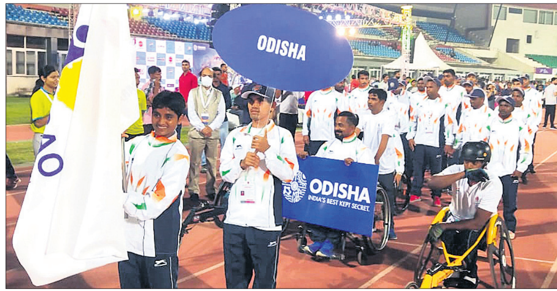
ପ୍ରତିଯୋଗିତାରେ ଭାରତ ଦଳର ପତାକା ଧରି ଉଡ଼ିବା ପ୍ରତିଯୋଗୀ ।