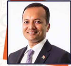
Chief Speaker Shri Naveen Jindal Chairman Jindal Steel and Power