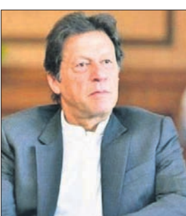
ଇମ୍ରାନ୍‌ନାଦାବୀ, ୨୮ ମାର୍ଚ୍ଚ (ପି.ଟି.)

ପାକିସ୍ତାନ ବିରୋଧୀ ଦଳ ନେତା ଚପା ପିଏନ୍‌ଏଲ୍-ଏନ୍ ଅଧିକ ଶେହବାଜ ଶରିଫ୍ ଯୋଗୁଁ ଗୋଟିଏ ପ୍ରଧାନମନ୍ତ୍ରୀ ଇମ୍ରାନ୍ ଖାନ୍‌ଙ୍କ ବିରୋଧରେ ଅନାସ୍ତା ପ୍ରସ୍ତାବ ଆରତ କରିଛନ୍ତି। ୨୦୧୮ରେ ଇମ୍ରାନ୍ ଶହୀଦତାକୁ ଆସିବା ପରେ ସବୁଠୁ କଠିନ ରାଜନୈତିକ ପରିସ୍ଥିତି ସମ୍ମୁଖୀନ ହୋଇଛନ୍ତି।