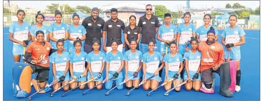
ଦିଲ୍ଲୀ ବିପକ୍ଷରେ ବିଜୟୀ ଓଡ଼ିଶା କ୍ରୀଡ଼ାକର୍ମୀମାନଙ୍କର ସମାପ୍ତି ସମୟରେ ।

ସୋନିପତ, ୨୮୩ (ପି.ସି.): ବିଶ୍ୱ ନମ୍ବର ୨ ଦୀପିକା କୁମାରୀ ଆଗାମୀ ଏସିଆନ୍ ଗେମ୍ସ ପାଇଁ ଭାରତୀୟ ଆର୍ତ୍ତେତି ଦଳରୁ ବାଡ଼ ହେବ। ସେମାନେ ୨୦୨୨ରେ ପ୍ରଥମଥର ପାଇଁ ଦୀପିକା ଭାରତୀୟ ଦଳରୁ ବାଡ଼ ହେବେ। ସେମାନେ ୨୦୨୨ରେ ପ୍ରଥମଥର ପାଇଁ ଦୀପିକା ଭାରତୀୟ ଦଳରୁ ବାଡ଼ ହେବେ।