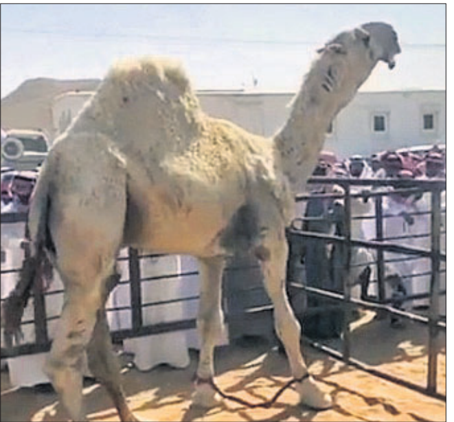
କୋଟି ୧୬ ଲକ୍ଷ ଟଙ୍କାର ନିଲାମ ଓଟା ଆରମ୍ଭ ହୋଇଥିଲା। ଏହାପରେ ଏହି ନିଲାମ ମୂଲ୍ୟ ବୃଦ୍ଧି ପାଇ ୭ ମିଲିୟନ ସାଉଦି ରିୟାଲ୍ ଅର୍ଥାତ୍ ୧୪ କୋଟି

୨୩ ଲକ୍ଷ ଟଙ୍କାରେ ଶୁଣି ହୋଇଥିଲା। ନିଲାମ ଧରିଥିବା ବ୍ୟକ୍ତିଙ୍କ ନାଁ ଓ ଠିକଣା ସମ୍ପର୍କରେ ଏପର୍ଯ୍ୟନ୍ତ କୌଣସି ସୂଚନା ଦିଆଯାଇ ନାହିଁ। କିନ୍ତୁ ଏହି ଓଟଟି ଏକ ବିଶେଷ ପ୍ରକାରର ଓଟ ହୋଇଥିବାରୁ ପ୍ରାୟ ସବୁଆଡ଼େ ଏହାକୁ ନେଇ ଚର୍ଚ୍ଚା ହେଉଥିଲା।