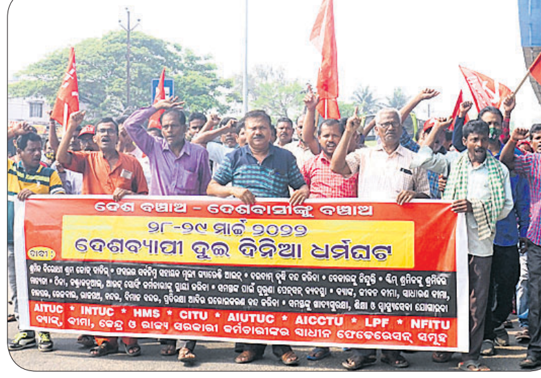
କଟକ ଖପୁରିଆ ଛକ