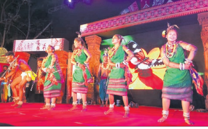
ବଣାର କଳାକାରମାନେ ପୁଷ୍କାରି ନୃତ୍ୟ ପରିବେଷଣ କରୁଛନ୍ତି।