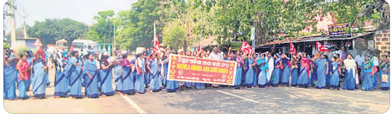
ଭାରତ ବନ୍ଦ ପାଳନ ପରିପ୍ରେକ୍ଷାରେ ଯୋଗବାର ଖୋର୍ଦ୍ଧା ଜିଲ୍ଲା ବୋଲଗଡ଼ ଚହସିଲ ଛକରେ ନିଶ୍ଚଳ ଓଡ଼ିଶା ଆଶକର୍ମୀ ସଂଘ ଓ ସିପିଆଇ ପକ୍ଷରୁ ରାସ୍ତା ଅବରୋଧ କରାଯାଇଛି।