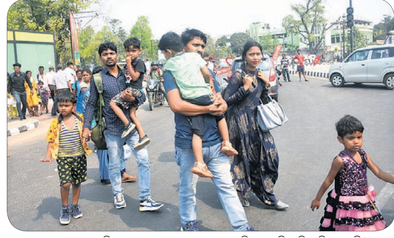
ଭୁବନେଶ୍ୱରରେ ଗାଡ଼ି ମୋଟର ବନ୍ଦ ଯୋଗୁ ଲୋକମାନେ ପଲ୍ଲୀକୁ ଧରି ଚାଲି ଚାଲି ଯାଉଛନ୍ତି।