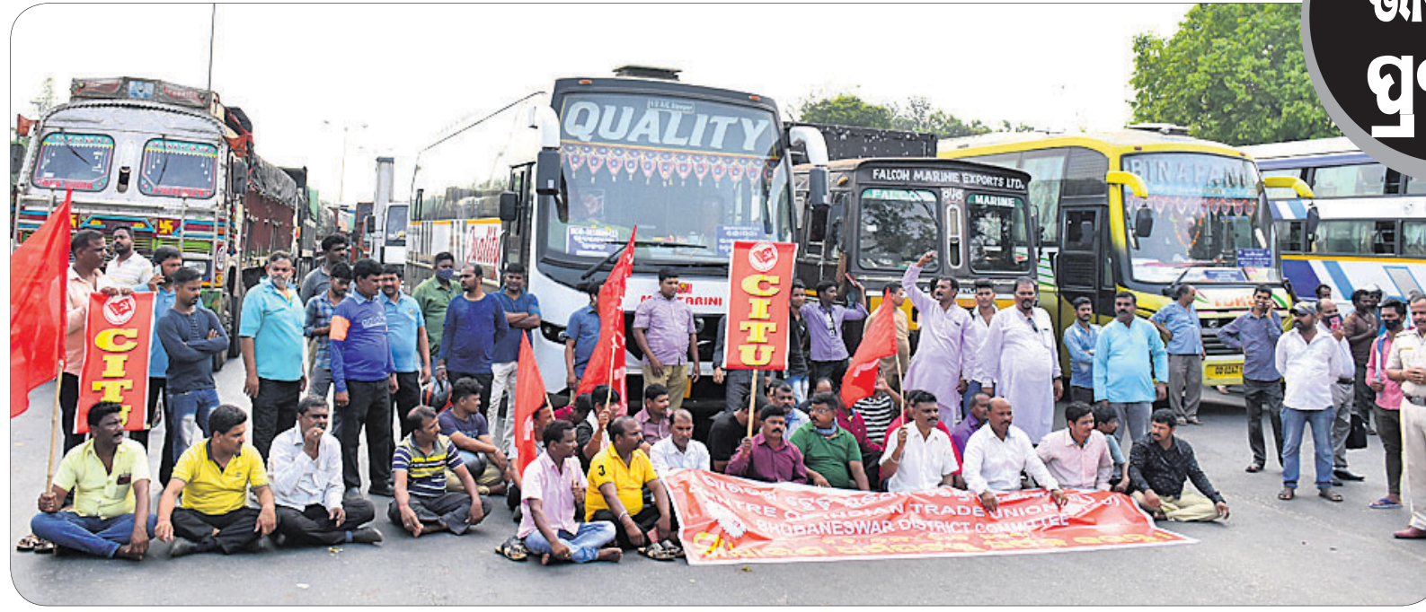
କେନ୍ଦ୍ର ସରକାରଙ୍କ ଶ୍ରମିକ ମାରଣ ନୀତି, ରାଷ୍ଟ୍ରୀୟ ସଂଗ୍ରାହକ ବିକ୍ରି ଓ ଦରବୃଦ୍ଧିକୁ ବିରୋଧ ସହ ୧୨ ଦମା ଦାବି ନେଇ କେନ୍ଦ୍ରୀୟ ଟ୍ରେଡ ୟୁନିଅନ ଏବଂ ସ୍ୱାଧୀନ ଫେଡେରେଶନଗୁଡ଼ିକ ପକ୍ଷରୁ ବୁଲଦିନିଆ ଭାରତ ବନ୍ଦର ଯୋଜନା ପ୍ରଥମ ଦିନରେ ଭୁବନେଶ୍ୱର କନ୍ୟାବିହାର ନିକଟ ୧୬ ନଂ. ଜାତୀୟ ରାଜପଥରେ ଗୋଡ଼ିମୋଟର ଅଟକାଯାଇଛି।