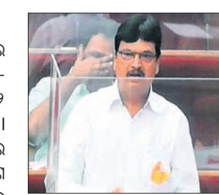
ଅର୍ଥମନ୍ତ୍ରୀ ନିରଞ୍ଜନ ପୂଜାରୀ

ରାଜ୍ୟରେ ରଖିଭାର ୧ ଲକ୍ଷ ୪ ହଜାର ୩୨୧ କୋଟି ରହିଛି। ୨୦୨୧-୨୨ରେ ମୁଖପିଛା ରଖିଭାର ୨୨ ହଜାର ୮୨୭ ଟଙ୍କା ୫୪ ପଇସା। ରାଜ୍ୟ ସରକାର ୨୦୧୦-୧୧ରେ ୩୪୯୦.୪୬ କୋଟି ଟଙ୍କା ରଖି କରିଥିବାବେଳେ ୨୦୧୧-୧୨ରେ ୧୭୦.୨୩ କୋଟି, ୨୦୧୨-୧୩ରେ ୨୫୦୦.୬୨ କୋଟି, ୨୦୧୩-୧୪ରେ ୧୯୭୯.୩୨ କୋଟି, ୨୦୧୪-୧୫ରେ ୭୬୩୬.୫୩ କୋଟି, ୨୦୧୫-୧୬ରେ ୧୧,୬୨୫.୩୨ କୋଟି, ୨୦୧୬-୧୭ରେ ୧୩,୦୮୦.୧୭ କୋଟି, ୨୦୧୭-୧୮ରେ ୧୪,୪୧୯.୪୧ କୋଟି, ୨୦୧୮-୧୯ରେ ୧୧,୬୫୦.୨୫ କୋଟି, ୨୦୧୯-୨୦ରେ ୧୫,୫୯୩.୬୨ କୋଟି, ୨୦୨୦-୨୧ରେ ୨୧,୩୧୭.୬୪ କୋଟି ଏବଂ ୨୦୨୧-୨୨ ଜାନୁୟାରୀ ସୁଦ୍ଧା ରାଜ୍ୟ ସରକାର ୧୦,୮୩୪.୨୯ କୋଟି ଟଙ୍କା ରଖି କରିଛନ୍ତି। କର୍ମଚର ପରେ ଓଡ଼ିଶା ଦେଶରେ କମ୍ ରଖି