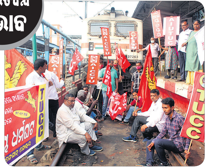
ଭୁବନେଶ୍ୱର ରେଳଷ୍ଟେଶନରେ ରେଳରୋକ୍ତା କରାଯାଇଛି।