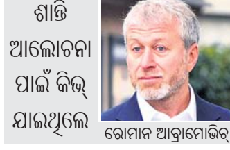
ଶାନ୍ତି ଆନ୍ଦୋଳନ ପାଇଁ କିଭ୍ ଯାଇଥିଲେ ରୋମାନ ଆଗ୍ରାମୋଭିର୍

କିଭ୍, ୨୮ମାର୍ଚ୍ଚ: ରୁଷିଆ ଅରବପତି ରୋମାନ ଆଗ୍ରାମୋଭିର୍ ଏବଂ ଯୁକ୍ତମୁକ୍ତ ବୁଲ୍ ଶାନ୍ତି ପ୍ରତିନିଧିଙ୍କୁ କିଭ୍ରେ ବିଷ ଦିଆଯାଇଥିବା ରିପୋର୍ଟ ପ୍ରକାଶ ପାଇଛି। ଶାନ୍ତି ଆନ୍ଦୋଳନକୁ ଚଳୁଥିବା କିଭ୍ରେ ଏପରି କିରୀୟାକାରୀ ବୋଲି ସୋମବାର ଫିଲ୍‌ଷ୍ଟ୍ର ଜର୍ନାଲରେ ପ୍ରକାଶିତ ଏହି ରିପୋର୍ଟରେ ଦର୍ଶାଯାଇଛି। ବିଲ୍‌ନେୟାର ରୋମାନ ଆଗ୍ରାମୋଭିର୍ଙ୍କ ଉପରେ ନିକଟରେ ପାଣ୍ଡାଫଳ ଦେଖାଯିବା କଟକଣା ଲଗାଇ ରୁଷିଆ ରାଷ୍ଟ୍ରପତି ଭୁଟିନ୍‌ଙ୍କ ଉପରେ ଚାପ ପକାଇବାକୁ ଉଦ୍ୟମ କରିଥିଲେ। ଯୁକ୍ତମୁକ୍ତ ଅରବପତି କ୍ରମେ ଶାନ୍ତି ଆନ୍ଦୋଳନ ନିମନ୍ତେ ରୋମାନ ମାର୍ଚ୍ଚ ୩ରେ କିଭ୍ ଯାଇଥିଲେ। ସେ କିଭ୍ରେ ଯୁକ୍ତମୁକ୍ତ ୨ ପ୍ରତିନିଧିଙ୍କ ସହ ମିଳି କରିବା ପରେ ସମସ୍ତ ୩ ଜଣ ଅସୁସ୍ଥ ହୋଇପଡ଼ିଥିଲେ। ସେମାନଙ୍କ ଆଖି ଲାଲ ପଡ଼ିଯିବା ସହ ଚର୍ମରୁ ଗୋପା ଛାଡ଼ିବା ଏବଂ ପୁହୁରେ ଅଜବ ଲକ୍ଷଣ ଦେଖାଯାଇଥିଲା ବୋଲି ଏହି ଆମେରିକୀୟ ଖବରକାଗଜ ପ୍ରକାଶ କରିଛି। ବାସ୍ତବରେ ଏହା ପଛରେ କିଏ ରହିଛି ତାହା ସ୍ପଷ୍ଟ ହୋଇ ନ ଥିବାରୁ କେତେକ କେତେକ କଠୋରପକ୍ଷୀ ଏପରି କାମ କରିଥିବା ସନ୍ଦେହ କରାଯାଉଛି। ସମସ୍ତ ୩ ଜଣ ଏବେ ସୁସ୍ଥ ଅଛନ୍ତି। ତେବେ ହତ୍ୟା ଉଦ୍ଦେଶ୍ୟରେ ମୁହଁ ବଦଳି ସେମାନଙ୍କୁ ଚୋରାବନା ଦେବା ପାଇଁ ବିଷ ଦିଆଯାଇଥିବା ଅନୁମାନ କରାଯାଇଛି।