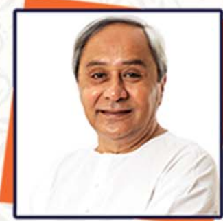
Inaugurator Shri Naveen Patnaik Hon'ble CM, Odisha