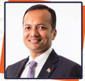
Chief Speaker Shri Naveen Jindal Chairman Jindal Steel and Power