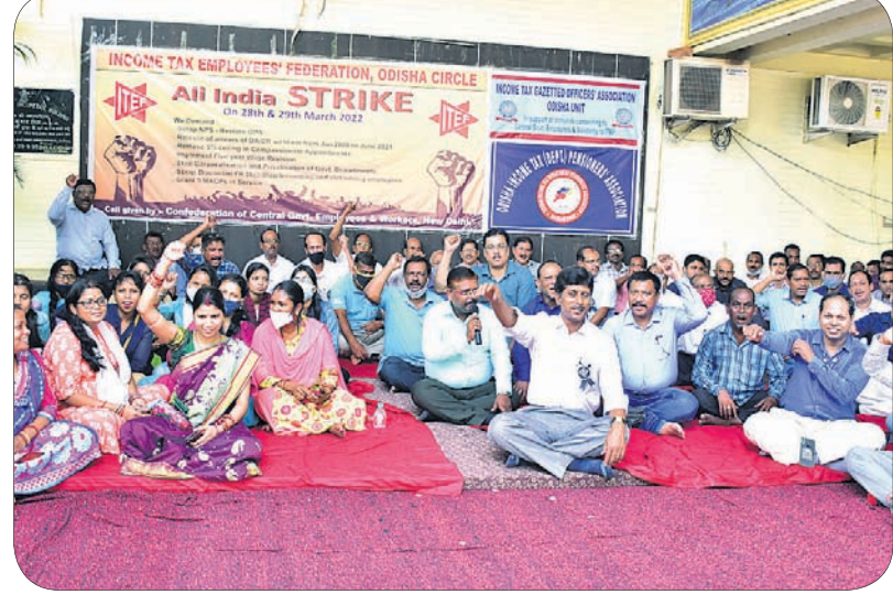
ଜନକମ୍ ବ୍ୟାଙ୍କ ଏଣ୍ଟ୍ରାଇଜ୍ ଫେଡେରେଶନ ପକ୍ଷରୁ ବନ୍ଦ ପାଳନ।

ଭାରତ ବନ୍ଦ ପାଇଁ ଯୋଗବାର ରାଜଧାନୀର ପେଟ୍ରୋଲ ପମ୍ପଗୁଡ଼ିକ ସକାଳୁ ବନ୍ଦ ରହିଥିଲା। ଏହାର ପ୍ରୟୋଗ ନେଇ ବ୍ୟବସାୟୀମାନେ ପେଟ୍ରୋଲ ଓ ଡିଜେଲ କଳାବଜାର କରିଥିଲେ। ସେମାନେ ସହରର ବିଭିନ୍ନ ଛକ ଯଥା ବାଣୀ ବିହାର, ଜୟଦେବ ବିହାର, ରଘୁଲଗଡ଼, ଶହାଦ ନଗର, ଚନ୍ଦ୍ରଶେଖରପୁର, ପଟିଆ, ନୟାପଲ୍ଲୀ, ବରପୁଷ୍ପା ସମେତ ବିଭିନ୍ନ ଅଞ୍ଚଳ ଓ ପେଟ୍ରୋଲ ପମ୍ପ ସାମ୍ନାରେ ଅଧିକ ଦାମରେ ତେଲ ବିକ୍ରି କରୁଥିବା ଦେଖିବାକୁ ମିଳିଥିଲା। ବିଶେଷ କରି ପାନ, ଚାଁ ଦୋକନୀ ଓ କେତେକ ଖୁରୁଦା ବ୍ୟବସାୟୀ ପେଟ୍ରୋଲ ବିକ୍ରିରେ ସାମିଲ ଥିଲେ। ପେଟ୍ରୋଲ ଲିଟରକୁ ୧୫୦ରୁ ୨୦୦ ଟଙ୍କା ପର୍ଯ୍ୟନ୍ତ ବିକ୍ରି କରିଥିବାବେଳେ ଲୋକେ ମଧ୍ୟ ହଜରାଶତୁ ମୁକ୍ତି ପାଇଥିଲେ।