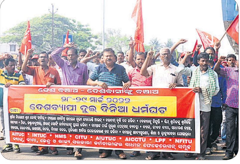
ବନ୍ଦ ପାଳନ ଅବସରରେ କଟକ ଖପୁରିଆ ଛକକୁ ବାହାରିଥିବା ରାଲି।