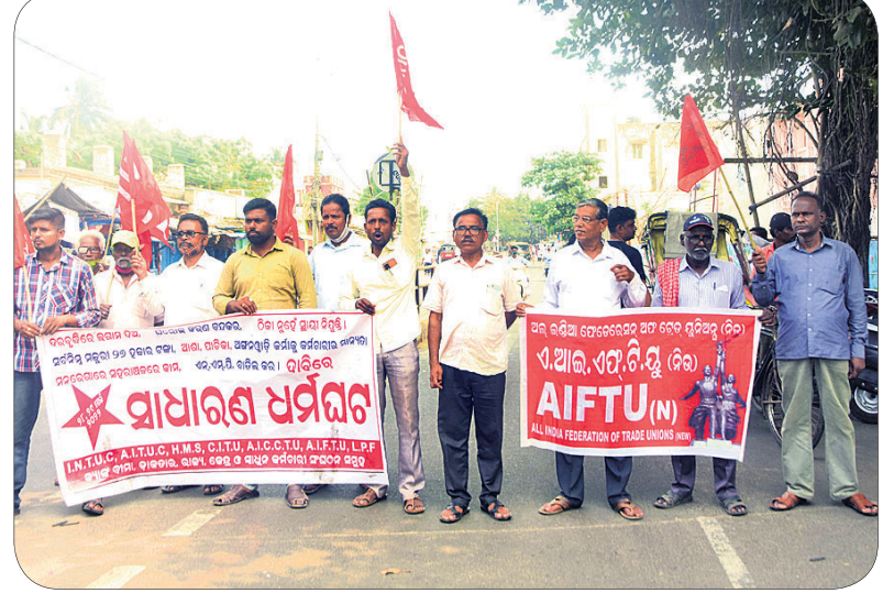
ବାମପନ୍ଥା ଦଳ ପକ୍ଷରୁ ପୁରୀରେ ବାହାରିଥିବା ଶୋଭାଯାତ୍ରା।