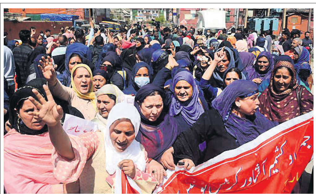
'ଭାରତ ବନ୍ଦ'ର ଦ୍ୱିତୀୟ ଦିନରେ ଶ୍ରୀନଗରରେ ସିଆଇଟିୟୁ ଏବଂ ଅଜନଘାଟି କର୍ମୀଙ୍କ ମିଳିତ ବିକ୍ଷୋଭ।

୧୭ ଭିଃ ହେଲିକପ୍ଟର ପୁତୁଣ୍ଡନ କରାଯାଇଥିବା ଆଇଏସଏ କହିଛି। ଅଗ୍ନିକାଣ୍ଡର କାରଣ ଜଣାପଡ଼ିନାହିଁ। ଆଖପାଖ ଅଞ୍ଚଳରେ ଥିବା ଜନବସତି ଏରିଆକୁ ଲୋକଙ୍କୁ ସୁରକ୍ଷିତ ସ୍ଥାନକୁ ଯିବାପାଇଁ ପରାମର୍ଶ ଦିଆଯାଇଛି। ଅନ୍ୟପକ୍ଷରେ ୨ ମାସ ପୂର୍ବରୁ ଏହି ଅଭୟାରଣ୍ୟରେ ଏକ ବାୟୁକ୍ଷେପ (କୋର୍ ଡ୍ରାମା) ବନ୍ଦ ବିଭାଗର ପ୍ରାୟ ୨୦୦ କର୍ମଚାରୀଙ୍କୁ ନିଆଁ ଲିଭାଇବା ପାଇଁ ଉଦ୍ୟମ କରୁଛନ୍ତି। ଅଭୟାରଣ୍ୟ ଜଳୁଥିବା ନେଇ ଅଲଘୋର ଜିଲ୍ଲା ପ୍ରଶାସନ ପକ୍ଷରୁ ଆଇଏସଏକୁ ଜଣାଯିବା ସହ ସହାୟତା ମଗାଯାଇଥିଲା। ଜଙ୍ଗଲର ପ୍ରାୟ ୧୦ ବର୍ଗ କିଲୋମିଟର ପର୍ଯ୍ୟନ୍ତ ନିଆଁ ବ୍ୟାପିଥିବାରୁ ଏହାକୁ ନିୟନ୍ତ୍ରଣ କରିବା ପାଇଁ ସେଠାରେ ଦୁଇଟି ଏମଆଇ