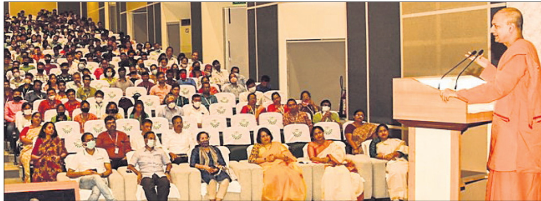
କିନ୍ ନଲେଜ ଟ୍ରି ବଜ୍ରତାମାଳାରେ ଅଧ୍ୟାୟ ରୁଚୁ ସାମାୟିକ ସର୍ବପ୍ରିୟାନ୍ୟ ଅଭିଭାଷଣ ରଖୁଛନ୍ତି।

କିନ୍ ନଲେଜ ଟ୍ରି ବଜ୍ରତାମାଳାରେ ଅଭିଭାଷଣ ଦେଇ ସେ କହିଲେ, ଆମକୁ ଯେତେ ସଫଳତା ମିଳିଲେ ମଧ୍ୟ ଆଧ୍ୟାତ୍ମିକତାବାଦ ବ୍ୟତିରେକେ ଶାନ୍ତି ମିଳି ନ ଥାଏ। ଏଥିପାଇଁ ବିଭିନ୍ନ କ୍ଷେତ୍ରରେ ସଫଳ ବ୍ୟକ୍ତିମାନେ ଆଧ୍ୟାତ୍ମିକତା ମଧ୍ୟରେ ସୁଖ ଓ ଶାନ୍ତି ଖୋଜିଥାନ୍ତି।