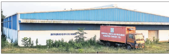
ପରିଷ୍କୃତ ଅବସ୍ଥାରେ ଥିବା ମ୍ୟାଗ୍ନୋହବ୍

ପୁଣି କାର୍ଯ୍ୟକ୍ଷମ ହେବ ପରିଷ୍କୃତ 'ମ୍ୟାଗ୍ନୋ ହବ୍'। ଗଞ୍ଜାମ ଆଉ ଶାନ୍ତାଳ ଜିଲ୍ଲା ଦରରେ ବିକ୍ରି କରିବାକୁ ପଡ଼ିବି ଆୟ। ସେମାନଙ୍କୁ ମିଳିବ ଉତ୍ପାଦିତ ପଦ୍ମାକର ଉଚିତ ମୂଲ୍ୟ।