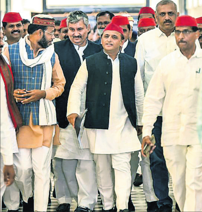
ଲକ୍ଷ୍ନୌ: ଉତ୍ତର ପ୍ରଦେଶ ବିଧାନସଭାକୁ ମଙ୍ଗଳବାର ବିରୋଧୀ ଦଳ ନେତା ତଥା ସମାଜବାଦୀ ପାର୍ଟି ଅଧ୍ୟକ୍ଷ ଅଶୁକେଶ ଯାଦବ ଦଳୀୟ ବିଧାୟକମାନଙ୍କ ସହ ସାଜୁଛନ୍ତି।