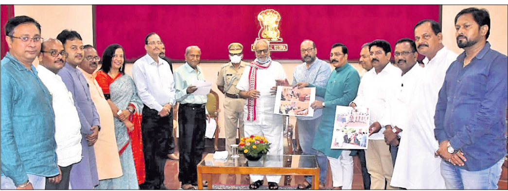
ରାଜ୍ୟପାଳ ପ୍ରଫେସର ଗଣେଶୀ ଲାଲଙ୍କୁ ମଙ୍ଗଳବାର ଦାବିପତ୍ର ପ୍ରଦାନ କରୁଛନ୍ତି ଭାଜପା ପ୍ରତିନିଧି ଦଳ।