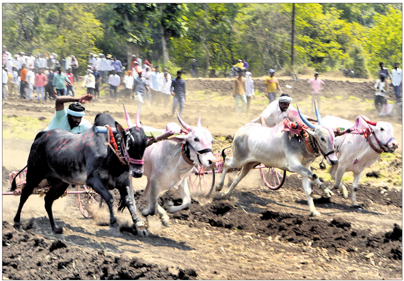
ମହାରାଷ୍ଟ୍ରର ସତରା ଜିଲା କରାଡ଼ରେ ମଙ୍ଗଳବାର ଆୟୋଜିତ ପାରମ୍ପରିକ ବକ୍ତ ବାଡ଼ି ଚୋଡ଼ ପ୍ରତିଯୋଗିତା।