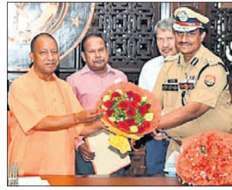
ଉତ୍ତର ପ୍ରଦେଶ ମୁଖ୍ୟମନ୍ତ୍ରୀ ଯୋଗୀ ଆଦିତ୍ୟନାଥଙ୍କୁ ଆଇପିଏସ୍ ଅଧିକାରୀ ପୁଷ୍ପଗୁଜ୍ଜ ପ୍ରଦାନ କରୁଛନ୍ତି।