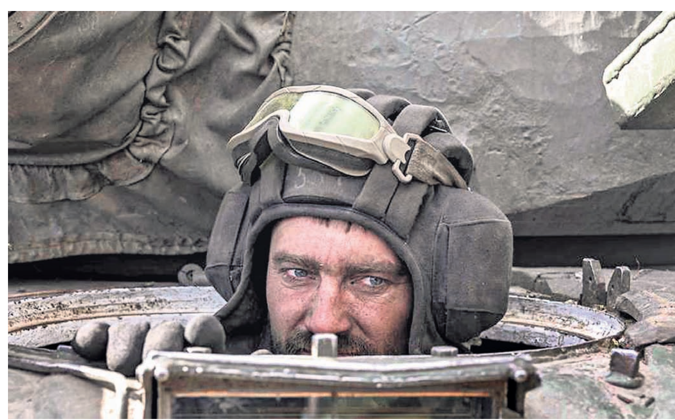
କିଭ୍ରେ ରୁଷିଆ ସୈନ୍ୟଙ୍କ ସହ ଲଡ଼େଇ ପରେ କବ୍‌ଚା କରିଥିବା ଏକ ଯୁଦ୍ଧ ଟ୍ୟାଙ୍କ ଭିତରେ ଜଣେ ୟୁକ୍ରେନୀୟ ସୈନ୍ୟ।