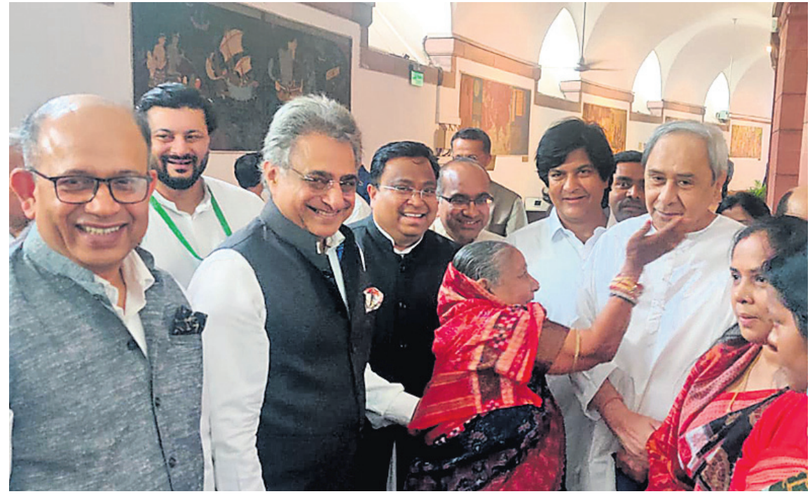
ପାଲିମେଣ୍ଟରେ ମଙ୍ଗଳବାର ବିଜେଟି ଏମ୍ପିମାନଙ୍କ ଗହଣରେ ଦଳର ସଭାପତି ତଥା ମୁଖ୍ୟମନ୍ତ୍ରୀ ନବୀନ ପଟ୍ଟନାୟକ ।

ସାମ୍ବନ୍ଧୀୟ ଶତକ ମ୍ୟାଚ ଭିତ୍ତିଆର ପ୍ରମିୟର ଲିଗରେ ମଙ୍ଗଳବାର ରାଜସ୍ଥାନ ରୟାଲ୍ ପକ୍ସରୁ ୧୦୦ତମ ମ୍ୟାଚ ଖେଳିଛନ୍ତି ସଞ୍ଜୁ ସାମ୍ବନ୍ଧୀୟ