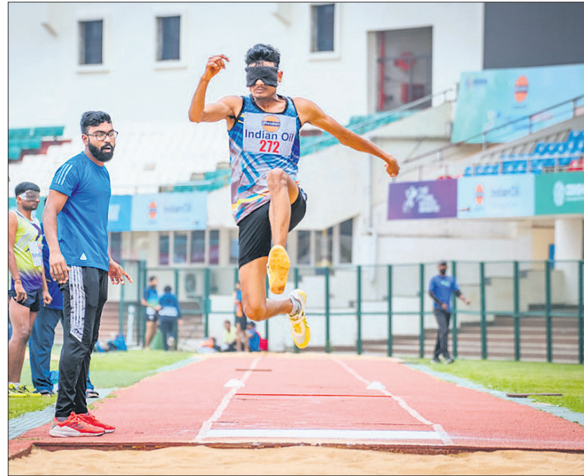
ଭୁବନେଶ୍ୱରରେ ଚାଲିଥିବା ଜାତୀୟ ପାରା ଆଥଲେଟିକ୍ସ ଚାମ୍ପିୟନଶିପ୍ରେ ରୁଧ୍ରବୀର ପୁରୁଷ ଲଙ୍କାଜ୍ୟ ଓ ରେସ୍ ଅବସରରେ ପ୍ରତିଯୋଗୀମାନେ ।