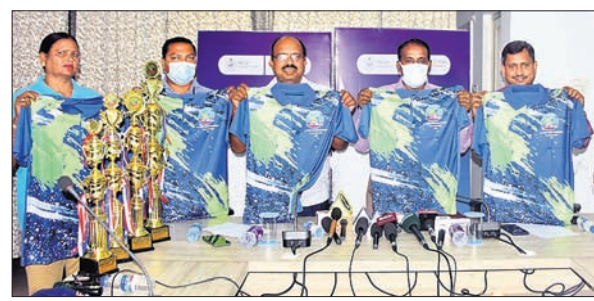
ଅଧିକାରୀମାନଙ୍କ ଦ୍ୱାରା କର୍ମ ଉନ୍ମୋଚନ କରାଯାଇଛି ।