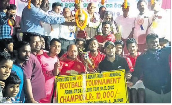
ଚାମ୍ପିୟନ ଦଳକୁ ଅତିଥି ରୂପେ ପ୍ରଦାନ କରୁଛନ୍ତି ।

ଦେଖିବାକୁ ମିଳୁଥିଲା । ଏହି କ୍ରିକେଟ୍ ଗ୍ରାଉଣ୍ଡରେ ଶେନ୍‌ଙ୍କ ଅନେକ ସ୍ମୃତି ରହିଛି । କାରଣ ସେ ନିଜର କ୍ରିକେଟ୍ ଜଗତର ଯାତ୍ରା ଏହି ଗ୍ରାଉଣ୍ଡରୁ ହିଁ ଆରମ୍ଭ କରିଥିଲେ ।