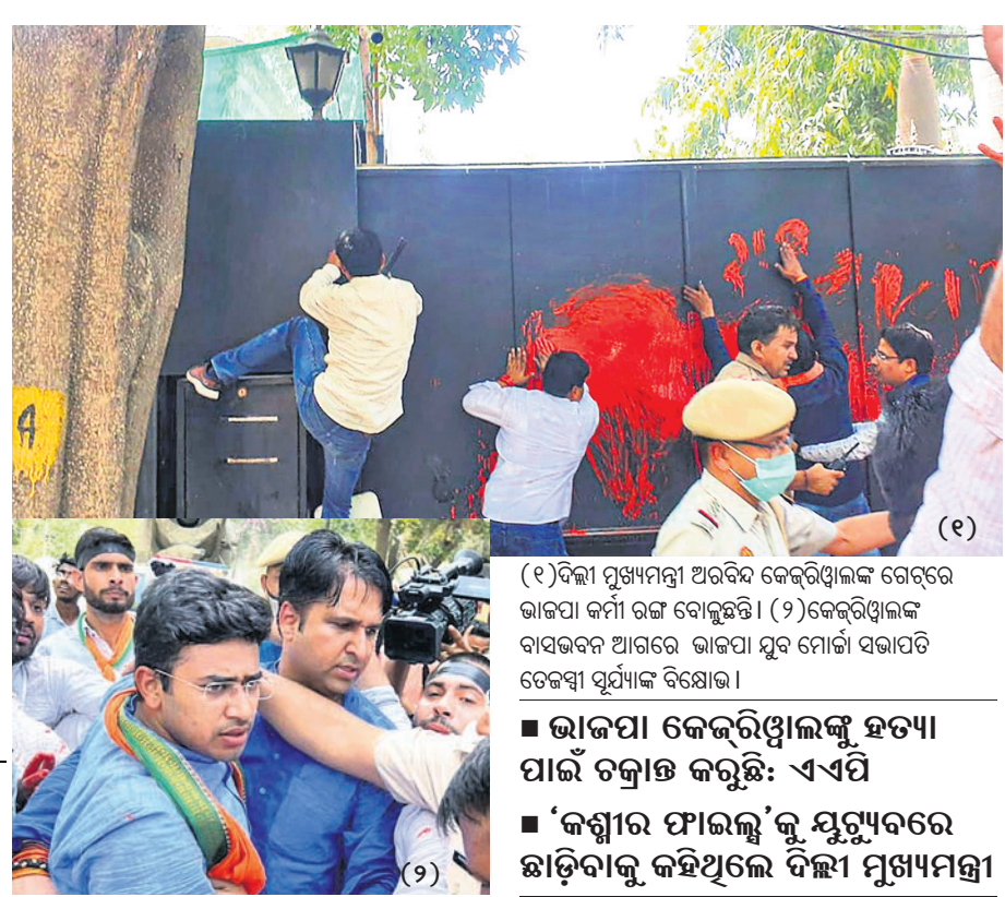
(୧) ଦିଲ୍ଲୀ ମୁଖ୍ୟମନ୍ତ୍ରୀ ଅରବିନ୍ଦ କେଜ୍ରିୱାଲଙ୍କ ରେଭର ଉପରେ ଭାଙ୍ଗିବା କର୍ମୀମାନେ ଟାଗେଟ୍ କରିଥିବା ଅଭିଯୋଗ ହୋଇଛି। ନିକଟରେ ମୁକ୍ତିଲାଭ କରିଥିବା 'ଦ କଣ୍ଠାର ଫାଇଲ୍' ଉପରେ କେଜ୍ରିୱାଲଙ୍କ ମତବ୍ୟକୁ ନେଇ ଉତ୍ତରାଖଣ୍ଡ ଭାଙ୍ଗିବା କର୍ମୀମାନେ ବିରୋଧ ପ୍ରଦର୍ଶନ କରିବାକୁ ଯାଇ ପୋଲିସ୍ ଉପସ୍ଥିତିରେ ଚୁପ୍‌ଚାପ୍ ଭିଆଇଛନ୍ତି। ଭାଙ୍ଗିବା କେଜ୍ରିୱାଲଙ୍କୁ ନିର୍ବାଚନରେ ହରାଇ ନ

ପାରିବାରୁ ତାଙ୍କୁ ହତ୍ୟା କରିବାକୁ ଉଦ୍ୟମ ଚଳାଇଛି ବୋଲି ଦିଲ୍ଲୀ ଉପମୁଖ୍ୟମନ୍ତ୍ରୀ ମନାସ ସିଂହାଡ଼ିଆ ସମାଲୋଚନା କରିଛନ୍ତି। ଦିଲ୍ଲୀ ପୋଲିସ୍ କେତେକ ଅଜ୍ଞାତ ବ୍ୟକ୍ତିଙ୍କ ବିରୋଧରେ ମାମଲା ରୁଜୁ କରିଛି। ବଳିଭଦ୍ର ନିର୍ଦ୍ଦେଶକ ବିବେକ ଅଗ୍ନିହୋତ୍ରୀଙ୍କ ଫାଇଲ୍ 'ଦ କଣ୍ଠାର ଫାଇଲ୍' ୧୯୯୦ ଦଶକରେ କଣ୍ଠାର ପଞ୍ଚିତକ ଉପରେ ନିର୍ଦ୍ଦାତନୀୟ କାହାଣୀକୁ ନେଇ ଗତିଶୀଳ ହୋଇଛି। ଉପଦେଶକରେ ଆତଙ୍କବାଦ ଆରମ୍ଭ ହେବାବେଳେ