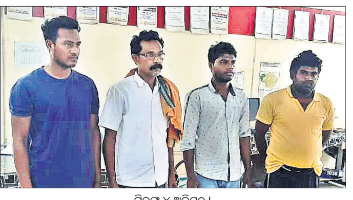
ଗିରଫ ୪ ଅଭିଯୁକ୍ତ ।