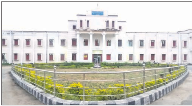
ସୁବର୍ଣ୍ଣପୁର ଜିଲାପାଳଙ୍କ କାର୍ଯ୍ୟାଳୟ।

ପ୍ରକଳ୍ପ ଅଛି। ମାତ୍ର ଜଳସେଚନ ସୁବିଧା ହୋଇପାରିନି। ମହାନଦୀ କୂଳରେ ମେଘା ଉଠା ଜଳସେଚନ ପ୍ରକଳ୍ପଗୁଡ଼ିକର ନିର୍ମାଣ କାର୍ଯ୍ୟ ମନ୍ଦର ଗତିରେ ଚାଲିଛି।