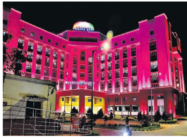
ଓଡ଼ିଶା ଦିବସ ଅବ୍ୟବହିତ ପୂର୍ବରୁ ଗୁରୁବାର ରାତିରେ ଆଲୋକମାଳାରେ ଝଲସି ଉଠିଛି ଖାରବେଳ ଭବନ ଏବଂ ଲୋକସେବା ଭବନ ।