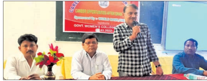
ମହିଳା ମହାବିଦ୍ୟାଳୟରେ ଅନୁଷ୍ଠିତ ସମ୍ମାନରେ ମହାଧ୍ୟାନ ଅତିଥି।

ବଲାଙ୍ଗୀର ସରକାରୀ ମହିଳା ମହାବିଦ୍ୟାଳୟରେ ମହିଳାଙ୍କ ଭୂମିକା ଓ ଭବିଷ୍ୟତ ଶୀର୍ଷକ ବୃତ୍ତି ପରାମର୍ଶ ସମ୍ମାନ