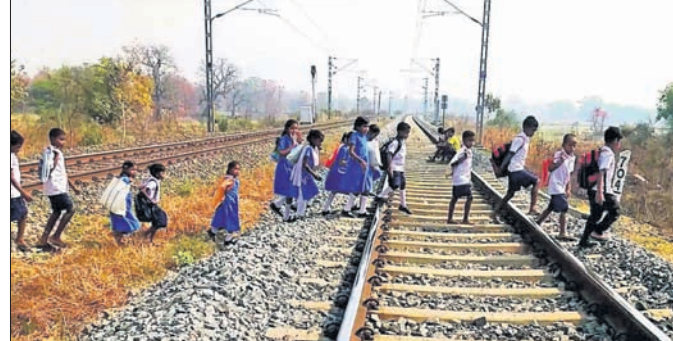
ଦାବଲିକାନୀର ଛାତ୍ରୀଛାତ୍ରମାନେ ରେଳ ଧାରଣା ଡେଇଁ ସ୍କୁଲ ଯାଉଛନ୍ତି।

କମ୍ପ ଉପସ୍ଥାନ ଦର୍ଶାଇ ବଲାଙ୍ଗୀର ଜିଲ୍ଲା ଦେଓଗାଁ ବ୍ଲକ ହାତୀସରା ପଞ୍ଚାୟତ ଦାବଲିକାନୀରେ ଥିବା ପ୍ରାଥମିକ ସ୍କୁଲକୁ