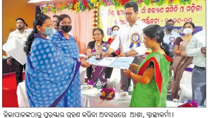
ଜିଲ୍ଲାପାଳଙ୍କଠାରୁ ପୁରସ୍କାର ଗ୍ରହଣ କରିବା ଅବସରରେ ଆଶା, ସ୍ୱାସ୍ଥ୍ୟକର୍ମୀ ।