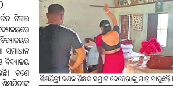
ଶିକ୍ଷୟିତ୍ରୀ ଜଣକ ଶିକ୍ଷକ ସମ୍ମୁଖରେ ବେହେରାକୁ ମାଡ଼ ମାରୁଛନ୍ତି।

କାଳିଫେଲ, ୩୧ମାର୍ଚ୍ଚ (ଡି.ଏନ୍.ଏ.) ମାଲକାନଗିରି ଜିଲ୍ଲା କାଳିଫେଲ ବ୍ଲକ ଅନ୍ତର୍ଗତ ଚିଲାଇ ପଞ୍ଚାୟତର ଏମ୍ପିଡି-୬୫ ଅଧିକାରୀଙ୍କୁ ଉଚ୍ଚ ବିଦ୍ୟାଳୟରେ ରୁଧିରୀ ଏକ ଅଭାବନୀୟ ଘଟଣା ଘଟିଛି।