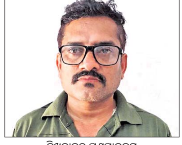
ନିଷ୍ଠାକାନ୍ଦ ସମ୍ପ୍ରଦାୟର ନିର୍ଦ୍ଦେଶକ