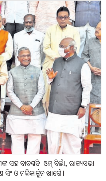
ବିଦାୟ ସମ୍ବର୍ଦ୍ଧନା ଅବସରରେ ପ୍ରଧାନମନ୍ତ୍ରୀଙ୍କ ସହ ବାଚସ୍ପତି ଓମ୍ ବିଲା, ରାଜ୍ୟସଭା ଉପାଧ୍ୟକ୍ଷ ହରିବଂଶ ନାରାୟଣ ସିଂ ଓ ମଲିକାର୍ଜୁନ ଖାଶ୍ଟ୍ରି।

ନୁଆଦିଲ୍ଲୀ, ୩୧।୩ ଇଣ୍ଡିଆନ୍ କ୍ରିକେଟ୍ ଲିଗ୍ (ଆଇସିଏଲ୍) ପ୍ରସାରଣ ନିଲାମୀରେ ମୁହଁମୁହିଁ ହେବାକୁ ଯାଉଛି ବୁଲ୍ ବଲ୍‌ମିଲିନିୟାରେ କେନ୍ଦ୍ର ବେଜୋସ୍ ଓ ମୁକେଶ୍ ଅୟନୀ। ପ୍ରଥମ ଥର ପାଇଁ ଟେଲିଭିଜନରେ କ୍ରିକେଟର ସିଧା ପ୍ରସାରଣ ଏବଂ ଅନୁଲୋଚନା ପ୍ଲାଟ୍ଫର୍ମ ହୋଇଆସୁଥିଲା। ମିଶିପୁର କର୍ମୀ ଭାରୋପ ବାନ୍ଧୁ ଶର୍ମିଳା ଉଚ୍ଚ ଆଇନ ପ୍ରତ୍ୟାହାର ଦାବିରେ ୧୬ ବର୍ଷ ଅନଶନ କରିଥିଲେ। ଅୟନୀଙ୍କ ରିଲାଏନ୍ ଇଣ୍ଡିଆନ୍ ସାମିଲ ହେବାକୁ ଯାଉଛି। ବୁନ୍ ୧୨ରେ ଭାରତୀୟ କ୍ରିକେଟ୍ ଲିଗ୍ ୭ ବିଲିୟନ୍ ଡଲାରରେ ନିଲାମ ହେବା ଆଶା ରଖାଯାଇଛି।