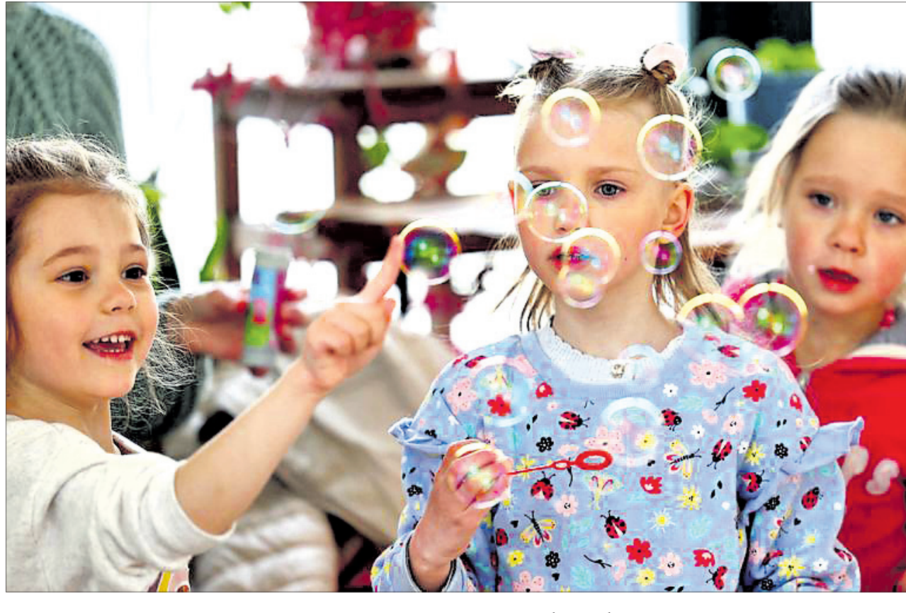
ବୁଦ୍ଧିଆର ଅଳ୍ପମଣ ପରେ ଯୁକ୍ତମାନଙ୍କୁ ପକାୟନ କରିଥିବା କୁନିପିଲାମାନେ ଜର୍ମାନୀର ବର୍ଲିନସ୍ଥିତ ଏକ ସ୍କୁଲରେ ଖେଳୁଛନ୍ତି।

କରନାଲ, ୩୧।୩: ଯୋଗ ଗୁରୁ ରାମଦେବ ବାବାଙ୍କୁ କରନାଲରେ ଏକ ସାମ୍ବାଦିକ ସମିଳନୀରେ ଜଣେ ଖବରଦାତା ପେଟ୍ରୋଲ ଦର ବୃଦ୍ଧି ବିଷୟରେ ପ୍ରଶ୍ନ କରିଥିଲେ। ରାମଦେବ ବିଧିରେ ରାଜ୍ୟର ଖବରଦାତାଙ୍କୁ ଦୁଇ ରହିବାକୁ କହିଥିଲେ। ୨୦୧୪ ଲୋକ ସଭା ନିର୍ବାଚନରେ ସରକାର ବଦଳିଲେ, ପେଟ୍ରୋଲ ଲିଟର ପିଛା ୪୦ ଟଙ୍କାରେ ମିଳିବ ବୋଲି ରାମଦେବ ପୂର୍ବରୁ କହିଥିଲେ। ତାହା ମନେପକାଇଦେଇ ଖବରଦାତା ଜଣକ ରାମଦେବଙ୍କୁ ପ୍ରଶ୍ନ କରିବା ଏହାର ଉତ୍ତର ଦେବା ବଦଳିବେ ରାମଦେବ ରାଜି ଯାଇ କହିଥିଲେ, 'ହଁ ମୁଁ ତାହା କହିଥିଲି, ତୁମେ ମୋର କ'ଣ କରିବ? ମୁଁ ଠିକାଦାର ରୁହେଁ ଯେ, ତୁମାମାନଙ୍କ ଏଭଳି ପ୍ରଶ୍ନର ଉତ୍ତର ଦେଉଥିବ।