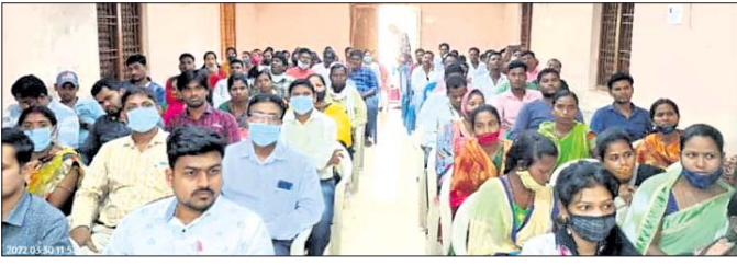
କାର୍ଯ୍ୟକ୍ରମରେ ଉପସ୍ଥିତ ଅଧିକାରୀ ଓ ଜନ ପ୍ରତିନିଧି ।

ଆର.ଉଦୟଗିରି,୩୧୩୩(ଡି.ଏନ.ଏ.) ମୋହନା ବ୍ଲକ୍‌ରେ ରୁଧିରାଜାଜାତୀୟ ଶାନ୍ତି ସ୍ତମ୍ଭର ଉଦ୍ଘାଟନା କାର୍ଯ୍ୟକ୍ରମରେ ଉପସ୍ଥିତ ଅଧିକାରୀ ଓ ଜନ ପ୍ରତିନିଧି ।