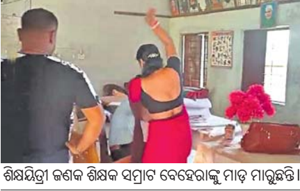
ଶିକ୍ଷୟିତ୍ରୀ ଜଣକ ଶିକ୍ଷକ ସମ୍ମୁଖରେ ସହକର୍ମୀଙ୍କୁ ମାଡ଼ ମାରୁଛନ୍ତି।

କାଲିମେଳା, ୩୧୩(ଡି.ଏନ୍.ଏ.) ମାଲକାନଗିରି ଜିଲା କାଲିମେଳା ବ୍ଲକ ଅନ୍ତର୍ଗତ ଚିଲାଇ ପଞ୍ଚାୟତର ଏମ୍ପିଡି-୬୫ ଅଧିକାରୀଙ୍କୁ ଉଚ୍ଚ ବିଦ୍ୟାଳୟରେ ରୁଧିରା ଏକ ଅଭାବନାୟ ଘଟଣା ଘଟିଛି।