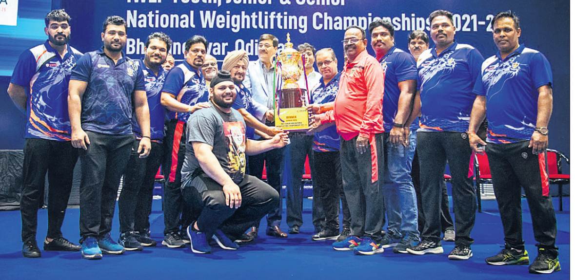
ଜାତୀୟ ଭାରୋଭୋଜନ ଚାମ୍ପିୟନଶିପ୍‌ରେ ପୁରୁଷ ବର୍ଗ ଚାମ୍ପିୟନ ରେଲଡେ ସ୍ପୋର୍ଟ୍ସ୍ ପ୍ରମୋଶନ ବୋର୍ଡ୍ ଦଳର ପ୍ରତିଯୋଗୀମାନେ ଟ୍ରଫି ସହ ଅତିଥିକ ଗହଣରେ।

୨୦୩ ଦର୍ଶକ ଉପସ୍ଥାନ ଥିଲେ। ଏହି ସ୍ୱର୍ଣ୍ଣପଦକ ମ୍ୟାଚରେ ପୁଲ୍‌ରାଷ୍ଟ୍ର ଆମେରିକା ୨-୧ ଗୋଲରେ ଜାପାନକୁ ପରାସ୍ତ କରିଥିଲା। ପୂର୍ବ କ୍ରମରେ ୨୦୧୯ରେ ଆର୍ଜେଣ୍ଟିନାରେ ଫ୍ରାନ୍ସ ମେଡାଲିଟାମେରେ ଷ୍ଟାଡିୟମରେ ପ୍ରତିଷ୍ଠା ହୋଇଥିଲା। ଆର୍ଜେଣ୍ଟିନା ମାଡ୍ରିଡ୍ ଓ ବାର୍ସିଲୋନା ମଧ୍ୟରେ ଏହି ମ୍ୟାଚକୁ ଷ୍ଟାଡିୟମରେ ୬୦, ୭୩୯ ଦର୍ଶକ ଦେଖିଥିଲେ।