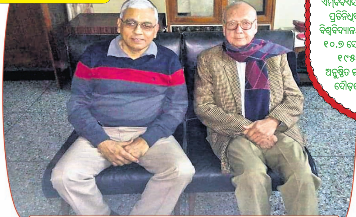
ପୂର୍ବତନ ରଣଜୀ ଟ୍ରଫି ଖେଳାଳି ତଥା ସମ୍ପର୍କୀୟ ଭାଇ ସୁପ୍ରିକାନ୍ତଙ୍କ ସହ ସତ୍ୟାବଳୀ ଯୋଗ (ତାହାଣୀ)।