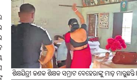
ଶିକ୍ଷୟିତ୍ରୀ ଜଣକ ଶିକ୍ଷକ ସମ୍ମୁଖରେ ସହକର୍ମୀଙ୍କୁ ମାଡ଼ ମାରିଛନ୍ତି।

କାଲିମେଳା, ୩୧୩୩(ଡି.ଏ.ଏ.ଏ.) ମାଳକାନଗିରି ଜିଲ୍ଲା କାଲିମେଳା ବ୍ଲକ ଅନ୍ତର୍ଗତ ଚିଲିକା ପଞ୍ଚାୟତର ଏଠାପରି-୬୫ ଅଫିସରେ ଉଚ୍ଚ ମାଧ୍ୟମିକ ବିଦ୍ୟାଳୟରେ କୁଳ୍ପିତ ଏକ ଅଧିକାରୀଙ୍କୁ ସମ୍ମୁଖରେ ଉଚ୍ଚ ମାଧ୍ୟମିକ ବିଦ୍ୟାଳୟର ଦୁଇ ଶିକ୍ଷୟିତ୍ରୀ ଶିକ୍ଷକଙ୍କ ମଧ୍ୟରେ ଥିବା ସମସ୍ୟା ସମାଧାନ କରିବାକୁ ଆସିଥିବା ଏଭଳି ଘଟଣା ବିଦ୍ୟାଳୟର ସମସ୍ତଙ୍କୁ ଆଶ୍ଚର୍ଯ୍ୟ କରିଛି।