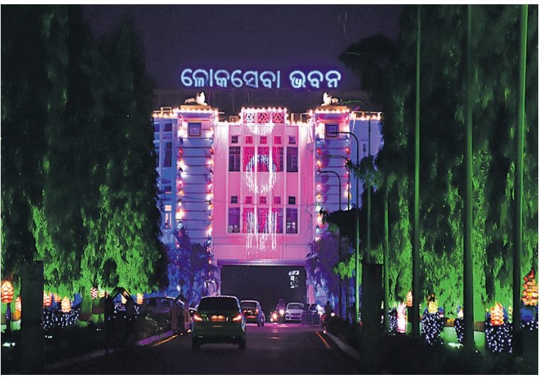
ଓଡ଼ିଶା ଦିବସ ଅବ୍ୟବହିତ ପୂର୍ବରୁ ଗୁରୁବାର ରାତିରେ ଆଲୋକମାଳାରେ ଝଲସି ଉଠିଛି ଖାରବେଳ ଭବନ ଏବଂ ଲୋକସେବା ଭବନ ।