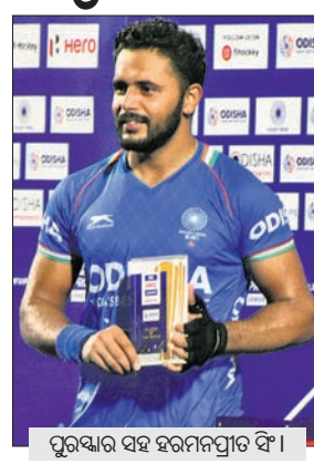
ପୁରସ୍କାର ସହ ହରମନପ୍ରୀତ ସି।

ଭୁବନେଶ୍ଵର, ୩୧୪ (କ୍ରୀଡ଼ା ପ୍ରତିନିଧି): ଓଡ଼ିଶାର ଅମିତ ରୋହିତାସକ ନେତୃତ୍ଵରେ ଭାରତ ଏପିଆଇଏସ୍ ପ୍ରେମି ଲିଗ୍ ହକିରେ ଲଙ୍କାଶ୍ଠ ବିପକ୍ଷରେ ଡବଲ ବିଜୟ ହାସଲ କରିଛି। କଳିଙ୍ଗ ଷ୍ଟାଡ଼ିୟମରେ ଶନିବାର ଶୁଭଆରମ୍ ୩-୨ ଗୋଲରେ ଜିତିଥିବା ଭାରତ ରବିବାର ଅନୁଷ୍ଠିତ ମ୍ୟାଚରେ ଲଙ୍କାଶ୍ଠ ପ୍ରଦର୍ଶନ କରି ୪-୩ ଗୋଲରେ ଲଙ୍କାଶ୍ଠକୁ ପରାସ୍ତ କରିଛି। ଭାରତ ପକ୍ଷରୁ ମନପ୍ରୀତ ସି ୧୫+ ୨୬ ଏବଂ ହରମନପ୍ରୀତ ସି ୨୬ ଓ ୪୩ତମ ମିନିଟରେ ୨ଟି ଲେଖାଏ ଗୋଲ ଦେଇଥିଲେ। ଲଙ୍କାଶ୍ଠର ଲିଆମ ସାନ୍‌ଡେଫୋର୍ଟ ୬ମ, ତେଜିତ କଣ୍ଠନ ୩୯ ଓ ସାମ୍ ଓଡ଼ି ୪୪ତମ