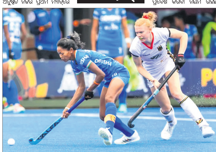
ଭାରତ ଓ ଜର୍ମାନୀ ମଧ୍ୟରେ ଅନୁଷ୍ଠିତ ମ୍ୟାଚ।

ପୁଲ୍ 'ଡି'ରେ ଭାରତ ୨ ମ୍ୟାଚରୁ ଦ୍ଵିତୀୟ ବିଜୟ ସହ ୬ ପଏଣ୍ଟ ପାଇ ଚେନ୍ନାଇର ଶୀର୍ଷସ୍ଥାନ ରହିଛି। ଜର୍ମାନୀ ୨ ମ୍ୟାଚରୁ ୧ ବିଜୟ ସହ ୩ ପଏଣ୍ଟ ପାଇଛି। ମାଲେସିଆ ଓ ଫ୍ଲୋୟ୍ଡ ମ୍ୟାଚ୍ ୩-୩ ଗୋଲରେ ଡ୍ର ରହିଥିବାରୁ ପଏଣ୍ଟ ପାଇଛନ୍ତି। ପ୍ରତି ପୁଲରୁ ୨ଟି ଲେଖାଏ ଦଳ ନକାଉଟରେ ପ୍ରଦେଶ କରିବା ନିୟମ ରହିଛି।