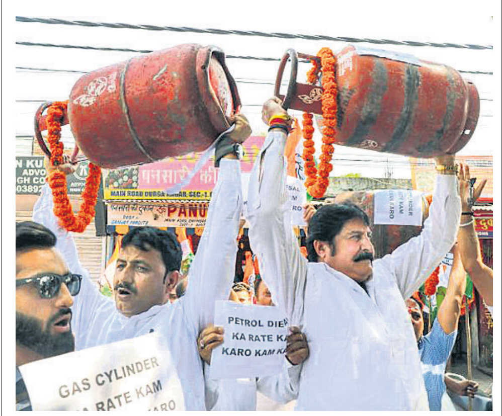
ତେଲ ଏବଂ ଏଲପିଜି ଦର ବୃଦ୍ଧି ପ୍ରତିବାଦରେ କଂଗ୍ରେସ ପକ୍ଷରୁ ରବିବୀର ଜଣ୍ଡରେ ବିରୋଧ ପ୍ରଦର୍ଶନ କରାଯାଇଛି।

କଳିତ ବର୍ଷ ଶେଷ ଭାଗରେ ଗୁଜରାଟ ବିଧାନସଭା ନିର୍ବାଚନ ହେବାକୁ ଥିବାବେଳେ ଦିଲ୍ଲୀ ମୁଖ୍ୟମନ୍ତ୍ରୀ ଅରବିନ୍ଦ କେଜ୍ରିୱାଲ ଏବଂ ପଞ୍ଜାବ ମୁଖ୍ୟମନ୍ତ୍ରୀ ଭଗତ ସିଂ ମାନ୍ଦ ପେଠାକୁ ବୁଲୁଥିବା ଗସ୍ତରେ ଯାଇ ଆମ୍ ଆଦମୀ ପାର୍ଟିକୁ ଥରେ ସୁଯୋଗ ଦେବା ଲାଗି ଶନିବାର ରୋଡ୍ ଶୋ'ରେ କନସାଧାରଣକୁ ଅନୁରୋଧ କରିଥିଲେ। ରବିବୀର ସେମାନେ ଅହମଦାବାଦର ସାମାଜିକରାଜ୍ୟ ମନ୍ଦିର ଯାଇ ପୂଜାର୍ଚ୍ଚନା କରିଛନ୍ତି। ତେବେ ଗୁଜରାଟ ଭାଜପା ଉତ୍ତରାଧିକାରୀ ପର୍ଯ୍ୟଟକ କହିବା ସହ କେଜ୍ରିୱାଲଙ୍କୁ ବୁଝାଇ ଦେଇଛନ୍ତି। କେଜ୍ରିୱାଲଙ୍କୁ ଲୋକେ ଭୋଟ ଦେଇ ନିର୍ବାଚିତ କରିଛନ୍ତି। ତେଣୁ ସେ ସମ୍ମାନ ପାଇବାକୁ ହକ୍‌ଦାର। ଭାଜପା ବିଭିନ୍ନ ପ୍ରସଙ୍ଗକୁ ନେଇ ନିର୍ବାଚନ ଲଢ଼ି, କାହା ପ୍ରତି ଅପମାନଜନକ ମନ୍ତବ୍ୟ ଦେଇ ରୁହେଁ ବୋଲି ଉପାଧିକାରୀ କହିଛନ୍ତି।