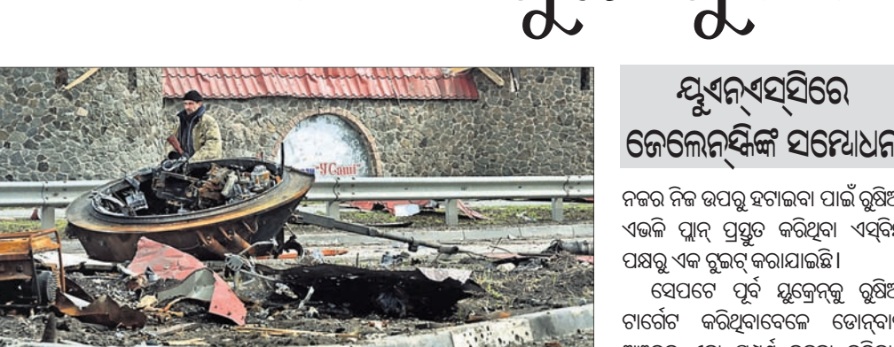
ନଷ୍ଟ ହୋଇଯାଇଥିବା ରୁଷିଆ ବ୍ୟାଙ୍କ ନିକଟରେ ଜଣେ ମୁକ୍ତେନ୍ଦ୍ର ସୈନ୍ୟ।