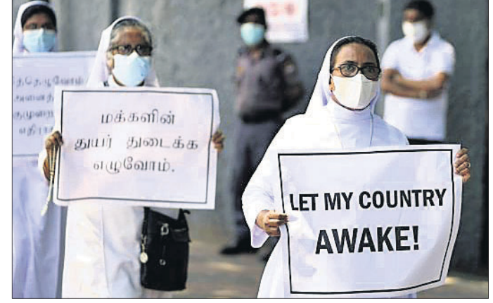
ଶ୍ରୀଲଙ୍କାର କ୍ୟାଥୋଲିକ୍ ନନ୍ ଆନ୍ଦୋଳନକୁ ଓହ୍ଲାଇଛନ୍ତି

ଯୋର ଆର୍ଥିକ ସଙ୍କଟକୁ ସାମ୍ନା କରୁଥିବା ଶ୍ରୀଲଙ୍କାର ସ୍ଥିତି ଦିନକୁ ଦିନ ଅତି ଖରାପ ହେଉଛି। ୪୨ ଏମ୍ପାଇ ନିଜକୁ ସ୍ଵାଧୀନ ଘୋଷଣା କରିବା ପରେ ରାଷ୍ଟ୍ରପତି ଗୋଟାବାୟା ରାଜପାକ୍ସେଙ୍କ ଶ୍ରୀଲଙ୍କା ପୋଡୁନ ପେରାପୁନା (ଏସ୍ଏଲପିଏ) ମଙ୍ଗଳବାର ପାଇମେଣ୍ଟରେ ସଂଖ୍ୟାଗରିଷ୍ଠତା ହରାଇଛି।