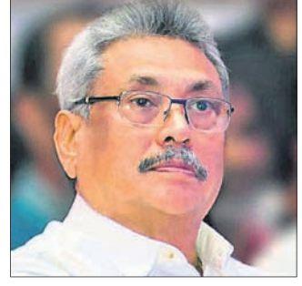
୪୨ ଏମ୍ପାଇ ଇମ୍ରାନ ପରେ