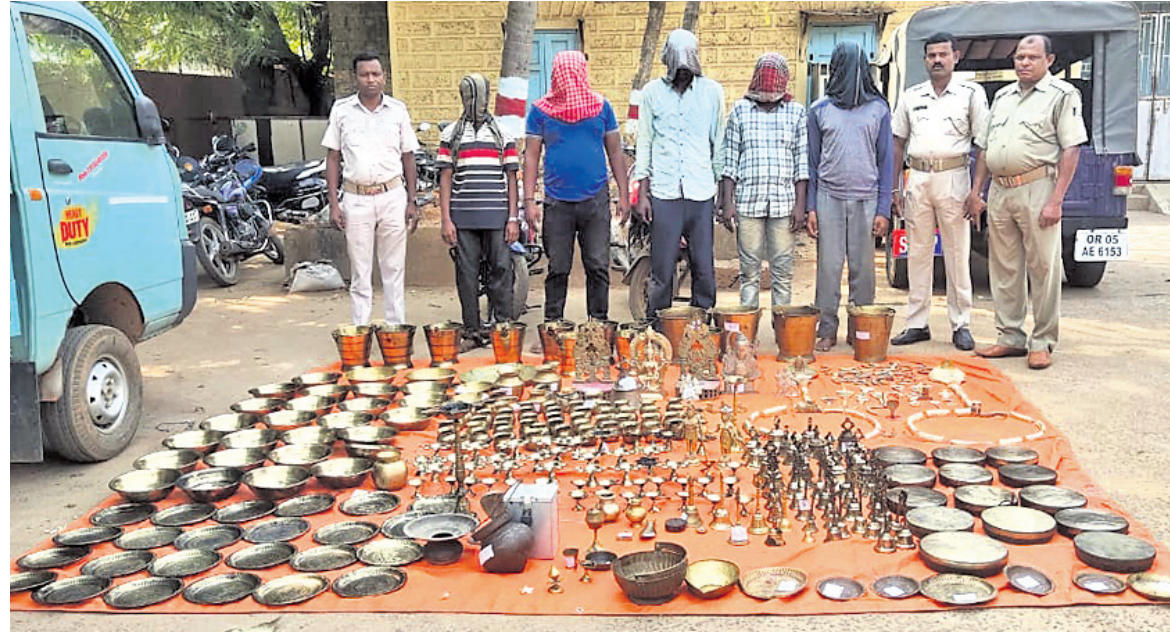
ଗିରଫ ୫ ଅଭିଯୁକ୍ତ, ଜବତ ହୋଇଥିବା ମୂର୍ତ୍ତି ଓ ସମଗ୍ରା ।

ଘରୁ ବାହାରି ପରେ ନିଖୋଜ ହୋଇଯାଇଥିଲେ । ଏନେଇ ପରିସର ଲୋକେ ସିନ୍ଦେହ କଲେ । ଥାନାରେ ଅଭିଯୋଗ କରିଥିଲେ ।