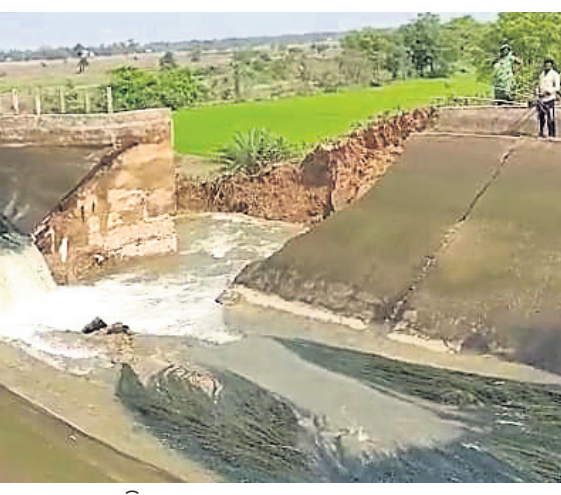
ମୁଖ୍ୟ କେନାଲରେ ସୃଷ୍ଟି ହୋଇଥିବା ଘାଟ ।