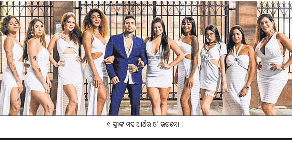
୯ ସ୍ତ୍ରୀଙ୍କ ସହ ଆର୍ଥିକ ଓ ଭରସା ।

ନକର ନିଜ ଉପରୁ ହଟାଇବା ପାଇଁ ରୁଷିଆ ଏକ ଘାତ ପ୍ରସ୍ତୁତ କରିଥିବା ଏବିଏସ୍ ପକ୍ଷରୁ ଏକ ରୁଜ୍ଞତା କରାଯାଇଛି। ସେପଟେ ପୂର୍ବ ମୁକ୍ତେନ୍ଦ୍ରଙ୍କୁ ରୁଷିଆ ଚାର୍ଜେଜ୍ କରିଥିବାବେଳେ ତୋନ୍‌ସାସ୍ ଅଞ୍ଚଳକୁ ଏହା ସମ୍ପୂର୍ଣ୍ଣ କବ୍‌ଜା କରିବାକୁ ଲକ୍ଷ୍ୟ ରଖୁଥିବା ନାଟୋ ମହାସଚିବ ଜେମ୍ ସ୍ଟେଲେନବର୍ଗ କହିଛନ୍ତି।