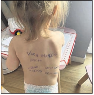
କିଛି: ଗତ ୪୨ ଦିନ ହେଲାଣି ରୁଷିଆ ଏବଂ ୟୁକ୍ରେନ୍ ମଧ୍ୟରେ ୟୁକ୍ ପରିସ୍ଥିତି ଲାଗି ରହିଛି । ଇତି ମଧ୍ୟରେ ଏକ ବୃଦ୍ଧ ଚାହିଦା ଦୃଶ୍ୟ ସାମ୍ନାକୁ ଆସିଛି । ସେଥିରେ ଜଣେ ମା' ତା' ଛୋଟ ଶିଶୁ ପିଠିରେ ଘରର ଠିକଣା ଲେଖିଛନ୍ତି । ଏହି ଫଟୋ ଏବେ ସୋସିଆଲ୍ ମିଡିଆରେ ଭାଇରାଲ୍ ହେବାରେ ଲାଗିଛି । ୟୁକ୍ ସୋସିଆଲ୍ ମିଡିଆରେ ସେହି ମା' ଜଣକ ଏତେ ଭୟଭୀତ ହୋଇପଡ଼ିଛନ୍ତି ଯେ ସେ ତାଙ୍କ ଶିଶୁ ପିଠିରେ ଘରର ଠିକଣା, ଫୋନ୍ ନମ୍ବର ଏବଂ ଅନ୍ୟାନ୍ୟ ତଥ୍ୟ ଲେଖିଛନ୍ତି । ସେ ଏପରି ଭାବନ୍ତି ଯେ, ଯଦି ତାଙ୍କର କିଛି ହୋଇଯାଏ ତେବେ ତାଙ୍କ ଶିଶୁ କେହି ଜଣେ ଆପଣେଇ ନେବେ ।