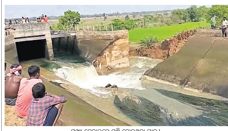
ମୁଖ୍ୟ କେନାଲରେ ସୃଷ୍ଟି ହୋଇଥିବା ଘାଟ।