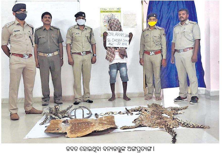
ଜବତ ହୋଇଥିବା ବନ୍ୟଜନ୍ତୁଙ୍କ ଅଜ୍ଞପ୍ରତ୍ୟଙ୍ଗ।