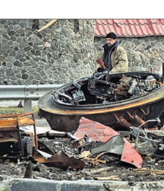
ନଷ୍ଟ ହୋଇଯାଇଥିବା ରୁଷିଆ ଗ୍ୟାସ୍ ନିକଟରେ ଜଣେ ୟୁକ୍ରେନ୍ ସୈନ୍ୟ ।

ରୁଷିଆର ୟୁକ୍ରେନ୍ ଆକ୍ରମଣକୁ ୪୧ ଦିନ ପୂରିଥିବାବେଳେ ରୁଷୀ ଗଣତନ୍ତ୍ରକୁ ନେଇ ଯାହା ବିଷ୍ଣୁରେ ଉଦ୍‌ବେଗ ପ୍ରକାଶ ପାଇଛି। ରୁଷିଆ ଗଣତନ୍ତ୍ରକୁ ପୁନି ନିଜ ଅପରାଧ କରିଥିବା କହି ୟୁକ୍ରେନ୍