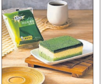
ତିଆରି କରାଯାଇଛି । ଏହାଛଡ଼ା କେକ୍ ଖଞ୍ଜ ଭଳି ଖୁବ୍ ନରମ ହୋଇଛି । କିନ୍ତୁ ଅତି ପାଖରୁ ଦେଖିଲେ ଜାଣିହେବ ଯେ ତାହା ଏକ କେକ୍ । ତାହାଫର୍ ରେଷ୍ଟୋରାଣ୍ଟରେ ଏହି କେକ୍‌ର ଚାହିଦା ଅଧିକ । ସେଥିପାଇଁ ଏହା ଚଢ଼ା ଦରରେ ବି ବିକ୍ରି ହେଉଛି । ପ୍ରଥମେ ଦେଖିବୁକ୍ରେ ଏହାର ଭିଲ୍‌ଆଲ୍‌କୁ ଶେୟାର କରାଯାଇଥିଲା ଓ ଏବେ ଏହାକୁ ନେଇ ଲୋକେ ଖୁବ୍ କମେଣ୍ଟ୍ କରୁଛନ୍ତି । ବିଶେଷକରି କେକ୍ ତିଆରି କରିବାର ସ୍ୱତନ୍ତ୍ର କଳାକୁ ସମସ୍ତେ ପ୍ରଶଂସା କରିଛନ୍ତି ।

ନୂଆଦିଲ୍ଲୀ: ବାସନମଜା ପାଇଁ ଥିବା ଖଞ୍ଜକୁ ବି ଖାଇହେବ! ଏଭଳି କଥା ଶୁଣି କେହି ହୁଏତ ବିଶ୍ୱାସ କରି ନ ପାରନ୍ତି । କିନ୍ତୁ ଏମିତି ଏକ ଭିଲ୍‌ଆଲ୍ ଏବେ ଦେଖିବାକୁ ମିଳୁଛି ସୋସିଆଲ୍ ମିଡିଆରେ । ବାସନମଜା ଖଞ୍ଜ ଭଳି ଦେଖାଯାଉଥିଲେ ବି ପ୍ରକୃତରେ ତାହା ଏକ କେକ୍ । ଦେଖିବାକୁ ଅବିକଳ ବାସନ ମାଜିକା ଖଞ୍ଜ ଭଳି । କିନ୍ତୁ ତାହା ବାସନମଜା ନୁହେଁ ବରଂ ଏକ କେକ୍ । କେକ୍ କଫି ସହ ଏହି କେକ୍ ଖାଇବା ପାଇଁ ଲୋକଙ୍କର ଖୁବ୍ ଆଗ୍ରହ । ସେଥିପାଇଁ ଏହାର ବେଶ୍ ଚାହିଦା ଅଛି । ସୋସିଆଲ୍ ମିଡିଆରେ ଶେୟାର କରାଯାଇଥିବା ଫଟୋ ଓ ସୁତନା ଅନୁସାରେ ଏମିତି କେକ୍ ତିଆରି କରାଯାଇଛି ତାହାଫର୍ ଏକ ରେଷ୍ଟୋରାଣ୍ଟରେ । କେକ୍ଟି ଏତେ ସୁନ୍ଦରଭାବେ ତିଆରି କରାଯାଇଛି ଓ ସେକେହି ବି ପ୍ରଥମେ ଦେଖିଲେ ଏକ ବାସନମଜା ବୋଲି ମନେକରିବେ । କାରଣ ଠିକ୍ ବାସନମଜା ଭଳି ତିନୋଟି ଭିନ୍ନ ଭିନ୍ନ ରଙ୍ଗରେ ଏହାକୁ