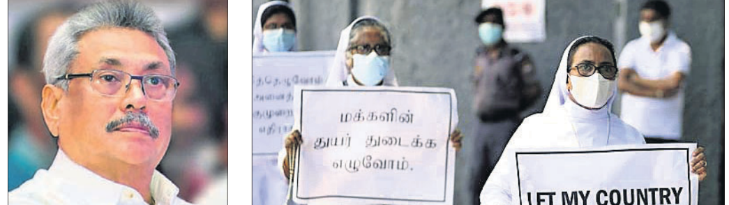
୪୨ ଏମ୍ପାଇ ଇମ୍ରାନ ପରେ ସରକାର ସଂଖ୍ୟାଲଘୁ

ଗ୍ରୀଲଙ୍କାର କ୍ୟାଥୋଲିକ୍ ନନ୍ ଆନ୍ଦୋଳନକୁ ଓହ୍ଲାଇଛନ୍ତି ବିରୋଧରେ ନାଗରିକଙ୍କ ବିକ୍ଷୋଭକୁ