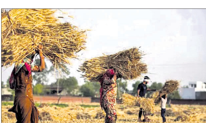
ଭାବରେ ବିଶ୍ୱର ଶସ୍ୟ ବ୍ୟବସାୟରେ ଏକଚତୁର୍ଥାଂଶ ଅଂଶଦାର । ୟୁକ୍ ପୂର୍ବରୁ କୃଷିଯାଗର ବନ୍ଦର ପର୍ଯ୍ୟନ୍ତ ଶସ୍ୟକୁ ପହଞ୍ଚାଇବା ପାଇଁ ରେକ ମାର୍ଗରେ ଏବଂ ପୋଲାଣ୍ଡ ରେକପଥ ଦେଇ ଦିନି ଓଡେସା ଏବଂ ମାଲ୍ଦୋଭାକୁ ପର୍ଯ୍ୟନ୍ତ ପହଞ୍ଚାଇଥିଲା । ସେଠାରୁ ଏସିଆ ଏବଂ ୟୁରୋପର ବିଭିନ୍ନ ସ୍ଥାନକୁ ଏହି ଶସ୍ୟ ପରିବହନ ହେଉଥିଲା । ତେବେ ବର୍ତ୍ତମାନ ବନ୍ଦର ବନ୍ଦ ରହିଥିବାରୁ ରୋମାନିଆ ଏବଂ ପୋଲାଣ୍ଡ ରେକପଥ ଦେଇ ଦିନି ପରିମାଣରେ ମକା ପଶୁମ ଦେଶକୁ ପହଞ୍ଚାଇଥିଲା । ତେବେ ଏହି ପ୍ରକ୍ରିୟା ବହୁ

ନୂଆଦିଲ୍ଲୀ, ୫୫୪ ବୈଶ୍ୱିକ ବଜାରକୁ ଖାଦ୍ୟଶସ୍ୟର ଆବଶ୍ୟକତା ଥିବା ବେଳେ ୟୁକ୍ରେନ୍‌ର ଚାଷ କ୍ଷେତ୍ରକୁ ଅମଳ ହୋଇଥିବା ୧୫ ମିଲିୟନ ଟନ୍ ମକା ସିଲୋ (ଶସ୍ୟ ଷ୍ଟୋର୍)ରେ ପଡ଼ିବାର ହିସାବ ଅମଳ ହୋଇଥିବା ମକାର ପରିମାଣର ଅର୍ଦ୍ଧାଧିକ ବିଭିନ୍ନ ଦେଶକୁ ରପ୍ତାନି ହେବାର ଯୋଜନା ରହିଥିବା ବେଳେ ବର୍ତ୍ତମାନ ଏହା କ୍ରେଡ଼ିଟ୍ ନିକଟରେ ପହଞ୍ଚିବା କଷ୍ଟସାଧ୍ୟ ହୋଇପଡ଼ିଛି । ଫଳରେ ଏହି ୟୁକ୍ ମଧ୍ୟରେ ୧୨୦ ବିଲିୟନ ଡଲାରର ଶସ୍ୟ ରପ୍ତାନି ବନ୍ଦ ପଡ଼ିଛି । ଯୋଗାଣରେ ବାଧା, ଆକାଶକ୍ଷୁଆଁ ମାଲ୍ ପରିବହନ ବନ୍ଦ ଏବଂ ବର୍ତ୍ତମାନର ପରିସ୍ଥିତି ବଜାରରେ ଉତ୍ତେଜନା ସୃଷ୍ଟି କରୁଛି । ରୁଷିଆ ଏବଂ ୟୁକ୍ରେନ୍‌ର ଶସ୍ୟ ତେଲିଭରି ମିଳିତ ଭାବରେ ବିଶ୍ୱର ଶସ୍ୟ ବ୍ୟବସାୟରେ ଏକଚତୁର୍ଥାଂଶ ଅଂଶଦାର । ୟୁକ୍ ପୂର୍ବରୁ କୃଷିଯାଗର ବନ୍ଦର ପର୍ଯ୍ୟନ୍ତ ଶସ୍ୟକୁ ପହଞ୍ଚାଇବା ପାଇଁ ରେକ୍ ମାର୍ଗରେ ଏବଂ ପୋଲାଣ୍ଡ ରେକପଥ ଦେଇ ଦିନି ଓଡେସା ଏବଂ ମାଲ୍ଦୋଭାକୁ ପର୍ଯ୍ୟନ୍ତ ପହଞ୍ଚାଇଥିଲା । ସେଠାରୁ ଏସିଆ ଏବଂ ୟୁରୋପର ବିଭିନ୍ନ ସ୍ଥାନକୁ ଏହି ଶସ୍ୟ ପରିବହନ ହେଉଥିଲା । ତେବେ ବର୍ତ୍ତମାନ ବନ୍ଦର ବନ୍ଦ ରହିଥିବାରୁ ରୋମାନିଆ ଏବଂ ପୋଲାଣ୍ଡ ରେକପଥ ଦେଇ ଦିନି ପରିମାଣରେ ମକା ପଶୁମ ଦେଶକୁ ପହଞ୍ଚାଇଥିଲା । ତେବେ ଏହି ପ୍ରକ୍ରିୟା ବହୁ