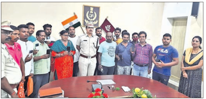
ଏସ୍ପିକ ସହ ନିଜ ମୋବାଇଲ ଫେରିପାଇଥିବା ବ୍ୟକ୍ତି ଓ ମହିଳାମାନେ।