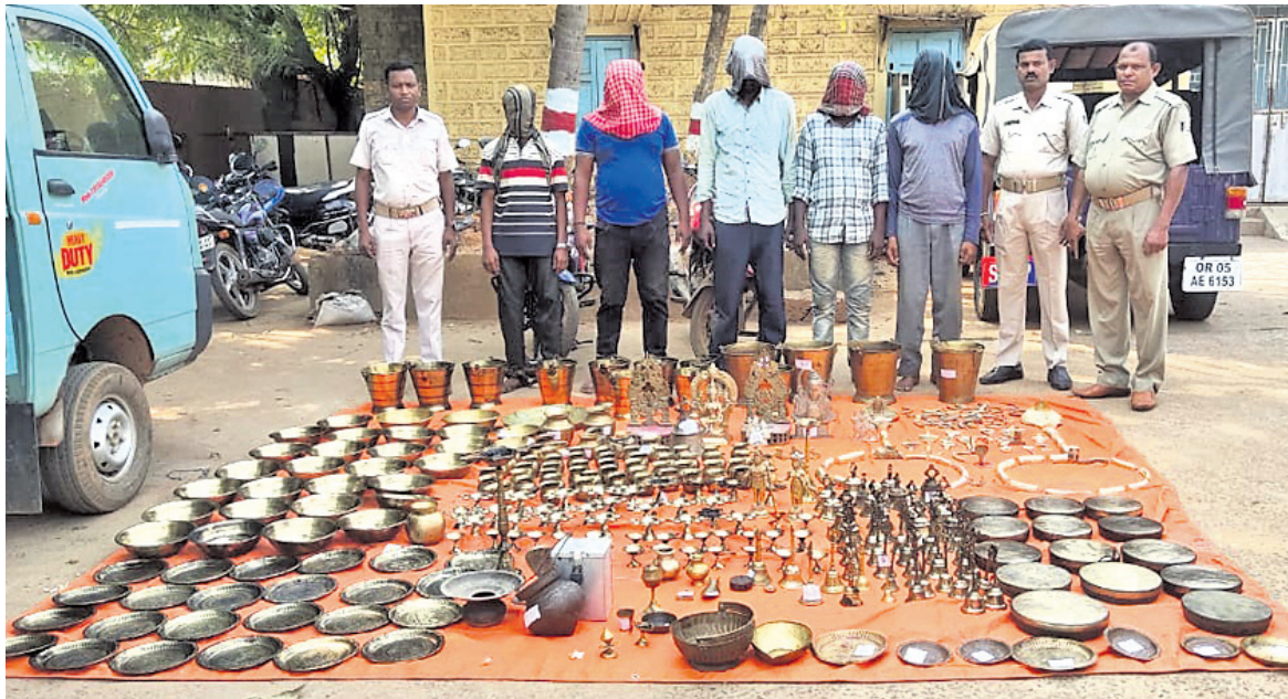
ଗିରଫ ୫ ଅଭିଯୁକ୍ତ, ଜବତ ହୋଇଥିବା ମୂର୍ତ୍ତି ଓ ସମଗ୍ରା।

ଅବଧୂ ବଢ଼ିଲା ଭୁବନେଶ୍ୱର, ୫/୪(ସ୍ୱା.ସେ.): ୨୦୨୧-୨୨ ବର୍ଷ ପାଇଁ ସମସ୍ତ ବର୍ଗର ଛାତ୍ରବୃତ୍ତି ଆବେଦନ ଅବଧୂ ବଢ଼ାଇ ଦିଆଯାଇଛି।