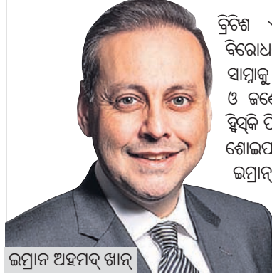
ଇମ୍ରାନ ଅହମଦ୍ ଖାନ

କ୍ରିକିଟ୍ ଏମ୍ପାଇ ଇମ୍ରାନ ଅହମଦ୍ ଖାନଙ୍କ ବିରୋଧରେ ଯୌନ ନିର୍ଯାତନା ଅଭିଯୋଗ ସାମ୍ନାକୁ ଆସିଛି।