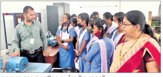
ଛାତ୍ରୀମାନେ ନୂତନ ଜ୍ଞାନକୌଶଳ ସମ୍ପର୍କରେ ଶିକ୍ଷା ନେଉଛନ୍ତି।

ବିକ୍ଷଳ ବିଭାଗ କନିଷ୍ଠ ସମ୍ପ୍ରାଣୀ ଧନସ୍ୱପ୍ନ ବେହେରା ଦାବିପତ୍ର ଗ୍ରହଣ କରୁଛନ୍ତି। ଏବଂ ସାହିତ୍ୟ କ୍ଷେତ୍ର ଥିବା ଗ୍ରାହ୍ୟକର୍ମରେ ଭାଗ ନେବା ଉପରେ ଆଗ୍ରହ ଥିବାରୁ ତାଙ୍କୁ ଉପସ୍ଥିତ ରଖିବାକୁ କୁଳ କୁଳ କରାଯାଇଛି। ସେହିଭଳି