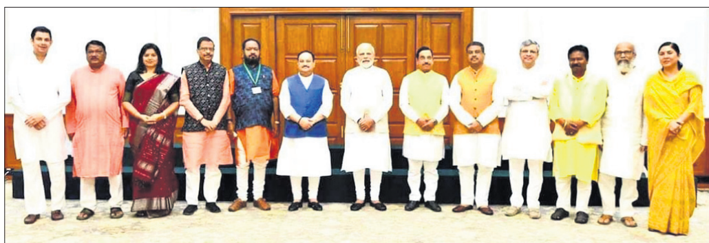
ନୂଆଦିଲ୍ଲୀଠାରେ ଗୁରୁବାର ପ୍ରଧାନମନ୍ତ୍ରୀ ନରେନ୍ଦ୍ର ମୋଦି ଏବଂ ଅନ୍ୟ କେନ୍ଦ୍ରୀୟ ନେତାଙ୍କ ସହ ଓଡ଼ିଶାର ଭାଜପା ଏମ୍ପି।