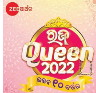
ଫୋଟୋ: ଉତ୍ସବ ୧୦ ବର୍ଷର

ଭୁବନେଶ୍ଵର, ୭/୪: ଓଡ଼ିଶାର ଲୋକପ୍ରିୟ ମନୋରଞ୍ଜନଭିତ୍ତିକ ଟ୍ୟାଲେଣ୍ଟ ଜୀ ସାର୍ଥକ ପ୍ରତିଯୋଗିତା ଆସିଛି। ପ୍ରତିଯୋଗିତା ପ୍ରଦର୍ଶନର ବଡ଼ ପ୍ଲାଟଫର୍ମ ରଜ କୁଇନ ୨୦୨୨-ଉତ୍ସବ ୧୦ବର୍ଷର।