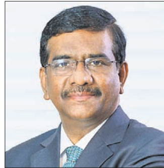
ୟୁନିୟନ୍ ବ୍ୟାଙ୍କ ମ୍ୟାନେଜିଂ ଡାଇରେକ୍ଟର ଏବଂ ସିଇଓ ରାଜକିରଣ ରାୟ

ନୂଆଦିଲ୍ଲୀ, ୭/୪: ୫୦,୦୦୦ କୋଟି ଟଙ୍କାର ବ୍ୟାଡ଼୍ ଲୋନ୍କୁ ନ୍ୟାଶନାଲ ଆସେଟ୍ ରିକନଷ୍ଟ୍ରକ୍ସନ କୋର୍ଟ (ଏନ୍ଏଆର୍ଏସିଏ)କୁ ସ୍ଥାନାନ୍ତର ପାଇଁ ଦେଶର ବ୍ୟାଙ୍କଗୁଡ଼ିକ ପାଇଁ ଷ୍ଟେଟ୍ ବ୍ୟାଙ୍କ ଅଫ୍ ଇଣ୍ଡିଆ (ଏସ୍ଟିଆଇ) ଦ୍ଵାରା ଧାର୍ଯ୍ୟ ହୋଇଥିବା ଦିନ ଅତିକ୍ରମ କରିଯାଇଛି।