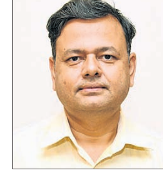
ସୁଗଳ କିଶୋର କୋଷା

ନୂଆଦିଲ୍ଲୀ, ୭/୪: ବରିଷ୍ଠ ପ୍ରଶାସକ ସୁଗଳ କିଶୋର କୋଷାକୁ ନୂତନ ଦାୟିତ୍ଵ ପ୍ରଦାନ କରାଯାଇଛି। ପୂର୍ବତନ ରେଳପଥର ରେଳବାଇ ସୁରକ୍ଷା ବଳ (ଆର୍ପିଏସ୍)ର ନୂତନ ପ୍ରମୁଖ ନିରାପଦ ଆୟୁକ୍ତ ଭାବେ କୋଷା ଇତିମଧ୍ୟରେ ଯୋଗଦାନ କରିଛନ୍ତି।