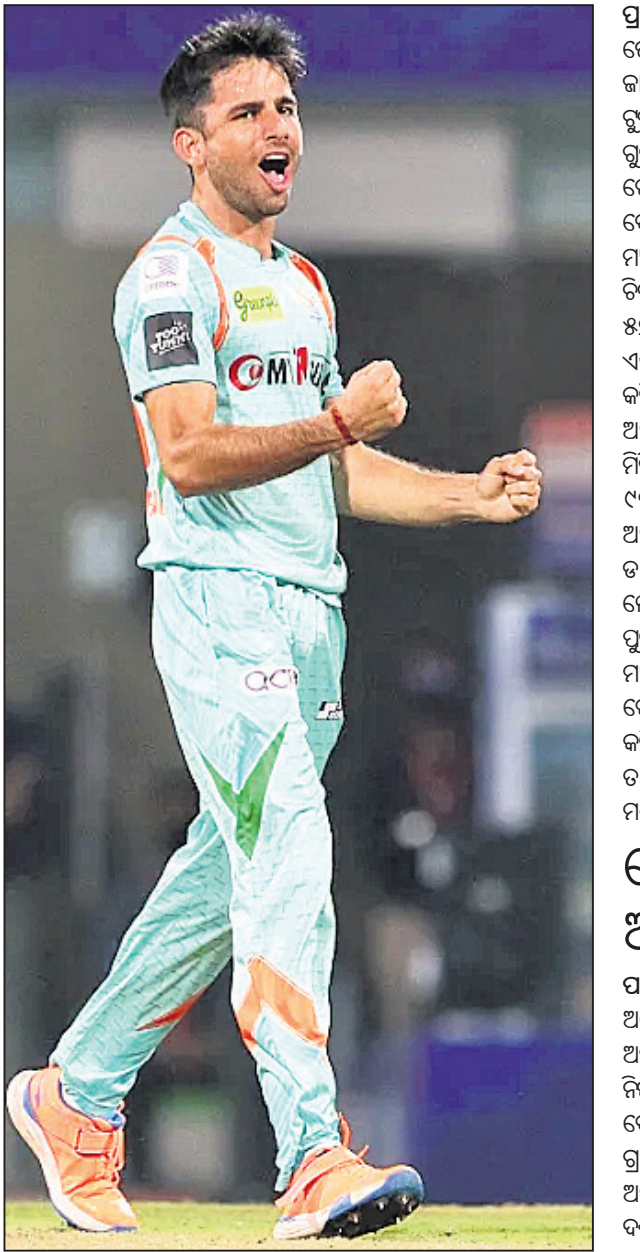
ଉଇକେଟ ନେବାପରେ ରବି ବିଶ୍ଵୋଇକ ପ୍ରତିନିଧି ।

ସ୍ଥାନୀୟ ଡି.ଡ଼ି.ଏଲ. ପାଟିଲ ଷ୍ଟାଡ଼ିୟମରେ ଗୁରୁବାର ଅନୁଷ୍ଠିତ ଲକ୍ଷ୍ମୀ ଆନ ପ୍ରିମିୟର ଲିଗ୍ (ଆଇପିଏଲ) ମ୍ୟାଚରେ ଲକ୍ଷ୍ମୀ ସୁପର ଜିଆଣ୍ଟ ୬ ଉଇକେଟରେ ଦିଲ୍ଲୀ କ୍ୟାପିଟାଲ୍‌କୁ ପରାସ୍ତ କରିଛନ୍ତି । ଦିଲ୍ଲୀ କ୍ୟାପିଟାଲ୍ ୨୦ ଓଭରରେ ୩ ଉଇକେଟ ହରାଇ ୧୪୯ ରନ କରିଥିଲା । କର୍ବାବରେ ଲକ୍ଷ୍ମୀ ସୁପରଜିଆଣ୍ଟ ୧୯.୪ ଓଭରରେ ୪ ଉଇକେଟ ହରାଇ ୧୫୫ ରନ ସଂଗ୍ରହ କରି ନେଇଥିଲା । ବିଜୟୀ ଦଳ ପକ୍ଷରୁ କ୍ୱିଣ୍ଟନ ଡି'କକ୍ ସର୍ବାଧିକ ୮୦ (୫୨ ବଲ୍, ୯ ଚୌକା, ୨ ଛକା) ରନ କରିଥିଲେ । ଦିଲ୍ଲୀ ପକ୍ଷରୁ କୁଲଦୀପ ଯାଦବ ୨ଟି ଏବଂ ଲଳିତ ଯାଦବ ଓ ଶାହୁଲ୍ ଠାକୁର ଗୋଟିଏ ଲେଖାଏ ଉଇକେଟ ନେଇଥିଲେ । ଲକ୍ଷ୍ମୀ ଦଳ ୪ ମ୍ୟାଚରୁ ଜୁମାରାତ ୩ ବିଜୟ ସହ ଚେଷ୍ଟିକର ଦ୍ୱିତୀୟ ସ୍ଥାନକୁ ଉନ୍ନତ ହୋଇଛି । ଅନ୍ୟପକ୍ଷରେ ଦିଲ୍ଲୀ କ୍ୟାପିଟାଲ୍ ୩ ମ୍ୟାଚରୁ ୨ୟ ପରାଜୟ ସହ ୨ମ ସ୍ଥାନକୁ ଖସିଛି । ଲକ୍ଷ୍ମୀ ଦଳର ଅଧିନାୟକ ଲୋକେଶ୍ ରାହୁଲ ଚପ୍ ଜିତି ପ୍ରଥମେ ଫିଲ୍ଡିଂ ନିଷ୍ପତ୍ତି ନେଇଥିଲେ । ପୁଥୀ ଶି'କ ବିଶୋଭକ ବ୍ୟାଟିଂ ଯୋଗୁ ପ୍ରାରମ୍ଭିକ ପର୍ଯ୍ୟାୟରେ ଦିଲ୍ଲୀ ରନ୍ ହାରରେ ପ୍ରଭାବ ପଡ଼ି ନ ଥିଲା । ପାଞ୍ଜର ଯେ ୬ ଓଭରରେ ଦିଲ୍ଲୀ କୌଣସି ଉଇକେଟ ନ ହରାଇ ୫୨ ରନ ସଂଗ୍ରହ କରିଥିଲା । ୮ମ ଓଭରରେ ଦ୍ୱିତୀୟ ବଲ୍‌ରେ ପୁଥୀଙ୍କୁ କ୍ୱିଣ୍ଟନ ଡି'କକ୍ ହାତରେ କ୍ୟାଚ କରାଇ କ୍ରିଷ୍ଣାସା ଗୋଥାମ ପ୍ୟାଭିଲିୟନ ଫେରାଇବାପରେ ମ୍ୟାଚର ମୋଡ୍ ବଦଳିଥିଲା । ପୁଥୀ ୩୪ ବଲ୍‌ରୁ ୯ ଚୌକା ଓ ୨ ଛକା ସହାୟତାରେ ୬୧ ରନ କରିଥିଲେ । ମାତ୍ର ତାଙ୍କ ବିଦାୟ ପରେ ଦିଲ୍ଲୀ ବ୍ୟାଟରମାନେ ରନ୍ ପାଇଁ ସଂଘର୍ଷ କରିଥିଲେ । ତେଜିତ ଫ୍ଲାନର୍ ମାତ୍ର ୪ ଓ ଷ୍ଟେସିଭିକ୍‌ସର ରୋଜମାନ ପାଡ୍‌ଡେଲ ୩ ରନକରି ଆଉଟ ହୋଇଥିଲେ । ଅଧିନାୟକ ରିଷଭ ପଡ୍ ଓ ଫର୍ମରେ ଥିବା ସର୍ପିଭାକ