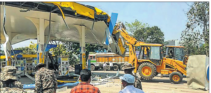
ବେଆଇନ ଭାବେ ନିର୍ମିତ ହୋଇଥିବା ଦଶାନ୍ତର ବରୋଲି ଉନ୍ନୟନ କର୍ମସୂତ୍ର ଗୁଣ୍ଡାଗଡ଼ରେ ସହାୟତାରେ ଏହାକୁ ଭାଙ୍ଗିଦେଇଛନ୍ତି।