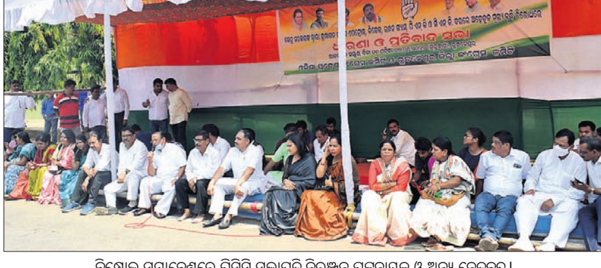
ବିକ୍ଷୋଭ ସମାବେଶରେ ପିପିସି ସଭାପତି ନିରଞ୍ଜନ ପଟ୍ଟନାୟକ ଓ ଅନ୍ୟ ନେତୃବୃନ୍ଦ।