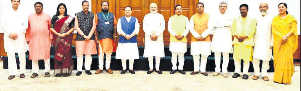
ନୂଆଦିଲ୍ଲୀଠାରେ ଗୁରୁବାର ପ୍ରଧାନମନ୍ତ୍ରୀ ନରେନ୍ଦ୍ର ମୋଦି ଏବଂ ଅନ୍ୟ କେନ୍ଦ୍ରୀୟ ନେତାଙ୍କ ସହ ଓଡ଼ିଶାର ଭାଜପା ଏମ୍ପି।