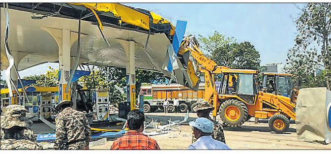
ବେଆଇନ ଭାବେ ନିର୍ମିତ ହୋଇଥିବା ଦର୍ଶାଇ ବରୋଲି ଉନ୍ନୟନ କର୍ତ୍ତୃପକ୍ଷ କ୍ଲିନିକାଲର ସହାୟତାରେ ଏହାକୁ ଭାଙ୍ଗିଦେଇଛନ୍ତି। ଏନେଇ ପୂର୍ବରୁ ବିଧାୟକଙ୍କ ପାଖକୁ