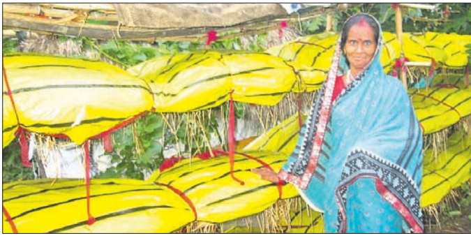
ରାଜନଗର ବୁକ ପଦନା ଗାଁର ଏକ ଛତୁ ପାର୍ଟି।

ପରିବାର ଭରଣପୋଷଣ ଏକ ସମସ୍ୟା ହେଲା। ଏହି ସମୟରେ ଓଡ଼ିଶା ଜାତିକା ମିଶନ ଅଧୀନରେ ସ୍ୱୟଂ ସହାୟକ ଗୋଷ୍ଠୀ ଗଠନ କରି ଛତୁଗାଠ ପାଇଁ ପ୍ରୋତ୍ସାହନ ଦିଆଯାଇଛି।