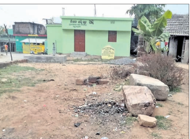
ନିର୍ମାଣ ହୋଇଥିବା ମିଶନ ଶକ୍ତି ଗୃହ ।

ନୟାଗଡ଼ ଜିଲ୍ଲା ଭାପୁର ବ୍ଲକ୍ ଶାସନ ପଞ୍ଚାୟତରେ ଦେବୋତ୍ତର ଜମିରେ ମିଶନ ଶକ୍ତି ଗୃହ ନିର୍ମାଣକୁ ନେଇ ଗ୍ରାମବାସୀ ଜିଲ୍ଲାପାଳ, ଦେବୋତ୍ତର କମିଶନର ଓ ବିଡିଓଙ୍କୁ ଲିଖିତ ଅଭିଯୋଗ କରିଛନ୍ତି ।