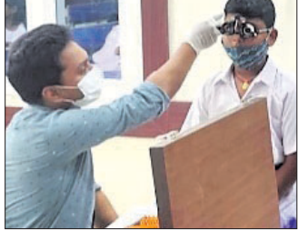
ପାରାଦୀପ, ୭/୪ (ସ.ପ୍ର.): ପାରାଦୀପର ଏକାଧିକ ସ୍ତରରେ ଜେଏସ୍‌ଡବ୍ଲ୍ୟୁ ଫାଉଣ୍ଡେସନ ପକ୍ଷରୁ ଚକ୍ଷୁ ଚିକିତ୍ସା ଶିବିର ଗୁରୁବାର ହୋଇଯାଇଛି।

ପାରାଦୀପ, ୭/୪ (ସ.ପ୍ର.): ପାରାଦୀପର ଏକାଧିକ ସ୍ତରରେ ଜେଏସ୍‌ଡବ୍ଲ୍ୟୁ ଫାଉଣ୍ଡେସନ ପକ୍ଷରୁ ଚକ୍ଷୁ ଚିକିତ୍ସା ଶିବିର ଗୁରୁବାର ହୋଇଯାଇଛି। ମଧୁରନୟ ଏବଂ ସିଧାସଳଖ, ବାଳିକା ହାର୍ଡସ୍କୁଲର ୩୨୬ ଛାତ୍ରଛାତ୍ରୀଙ୍କୁ ମାଗଣା ପରୀକ୍ଷା, ଚିକିତ୍ସା ଓ ଚକ୍ଷୁ ଦିଆଯାଇଛି।