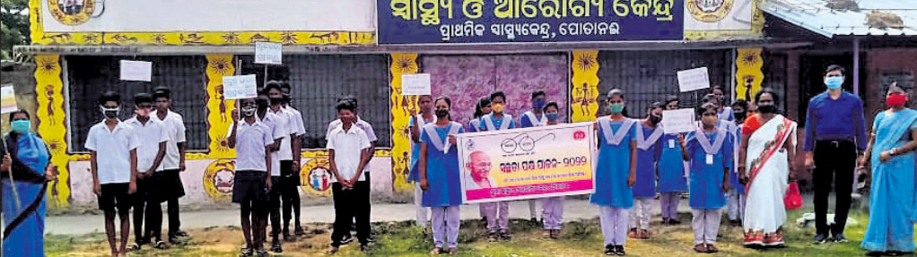
ପୋତାନଇ ପ୍ରାଥମିକ ସ୍ୱାସ୍ଥ୍ୟକେନ୍ଦ୍ର ପକ୍ଷରୁ ବାହାରିଥିବା ଶୋଭାଯାତ୍ରା।