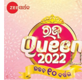
ଫୋଟୋ: ଉତ୍ସବ ୧୦ ବର୍ଷର

ଭୁବନେଶ୍ୱର, ୭/୪: ଓଡ଼ିଶାର ଲୋକପ୍ରିୟ ମନୋରଞ୍ଜନଭିତ୍ତିକ ଟ୍ୟାଲେଣ୍ଟ ଜୀ ସାର୍ଥକ ପୁଣିଥରେ ନେଇ ଆସିଛି ପ୍ରତିଭା ପ୍ରଦର୍ଶନର ବଡ଼ ପ୍ଲାଟଫର୍ମ।