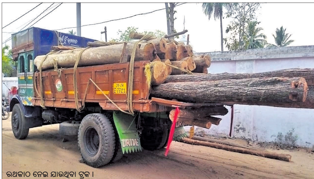
ରଥକାଠି ନେଇ ଯାଉଥିବା ଟ୍ରକ ।

ବିଶ୍ୱ ପ୍ରସିଦ୍ଧ ପୁରୀ ରଥଯାତ୍ରା ପାଇଁ ଗୁରୁବାର ନୟାଗଡ଼ ବନଖଣ୍ଡ ଦଶପଲ୍ଲା ବନାଞ୍ଚଳରୁ ତୃତୀୟ ପର୍ଯ୍ୟାୟରେ ୨୪ ଖଣ୍ଡ କାଠି କଟକ ସ ମିଳୁକ୍ତ ଚିରଫ ପାଇଁ ଯାଇଛି ।