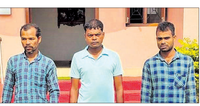
ବନ୍ୟଜନ୍ତୁ ମାଂସ ଜବତ ଘଟଣାରେ ଗିରଫ ୩ ଯୁବକ ।

ନୟାଗଡ଼ ବନଖଣ୍ଡ ମହାପୁର ବନାଞ୍ଚଳ ଅଧୀନ ମହିତମା ଅଞ୍ଚଳରୁ ମଙ୍ଗଳବାର ବନ୍ୟଜନ୍ତୁ ମାଂସ ଜବତ କରାଯାଇଛି । ଏହି ଘଟଣାରେ ୩ ଯୁବକଙ୍କୁ ଗିରଫ କରାଯାଇ ଗୁରୁବାର କୋର୍ଟଚାଲଣା କରାଯାଇଛି ।