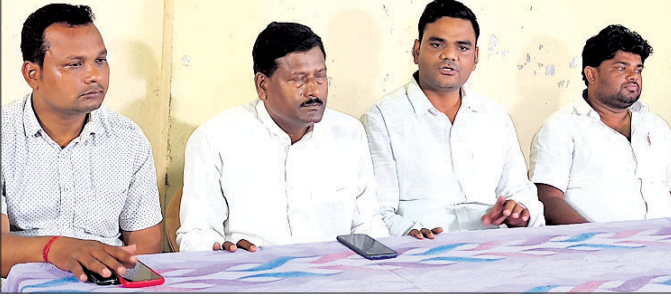
ଭାଜପା ପକ୍ଷରୁ ଅନୁଷ୍ଠିତ ଖବରଦାତା ସମିଳନୀ ଉପସ୍ଥିତ ନେତାମାନେ।