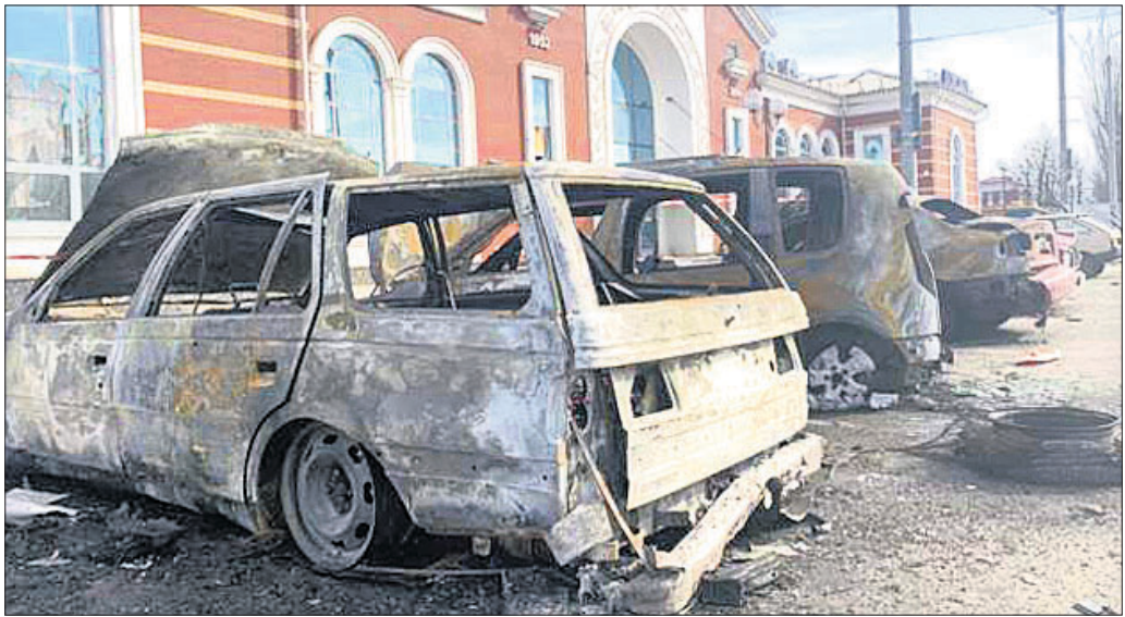
ଶୁକ୍ରବାର ପୂର୍ବ ସୁକ୍ରେନ୍ର ଜାମାଗୋର୍ଥୀ ରେଳ ଷ୍ଟେଶନରେ ରକେଟ୍ ମାଡ଼ ପ୍ରାଣ ବିଳକରେ ପଡ଼ିଥିବା ଦେଖିବାକୁ ମିଳିଥିଲା ।