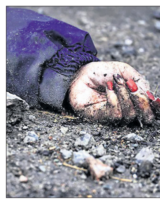
ସୁକ୍ରେନ୍ର କୁଟା ଗଣହତ୍ୟା ପରେ ଅନେକ ହୃଦୟବିଦାରକ ଛବି ସାମ୍ବାଦିଆରୁ ଲାଗିଛି ।

ଇସଲାମାବାଦ, ୮୪ : ନ୍ୟାଶନାଲ ଆସେମ୍ବ୍ଲି ଉପବାଚସ୍ପତି କାହିଁକି ସୁପ୍ରିମକୋର୍ଟର ରାୟକୁ ନେଇ ମର୍ମାହତ ହେବେ ।