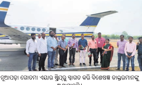
ନୂଆପଡ଼ା ଗୋଡ଼ା ଏଞ୍ଚି ପ୍ରସ୍ତୁତ ସ୍ଵାସ୍ଥ୍ୟ ସେବା କ୍ଷେତ୍ରରେ ଉନ୍ନତି ଆଣିବାକୁ ଉଦ୍ଦେଶ୍ୟରେ ଉଦ୍ଘାଟନ କରାଯାଇଛି।

କଳାହାଣ୍ଡି ପରେ ନୂଆପଡ଼ା ଜିଲ୍ଲାରେ ଉନ୍ନତ ସ୍ଵାସ୍ଥ୍ୟ ସେବା କାର୍ଯ୍ୟକ୍ରମ ଆରମ୍ଭ ହୋଇଛି। ଏହି ସେବା ପାଇଁ କଟକର ଉନ୍ନତ ସ୍ଵାସ୍ଥ୍ୟ ସେବା କାର୍ଯ୍ୟକ୍ରମରୁ ନୂଆପଡ଼ା ଗୋଡ଼ା ଏଞ୍ଚି ପ୍ରସ୍ତୁତ ସ୍ଵାସ୍ଥ୍ୟ ସେବା କ୍ଷେତ୍ରରେ ଉନ୍ନତି ଆଣିବାକୁ ଉଦ୍ଦେଶ୍ୟରେ ଉଦ୍ଘାଟନ କରାଯାଇଛି।