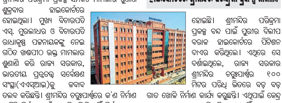
ହାଇକୋର୍ଟରେ ଶ୍ରୀମନ୍ଦିର ପରିକ୍ରମା ପ୍ରକଳ୍ପ ପାଇଁ ଜବାବ ତଲବ କରାଯାଇଛି।

ହାଇକୋର୍ଟରେ ଶ୍ରୀମନ୍ଦିର ପରିକ୍ରମା ପ୍ରକଳ୍ପ ପାଇଁ ଜବାବ ତଲବ କରାଯାଇଛି। ହାଇକୋର୍ଟରେ ଶ୍ରୀମନ୍ଦିର ପରିକ୍ରମା ପ୍ରକଳ୍ପ ପାଇଁ ଜବାବ ତଲବ କରାଯାଇଛି।