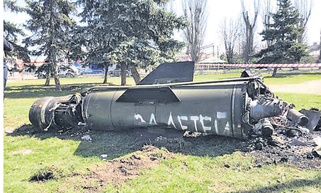
ସୁକ୍ରେନ୍ ଜାମାଗୋର୍ଥୀ ରେଳ ଷ୍ଟେଶନରେ ନିକ୍ଷେପ କରାଯାଇଥିବା ମିଶାଇଲର ଅବଶେଷ ।

ହେଗ, ୮୪ : ୧୯୯୦ର ବଲ୍‌କାନ୍ ସଂଘର୍ଷରୁ ପୂର୍ଣ୍ଣ ସୁରାକ୍ଷା ପ୍ରଦାନ ପାଇଁ ବିଶ୍ୱରାଜ୍ୟରେ ସୁକ୍ରେନ୍ ଯିବ ଫୋରେନସିକ୍ ଟିମ୍ ପଠାଯାଇଛି ।