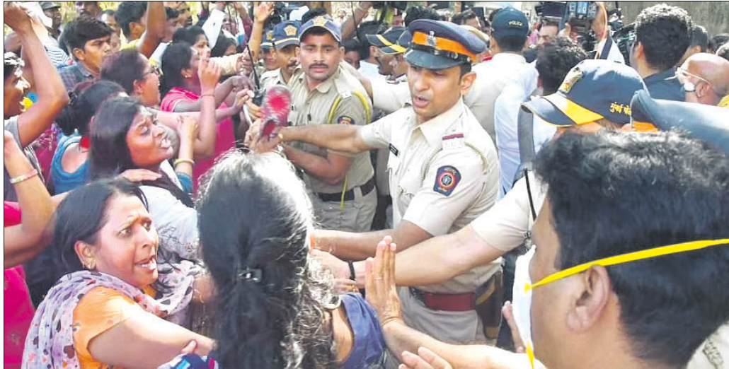
ଏନସିପି ଅଧ୍ୟକ୍ଷ ଶରଦ ପାଠ୍ୟପୁସ୍ତକ ଘର ଆଗରେ ଏମ୍ପାଏଆରସିଏ କର୍ମଚାରୀଙ୍କ ବିକ୍ଷୋଭ

ପୁସ୍ତକ, ୮୮୪ (ଆଇଏଏଏଏଏ) ମହାରାଷ୍ଟ୍ର ରାଜ୍ୟ ସଡ଼କ ପରିବହନ ନିଗମ (ଏମ୍ପାଏଆରସିଏ)ର ଆନ୍ଦୋଳନରତ