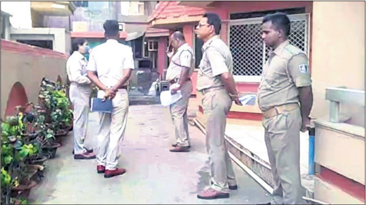
ପୁରୀରେ ହୋଟେଲରେ ହତ୍ୟା ପଡ଼ିଥିବା ପ୍ରତିପତ୍ତି ପ୍ରଦାନ କରାଯାଇଥିବା ଦେଖାଯାଉଛି।

ପୁରୀ ସହରର ଏକ ହୋଟେଲରେ ପୁରୀର ବନ୍ଦୀମାନଙ୍କୁ ହତ୍ୟା କରାଯାଇଥିବା ଅଭିଯୋଗ ହୋଇଛି। ଏ ନେଇ ପୋଲିସ ଆଇପିସି ଧାରା ୩୦୨ ଓ ୩୪ରେ ଏକ ମାମଲା (ନଂ. ୮୧/୨୨) ରୁଲ୍ କରି ଚଢ଼ିଆ ଆରମ୍ଭ କରିଛି।