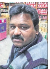
ପୁଲବାଣୀ ପୌର ପରିଷଦ ନିର୍ବାଚନରେ ଦଳ ବିରୋଧରେ କାମ ହେଉଥିଲା। ହେଲେ ଅଧିକ ପର୍ଯ୍ୟାୟରେ ବିଜେଡିରୁ ନିଲମ୍ବିତ ହେଲେ।

ପୁଲବାଣୀ ଅଫିସ, ୮୮୪: ପୁଲବାଣୀ ପୌର ପରିଷଦ ନିର୍ବାଚନରେ ଦଳ ବିରୋଧରେ କାମ ହେଉଥିଲା। ହେଲେ ଅଧିକ ପର୍ଯ୍ୟାୟରେ ବିଜେଡିରୁ ନିଲମ୍ବିତ ହେଲେ। ଏପରିକି ନିଜ ଖର୍ଚ୍ଚରେ ଦଳୀୟ କାର୍ଯ୍ୟକ୍ରମ ପ୍ରାଥୀଙ୍କୁ ସେ ଜିତାଇବାରେ ବି ସମର୍ଥନ ହୋଇ ନ ଥିଲେ। ଅପରପକ୍ଷେ ଏହି ପୌର ପରିଷଦ ନିର୍ବାଚନରେ ଦଳ ବିରୋଧୀ କାର୍ଯ୍ୟ କରିବା ଅଭିଯୋଗରେ ବିଜେଡିରୁ ନିଲମ୍ବିତ ହେଲେ।