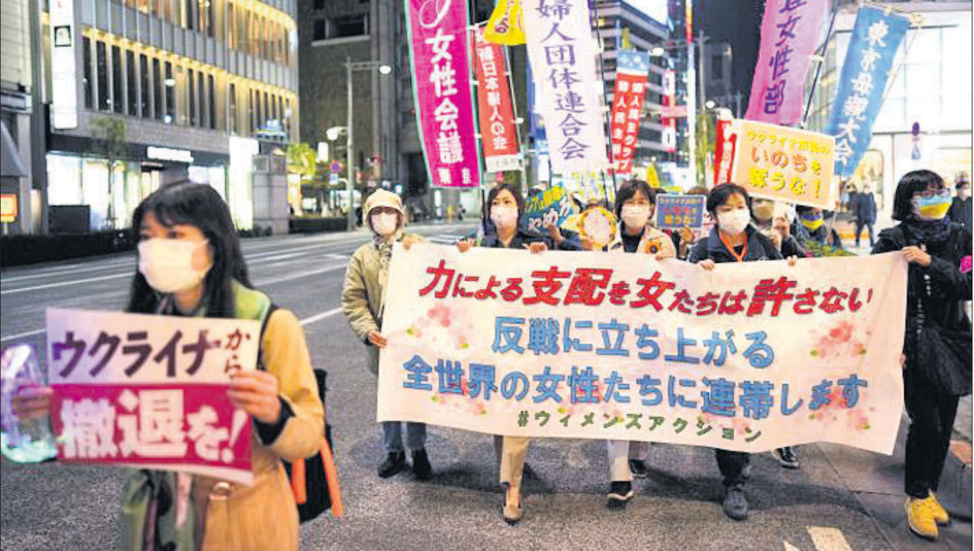
ରୁଷିଆର ସୁକ୍ରେନ୍ ଆକ୍ରମଣ ପ୍ରତିବାଦରେ ଟୋକିଓରେ ମହିଳାଙ୍କ ବିରୋଧ ।

ଲାହୋର, ୮୪: ୨୬/୧୧ ମୁସଲିମ ଆକ୍ରମଣର ମାଷ୍ଟରମାଇଣ୍ଡ ତଥା ନିଷିଦ୍ଧ ଯୋଗ୍ୟ ଡକ୍ଟର ହାଫିଜ୍ ସୟିଦଙ୍କୁ ୩୨ ବର୍ଷ ଜେଲ ଦଣ୍ଡର ସହିତ ମାମଲାରେ ୩୨ ବର୍ଷ ଜେଲ ଦଣ୍ଡ ଦିଆଯାଇଛି । ସେହିପରି ୩୨ ବର୍ଷ ଜେଲ ଦଣ୍ଡ ଦିଆଯାଇଛି । ସେହିପରି ୩୨ ବର୍ଷ ଜେଲ ଦଣ୍ଡ ଦିଆଯାଇଛି ।