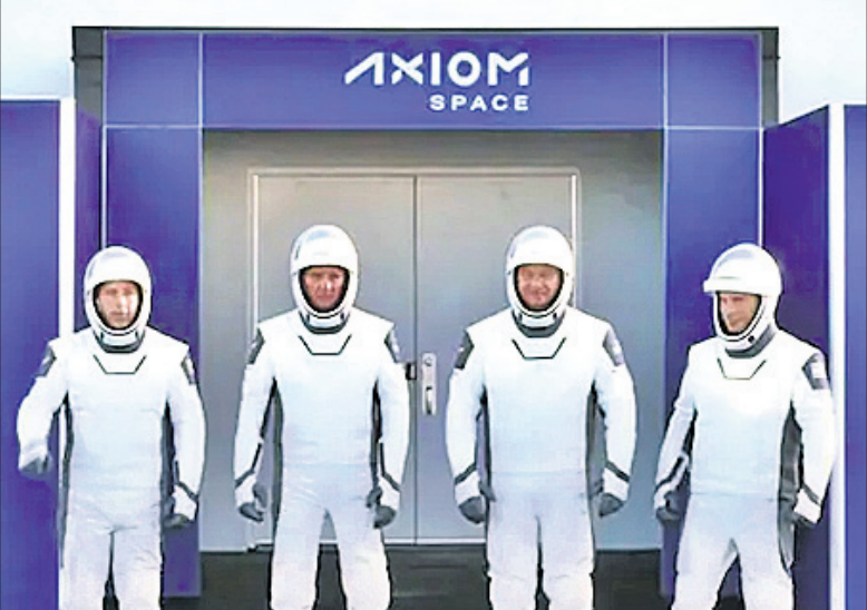
ମିଶନରେ ଯାଇଥିବା ୪ କ୍ରମ ମେୟର ।