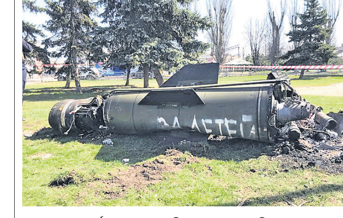
ମୁକ୍ତେନ୍ଦ୍ର ଜାମାଟୋଭ୍ ରେଳ ଷ୍ଟେଶନରେ ନିକ୍ଷେପ କରାଯାଇଥିବା ମିଶାଇଲର ଅବଶେଷ।

ହେଗ୍, ୮୪ ୧୯୯୦ର ବଲ୍‌କାନ୍ ସଂଘର୍ଷରୁ ସଂଗ୍ରହ କରାଯାଇଥିବା ମୁକ୍ତେନ୍ଦ୍ର ଯିବ ପୋରେନ୍‌ସିକ୍ ଟିମ୍ ଆସନ୍ତା ସପ୍ତାହରେ ମୁକ୍ତେନ୍ଦ୍ର ଗସ୍ତ କରି ନିଖୋଜ ନେଇ ରୁଷିଆର ମୁକ୍ତେନ୍ଦ୍ର ଆକ୍ରମଣ ପର୍ଯ୍ୟନ୍ତ ନିଖୋଜ ଓ ନିହତଙ୍କ ପରିଚୟ ଟିକ୍ସ ପାଇଁ ଏକ ଅନ୍ତର୍ଜାତୀୟ ସଂସ୍ଥା ଗଠନ କରାଯାଇଛି। ଏହି ସଂସ୍ଥାର ପୋରେନ୍‌ସିକ୍ ଟିମ୍ ଆସନ୍ତା ସପ୍ତାହରେ ମୁକ୍ତେନ୍ଦ୍ର ଗସ୍ତ କରି ନିଖୋଜ ନେଇ ରୁଷିଆର ମୁକ୍ତେନ୍ଦ୍ର ଆକ୍ରମଣ ପର୍ଯ୍ୟନ୍ତ ନିଖୋଜ ଓ ନିହତଙ୍କ ପରିଚୟ ଟିକ୍ସ ପାଇଁ ଏକ ଅନ୍ତର୍ଜାତୀୟ ସଂସ୍ଥା ଗଠନ କରାଯାଇଛି। ଏହି ସଂସ୍ଥାର ପୋରେନ୍‌ସିକ୍ ଟିମ୍ ଆସନ୍ତା ସପ୍ତାହରେ ମୁକ୍ତେନ୍ଦ୍ର ଗସ୍ତ କରି ନିଖୋଜ ନେଇ ରୁଷିଆର ମୁକ୍ତେନ୍ଦ୍ର ଆକ୍ରମଣ ପର୍ଯ୍ୟନ୍ତ ନିଖୋଜ ଓ ନିହତଙ୍କ ପରିଚୟ ଟିକ୍ସ ପାଇଁ ଏକ ଅନ୍ତର୍ଜାତୀୟ ସଂସ୍ଥା ଗଠନ କରାଯାଇଛି।