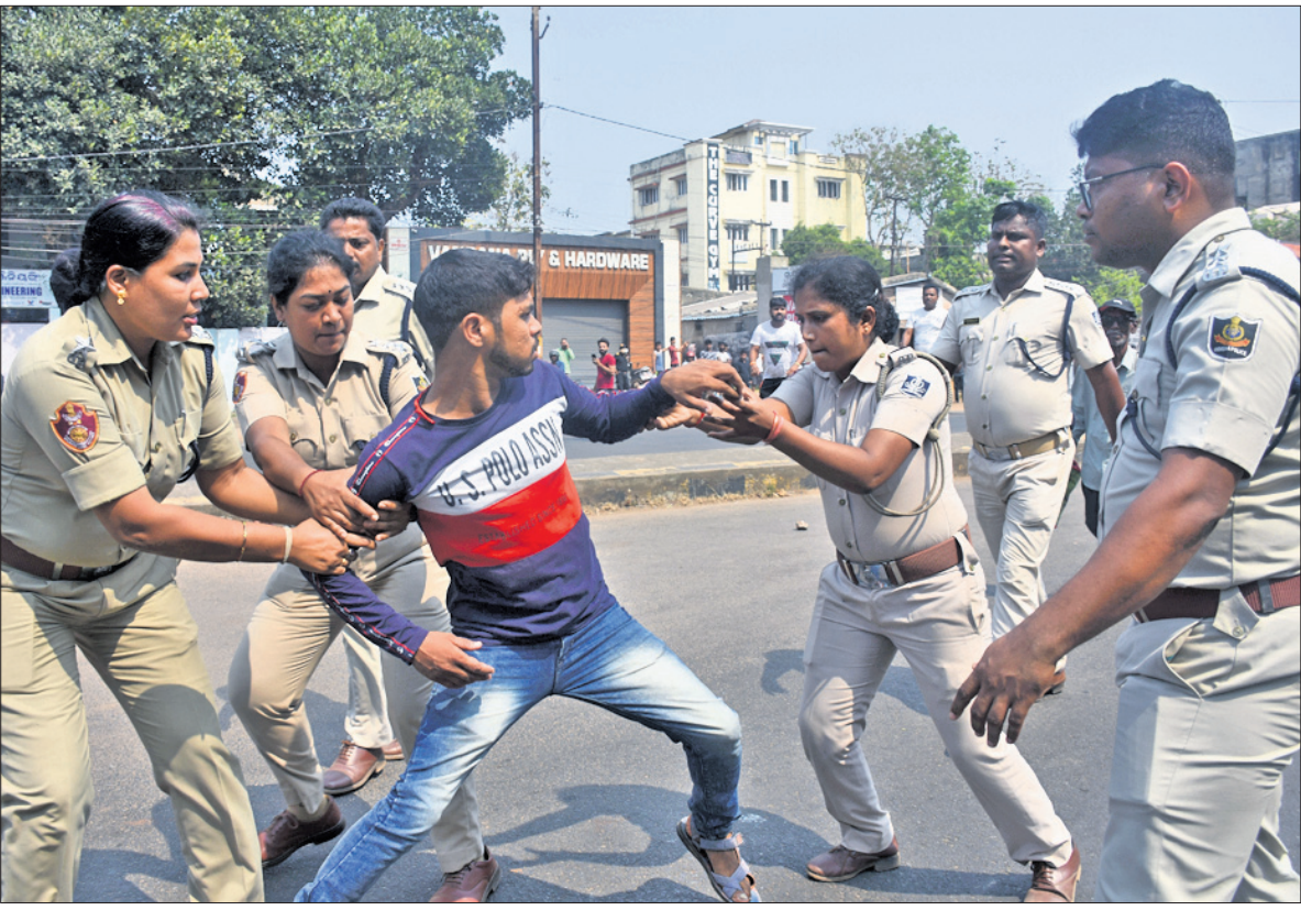
ଭୁବନେଶ୍ୱର ଝାରପଡ଼ାସ୍ଥିତ ଗଣେଶ ବଜାର ଉଦ୍ଧେବ ପ୍ରତିବାଦରେ ବିକ୍ଷୋଭ ବେଳେ ଶୁକ୍ରବାର ପୋଲିସ ଜଣେ ଯୁବକଙ୍କୁ କାନ୍ଦୁ କରିବାକୁ ଉଦ୍ୟମ କରୁଛି।