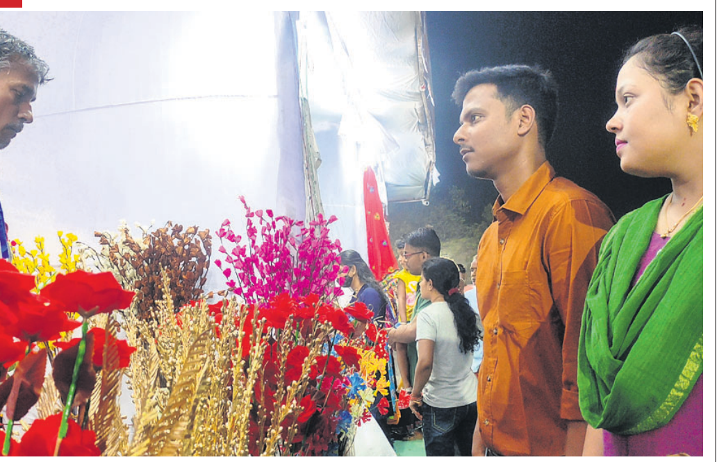
ଅନୁଗୋଳ ହାଲସ୍କୁଲ ପଡ଼ିଆରେ ବାଲିଥିବା ପଲିଷ୍ଟା ମେଳାକୁ ଆସିଥିବା ଗ୍ରାହକମାନେ ପୂଜା କରୁଛନ୍ତି।