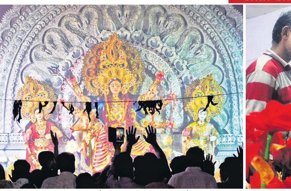
ଅନୁଗୋଳ ଅମଳାପଡ଼ାଠାରେ ମା' ବାସନ୍ତୀ ଦୁର୍ଗାଙ୍କ ଦଶମୀ ପୂଜା ବେଳେ ଭକ୍ତମାନେ ଦର୍ଶନ କରୁଛନ୍ତି।

ଦେଈନାଳ ଶ୍ରୀବଳରାମ ମନ୍ଦିର ପରିସରରେ ଥିବା ପ୍ରଭୁ ଶ୍ରୀଶ୍ରୀ ରାମଚନ୍ଦ୍ର ଜାଉଳ ମନ୍ଦିରରେ ରାମନବମୀ ଅବସରରେ ଶ୍ରୀରାମ ସେବା ସଦନ ପକ୍ଷରୁ ମହାପ୍ରଭୁଙ୍କୁ ସୁବର୍ଣ୍ଣ ରାମତିଳକ ଓ ରୁପାବେଷ୍ଟ ଥିବା ଚାମର ଅର୍ପଣ କରାଯାଇଛି।