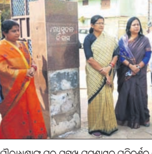
ପୌରାଧିକାରୀ ଘର ସମ୍ମୁଖ ଘଟଣାସ୍ଥଳ ପରିବର୍ତ୍ତନ କରୁଛି ରାଜ୍ୟ ଭାଜପା ପ୍ରତିନିଧି ଦଳ।