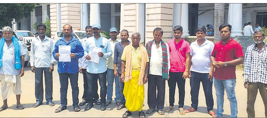
ପ୍ରଶାସନକୁ ଦାବିପତ୍ର ପ୍ରଦାନ କରିବାକୁ ଆସିଥିବା ଛଣବୋଲୁ ଗ୍ରାମବାସୀ।