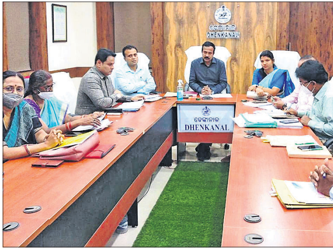
ଉନ୍ନତମାନଙ୍କ ଯୋଜନା ସମ୍ପର୍କରେ ଚର୍ଚ୍ଚା କରିବା ପାଇଁ ଉନ୍ନତମାନଙ୍କ ସମାବେଶ ଯୋଜନା କରାଯାଇଛି।

ଦେଈନାଳ ଜିଲ୍ଲାରେ ଉନ୍ନତମାନଙ୍କ ଯୋଜନାର ସଫଳ ରୂପାୟନ ନିମନ୍ତେ ଯୋଜନା କରାଯାଇଛି।