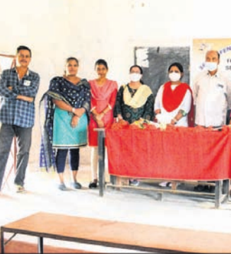
ଶିବିରରେ ଯୋଗଦେଇଥିବା ଅତିଥିଙ୍କ ସମେତ ଅନ୍ୟମାନେ।

ଦେଈନାଳ ଜିଲ୍ଲା ଭାସ୍କରରେ ଦେବେନ୍ଦ୍ର ଶତପଥୀ ସ୍ମାରକ ଉଚ୍ଚମାଧ୍ୟମିକ ବିଦ୍ୟାଳୟରେ ଆତ୍ମରକ୍ଷା ତାଲିମ ଶିବିର ଉଦ୍ଘାଟିତ ହୋଇଛି।