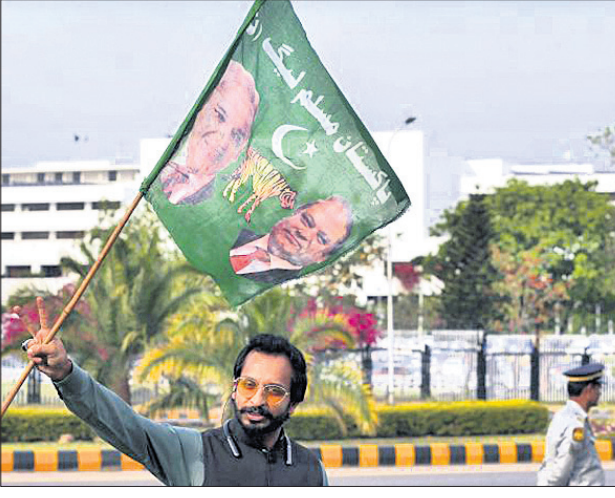
ଶେହବାଜ୍ ଜଣେ ସମର୍ଥକ ପାଇଁ ମାମଲା ଦାଖଲ ହୋଇଛି।