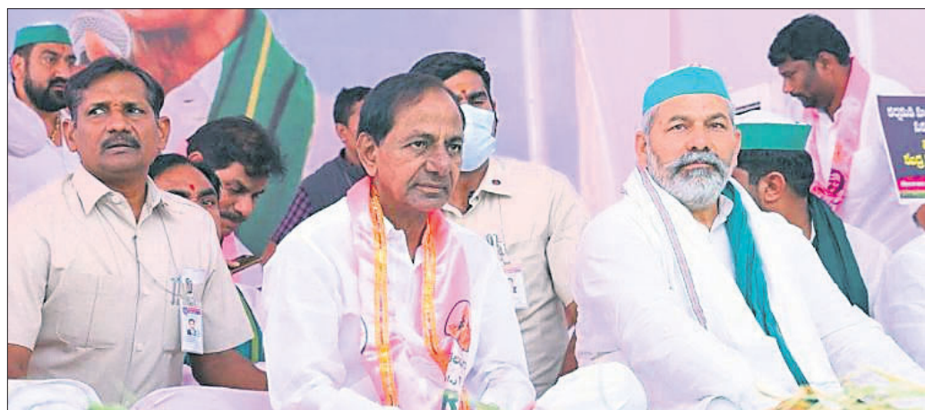
ନୂଆଦିଲ୍ଲୀରେ ତିଆରୀ ସମୟରେ କେସିଆର ଏବଂ ଚାଷୀ ନେତା ରାଜେଶ ଚିକାୟତ ଧ୍ୟାନ କର୍ତ୍ତବ୍ୟ ଦେଖିଛନ୍ତି।

ତେଲଙ୍ଗାନା ମୁଖ୍ୟମନ୍ତ୍ରୀ କେ. ଚନ୍ଦ୍ରଶେଖର ରାଓ (କେସିଆର) କେନ୍ଦ୍ର ସରକାରଙ୍କ ଧ୍ୟାନ କର୍ତ୍ତବ୍ୟ ଦୃଢ଼ ସମାଲୋଚନା କରିଛନ୍ତି। ତାଙ୍କ ରାଜ୍ୟରୁ ଧ୍ୟାନ କର୍ତ୍ତବ୍ୟ ନାହିଁ ପ୍ରଧାନମନ୍ତ୍ରୀ ନରେନ୍ଦ୍ର ମୋଦିଙ୍କ ସରକାର ୨୪ ଘଣ୍ଟା ମଧ୍ୟରେ ଜବାବ ଦିଅନ୍ତୁ ବୋଲି ସୋମବାର ନୂଆଦିଲ୍ଲୀରେ ଆୟୋଜିତ ପ୍ରତିବାଦ ରାଲିରେ କେସିଆର ଆହ୍ୱାନ ଦେଇଛନ୍ତି।