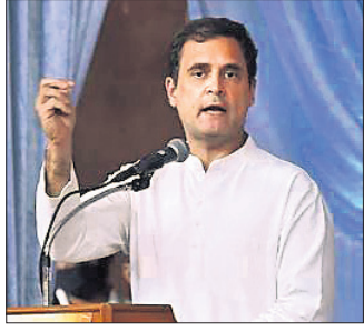
ଆବଶ୍ୟକତା ରହିଛି। ମାତ୍ର ସରକାରଙ୍କ ବୁଲ୍‌ଡୋଜର କେବଳ ଲୋକଙ୍କ

କଂଗ୍ରେସ ନେତା ରାହୁଲ ଗାନ୍ଧୀ ଭାଜପା ସରକାରଙ୍କୁ ଦେଶରେ ଦରଦାମ୍ ବୁଦ୍ଧି ନେଇ ଘେରିବା ଆରମ୍ଭ କରିଛନ୍ତି। ସେ ମଙ୍ଗଳବାର ରୁଲ୍‌ଡୋଜ କରି କହିଛନ୍ତି ଯେ, ଅତ୍ୟାଚାରୀୟ ସାମ୍ରାଜ୍ୟର ଅତ୍ୟଧିକ ଦର ଏବଂ ବେରୋଜଗାରି ଲୋକଙ୍କ ଆର୍ଥିକ ମେରୁଦଣ୍ଡକୁ ଭାଙ୍ଗି ଦେଇଛି। ପ୍ରଧାନମନ୍ତ୍ରୀ ନରେନ୍ଦ୍ର ମୋଦି ସରକାର ଲୋକଙ୍କ ସମସ୍ୟା ଉପରେ ବୁଲ୍‌ଡୋଜର ଚଳାଇବାର