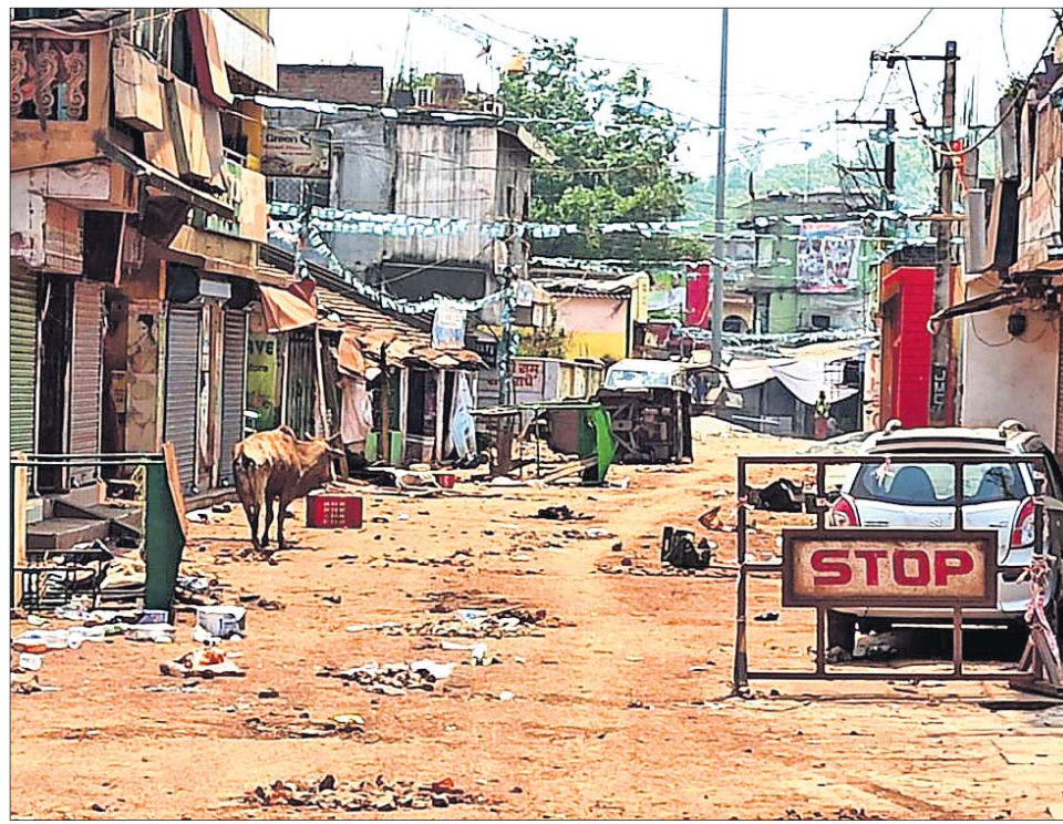
ଗୋଷ୍ଠୀ ସଂଘର୍ଷ ପରେ ମଙ୍ଗଳବାର କେନ୍ଦୁଝର ଜିଲ୍ଲା ଯୋଡ଼ା ସହର ଶୂନ୍ୟମାନ।

ଆଜି ଦେବା କାଳି ଦେବା, ଦେବା ଦେବା କହୁଥିବା ଯାବତ ଚନ୍ଦ୍ର ଦିବାକର। ଆମ ପାରିଲେ ତମ ରାଜା, ନଇ ବଢ଼ିଲେ କେଉଟ ରାଜା।