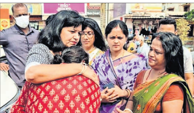
କ୍ଷତ୍ରିଗ୍ରସ୍ତ ବୋକାନୀଙ୍କୁ ଭେଟୁଛନ୍ତି ଭୁବନେଶ୍ୱର ଏବଂ ଅପରାଜିତା ସମ୍ବନ୍ଧୀୟ।

ଭୁବନେଶ୍ୱର ମହାନଗର ନିଗମ (ବିଏନ୍‌ସି) ବିନାଶରୁ ନୂଆ ଜନିତ ଆରମ୍ଭ କରୁଛି। ସକାରାତ୍ମକ ମନୋବୃତ୍ତି ଛାଡ଼ି ନିକାରାତ୍ମକ ଚିନ୍ତାଧାରା ଆପଣାଉଛନ୍ତି। ଝାରପଡ଼ା ସ୍ଥିତ ହାଟ ଭଙ୍ଗା ଘଟଣା ପରେ କ୍ଷତ୍ରିଗ୍ରସ୍ତ ବ୍ୟବସାୟୀଙ୍କୁ ଭେଟିବା ପରେ ଗଣମାଧ୍ୟମକୁ ଏବଂ ଅପରାଜିତା ସମ୍ବନ୍ଧୀୟ ସମ୍ବାଦ କହିଛନ୍ତି। ଅପରାଜିତା ଆହୁରି କହିଛନ୍ତି, ୪୩୦ ଲୋକଙ୍କୁ ରାତାରାତି ବ୍ୟବସୃତ କରାଗଲା। ସେମାନେ ନିଜ ଜୀବିକା ହରାଇଲେ। ଭୁବନେଶ୍ୱର ବିକାଶ ହେଉ, କିନ୍ତୁ ଲୋକଙ୍କ ସୁବିଧାକୁ ସର୍ବୋଚ୍ଚ ପ୍ରାଥମିକତା ଦେବା କଥା। ମାର୍କେଟ୍ ବିକ୍ରି ନାହିଁ ଯେଉଁମାନଙ୍କୁ ରାତାରାତି ଝାରପଡ଼ା ହାଟରୁ ହଟାଗଲା ସେମାନଙ୍କୁ ପ୍ରଥମେ ଥିକାଧାର କରାଯିବା ଆବଶ୍ୟକ। ଏହି ଉଠା ଉପାଧ୍ୟକ୍ଷ ନିର୍ବାଚନ ହୋଇଥିବାବେଳେ ଏଠାରେ ହୋଇପାରି ନ ଥିଲା।