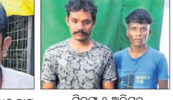
ବିପଦ ୨ ଅଭିଯୁକ୍ତ