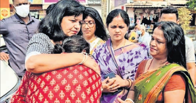
କ୍ଷତ୍ରିଗ୍ରସ୍ତ ସେବାକାରୀଙ୍କୁ ଭେଟୁଛନ୍ତି ଭୁବନେଶ୍ୱର ଏମ୍‌ପି ଅପରାଜିତା ସମ୍ବନ୍ଧୀୟ।

ଭୁବନେଶ୍ୱର ମହାନଗର ନିଗମ (ବିଏନ୍‌ସି) ବିନାଶରୁ ନୂଆ ଜନିତ ଆରମ୍ଭ କରୁଛି। ସକାରାତ୍ମକ ମନୋବୃତ୍ତି ଛାଡ଼ି ନିକାରାତ୍ମକ ଚିନ୍ତାଧାରା ଆପଣାଉଛନ୍ତି। ଝାରପଡ଼ା ସ୍ଥିତ ହାଟ ଭଙ୍ଗା ଘଟଣା ପରେ କ୍ଷତ୍ରିଗ୍ରସ୍ତ ବ୍ୟବସାୟୀଙ୍କୁ ଭେଟିବା ପରେ ଗଣମାଧ୍ୟମକୁ ଏମ୍‌ପି ଅପରାଜିତା ସମ୍ବନ୍ଧୀୟ ସମ୍ବାଦ କହିଛନ୍ତି। ଅପରାଜିତା ଆହୁରି କହିଛନ୍ତି, ୪୩୦ ଲୋକଙ୍କୁ ରାତାରାତି ବ୍ୟବହାର କରାଗଲା। ସେମାନେ ନିଜ ଜୀବିକା ହରାଇଲେ। ଭୁବନେଶ୍ୱର ବିକାଶ ହେଉ, କିନ୍ତୁ ଲୋକଙ୍କ ସୁବିଧାକୁ ସର୍ବୋଚ୍ଚ ପ୍ରାଥମିକତା ଦେବା କଥା। ମାର୍କେଟ୍ ବିକ୍ରି ନାହିଁ ଯେଉଁମାନଙ୍କୁ ରାତାରାତି ଝାରପଡ଼ା ହାଟରୁ ହଟାଗଲା। ସେମାନଙ୍କୁ ପ୍ରଥମେ ଥିକାଧାର କରାଯିବା ଆବଶ୍ୟକ। ଏହି ଉଠା ଉପାଧ୍ୟକ୍ଷ ନିର୍ବାଚନ ହୋଇଥିବାବେଳେ ଏଠାରେ ହୋଇପାରି ନ ଥିଲା।