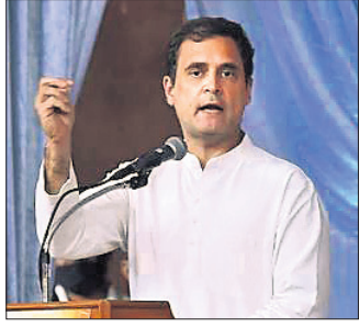
ଆବଶ୍ୟକତା ରହିଛି। ମାତ୍ର ସରକାରଙ୍କ ରୁଲ୍‌ଡୋଜର କେବଳ ଲୋକଙ୍କ

କଂଗ୍ରେସ ନେତା ରାହୁଲ ଗାନ୍ଧୀ ଭାଜପା ସରକାରଙ୍କୁ ଘୃଣା କରିବା ପାଇଁ ବୃଦ୍ଧି ନେଇ ଘେନିବା ଆରମ୍ଭ କରିଛନ୍ତି। ସେ ମଙ୍ଗଳବାର ରୁଲ୍‌ଡୋଜ କରି କହିଛନ୍ତି ଯେ, ଅତ୍ୟାଚାରୀୟ ସାମ୍ରାଜ୍ୟ ଅଧିକାରୀଙ୍କ ଦ୍ୱାରା ଏବଂ ବେରୋଜଗାରି ଲୋକଙ୍କ ଆର୍ଥିକ ମେରୁଦଣ୍ଡକୁ ଭାଙ୍ଗି ଦେଇଛି। ପ୍ରଧାନମନ୍ତ୍ରୀ ନରେନ୍ଦ୍ର ମୋଦି ସରକାର ଲୋକଙ୍କ ସମସ୍ୟା ଉପରେ ରୁଲ୍‌ଡୋଜର ଚଳାଇବାର