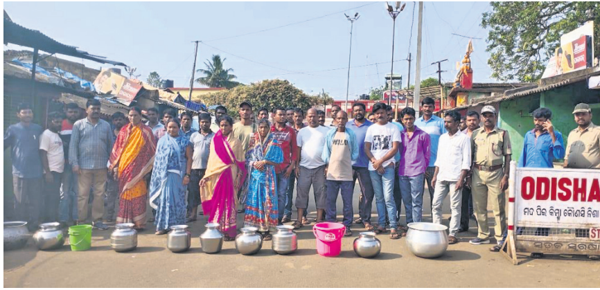
ମହିଳାମାନେ ହାଣ୍ଡି ରଖି ରାସ୍ତା ଅବରୋଧ କରିଛନ୍ତି।

ଜଳ ବିଭାଗର ସୂଚନାଶିଳା, ଜଳ ବହୁଳେ ସୂଚନାଶିଳା ଏହି ମନୁପାଠ ସଦୃଶ ସବୁ ସମୟରେ ପ୍ରମାଣିତ ହୋଇଥାଏ। ଜଳ ପାଇଁ ଦଶମହପୁର ବ୍ଲକରେ କନିଷ୍ଠ ଯନ୍ତ୍ରୀ, ଏସ୍ଡିଓଙ୍କ ସହ ଅଧୀକ୍ଷଣ ଯନ୍ତ୍ରୀଙ୍କୁ ମଙ୍ଗଳବାର ଲୋକେ ଯୋଗଦେଇ ଆଞ୍ଚଳିକ ବିଭାଗ କମିଟି ଆହ୍ୱାନରେ ଦୋକାନ ବଜାର ବନ୍ଦ ରହିବା ସହ ଗାଡ଼ିମୋଟର ଚଳାଚଳକୁ ମଧ୍ୟ ରୋକିବା ବନ୍ଦ ରଖିଥିଲେ। ବିଭିନ୍ନ ସ୍ଥାନରେ ମହିଳାମାନେ ଖାଲି ହାଣ୍ଡି ଧରି ରାସ୍ତା ଅବରୋଧ କରିଥିବା ଦେଖିବାକୁ ମିଳିଥିଲା। ଖବରରୁ ଜଣାପଡ଼ିଛି, ଦଶମହପୁର ବ୍ଲକରେ ଦୀର୍ଘଦିନ ହେଲା ପାନୀୟ ଜଳ ସମସ୍ୟା ଲାଗି ରହିଛି। ଚଳିତବର୍ଷ ପାନୀୟ ଜଳର ସମସ୍ୟା ନେଇ ଏପ୍ରିଲ ୨୮ରେ ଗ୍ରାମବାସୀ ରାସ୍ତାଗୋଡ଼ିଆ କରିଥିଲେ। ସେତେବେଳେ ବିଡ଼ିଓ ଏ ବ୍ଲକ ଜଳ ଯୋଗାଣ ବିଭାଗ କନିଷ୍ଠ ଯନ୍ତ୍ରୀ ୮ ଦିନ ମଧ୍ୟରେ ସମସ୍ୟାର ସମାଧାନ କରିବାକୁ ପ୍ରତିଶ୍ରୁତି ଦେଇଥିଲେ। ମାତ୍ର ଏକ ବର୍ଷ ପରେ ମଧ୍ୟ କୌଣସି ପଦକ୍ଷେପ ନେଇ ନ ଥିଲେ। ମାର୍ଚ୍ଚ ୨୮ରେ ପାନୀୟ ଜଳ ଯୋଗାଣ ନେଇ ରାସ୍ତା ଅବରୋଧ କରାଯିବ ବୋଲି ଗ୍ରାମବାସୀ ଜିଲ୍ଲାପାଳଙ୍କଠାରୁ ଆରମ୍ଭ କରି ବିଭାଗୀୟ ଅଧିକାରୀଙ୍କୁ ଅଭିଯୋଗପତ୍ର ଦେଇଥିଲେ। ଏହା