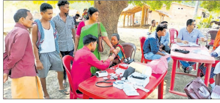
ଗୋମ୍ପାକୋଣ୍ଡା ଗ୍ରାମରେ ତାନ୍ତ୍ରୀକ ଚିକିତ୍ସା ପ୍ରଦାନ କରୁଛନ୍ତି ।

ମାଳକାନଗିରି ଜିଲ୍ଲା କାଳିମେଳା ବ୍ଲକ ଗୋମ୍ପାକୋଣ୍ଡା ପଞ୍ଚାୟତ ଗୋମ୍ପାକୋଣ୍ଡା ଗ୍ରାମରେ ଅଜଣା ରୋଗ ଦେଖା ଦେଖା ହେଇଛି। ଏହି ଅଜଣା ରୋଗରେ କେତେକ ବ୍ୟକ୍ତି ପ୍ରାଣ ହରାଇଥିବା ବେଳେ ଅନେକ ଆକ୍ରାନ୍ତ ହୋଇଥିବା ଖବର ମିଳିଛି। ଗତ କିଛି ଦିନ ତଳେ ବ୍ଲକର ଚିକିତ୍ସା ପଞ୍ଚାୟତ ଅନ୍ତର୍ଗତ ପିତାକୋଣ୍ଡା ଗ୍ରାମରେ ୨ ମାସ ଭିତରେ ୫ ଶିଶୁଙ୍କ ସହ ୨୦ ଜଣଙ୍କ ମୃତ୍ୟୁ ହେବା ଖବର ଜିଲ୍ଲାରେ ଆଲୋଚନା ହୋଇଛି। ଅନୁରୂପ ଭାବେ ଅଜଣା ରୋଗ ସ୍ୱାସ୍ଥ୍ୟ ବିଭାଗର ଚିକିତ୍ସା କାରଣ ପାଲଟିଛି। ଏନେଇ ସୁତନା ମଙ୍ଗଳବାର କାଳିମେଳା ଗୋମ୍ପା ସ୍ୱାସ୍ଥ୍ୟକେନ୍ଦ୍ରର ଏକ ତାନ୍ତ୍ରୀକ ଚିକିତ୍ସା ଗ୍ରାମକୁ ଯାଇ ସେଠାରେ ଏକ ସ୍ୱାସ୍ଥ୍ୟ ଶିବିର କରିବା