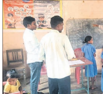
ସ୍ୱାଭିମାନ ଅଞ୍ଚଳର ଏକ ସ୍କୁଲରେ ଜିଲ୍ଲାପାଳ ପିଲାଙ୍କୁ ପଢ଼ାଉଛନ୍ତି ।

ମାଳକାନଗିରି ମାଳକାନଗିରି ଜିଲ୍ଲାର ସମସ୍ତ ଡ୍ରାଇଭରମାନେ ଏକାଠି ହୋଇ ସେମାନଙ୍କ ବିଭିନ୍ନ ସମସ୍ୟା ସମାଧାନ ନେଇ ଜିଲ୍ଲାପାଳଙ୍କୁ ଦାବିପତ୍ର ପ୍ରଦାନ କରିଛନ୍ତି। ଓଡ଼ିଶା ଡ୍ରାଇଭର ସଂଘ ପକ୍ଷରୁ ସେମାନେ ପୁଞ୍ଜୀମନ୍ତ୍ରୀଙ୍କ ଉଦ୍ଦେଶ୍ୟରେ ଏହି ଦାବିପତ୍ର ଦେଇଛନ୍ତି। ରାଜ୍ୟରେ ସମସ୍ୟା ଓ ଅସୁବିଧା ସମୟରେ ଡ୍ରାଇଭରମାନଙ୍କ ଭୂମିକା ରୁଚୁପୁର୍ଣ୍ଣ। କୋରନା ମହାମାରୀ ସମୟରେ ମଧ୍ୟ ଅନେକ ଡ୍ରାଇଭର ନିଜ ଜୀବନକୁ ବଳି ଲଗାଇ ସରକାରଙ୍କୁ ସାହାଯ୍ୟ କରିଛନ୍ତି। ବର୍ଷା, ଚୋପାନ ଓ ବାତ୍ୟା ସମୟରେ ମଧ୍ୟ ଲୋକଙ୍କ ଜୀବନ ସଂରକ୍ଷଣ ପାଇଁ ମାତ୍ର