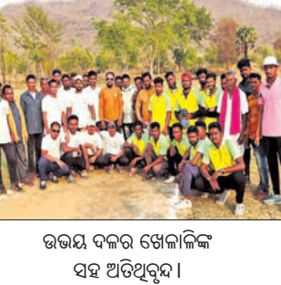
ଉଭୟ ଦଳର ଖେଳାଳିଙ୍କ ସହ ଅତିଥିବୃନ୍ଦ।