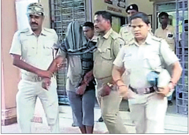
ଅଭିଯୁକ୍ତଙ୍କୁ କୋର୍ଟକୁ ନିଆଯାଇଛି।