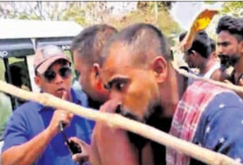
ଉତ୍ତରକୋଟ ଲୋକେ ଓ ତହସିଲଦାର।

ଗଞ୍ଜାମ, ୧୩୪(ଡି.ଏନ.ଏ.) ଜଣେ ଯୁବକଙ୍କୁ ଚାପୁଡ଼ା ମାରି ଗଞ୍ଜାମ ତହସିଲଦାର ଅଟକିଛନ୍ତି। ଏହି ଘଟଣା ନେଇ ଗଞ୍ଜାମ ବ୍ଲକ୍ ଅନ୍ତର୍ଗତ ସିପକ୍ସିଆ ଗ୍ରାମବାସୀ ତହସିଲଦାରଙ୍କୁ ଯେଉଁ କୋର୍ଟରେ ମାରିଥିଲେ।