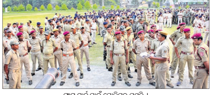
ସ୍ୱାଗତ ପାଇଁ ପୋଲିସର ପ୍ରସ୍ତୁତି।