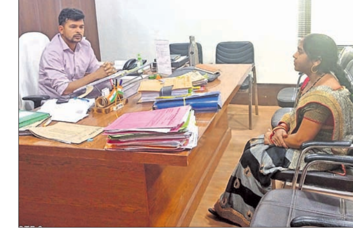
ପାନୀୟ ଜଳ ସମସ୍ୟାକୁ ନେଇ ଜିଲ୍ଲା ପରିଷଦ ଉପାଧ୍ୟକ୍ଷ ପିତିକାଠାରେ ଫେରାଦ ହେଉଛନ୍ତି।