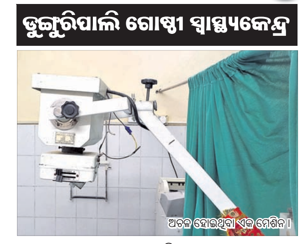
ଅଟକି ହୋଇଥିବା ଏକ ମେଶିନ।