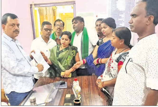
କୁନାଗତ ଉପକୂଳ ଅଭିଯୋଗପତ୍ରର ଏକକିତା ନକଲ ଦିଆଯାଉଛି।