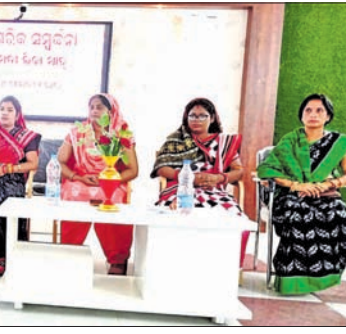
ନବନିର୍ବାଚିତ ପୌରାଧକ୍ଷ, ଉପାଧକ୍ଷ ଓ କାଉନସିଲରଙ୍କୁ ସମ୍ବର୍ଦ୍ଧନା ସଭା।

କଳାହାଣ୍ଡି ଜିଲ୍ଲା କୋକସରା ବୁକ ବଡ଼ପୋ ପଞ୍ଚାୟତ ଚଳାଣୀଠାରେ କାଉଡୋଳିଆ ମାଟି ପରିବାରର ଗୁରୁ ତଥା ଶ୍ରୀ କାଳକ୍ଷେତ୍ର ମହାଦେବ ତଥା ଲକ୍ଷ୍ମୀ ଦେବୀ ମା' କାଳୀବାହୁଡ଼ିକ ପଣାଜଳା ଯାତ୍ରା ଚେତ୍ର ଶୁକ୍ଳପକ୍ଷ ଏକାଦଶୀ ତିଥିରେ ପାଳିତ ହୋଇଯାଇଛି। ନବରଞ୍ଜପୁର ଜିଲ୍ଲା ଭେଜିଗୁଡ଼ା ମା' କାଳୀବାହୁଡ଼ିକ ମୁଖ୍ୟ ପାଠାଗାରୀ ହୋଇଥିବା ବେଳେ ସେଠାରୁ ମା' କାଳୀଠାକୁ ଆସିବା ପରେ ପଣାଜଳା ଯାତ୍ରା ଅନୁଷ୍ଠିତ ହୋଇଯାଇଛି। କିଛି ବର୍ଷ ଅତୀତକରେ ପଣାଜଳା ଯାତ୍ରାରେ ପଡ଼ୋଶୀ ନବରଞ୍ଜପୁର, ଜଗଦଳପୁର, ରାଇଘର, ଛତିଶଗଡ଼ ଦେଭୋଗ ଓ କଳାହାଣ୍ଡି ଜିଲ୍ଲାର ବିଭିନ୍ନ ସ୍ଥାନରୁ ବଂଶୀୟ ଛାତ୍ର କୁରୁମ୍ଭ ଲୋକମାନେ ଆସି ଯୋଗଦେଇ ଲକ୍ଷ୍ମୀଦେବୀଙ୍କ ନିକଟରେ ନିଜର ପରିବାରର ସୁଖ ମଙ୍ଗଳ କାମନା କରିଥିଲେ। ପାଣି ଦେବାକୁ ବୋଦା, କୁକୁଡ଼ା, ପାଣି ଆଦି ବଳି ଦିଆଯାଏ। କାଉଡୋଳା, ଶରୀରୁଡ଼ା, ବୋବିଆ, ରଏନଗୁଡ଼ା, ଧୋବେନପଡ଼ା, ଯଶ୍ୱିଗୁଡ଼ା ଗ୍ରାମର ଶତାଧିକ ଶ୍ରଦ୍ଧାଳୁଙ୍କ ସମାଗମ ହୋଇଥିଲା।