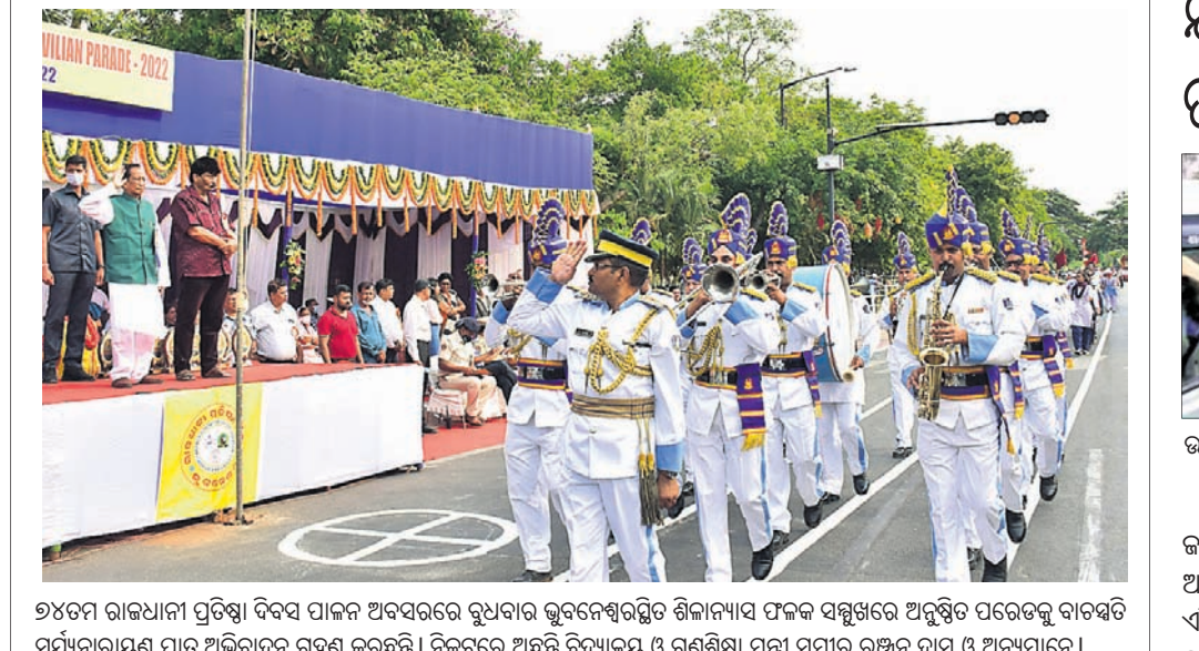
୨୪ତମ ରାଜଧାନୀ ପ୍ରତିଷ୍ଠା ଦିବସ ପାଳନ ଅବସରରେ ରୁକୁଣାର ଭୁବନେଶ୍ୱରସ୍ଥିତ ଶିଳାମୟ ଫକଟ ସମ୍ମୁଖରେ ଅନୁଷ୍ଠିତ ପରବର୍ତ୍ତୀ ବାଦ୍ୟତୀ ପୂର୍ଣ୍ଣାବଳୀର ପ୍ରଥମ ଅଭିବାଦନ ଗ୍ରହଣ କରୁଛନ୍ତି।

ଭୁବନେଶ୍ୱର ସଡ଼କ ଦୁର୍ଘଟଣା ଚିକିତ୍ସାକର୍ମୀଙ୍କୁ ନିୟୋଜିତ କରାଯାଇଛି। ଏମ୍ସ୍ ସାବିତ୍ରୀରେ ସେଣ୍ଟର(ଏବିଏସ୍‌ସି)ରେ ଆସନ୍ତା ୧୨ ତାରିଖରୁ ସପ୍ତାହ ଓପିଡି ସେବା ଆରମ୍ଭ ହେବ।