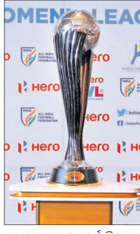
ପ୍ରସାରଣ ହେବ। ସମ୍ପୂର୍ଣ୍ଣ ସିକ୍ସରେ ମୋଟ ୬୨ଟି ମ୍ୟାଚ ଅନୁଷ୍ଠିତ

ଭୁବନେଶ୍ଵର, ୧୩୪ (କ୍ରୀଡ଼ା ପ୍ରତିନିଧି) ହିରୋ ଇଣ୍ଡିଆନ୍ ଓମେନ୍ସ ଲିଗ୍ (ଆଇଡ଼ିଏଲ୍)ର ୫ମ ସଂସ୍କରଣ ଆୟୋଜନ ପାଇଁ କ୍ଷେତ୍ର ପ୍ରସ୍ତୁତ। ଭୁବନେଶ୍ଵରର ୩ଟି ଗ୍ରାଉଣ୍ଡ କଳିଙ୍ଗ ଷ୍ଟାଡ଼ିୟମ, କ୍ୟାପିଟାଲ ହାଲ୍ସୁଲ୍ ପଡ଼ିଆ ଓ ୬ମ ବାଗାଲିୟନ ପଡ଼ିଆରେ ଏହି ସମ୍ପାଜନକର୍ମ ଲିଗ୍ ଚଳିତ ମାସ ୧୫ ତାରିଖରୁ ଆରମ୍ଭ ହୋଇ ମେ’ ୨୬ ପର୍ଯ୍ୟନ୍ତ ଚାଲିବ। ମହିଳା ଫୁଟବଲ୍ରେ ଏହି ପେସାଦାର କ୍ଷେତ୍ର ପ୍ରତିଯୋଗିତାରେ ମୋଟ ୧୨ଟି ଦଳ ଅଂଶଗ୍ରହଣ କରିବେ ଏବଂ ଏହା ଝୁରୋ ଷ୍ଟୋର୍ ଇଣ୍ଡିଆରେ ସିଧା