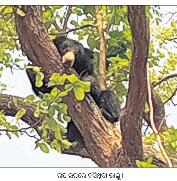
ଗଛ ଉପରେ ବସିଥିବା ଭାଲୁ।

ଉପରକୋଟ, ୧୩/୪(ବୁଧବାର) ଖାଦ୍ୟ ଅନୁଷ୍ଠାନରେ ରାତିରେ ଜନସଂସ୍ଥା ହୋଇଥିଲା ଭାଲୁ ସକାଳୁ ଲୋକେ ଭାଲୁକୁ ଉଡ଼ାଉଛନ୍ତି। ସେ ଏକ ଶାଳଗଛରେ ଚଢ଼ିଯାଇଥିଲା। ଏପରି ଦୃଶ୍ୟ ନବରଙ୍ଗପୁର ଜିଲ୍ଲା ଉପରକୋଟ ବ୍ଲକ କୁର୍ଦ୍ଦା ପଞ୍ଚାୟତ ଜୁନାପାଣି ଗ୍ରାମ ନିକଟସ୍ଥ ଜଙ୍ଗଲରେ ଦେଖିବାକୁ ମିଳିଥିଲା। ସୂଚନାକୁ ଗ୍ରହଣ କରି ଖାଦ୍ୟ ଅନୁଷ୍ଠାନର ଗାଁ ଆଡ଼କୁ ଚାଲି ଆସିଥିଲା। ସକାଳୁ ହୋଇଥିବାରୁ ସେ ଫେରି ନ ପାରି ଗାଁ ପାଖ ଜଙ୍ଗଲକୁ ପକାଇଥିଲା। ଗ୍ରାମର କେତେଜଣ ଲୋକ ମହଲ ଗୋଟେଇବାକୁ ଜଙ୍ଗଲକୁ ଯାଇଥିଲେ। ସେମାନେ ଭାଲୁକୁ ଦେଖି ଉଡ଼ାଉଥିଲେ। ସେହି ସମୟରେ ଭାଲୁଟି ଭୟଭୀତ ହୋଇ ଗଛ ଉପରେ ଚଢ଼ିଯାଇଥିଲା। ଖବରପାଇ ବନ ବିଭାଗର ୨୫ଜଣିଆ ଟିମ୍ ଘଟଣାସ୍ଥଳରେ ପହଞ୍ଚିଥିଲେ। ଭାଲୁକୁ କିପରି ଚଳକୁ ଓହ୍ଲାଇବ ସେ ନେଇ ଚେଷ୍ଟା କରିଥିଲେ। ଭାଲୁଟି ଭୟଭୀତ ହୋଇଥିବାରୁ ବନ କର୍ମଚାରୀମାନେ ପ୍ରଥମେ ଗଛ ଚଳୁ ଲୋକଙ୍କୁ ହଟାଇଥିଲେ। ସନ୍ଧ୍ୟା ୫.୩୦ରେ ଭାଲୁଟି ଗଛରୁ ଓହ୍ଲାଇ ଜଙ୍ଗଲ ଭିତରକୁ ଚାଲିଯାଇଥିଲା।