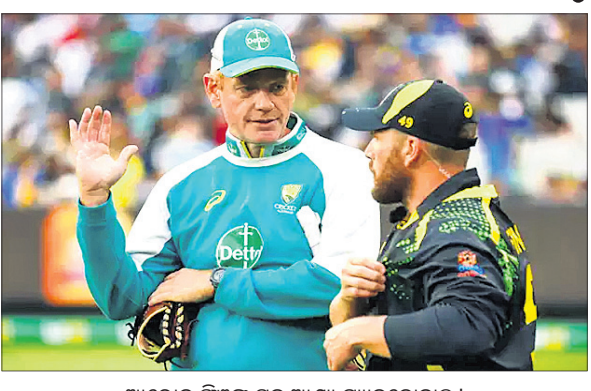
ଆରୋନ୍ ଫିକ୍ସଙ୍କ ସହ ଆଷ୍ଟ୍ରେଲିଆ ମ୍ୟାକଡୋନାଲ୍ଡ

ମେଲବୋର୍ନ, ୧୩/୪ ଆଷ୍ଟ୍ରେଲିଆ ମ୍ୟାକଡୋନାଲ୍ଡ ଅଷ୍ଟ୍ରେଲିଆ ପୁରୁଷ କ୍ରିକେଟ ଦଳର ସମସ୍ତ ଫର୍ମାଟ ପାଇଁ ଫୁଲ୍ ଟାଇମ୍ କୋର୍ ଭାବେ ନିଯୁକ୍ତ କରାଯାଇଛି। ଏ ନେଇ ଗୁଆରୁକ୍ରିକେଟ ଅଷ୍ଟ୍ରେଲିଆ (ସିଏ) ଘୋଷଣା କରିଛି। ପୂର୍ବତନ କୋର୍ କଷ୍ଟନ ଲାଙ୍ଗର ଫେବୃଆରୀରେ ଇଣ୍ଡିଆ ଦେବା ପରେ ମ୍ୟାକଡୋନାଲ୍ଡ ଅଭିନୀତ କୋର୍ ଭାବେ ଦାୟିତ୍ଵ ସମ୍ଭାଳିଥିଲେ। ତାଙ୍କ ନେତୃତ୍ଵରେ ଅଷ୍ଟ୍ରେଲିଆ ଦଳ ପାକିସ୍ତାନରେ ଟେଷ୍ଟ ଏବଂ ଟି୨୦ରେ ସଫଳ ପ୍ରଦର୍ଶନ କରିଥିଲା। ଏଥିପାଇଁ ପୂର୍ବତନ ଇକ୍ଵେରିଆ ଅଲରାଉଣ୍ଡର ସହ କ୍ରିକେଟ ଅଷ୍ଟ୍ରେଲିଆ ଏକ ୪ ବର୍ଷିଆ ଚୁକ୍ତି କରିଛି। “ଆଷ୍ଟ୍ରେଲିଆ ଜଣେ ଚମତ୍କାର ମୁଖ୍ୟ କୋର୍, ଯାହାକି ସେ ପ୍ରମାଣ କରି ଦେଖାଇ ସାରିଛନ୍ତି। ନିଯୁକ୍ତି ପ୍ରକ୍ରିୟା