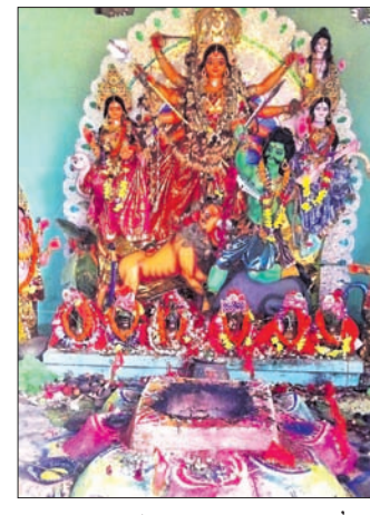
ଗଡ଼ପୋଖରୀରେ ପୂଜା ପାଉଥିବା ମା' ବାସନ୍ତିଦୁର୍ଗାଙ୍କ ମୂର୍ତ୍ତୀ।