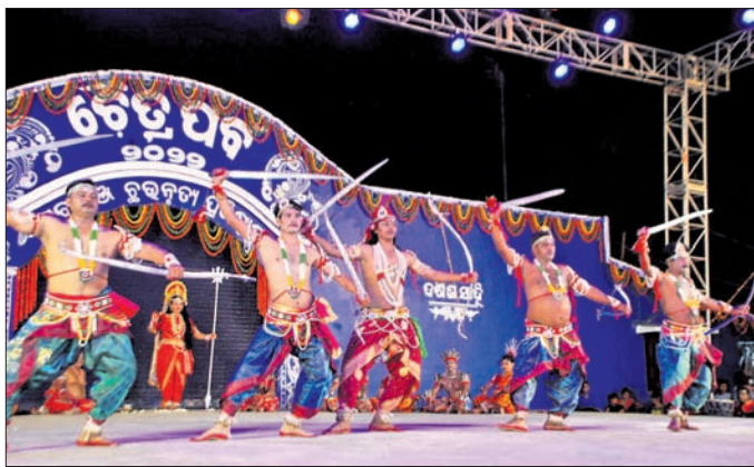
ଛନ୍ଦ କଳାକାରମାନେ ଦଳଗତ ନୃତ୍ୟ ପରିବେଷଣ କରୁଛନ୍ତି।