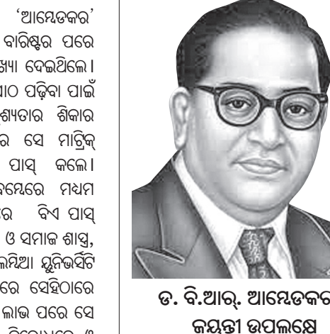
ଡ. ବି.ଆର୍. ଆୟେତକରଙ୍କ ଜୟନ୍ତୀ ଉପଲକ୍ଷେ

ମହାତ୍ମା ଗାନ୍ଧୀ ଓ ଆୟେତକର ଉଭୟ ଦେଶକୁ ଜାତି ପ୍ରଥା ବିଲୋପ ପାଇଁ ପ୍ରୟାସ କରି ରଖିଥିଲେ । ମାତ୍ର ଗାନ୍ଧିଜୀ ହିନ୍ଦୁ ବର୍ଣ୍ଣ ବ୍ୟବସ୍ଥା ମଧ୍ୟରେ ଜାତିପ୍ରଥା ହତଭାବ ପାଇଁ କହୁଥିବା ବେଳେ ଆୟେତକର ବର୍ଣ୍ଣ ବ୍ୟବସ୍ଥା ପାଇଁ ଜାତି ବ୍ୟବସ୍ଥା, କୁସଂସ୍କାର,