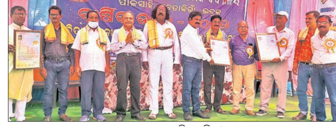
ଉତ୍ସବରେ ଉପସ୍ଥିତ ଅତିଥି।