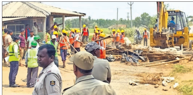
ରାଜପଥ କଡ଼କୁ ଜବରଦଖଲ ଉଚ୍ଛେଦ କରାଯାଇଛି।