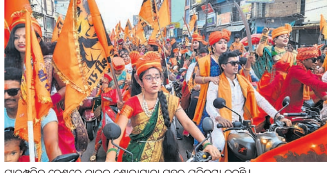
ପାରମ୍ପରିକ ବେଶରେ ବାଉଳ ଶୋଭାଯାତ୍ରା ସହର ପରିକ୍ରମା କରୁଛି।