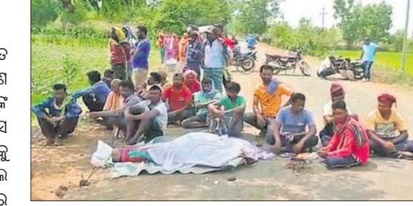
ରାସ୍ତା ଅବରୋଧ କରିଥିବା ପରିବାର ଓ ଗ୍ରାମବାସୀ ।

କନ୍ଧପୁର ସଦର ଥାନା ଅନ୍ତର୍ଗତ ଘାଟବାସୀ ଗ୍ରାମର ଏକ କୁଅରୁ ଜଣେ ବୁଦ୍ଧଙ୍କ ମୃତଦେହ ଜବତ ହୋଇଛି ।