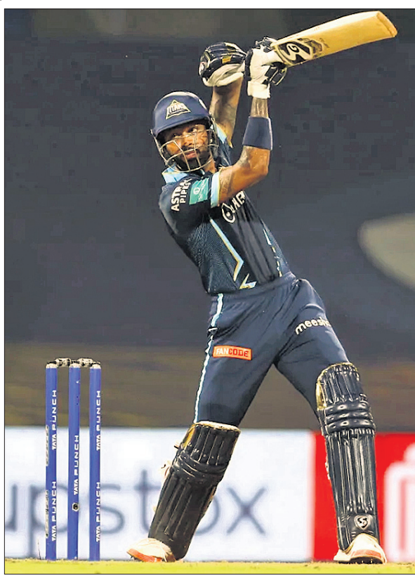
ଶର୍ଦ୍ଧା ଖେଳିବା ଅବସରରେ ହାର୍ଦ୍ଦିକ ପାଣ୍ଡ୍ୟା।

ଆଇପିଏଲ୍-୧୫ ଆଜିର ମ୍ୟାଚ ସନ୍ତୋଷକର୍ତ୍ତୃ ହାଇଡ୍ରୋପାଟ ବନାମ କୋଲକାତା ନାଇଟ ରାଇଡର୍ସ ସ୍ଥାନ: ପୁସ୍ତକ ସମୟ: ରାତି ୭ଟା ୩୦ ପ୍ରସାରଣ: ଷ୍ଟାର ସ୍ପୋର୍ଟ୍ସ