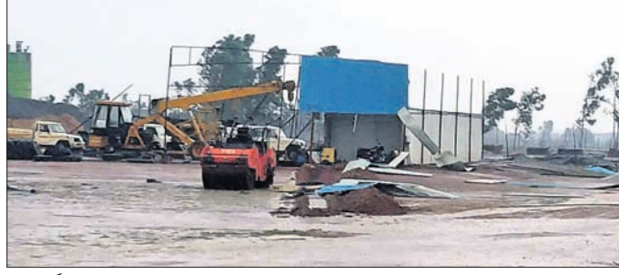
ଝଡ଼ବର୍ଷାରେ ଉତ୍ତରରେ ଭାରତମାଳା ପ୍ରକଳ୍ପ ଅଭ୍ୟାସ କାର୍ଯ୍ୟ।