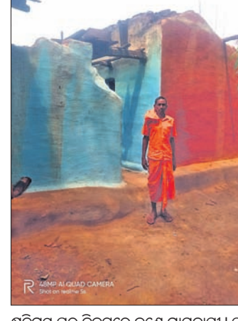
କ୍ଷତିଗ୍ରସ୍ତ ଘର ନିକଟରେ ଜଣେ ଗ୍ରାମବାସୀ। ସାନକ୍ଳୁମାରୀ ଗାଁରେ ନଷ୍ଟ ହୋଇଥିବା ମକା ଫସଲ।

ନବରଙ୍ଗପୁର ଜିଲା ଉପଲକ୍ଷ୍ୟରେ ଅଣ୍ଡାଧାରୀ ପ୍ରକଳ୍ପରେ ପ୍ରକଳ୍ପ ଝଡ଼ ଟୋପାନ ହୋଇଥିଲା। ଏହାର ପ୍ରଭାବରେ ଉପଲକ୍ଷ୍ୟ ନିକଟରେ ଶାଖା ପଞ୍ଚାୟତର ସାନ କ୍ଳୁମାରୀ ଗ୍ରାମରେ ବ୍ୟାପକ କ୍ଷୟକ୍ଷତି ହୋଇଛି।