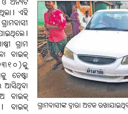
ଗ୍ରାମବାସୀଙ୍କ ଦ୍ଵାରା ଅଟକ ରଖାଯାଇଥିବା କାର୍ ଓ ବାଇକ୍ ।

ପଞ୍ଚରେ ଗ୍ରାମ ଭିତରକୁ ଆସିଥିବା କାର୍ (ଏପି୫୫ଏଏ୧-୨୮୯୯)କୁ ଧରିଥିଲେ ।