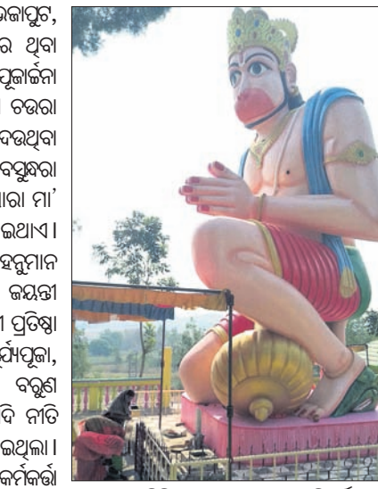
ଦାମନଯୋଡ଼ିସ୍ଥିତ ସୁଭଦ୍ରା ହନୁମାନ ପ୍ରତିମା ।

କଳାନିକେତନସ୍ଥିତ ଆଖଣ୍ଡଳମଣି ମନ୍ଦିରରେ ବିଷୁବାନ୍ତ ଯଜ୍ଞ ଅନୁଷ୍ଠିତ ହୋଇଛି । ବିଭିନ୍ନ ଗ୍ରାମରେ ପଣା ବନ୍ଧନ ସହ ଅନୁପ୍ରସାଦ ସେବନର ବ୍ୟବସ୍ଥା ହୋଇଥିଲା ।