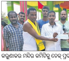
କରୁଣାକର ମନ୍ଦିର କମିଟିକୁ ଟଙ୍କା ପ୍ରଦାନ କରୁଛନ୍ତି । ସମାଜିକ କର୍ମୀ ରୁପେ ବେଶ୍ ପରିଚିତ ।

ହନୁମାନ ମନ୍ଦିର ପରିସରରେ କୁଖରୋପଣ ଓ ମନ୍ଦିର ପରିଚାଳନା ପାଇଁ ମନ୍ଦିର ପରିଚାଳନା କମିଟିକୁ ପ୍ରଦାନ କରିବେ ବୋଲି କହିଥିଲେ ।