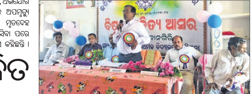
ସାହିତ୍ୟ ଆସରରେ ଉପସ୍ଥିତ ଅତିଥିମାନେ ।

ଅଲଗା ପାଳିତହେଇଯାଇଛି । ରାମ ମନ୍ଦିର ନିକଟସ୍ଥ ଅତି ପୁରାତନ ହନୁମାନ ମନ୍ଦିର, ଦୈନିକ ବକାର ସ୍ଥିତ ହନୁମାନ ମନ୍ଦିର ଓ ଆରାଧ୍ୟ ଦେବୀ ମା' ଶିବକା ଠାକୁରାଣୀ ମନ୍ଦିରରେ ପୂଜାପାଠ, ହୋମ ଯଜ୍ଞ ହେଇଥିଲା ।