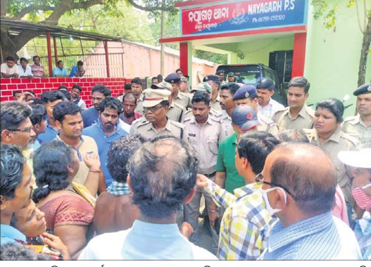
ରୂପସାର ରାତିରେ ବନ୍ଧୁଙ୍କୁ ଶୋଭାଯାତ୍ରା ସମୟରେ ଘଟିଥିବା ହତ୍ୟା ପରେ ଭୟାବ୍ୟ ଲୋକଙ୍କୁ ଏସ୍ପି ନୟାଗଡ଼ ଡାକ୍ତର ଥାନା ସମ୍ମୁଖରେ ବୁଝାଶୁଝା କରୁଛନ୍ତି।