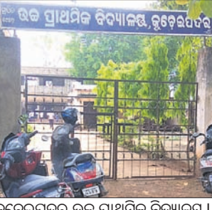
କ୍ରୁଟେଇପଦର ଭଲ ପ୍ରାଥମିକ ବିଦ୍ୟାଳୟ।

ବିକିରି, ୧୫୫ (ଡି.ଏନ୍.ଏ.) ଚୁଲ ବର୍ଷ ପରେ ସ୍କୁଲ ଖୋଲିଛି। ଏଥିପାଇଁ ପିଲାମାନେ ଖୁସି ହୋଇଛନ୍ତି। ଏହା ଘଟିଥିବା ସମୟରେ ପିଲାମାନେ ପଢ଼ିପାରିବେ ବୋଲି ଅଭିଭାବକମାନେ ମଧ୍ୟ ଆଶା ରଖୁଥିଲେ।