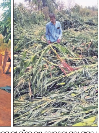
କ୍ଷତିଗ୍ରସ୍ତ ଘର ନିକଟରେ ଜଣେ ଗ୍ରାମବାସୀ। ସାନକ୍ଳୁମାରୀ ଗାଁରେ ନଷ୍ଟ ହୋଇଥିବା ମକା ଫସଲ।