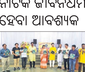
ଦାମନଯୋଡ଼ି, ୧୫୪୪ (ଡି.ଏନ.ଏ.)

ନାଟକ ସମାଜର ପ୍ରତିଫଳନ । ଲୋକଙ୍କ ସ୍ଵଖୁଖୁଖି, ପ୍ରତିଟି ପରିସ୍ଥିତି, ଘଟଣାବଳୀର କଥା କୁହେ ।