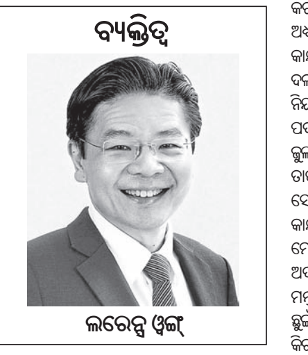
ବ୍ୟକ୍ତିତ୍ୱ ଲରେଡ୍ ଖୁଇଙ୍ଗ

ନିଗର-ରାଷ୍ଟ୍ର ସିଦ୍ଧାପୁରର ପ୍ରଥମ ପ୍ରଧାନମନ୍ତ୍ରୀ ଲି କୁଆନ୍ସୁ ବଡ଼ ପୁଅ ଲି ହେସିଏନ୍ ଲୁଙ୍ଗଙ୍କ ମନ୍ତ୍ରଣାଭଙ୍ଗରେ ଅର୍ଥମନ୍ତ୍ରୀ ଥିବା ଲରେଡ୍ ଖୁଇଙ୍ଗ ଏବେ ପ୍ରଧାନମନ୍ତ୍ରୀ ଘୋଷଣା କରାଯିବା ପରେ ଦେଶବ୍ୟାପୀ ଉତ୍ସାହ ଦେଖାଦେଇଛି । ୪୯ ବର୍ଷୀୟ ଯୁବ ନେତୃତ୍ୱ ସିଦ୍ଧାପୁରକୁ ଏକ ନୂଆ ଶାନ୍ତିରେ ପହଞ୍ଚାଇବେ ବୋଲି ସମସ୍ତେ ଆଶା ରଖୁଛନ୍ତି । ୭୦ ବର୍ଷୀୟ ଲି ଲୁଙ୍ଗ ଦେଶର ତୃତୀୟ ପ୍ରଧାନମନ୍ତ୍ରୀ ଅଛନ୍ତି । ଉପପ୍ରଧାନମନ୍ତ୍ରୀ ହେଇ ସେ କିଙ୍ଗ୍ ଏପ୍ରିଲ ୨୦୨୧ରେ ଦେଶର ଅନ୍ୟତମ ପ୍ରମୁଖ ନେତା ପ୍ରଭୁ ଓହରିଯିବା ପରେ ଲି ଲୁଙ୍ଗ ନୂଆ ନେତା ଭୟନ କରିବା ଲାଗି ପ୍ରକ୍ରିୟା ଆରମ୍ଭ କରିଥିଲେ । ଫଳରେ ଯୁବ ନେତା ଖୁଇଙ୍ଗ ପ୍ରଧାନମନ୍ତ୍ରୀ ପଦବା ଲାଗି ଉପଯୁକ୍ତ ବ୍ୟକ୍ତି ବୋଲି ସ୍ଥିର କରାଯିବା ପରେ ତାଙ୍କ ନାମ ଘୋଷଣା କରାଯାଇଛି । ଲରେଡ୍ ଖୁଇଙ୍ଗ ୧୯୭୨ରେ ଜନ୍ମଗ୍ରହଣ କରିଥିଲେ । ତାଙ୍କର ବଂଶୋଦ୍ଭବ ସିଦ୍ଧାପୁରବାସୀ ଖୁଇଙ୍ଗ ସିଦ୍ଧାପୁରର ହାଏବ ବୟେଜ ପ୍ରାଇମେରୀ ସ୍କୁଲରୁ ପ୍ରାଥମିକ ଶିକ୍ଷା ଶେଷ କରିବା ପରେ ଭିକ୍ଟୋରିଆ କୁନିଂଗର କଲେଜରୁ ଡିଗ୍ରୀ ଅର୍ଜନ କରିଥିଲେ । ଏହା ପରେ ସେ ଆମେରିକାର ଯୁନିଭର୍ସିଟି ଅଫ୍ ଫ୍ଲୋରିଡାରେ ପଢ଼ିବା ପାଇଁ ପଢ଼ିବ ସର୍ଭିସ୍ କମିଶନ ସ୍ଥଳାନ୍ତରିତ୍ ପାଇଥିଲେ । ସେଠାରୁ ସେ ଅର୍ଥନୀତିରେ ବ୍ୟାଚୁଲର ଅଫ୍ ସାଇନ୍ସ ଡିଗ୍ରୀ ଗ୍ରହଣ କରିଥିଲେ । ପରେ ସେ ଯୁନିଭର୍ସିଟି ଅଫ୍ ମିଚିଗାନରୁ ଅର୍ଥନୀତିରେ ସ୍ନାତକୋତ୍ତର କରିଥିଲେ । ପ୍ରତିଭାସମ୍ପନ୍ନ ଖୁଇଙ୍ଗ ମଧ୍ୟ ସାର୍ଭାନ୍ଟି ବିଶ୍ୱବିଦ୍ୟାଳୟର ଜିଏ ଏଫ୍ କେନେଡି ସ୍କୁଲ ଅଫ୍ ବ୍ୟାଜନେସନ୍ସରୁ ପଢ଼ିବ ଆଡ଼ମିନିଷ୍ଟ୍ରେସନରେ ସ୍ନାତକୋତ୍ତର କରିଥିଲେ । ଏହା ପରେ ସେ ସିଦ୍ଧାପୁର ସିଟିଲି ସର୍ଭିସ୍ରେ ଉଚ୍ଚାଧିକାରୀ ହୋଇଥିଲେ । ବାଣିଜ୍ୟ ଓ ଶିଳ୍ପ ମନ୍ତ୍ରଣାଳୟର ସହାୟକ ନିର୍ଦ୍ଦେଶକ (ଗବେଷଣା ଓ ଯୋଜନା) ଭାବେ ୧୯୯୭ରୁ ୧୯୯୯ ଯାଏ କାର୍ଯ୍ୟ