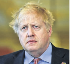
ତାଲିକାରେ ୩ ଭାରତୀୟ ବଂଶୋତ୍ତର

ବ୍ରିଟେନ ପ୍ରଧାନମନ୍ତ୍ରୀ ବୋରିସ୍ ଜନ୍ସନ୍‌ଙ୍କ ଉପରେ ରୁଷିଆ କଟକଣା ଲଗାଇଛି। ଯୁକ୍ତେନ୍ ଯୁଦ୍ଧରେ ଶତ୍ରୁତାପୂର୍ଣ୍ଣ ବ୍ୟବହାର ଦେଖାଇଥିବାରୁ ବୋରିସ୍ ରୁଷିଆ ଆସିପାରିବେ ନାହିଁ ବୋଲି ମଧ୍ୟେ ପକ୍ଷରୁ କୁହାଯାଇଛି। ଏହାସହ ବ୍ରିଟେନ ସରକାରଙ୍କ ମୋଟ ୧୩ ଜଣଙ୍କ ଉପରେ ଏହି ବ୍ୟାନ୍ ଲଗାଯାଇଥିବା ରୁଷିଆ ବହିର୍ବାସୀୟ ମନ୍ତ୍ରଣାଳୟ ପକ୍ଷରୁ କୁହାଯାଇଛି। ସେମାନଙ୍କ ମଧ୍ୟରେ ବ୍ରିଟେନର ବହିର୍ବାସୀୟ ସଚିବ ଲିଭ୍ ଫୁସ୍, ପ୍ରତିରକ୍ଷା ସଚିବ ବେନ୍ ଡ୍ରାଲୋସେ, ଉପପ୍ରଧାନମନ୍ତ୍ରୀ ଲର୍ଡ୍ ଚାନ୍ସେଲର, ମୁଖ୍ୟ ବିଭାଗର ପରରାଷ୍ଟ୍ର ସଚିବ ଜଷ୍ଟିସ୍ ଡୋମିନିକ୍ ରାଭ୍, ୩ ଭାରତୀୟ ବଂଶୋତ୍ତର ଗୃହ ସଚିବ ପ୍ରାଡି ପଟେଲ, ଚାନ୍ସେଲର ରିଶି ସୁନକ ଏବଂ ଆଚରି ଜେନେରାଲ ସୁଏଲ।