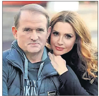
ଭିକ୍ଟୋର ମେଡ଼ଭେଦୁକଙ୍କ ସହ ଓଡ଼ିଆନା ମାଡ଼ରେନକୋ

ରୁଷିଆ ରାଷ୍ଟ୍ରପତି ଭୁଟିନିନ ପୂର୍ବିକ ଘନିଷ୍ଠ ସହଯୋଗୀ କୁହାଯାଉଥିବା ଭିକ୍ଟୋର ମେଡ଼ଭେଦୁକଙ୍କୁ ଯୁକ୍ତେନ୍ ଗୋଇନ୍ଦା ଅଧିକାରୀ ମଙ୍ଗଳବାର ରାତିରେ କରିଥିଲେ। ତାଙ୍କୁ ମାଡ଼ ମରାଯାଇଥିବା ଭିକ୍ଟୋରଙ୍କ ସେଲିବ୍ରିଟି ପ୍ରା ଓଡ଼ିଆନା ମାଡ଼ରେନକୋ ଅଭିଯୋଗ କରିଛନ୍ତି। ଭିକ୍ଟୋରଙ୍କ ଉପରେ ଅତ୍ୟାଚାର ବନ୍ଦ କରି ତାଙ୍କୁ ମୁକ୍ତ କରାଯିବାକୁ ଓଡ଼ିଆନା ଶୁକ୍ରବାର ଏକ ଭିଡିଓ ବାର୍ତ୍ତାରେ ଦାବି କରିଛନ୍ତି। ରାଜନୈତିକ ଶତ୍ରୁତା ରଖାଯାଇ ଭିକ୍ଟୋରଙ୍କୁ ବେଆଇନ ଭାବେ ରାତିରେ କରାଯାଇଥିବା ତାଙ୍କ ପ୍ରା କହିଛନ୍ତି। ପୂର୍ବତନ ବିଧି ସ୍ତର ତଥା 'ଏକ୍ସ ପ୍ୟାକ୍ଟର' ଉପସ୍ଥାପିତା ଓଡ଼ିଆନା ସ୍ୱାମୀ ଭିକ୍ଟୋରଙ୍କୁ ମୁକ୍ତକାରୀ ନିମନ୍ତେ ଦ୍ୱିଗତ ପଦକ୍ଷେପ ନେବାକୁ ଯୁକ୍ତେନ୍ ରାଷ୍ଟ୍ରପତି ଭୋଇଟିନିନ ଜେଲେନ୍ସ୍କିଙ୍କୁ ନିବେଦନ କରିଛନ୍ତି। ଭିକ୍ଟୋର ମେଡ଼ଭେଦୁକ ଯୁକ୍ତେନ୍‌ର ଜଣେ ରାଜନେତା ତଥା ଦେଶର ବିଶିଷ୍ଟ ବ୍ୟକ୍ତି। ପୂର୍ବିକ ସହ ଘନିଷ୍ଠତା ଯୋଗୁ ସେ ସର୍ବଦା ବିବାଦରେ ରହିଆସି। ରୁଷିଆରୁ ଯୁକ୍ତେନ୍ ଆକ୍ରମଣ ପୂର୍ବରୁ ଭିକ୍ଟୋରଙ୍କୁ ଗୃହବନ୍ଦୀ ରଖାଯାଇଥିଲା। ମୁଖ୍ୟବେଳେ ସେ ସହାୟତା ପାଇଥିବାବେଳେ