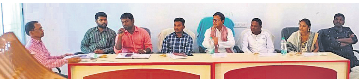
ବୈଠକରେ ଉପସ୍ଥିତ କୋରାପୁଟ ଏମ୍ପି, ବିଡିଓ ଏବଂ ଅନ୍ୟମାନେ ।