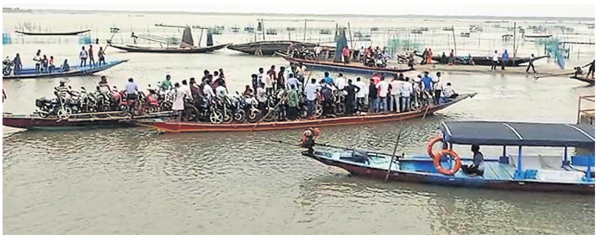
ପରିବହନ ବିବାଦ ଯୋଗୁ ଚିଲିକାରେ ଶନିବାର ତଙ୍ଗାରେ ଫସି ରହିଥିବା ଯାତ୍ରୀମାନେ।