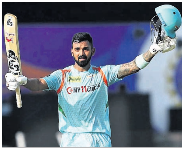
ଶତକ ହାସଲ ପରେ ଲୋକେଶ ରାହୁଲ।

ପୁମ୍ବାଇ, ୧୬/୪ ଚଳିତ ଆଇପିଏଲରେ ମୁମ୍ବାଇ ଇଣ୍ଡିଆନ୍ସ ପରାଜୟ ଧାରା ଭାରି ରହିଛି। ଗୁଜରାଟ ଗ୍ରାଣ୍ଡସ୍ଲ୍ୟାମ୍ ଖେଳରେ ଶନିବାର ଅପରାହ୍ଣରେ ଖେଳାଯାଇଥିବା ଆଇପିଏଲ ଲିଗ ମ୍ୟାଚରେ ମୁମ୍ବାଇକୁ ୧୮ ରନ୍ରେ ଲକ୍ଷ୍ମୀ ସୁପର ଜିଆଣ୍ଟ୍ସ ହରାଇ ଦେଇଛି। ସର୍ବାଧିକ ୫ ଥର ଚାମ୍ପିୟନ ରୋହିତ ଶର୍ମାଙ୍କ ନେତୃତ୍ୱାଧୀନ ଦଳ ପାଇଁ ଏହା କ୍ରମାଗତ ୬ଶ ପରାଜୟ। ଏହି ବିଜୟ ଯୋଗୁ ଲକ୍ଷ୍ମୀ ୮ ପଏଣ୍ଟ ସହ ପଏଣ୍ଟ ଟେବୁଲରେ