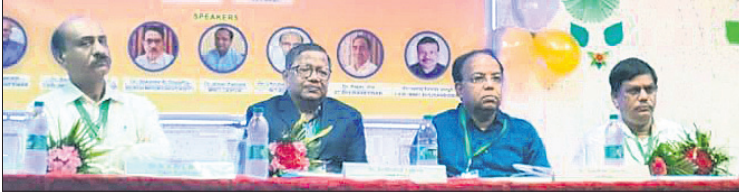
ଉଦ୍ଘାଟନା କାର୍ଯ୍ୟକ୍ରମରେ ଉପସ୍ଥିତ ଅତିଥିମାନେ ।