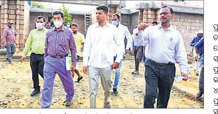
ସୁଆଣ୍ଡୋ ଗ୍ରାମର ବିକାଶ କାର୍ଯ୍ୟକୁ ୫-ଟି ସତିର ଭି.କେ.ପାଞ୍ଚିଆନ ଓ ଅନ୍ୟ ଅଧିକାରୀମାନେ ଅନୁଧ୍ୟାନ କରୁଛନ୍ତି।

ଉତ୍କଳମଣି ପଞ୍ଚିତ ଗୋପବନ୍ଧୁ ଦାସଙ୍କ ଜନ୍ମପୀଠ ପୁରୀ ଜିଲ୍ଲା ସୁଆଣ୍ଡୋ ଗ୍ରାମରେ ଚାଲିଥିବା ଐତିହ୍ୟ ପ୍ରକଳ୍ପର ଅଗ୍ରଗତି ନେଇ ଶନିବାର ମୁଖ୍ୟମନ୍ତ୍ରୀଙ୍କ ସତିର (୫-ଟି) ଭି. କାଳିକେୟ ପାଞ୍ଚିଆନ ସକାଳ ୭ଟାରେ ପରିଦର୍ଶନରେ ଯାଇ ବିକାଶ କାର୍ଯ୍ୟ ଅନୁଧ୍ୟାନ କରିଛନ୍ତି। ପ୍ରଥମେ ପାଞ୍ଚିଆନ ଗୋପବନ୍ଧୁଙ୍କ ଷଠିଘରକୁ ଯାଇ ଉତ୍କଳମଣିଙ୍କ ପ୍ରତି ଶ୍ରଦ୍ଧା ନିବେଦନ କରିଥିଲେ। ଗୋପବନ୍ଧୁଙ୍କ ଦାୟାଦେବୀଙ୍କୁ ଭେଟି ସ୍ମୃତିପାଠ ବିଷୟରେ ଆଲୋଚନା କରିଥିଲେ। ଉତ୍କଳମଣିଙ୍କ ଜନ୍ମପୀଠର ବିକାଶ ପାଇଁ ସରକାରଙ୍କ ପଦକ୍ଷେପର ସେନାରେ ଉଚ୍ଚ ପ୍ରଶଂସା କରିଥିଲେ। ରାଜ୍ୟ ସରକାରଙ୍କ ପକ୍ଷରୁ ଏହାର ପୁନରୁଦ୍ଧାର କାର୍ଯ୍ୟ ହାତକୁ ନିଆଯିବା ସହ ତୁଟ ଗଡ଼ରେ ନିର୍ମାଣ କାର୍ଯ୍ୟ ଜାରି ରହିଛି। ଶିବ ମନ୍ଦିର, ବୁଦ୍ଧି ଚୋଖରୀ, ପୈତୃକ ବାସଗୃହ, ଗ୍ରାମକୁ ଉନ୍ନତ ରାସ୍ତା, ଭୁକ୍ତ ବିଦ୍ୟୁତ ଯୋଗାଣ ବ୍ୟବସ୍ଥା, ପାନୀୟ ଜଳ ଯୋଗାଣ, ପକ୍ଷୀମାନଙ୍କୁ ଛକ ଠାରୁ ଗୋପବନ୍ଧୁଙ୍କ ଷଠିଘର ପର୍ଯ୍ୟନ୍ତ ରାସ୍ତାକୁ ଖଣ୍ଡାଲଟ ପଥରେ ବୋହରି କରଣ କରାଯିବ, ଭାର୍ଗବୀ ନଦୀରେ ବୋଟି, ଅତ୍ୟଧୁନିକ ଲୋକ ବ୍ୟବସ୍ଥା ଓ ଖାଦ୍ୟ ପାର୍କ, ପୁଲିକ୍ସମାନ ନିର୍ମାଣ କାର୍ଯ୍ୟକୁ ୫-ଟି ସତିର ବୁଲି ଦେଖିଥିବା ବେଳେ ୨୦୦୩ ମାସ ମଧ୍ୟରେ ନିର୍ମାଣ କାର୍ଯ୍ୟ ଶେଷ କରିବାକୁ ଜିଲ୍ଲାପାଳଙ୍କୁ ନିର୍ଦ୍ଦେଶ ଦେଇଛନ୍ତି।