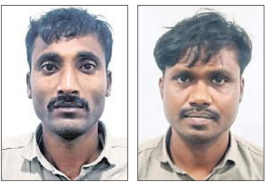
ଗିରଫ ୨ ଅଭିଯୁକ୍ତ

ଏହି ଗ୍ୟାଙ୍ଗର ମାଷ୍ଟରମାଲଟ୍ ସହ ୫ ଜଣ ଦେହାନ୍ତ ଥିବାବେଳେ ସେମାନଙ୍କୁ କମିଶନରେଟ୍