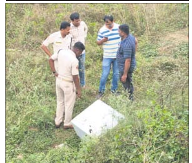
ଗିରଫ ୨ ଅଭିଯୁକ୍ତ