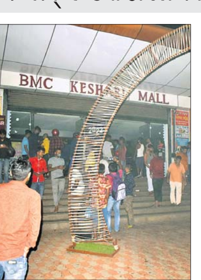
କିରିବେ ଏବଂ ସ୍ୱଳ୍ପ ଦେୟରେ ଅଧିକ ଉପକୃତ ହୋଇପାରିବେ ସେଥିପାଇଁ ଚେଷ୍ଟା କରି ରହିବ । ଏପରିକି ସଂଗଠିତ ରହିଥିବା ଅନ୍ୟ ବିଏମ୍‌ସି ସହଯୁକ୍ତ ବ୍ୟବସାୟୀ ସଂଗଠନକୁ ଏଥିପାଇଁ ପ୍ରୋତ୍ସାହିତ କରାଯିବ ବୋଲି ଚେତୁଟି କମିଶନର