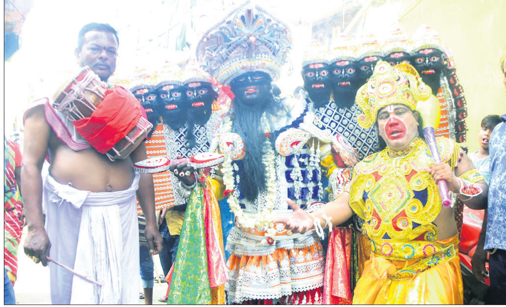
ଦୋଳନାଟ ସାହିର ରାବଣ, ହନୁମାନ ବେଶଧାରୀ ସାହି ପରିକ୍ରମା କରୁଛନ୍ତି ।