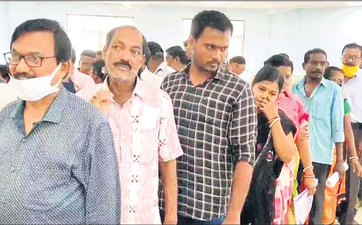
ଚିକିତ୍ସା ପାଇଁ ଲମ୍ବା ଧାଡ଼ିରେ ଛିଡ଼ା ହୋଇଥିବା ରୋଗୀ।