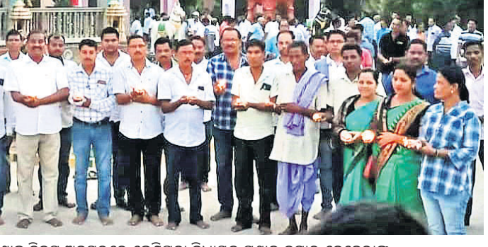
୧୭ କୁଷ୍ଠର ବୁଲିବ ରଥ ୧୭ କୁଷ୍ଠର ବୁଲିବ ରଥ ୧୭ କୁଷ୍ଠର ବୁଲିବ ରଥ