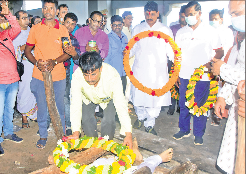
ଗଣଶିକ୍ଷା ମନ୍ତ୍ରୀ ସମୀର ରଞ୍ଜନ ଦାଶ ସଙ୍ଗୀତଜ୍ଞ ପ୍ରଫୁଲ୍ଲ କରଙ୍କ ଶବାଧାରରେ ଶ୍ରଦ୍ଧାଞ୍ଜଳି ଦେଇଛନ୍ତି ।