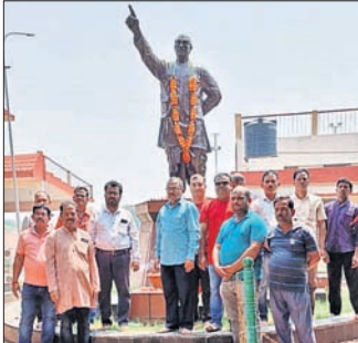
ଡେଙ୍କାନାଳରେ ବିଜୁବାବୁଙ୍କ ପ୍ରତିମୂର୍ତ୍ତିର ମାଲ୍ୟବର୍ଣ୍ଣ କରାଯାଇଛି।

ଡେଙ୍କାନାଳ, ୧୮/୪(ଡି.ଏନ.ଏ.)- ନାଲକୋ ଏବଂ ଏମ୍.ଏ.ଏ.ସି.ସି.ରୁ ବିଜୁବାବୁଙ୍କ ବିରୋଧୀ ଦିବସ ପାଳିତ ହୋଇଯାଇଛି। ନାଲକୋ ଅଧିକାରୀମାନେ ଯୋଗଦେଇ ପ୍ରତିମୂର୍ତ୍ତିରେ ପୁଷ୍ପମାଳ୍ୟ ଅର୍ପଣ କରିଥିଲେ।