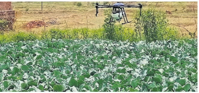
ଡ୍ରୋନ୍ ବ୍ୟବହାର ସମ୍ପର୍କରେ ପ୍ରଶିକ୍ଷଣ ଦିଆଯାଇଛି।

ଡ୍ରୋନ୍ ବ୍ୟବହାର ସମ୍ପର୍କରେ ପ୍ରଶିକ୍ଷଣ ଦିଆଯାଇଛି। ଡ୍ରୋନ୍ ସହାୟତାରେ ରାଷ୍ଟ୍ରୀୟ ଆୟ ଦୁଗୁଣିତ କରିବ ଡ୍ରୋନ୍। ଡ୍ରୋନ୍ ସହାୟତାରେ ରାଷ୍ଟ୍ରୀୟ ଆୟ ଦୁଗୁଣିତ କରିବ ଡ୍ରୋନ୍।