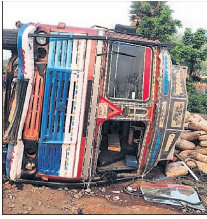
ଦୁର୍ଘଟଣା ପରେ ଓଲଟି ପଡ଼ିଥିବା ଟ୍ରକ୍