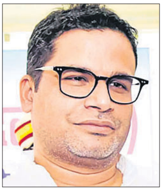
ସମାଜିକା ପ୍ରିୟଙ୍କା ଗାନ୍ଧୀ ଭ୍ରାତୃ, ବରିଷ୍ଠ ନେତା ପୁରୁଲୁ ଖୁସିନିକ, ରଣଦୀପ୍