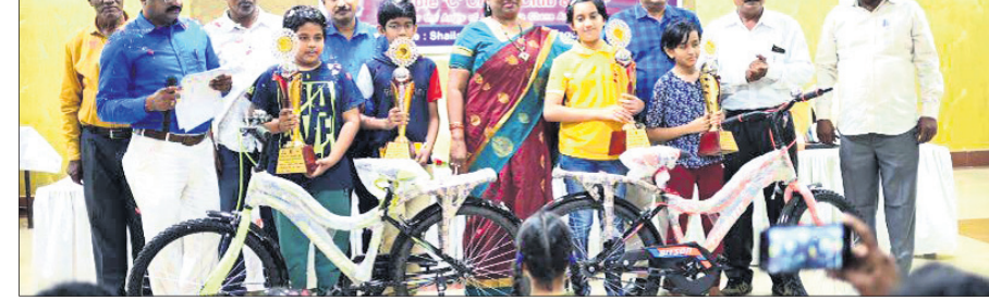
ରାଜ୍ୟ ଚେମ୍ପିୟନ କ୍ୱାଡ୍ରା ପ୍ରତିନିଧି ପୁରସ୍କାର ସହ ଅତିଥିକ ରହିଛନ୍ତି।

ହରାଇଥିବାବେଳେ ପ୍ରାୟତଃ ଚଳିତ ହେତୁର ମ୍ୟାଚରେ ୨-୪ ଗୋଲରେ ହାରି ଯାଇଥିଲା। ତେବେ ପର ମ୍ୟାଚରେ ଦକ୍ଷିଣ ଆଫ୍ରିକାକୁ ପୁଣି ୧୦-୨ ଗୋଲରେ ହରାଇ ଭାରତୀୟ ଦଳ ସଫଳ ପ୍ରତ୍ୟାବର୍ତ୍ତନ କରିଥିଲା। ଘରୋଇ ପରିବେଶରେ କଳିଙ୍ଗ ଷ୍ଟାଡ଼ିୟମରେ ଭାରତୀୟ ପୁରୁଷ ହକି ଦଳ ଗୋଟିଏ ମ୍ୟାଚ ଖେଳି ଥିଲା। ଷ୍ଟେଡ଼ିୟମ ପ୍ରଥମ ମ୍ୟାଚରେ ୫-୪ ଗୋଲରେ ହରାଇଥିବା ବେଳେ ଦ୍ୱିତୀୟ ମ୍ୟାଚରେ ୩-୫ ଗୋଲରେ ପରାସ୍ତ ହୋଇଥିଲା। “ଜର୍ମାନୀ ବିପକ୍ଷ ଦ୍ୱିତୀୟ ମ୍ୟାଚ କଷ୍ଟସାଧ୍ୟ ଥିଲା। ଆମର ଦିନିକିଆରେ କିଛିଟା ତ୍ରୁଟି ପରିଲକ୍ଷିତ ହୋଇଥିଲା। ତେଣୁ ଆଗାମୀ ମ୍ୟାଚ ଖେଳିବା ପୂର୍ବରୁ ଆମକୁ ଏହି ବିଭାଗ ଉପରେ କାର୍ଯ୍ୟ କରିବାକୁ ହେବ” —ଅଧିକାରୀ ଲୋକେନାଥ ପୁରୀ