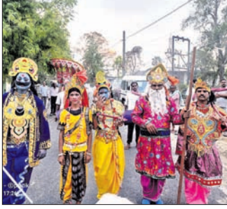
ଡେଙ୍କାନାଳରେ ମା'ଗ୍ରାମେଶ୍ୱରୀଙ୍କ ବାର୍ଷିକ ପୂଜା ପାଳିତ ହୋଇଥିଲା।

ମା'ଗ୍ରାମେଶ୍ୱରୀଙ୍କ ମହୋତ୍ସବ ୧୯/୪/୨୨(ଡି.ଏନ.ଏ.)- ୧୯/୪/୨୨ ମଙ୍ଗଳବାର ଦିନ ଡେଙ୍କାନାଳ ଜିଲ୍ଲାରେ ଡେଙ୍କାନାଳ ଉପଖଣ୍ଡରେ ମା'ଗ୍ରାମେଶ୍ୱରୀଙ୍କ ବାର୍ଷିକ ପୂଜା ପାଳିତ ହୋଇଯାଇଛି।