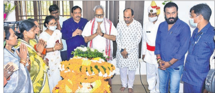
ରାଜ୍ୟପାଳ ପ୍ରଫେସର ଡ. ଗଣେଶୀ ଲାଲ ଓ ଅନ୍ୟମାନେ ଶ୍ରଦ୍ଧାଞ୍ଜଳି ଅର୍ପଣ କରୁଛନ୍ତି ।