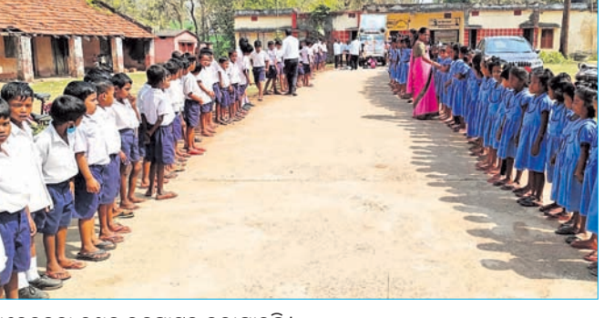
ଡେଙ୍କାନାଳରେ ଶିକ୍ଷାର ବାର୍ତ୍ତା ପହଞ୍ଚିବ।

ଡେଙ୍କାନାଳ ଜିଲ୍ଲା କଳହାତ୍ୱାଡ଼ ବ୍ଲକ୍ ଉପଖଣ୍ଡରେ ଶିକ୍ଷାର ବାର୍ତ୍ତା ପହଞ୍ଚିବ। ଡେଙ୍କାନାଳ ଜିଲ୍ଲା କଳହାତ୍ୱାଡ଼ ବ୍ଲକ୍ ଉପଖଣ୍ଡରେ ଶିକ୍ଷାର ବାର୍ତ୍ତା ପହଞ୍ଚିବ।