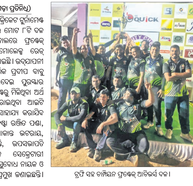
ଟ୍ରେନିଂ ସହ ଚାମ୍ପିୟନ ଫ୍ରାଣ୍ଟ ଆତିକାର୍ଯ୍ୟ ଦଳ।