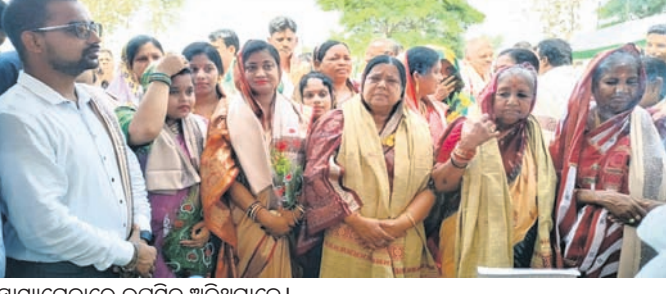
ସ୍ୱାସ୍ଥ୍ୟମେଳାରେ ଉପସ୍ଥିତ ଅତିଥିମାନେ।