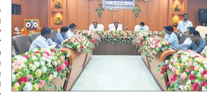
ବିସିସି ବ୍ୟାଙ୍କର ସାଧାରଣ ଅଧିବେଶନ