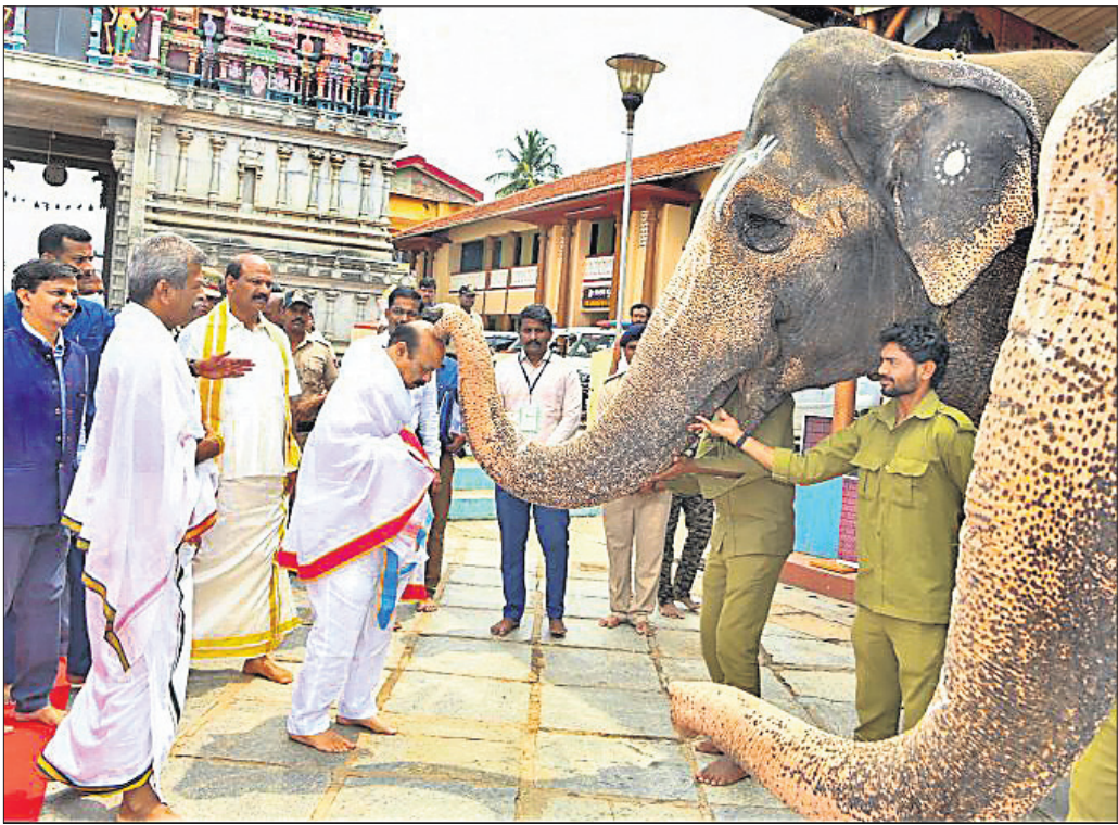
କର୍ମଚାରୀଙ୍କୁ ପୁଷ୍ୟପତ୍ରୀ ବାସବରାଜ ବେମାଳ ମଙ୍ଗଳବାର ଶ୍ରୀ ଶ୍ରୀଲେଖି ଶାରଦା ପୀଠ ଦର୍ଶନ ବେଳେ ହାତୀଠାରୁ ଆଶୀର୍ବାଦ ନେଉଛନ୍ତି।