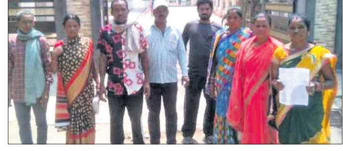
ପାଣି ସମସ୍ୟା ଜଣାଇବାକୁ ଆସିଥିବା ଗ୍ରାମବାସୀ।

ପାରଳାଖେମୁଣ୍ଡି, ୧୯୪୪(ଡି.ଏନ୍.ଏ.) ଗଜପତି ଜିଲା ଗୁମ୍ଫା ବ୍ଲକ୍ କୁଳାସିଂ ପଞ୍ଚାୟତ ଗିରାମଣ୍ଡଳସାହି ଗ୍ରାମବାସୀ ପାନୀୟ ଜଳ ପାଇଁ ନାହିଁ ନ ଥିବା ଅସୁବିଧାର ସମ୍ମୁଖୀନ ହେଉଛନ୍ତି। ଏହାର ସମାଧାନ ପାଇଁ ଗ୍ରାମବାସୀ ପାରଳାଖେମୁଣ୍ଡି ଆସି ଜିଲାପାଳଙ୍କ ଦ୍ୱାରସ୍ଥ ହୋଇଛନ୍ତି। ଗାଁରେ ଏକ ସୌରଚାଳିତ ନଳକୂପ ସ୍ଥାପନ ନିମନ୍ତେ ନିବେଦନ କରିଛନ୍ତି। ଗ୍ରାମରେ ୪୦ରୁ