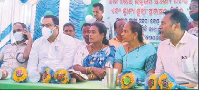
କାର୍ଯ୍ୟକ୍ରମରେ ଉପସ୍ଥିତ ଅତିଥି।