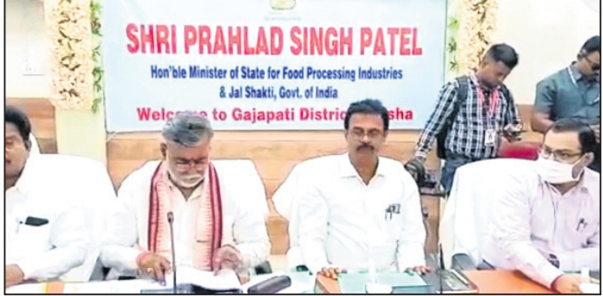
ସମୀକ୍ଷା ବୈଠକରେ ଉପସ୍ଥିତ କେନ୍ଦ୍ରମନ୍ତ୍ରୀ ଓ ଅନ୍ୟମାନେ।

ଅଧିକାରୀଙ୍କ ସହ ଆଲୋଚନା କରିଥିଲେ। ଜିଲାର ବିକାଶ ଦିଗରେ ପ୍ରଶଂସା ଦେଇ ଜିଲାପାଳଙ୍କୁ ପ୍ରଶଂସା କଲେ। ପାନୀୟ ଜଳ ଓ ରାସ୍ତା