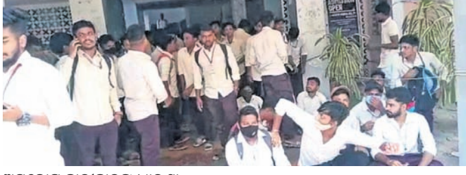
ଅସନ୍ତୋଷ ଛାତ୍ରାଛାତ୍ରୀଙ୍କ ଧାରଣା

କେନ୍ଦ୍ରକରି ମଙ୍ଗଳବାର ଛାତ୍ରାଛାତ୍ରୀମାନେ ବିଶ୍ୱବିଦ୍ୟାଳୟ ପରିସରରେ ଅଧ୍ୟକ୍ଷଙ୍କ କାର୍ଯ୍ୟାଳୟ ସମ୍ମୁଖରେ ପୂର୍ବଦ୍ୱାରା ୧୯୮୪ରୁ ବିଦ୍ୟାଳୟରେ ପଢ଼ିଆଇଥିବା ଛାତ୍ରାଛାତ୍ରୀଙ୍କୁ ନିମନ୍ତେ ପ୍ରମୋକ୍ଷଣ ସହ ବିକଳ ମାର୍ଚ୍ଚିକା ବ୍ୟବସ୍ଥା କରାଯାଇଥିଲା। ତେବେ ବର୍ତ୍ତମାନ ଖଲ୍ଲିକୋଟ ବିଶ୍ୱବିଦ୍ୟାଳୟ କର୍ତ୍ତୃପକ୍ଷ ଏହାକୁ ଅଣଦେଖା କରିଥିବା ନେଇ ଛାତ୍ରାଛାତ୍ରୀ ମହଲରୁ ଅଭିଯୋଗ ହୋଇଛି।