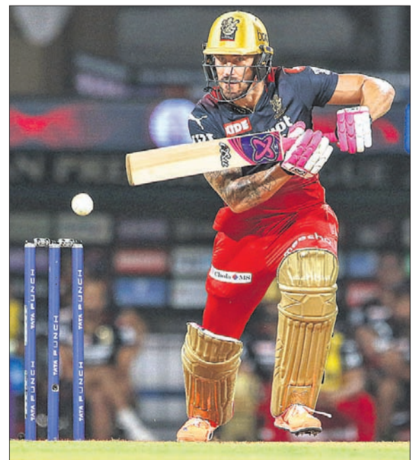
ଶତ ଖେଳୁଛନ୍ତି ଫାୟ ତୁ'ପ୍ଲେସି।