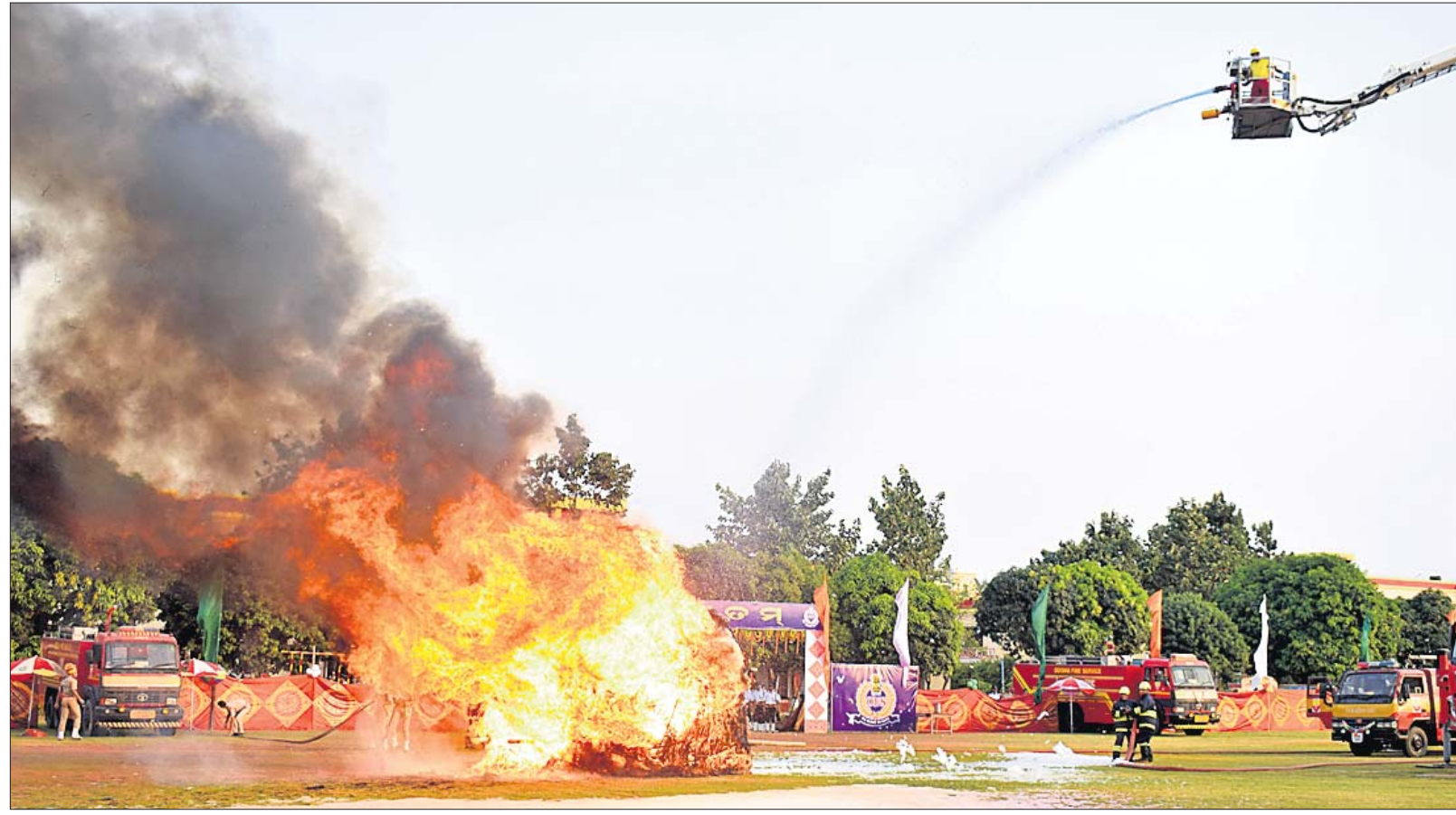
ଭୁବନେଶ୍ୱର ବରମୁଣ୍ଡାସ୍ଥିତ ଓଡ଼ିଶା ଫାୟାର ଆଣ୍ଡ ଟିକାସ୍‌ର ରେଭ୍ୟୁର୍ ଏକାଡେମୀ ପକ୍ଷରୁ ୬୮ତମ ଅଗ୍ନିଶମ ସେବା ସପ୍ତାହ ପାଳନ ଅବସରରେ ମଙ୍ଗଳବାର ମନୁଜ୍ଞ ପ୍ରଦର୍ଶନ କରାଯାଇଛି।