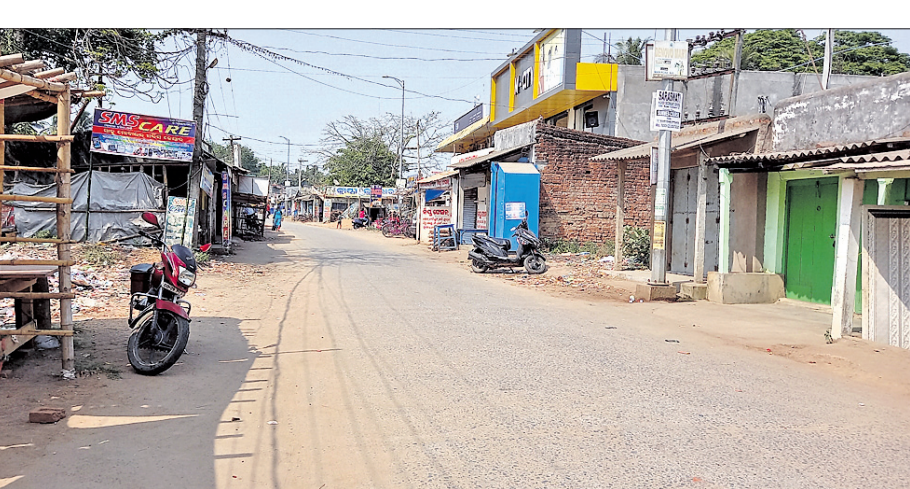
ଖରା ଯୋଗୁ ଆଳି ବଜାର ଶୁନଶାନ ହୋଇଯାଇଛି।

ଦିନକୁ ଦିନ ଗ୍ରାମ୍ୟ ପ୍ରବାହ ବୃଦ୍ଧିର ଲାଗିଛି। କେନ୍ଦ୍ରାପଡା ଜିଲ୍ଲା ଆଳି ଅଞ୍ଚଳରେ ଚାପପାତ୍ରା ୪୦ ଡିଗ୍ରୀ ପରେ ରହୁଛି। ତହସିଲ ଖରାରେ ସିଝିବାର ଲାଗି ସମସ୍ତ ଆଳି ଅଞ୍ଚଳ। ସକାଳ ୮ ଘଣ୍ଟା ପରେ ଅଞ୍ଚଳର ଚାପପାତ୍ରା ବୃଦ୍ଧି ସହ ଖଞ୍ଜି ପବନରେ ଅଞ୍ଚଳର ଜନଜୀବନ ଅସ୍ତବ୍ୟସ୍ତ ହୋଇପଡୁଛି। ପୁଣ୍ୟପାଳ ଖରା ଯୋଗୁ ଦିନ ୧୦ ଘଣ୍ଟା ପରେ ଅଞ୍ଚଳର ରାସ୍ତାଯାତ୍ର ଶୁନଶାନ ହୋଇପଡୁଛି। ଅଞ୍ଚଳର ପ୍ରମୁଖ ବ୍ୟବସାୟ ପୋଷ୍ଟାଫିସ୍ ହେଉଛି ଆଳି ବଜାର। ଏହି ବଜାର ଉପରେ ଅଞ୍ଚଳର ହଜାର ହଜାର ଲୋକ ବିଭିନ୍ନ କାର୍ଯ୍ୟ ନିମନ୍ତେ ଆସିଥାନ୍ତି। ଅପରପକ୍ଷରେ ଆଳି ଅଞ୍ଚଳର ସମସ୍ତ ସରକାରୀ କାର୍ଯ୍ୟାଳୟ ସରକାରୀ ଅଧିକାରୀଙ୍କୁ ବେଶ୍ ପ୍ରସାଦ ଦାସଙ୍କୁ ପଚାରିବାରୁ କାର୍ଯ୍ୟାଳୟ ଅଞ୍ଚଳରେ ବସିଥିବା ହିତାଧିକାରୀ ଫେବୃୟାରୀ, ମାର୍ଚ୍ଚ ମାସର ଚାଉଳ ପାଇ ନ ଥିବା ନେଇ ଅଭିଯୋଗ କରିଛନ୍ତି। ଚାହାର ତଦନ କରାଯାଇ କାର୍ଯ୍ୟାନୁଷ୍ଠାନ ନିଆଯିବ ବୋଲି କହିଛନ୍ତି।