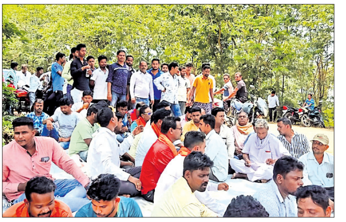
ଫେଡ୍ରେକେସନ ଯାତ୍ରାରେ ଯୁବକମାନେ ବିଶୋଭ ପ୍ରଦର୍ଶନ କରୁଛନ୍ତି।

କମ୍ପାନୀରେ ସ୍ଥାନୀୟ ବେକାରଙ୍କୁ ନିଯୁକ୍ତି ଦାବି କରି କମ୍ପାନୀ ଫେଡ୍ରେକେସନ ଯାତ୍ରାରେ ମଙ୍ଗଳବାର ହଜାର ହଜାର ଯୁବକ ବିଶୋଭ ପ୍ରଦର୍ଶନ କରିଛନ୍ତି। ପାରାଦାପ ଟେକ୍ସଟାଇଲ୍ କମ୍ପାନୀରେ ପ୍ରକଳ୍ପରେ କାର୍ଯ୍ୟରତ ଠିକା କମ୍ପାନୀ ଟେକ୍ସଟାଇଲ୍ ପ୍ରକଳ୍ପରେ ଲିମିଟେଡ୍ କୁଜଙ୍ଗ ଅନ୍ତର୍ଗତ ପ୍ରସ୍ତୁତିଆଠାରେ ଏକ ଫେଡ୍ରେକେସନ ଯାତ୍ରା କରିଛି। ଏଠାରେ ବଡ଼ ବଡ଼ କର୍ମଚାରୀଙ୍କୁ ନିଯୁକ୍ତି ଦାବି କରି କମ୍ପାନୀ ଫେଡ୍ରେକେସନ କାମ ହେବ। ଏନେଇ ବହୁ ସଂଖ୍ୟାରେ ଶ୍ରମିକଙ୍କ ଆବେଦନ ରହିଛି। ବିଶେଷକରି ଖେଳତର, ରିଗର, ମେକାନିକାଲ ଇଞ୍ଜିନିୟର, କଟର ସମେତ ବିଭିନ୍ନ ମେକାନିକାଲ କାମ ପାଇଁ କୁଶଳୀ, ଅଣକୁଶଳୀ ଓ ଅର୍ଦ୍ଧକୁଶଳୀ ଶ୍ରମିକଙ୍କ ଆବେଦନ ରହିଛି। ଏଥିରେ କମ୍ପାନୀ କର୍ତ୍ତୃପକ୍ଷ ସ୍ଥାନୀୟ ବେକାରଙ୍କୁ ନିଯୁକ୍ତି ନ ଦେଇ ବାହାର ରାଜ୍ୟରୁ ଶ୍ରମିକ ଆଣି କାମ କରାଇବା ପାଇଁ ମନୁଷ୍ୟ କରିଥିବା ଅଭିଯୋଗ ହୋଇଛି। ପ୍ରତିବାଦରେ ଯୁବକମାନେ ଟ୍ରକ୍ ଯାତ୍ରାରେ ଯାତ୍ରା ନିକଟରେ ଧାରଣା ଦେଇଛନ୍ତି।