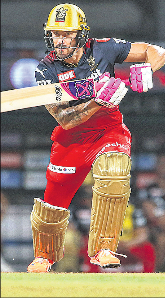
ପ୍ଲେସି ଅଫ୍ ଦି ମ୍ୟାଚ୍ ଫାଟ୍ ଡୁ'ପ୍ଲେସି।

ଅଧିନାୟକ ଫାଟ ଡୁ'ପ୍ଲେସିଙ୍କ ୯୬ ରନ୍‌ର ଇନିଂସ ପରେ କୋଶ ହାଜେଲଉଡ୍‌ଙ୍କ ଦମଦାମ ବୋଲିଂ ଯୋଗୁ ରୟାଲ ଚ୍ୟାଲେଞ୍ଜର୍ସ ବାଙ୍ଗାଲୋର (ଆରସିବି) ୧୮ ରନ୍‌ରେ ଲକ୍ଷ୍ମୀ ସୁପର ଜିଆଣ୍ଟ୍ସ ହରାଇ ଦେଇଛି। ଏହି ବିକ୍ରୟ ଯୋଗୁ ଆରସିବି ୭ ମ୍ୟାଚ୍‌ରୁ ୧୦ ପଏଣ୍ଟ୍ ସହ ଡାଲିକାରେ ଡିଟାୟ ଗ୍ଲାନକୁ ଉନ୍ନାତ ହୋଇଛି। ଅନ୍ୟପକ୍ଷରେ ଲକ୍ଷ୍ମୀ (୮ ପଏଣ୍ଟ୍) ୭ ମ୍ୟାଚ୍‌ରୁ ୩ୟ ପରାଜୟ ସହ ଚତୁର୍ଥ ସ୍ଥାନରେ ରହିଛି। ଚନ୍ଦ୍ର ଛିଟ ଲକ୍ଷ୍ମୀ ଅଧିନାୟକ ଲୋକେଶ ରାହୁଲ ବୋଲିଂ ନିଷ୍ପତ୍ତି ନେଇଥିଲେ, ଯାହାକୁ ସଠିକ୍