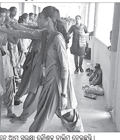
ଛାତ୍ରାମାନେ ଆତ୍ମ ସୁରକ୍ଷା କୌଶଳ ତାଲିମ ନେଉଛନ୍ତି ।

ରାଜ୍ୟ ସରକାରଙ୍କ ମୁକାମତି-୨୦୧୩ ଅନୁଯାୟୀ ଉଚ୍ଚ ମାଧ୍ୟମିକ ଶିକ୍ଷା ନିର୍ଦ୍ଦେଶାଳୟ, ଭୁବନେଶ୍ୱର ନିର୍ଦ୍ଦେଶିତ ତଥା ଇଟାମାଟି ଶିକ୍ଷା ଓ ବିଷୟିକ କନିଷ୍ଠ ମହାବିଦ୍ୟାଳୟ(ନୋଡାଲ କଲେଜ) ତଦ୍ୱାବଧାନରେ ଏହି ୮ ଦିନିଆ ତାଲିମ ଶିବିର ଅନୁଷ୍ଠିତ ହେବ ।