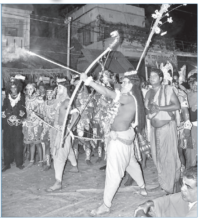
୩୫ ଫୁଟ ଉଚ୍ଚ କାଠନିର୍ମିତ ରାବଣଙ୍କ ସହିତ ଶ୍ରୀରାମଙ୍କ ମୁକ୍ତ ହେଉଥିବା ଦୃଶ୍ୟ ।