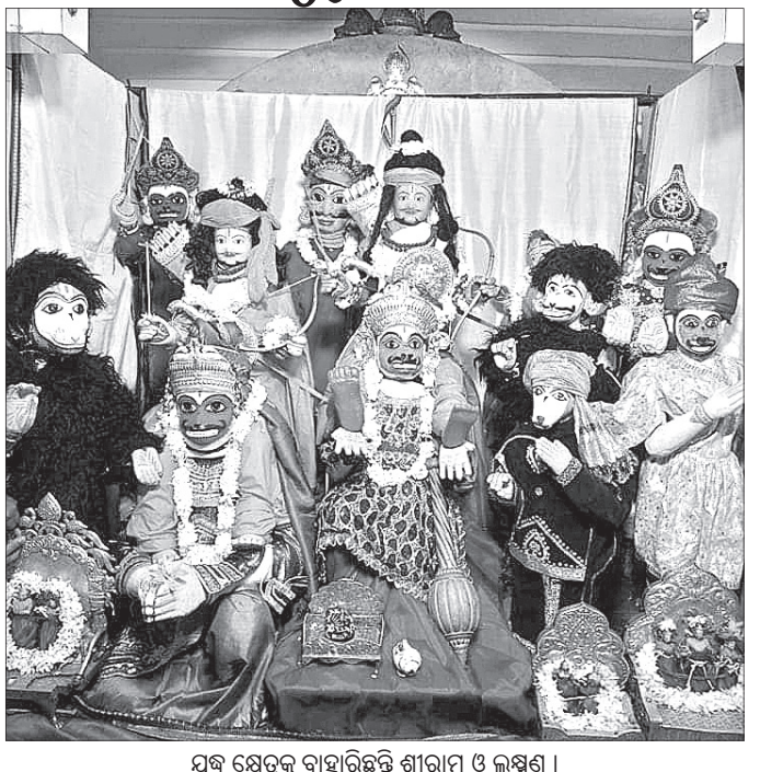
ଯୁଦ୍ଧ କ୍ଷେତ୍ରକୁ ବାହାରିଛନ୍ତି ଶ୍ରୀରାମ ଓ ଲକ୍ଷ୍ମଣ ।

ଓଡ଼ିଶା, ୧୯୮୪(ସ୍ୱ.ପ୍ର.) ଶ୍ରୀରାମ ଅନୁରୂପ ବନ୍ଧୁର ଦିବ୍ ବର୍ଣ୍ଣନ ବେଦା ଓଡ଼ିଶାରେ ଚାଲିଥିବା ପ୍ରସିଦ୍ଧ ଶ୍ରୀରାମ ସହିତ ରଘୁବୀର ଅଯୋଧ୍ୟା ଫେରିବେ ।