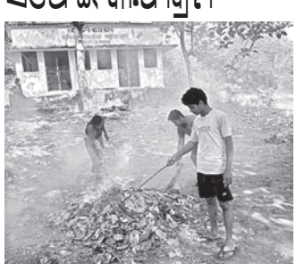
ଖଣ୍ଡପଡ଼ା, ୧୯୮୪(ସ୍ୱ.ପ୍ର.): ମା'ନାରାୟଣଙ୍କ ପୀଠ ପରିସରକୁ ଭାଜାପା କର୍ମକର୍ତ୍ତା, କର୍ମୀ ଓ ସାମାଜିକ କର୍ମୀମାନେ ସଫେଇ କରିଛନ୍ତି ।