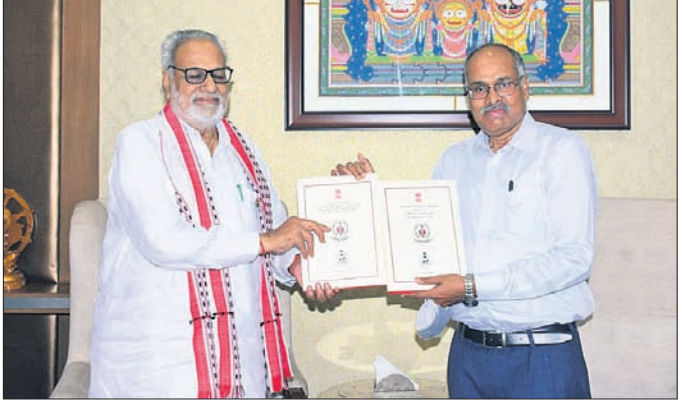
ଭୁବନେଶ୍ୱର, ୨୦୧୪ (ଭୁବନେଶ୍ୱର)