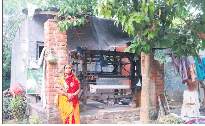
ପରିସ୍ଥିତି ତଳେ ଥିବା ରୁଣ୍ଡାନ୍ତର ରକ୍ଷିତା ଦାସଙ୍କ ଚନ୍ଦ୍ରଶାଳା

ଯୋଜନା ରହିଛି । ଏହିସବୁ ଯୋଜନା ୨୦୦୫-୦୬ ବର୍ଷଠାରୁ ଆର୍ଥିକ ୧୬ ବର୍ଷ ହେଲା କାର୍ଯ୍ୟକାରୀ ହେଉଛି । ଏହାବ୍ୟତୀତ ମୁଖ୍ୟମନ୍ତ୍ରୀଙ୍କ ଦ୍ୱାରା ଅନୁମୋଦିତ ସ୍ୱତନ୍ତ୍ର ପରିବାରଙ୍କୁ ଅଗ୍ରାଧିକାର ଭିତ୍ତିରେ ବାସଗୃହ, ଚନ୍ଦ୍ରଶାଳାରେ ଉଲ୍ଲେଖକରଣ ପାଇଁ ୭୦୦୦ ଟଙ୍କା ସହାୟତା, ଜନଭର୍ତ୍ତର ସହ ପଞ୍ଜୀ, ସାଧାରଣ ସୁବିଧା କେନ୍ଦ୍ର ଓ ଗୋଦାମ ଗୃହ, ବିକ୍ରୟ କେନ୍ଦ୍ର ଆଦି ବ୍ୟବସ୍ଥା ରହିଛି । ହେଲେ ଏହିସବୁ ଯୋଜନାକୁ ଅଧିକାଂଶ ରୁଣ୍ଡାନ୍ତର ପରିବାର ବଞ୍ଚିତ ହୋଇଛନ୍ତି । ଯୋଜନାର ସଫଳତା ପାଇବାକୁ ଗରିବ ରୁଣ୍ଡାନ୍ତରମାନେ ଗତ ୧୬ ବର୍ଷ ହେଲା ଆଶାବାହି ବସିଛନ୍ତି । ଉପରୋକ୍ତ କାରଣରୁ ୨୦୧୫-୧୬ ବର୍ଷରେ ୩୭୮୦୬.୭୯ ଲକ୍ଷ ଟଙ୍କାର କର୍ମଚାରୀ ଉତ୍ପାଦନ ହୋଇଥିଲାବେଳେ ତାହା ୨୦୨୦-୨୧ରେ ୨୮୭୭୭.୪୨ ଲକ୍ଷ ଟଙ୍କାକୁ