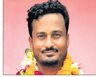
ଓସିମ ଏଜଦାନୀ କାଦ୍ରୀ

ପ୍ରକାଶ ଯେ, ଗତ ମାର୍ଚ୍ଚ ୨୪ରେ ମତଦାନ ସମୟରେ ହିଂସାକାଣ୍ଡ ଯୋଗୁ ଏନ୍ଏସି ନିର୍ବାଚନ ବାଧାପ୍ରାପ୍ତ ହୋଇଥିଲା । ପରେ ଏପ୍ରିଲ ୪ରେ ୨ଟି ବ୍ଲକ୍ରେ ସାନି ମତଦାନ ହୋଇଥିଲା । ଏନ୍ଏସି ଅଧ୍ୟକ୍ଷ ପଦବା ବିଜେତ ହାତକୁ ଯାଇଥିଲା । ସେହିପରି ୧୧ ଖ୍ରୀଷ୍ଟ ଉପାଧ୍ୟକ୍ଷ ଭାବେ ନିର୍ବାଚିତ ହୋଇଛନ୍ତି ।