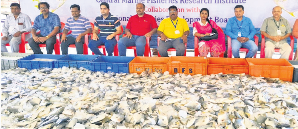
ବିଶେଷଜ୍ଞଙ୍କ ଉପସ୍ଥିତିରେ ଅମଳ ହୋଇଥିବା ପମ୍ପାନୋ ମାଛ।