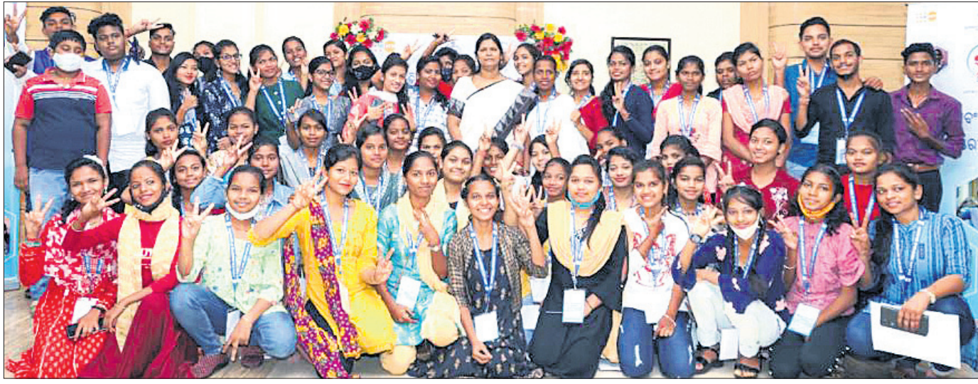
ଆତ୍ମ ଉନ୍ମୋଚନ ଅବସରରେ ଅନ୍ୟମାନଙ୍କ ସହ ମହିଳା ଓ ଶିଶୁ ବିକାଶ ଏବଂ ମିଶନ ଶକ୍ତି ମନ୍ତ୍ରାଳୟ ଦ୍ୱାରା।

ବାଲ୍ୟ ବିବାହ ହୋଇବା ପାଇଁ ରାଜ୍ୟ ସରକାରଙ୍କ 'ଅତ୍ମ ନାଥମ' କାର୍ଯ୍ୟକ୍ରମକୁ ଅଧିକ ପ୍ରସାର ଓ ସର୍ବଜନୀନ କରିବା ଲାଗି ପ୍ରସ୍ତୁତ ହୋଇଛି 'ଅତ୍ମ ନାଥମ'। ରୁଧିର ମହିଳା ଓ ଶିଶୁ ବିକାଶ ଏବଂ ମିଶନ ଶକ୍ତି ମନ୍ତ୍ରାଳୟ ଦ୍ୱାରା ସହାୟତା ଉନ୍ମୋଚନ କରାଯାଇଛି। ୨୦୨୦ ଅକ୍ଟୋବରରେ ଆରମ୍ଭ ହୋଇଥିବା ଅତ୍ମ ନାଥମ କାର୍ଯ୍ୟକ୍ରମ ଅତ୍ୟାଧୁନିକ ରାଜ୍ୟ ପ୍ରତ୍ୟେକ ଅଞ୍ଚଳରେ କେନ୍ଦ୍ରରେ ପହଞ୍ଚିପାରିଛି। ୧୨ ଲକ୍ଷ କିଶୋରୀକିଶୋରଙ୍କ ଦକ୍ଷତା, ଶିକ୍ଷା, ଜୀବନକୌଶଳ ଆଦିରେ ଉନ୍ନତ ଅଣାଇ ସମାଜର ପୁଖ୍ୟସ୍ତ୍ରୋତରେ ସାମିଲ କରାଯାଇପାରିଛି। ସେମାନେ ଏହି ବୈଷୟିକ ଜ୍ଞାନ କୌଶଳ ସମ୍ପନ୍ନ ଆତ୍ମ ନାଥମରେ ଜୀବନ କୌଶଳ ସମ୍ପନ୍ନକରେ ଶିକ୍ଷା ଲାଭ କରିବା ସହିତ ବ୍ୟକ୍ତିଗତ ପ୍ରସ୍ତୁତି କରିବେ ବୋଲି ମନ୍ତ୍ରୀ ପ୍ରକାଶ କରିଛନ୍ତି। ଆଗାମୀ ଦିନରେ ଏହି କାର୍ଯ୍ୟକ୍ରମକୁ ଅଧିକ ସମ୍ପନ୍ନ ଓ ପ୍ରସାର କରାଯିବ। କିଶୋରୀକିଶୋରଙ୍କ ନେତୃତ୍ୱ ବିକାଶ ପାଇଁ ବିଭିନ୍ନ କାର୍ଯ୍ୟକ୍ରମ କରାଯିବ। ବିଭାଗ ଓ ଆତ୍ମ ସମପ୍ରକାଶ ସହଯୋଗରେ ରାଜ୍ୟକୁ ୨୦୩୦ ପୂର୍ବ ବାଲ୍ୟବିବାହ ମୁକ୍ତ କରିବାରେ ସଫଳ ହୋଇପାରିବା ବୋଲି ମନ୍ତ୍ରୀ ଆଶାବାସୀ କରୁଛନ୍ତି।