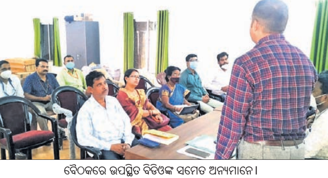
ବୈଠକରେ ଉପସ୍ଥିତ ବିଭିନ୍ନ ସମେତ ଅନ୍ୟମାନେ।

ବଳୟା, ୨୦୧୪(ଡି.ଏନ.ଏ.): କିଶୋରନଗର ବ୍ଲକ୍ ବଳୟା ହାଲସୁଲ ପରିସରରେ ଆୟତ୍ତା ୨୩ ତାରିଖରେ ବୁକ୍ସରୀୟ ସ୍ଵାସ୍ଥ୍ୟମେଳା ଅନୁଷ୍ଠିତ ହେବ।