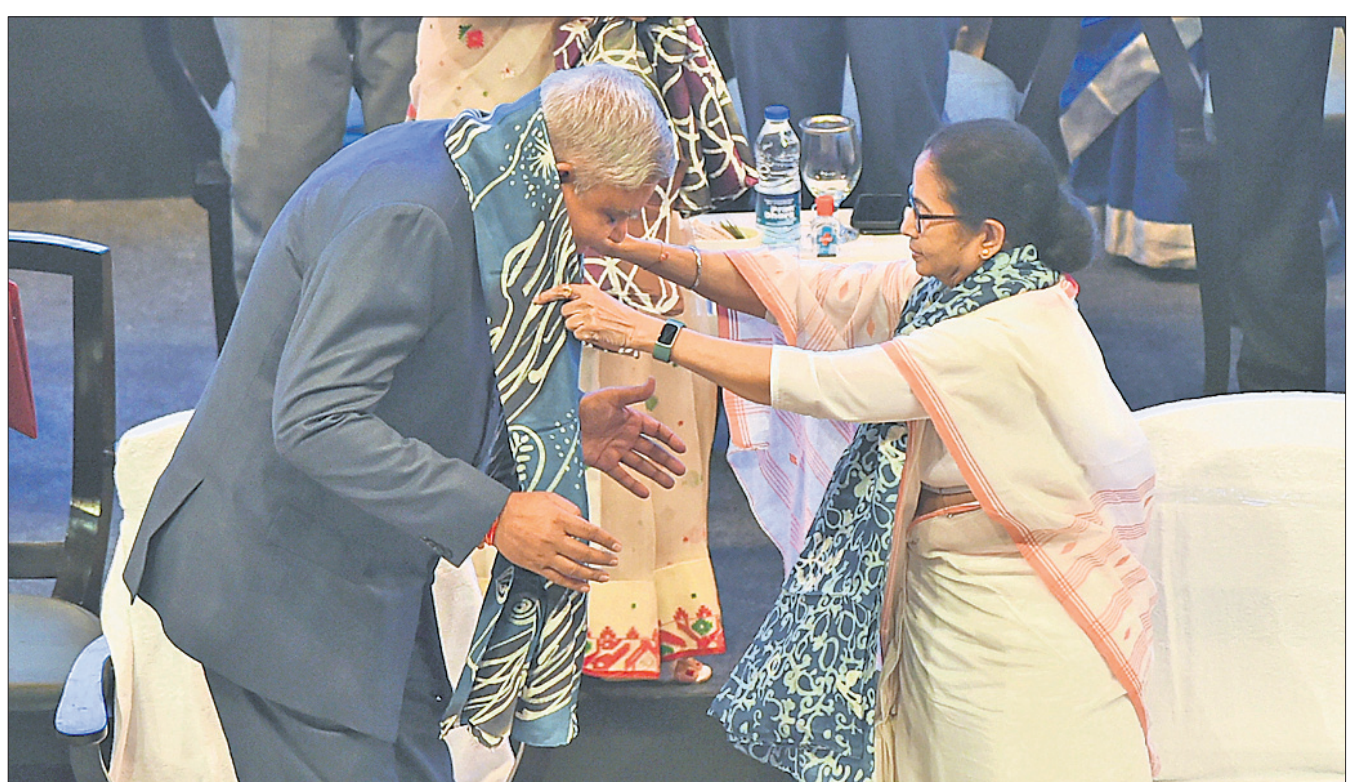
କୋଲକାତାରେ ରୁଧିରାଣୀ ସମ୍ମାନ ପାଇଁ ବିଜୁବେଂସ ସମିତି (ବିଜୁବିଏସ୍) ଦେଲେ ପଣ୍ଡିତଙ୍କୁ ରାଜ୍ୟପାଳ ଜଗଦୀପ ଧନକରଙ୍କୁ ଉପହାର ଦେଇ ସମ୍ମାନିତ କରୁଥିବା ପ୍ରତିମା ପତାକା ବାନ୍ଧିବା।