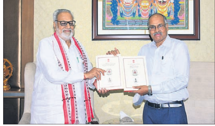
ଭୁବନେଶ୍ୱର, ୨୦୧୪ (ବୁଧବେଳା)