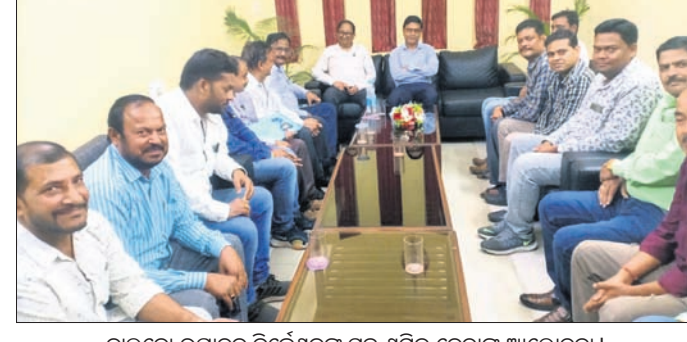
ନାଲକୋ ଉଦ୍‌ଘାଟନ ନିର୍ଦ୍ଦେଶକଙ୍କ ସହ ଶ୍ରମିକ ନେତାଙ୍କ ଆଲୋଚନା।

ଅଭିଯୋଗ କରିଛନ୍ତି, ଗ୍ରାମର ଏକ ମନ୍ଦିରର ପୁନରୁଦ୍ଧାର ହେଉଛି। ଏଥିପାଇଁ ଗ୍ରାମରେ ଚାନ୍ଦା ଆଦାୟ ହେଉଥିଲା। ସେ ଚାନ୍ଦା ନ ଦେବାକୁ ଗତ ଋତୁ ଗ୍ରାମସଭା ବସିଥିଲା। ଏଥିରେ ସରପଞ୍ଚ ଓଖାଳ ସହିତ ଗ୍ରାମର ମୁତକମାନେ ଚାନ୍ଦା ଦେବାକୁ ତାଙ୍କୁ ବାଧ୍ୟ କରିଥିଲେ। ଇଡ଼କୋ ସୁତରାଣ ଚାନ୍ଦା ଦେବାକୁ ମନା କରିବାରୁ ତଳେ ଛେପ ପକାଇ ନାଳ ଘଷିବା ପାଇଁ ତାଙ୍କୁ ବାଧ୍ୟ କରାଯାଇଥିଲା। ଏହି