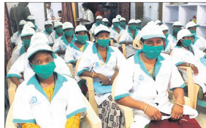
ତାଲିମ କାର୍ଯ୍ୟକ୍ରମରେ ପ୍ରଶିକ୍ଷାଥୀମାନେ।

ଦେଈନାଳ ଅପିସ, ୨୦୧୪ ଉଚ୍ଚତା ଏହି ଅବସରରେ ଜିଲ୍ଲାପାଳ ପୋଷଣ ଓ ସ୍ୱଚ୍ଛତା ଉପରେ ଗୁରୁତ୍ୱରୋପ କରିବା ସହିତ ଆଦିବାସୀ ମହିଳାଙ୍କ ସହିତ ସେମାନଙ୍କ ଅଞ୍ଚଳର ସମସ୍ୟା ସମ୍ପର୍କରେ ଅବଗତ ହୋଇଥିଲେ।