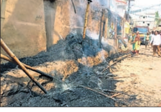
ଅଗ୍ନିକାଣ୍ଡରେ ଶତିଶୁଦ୍ଧ ସୁବଳକ ଘର ।