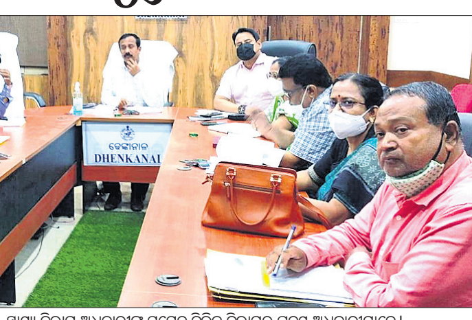
ସମାକ୍ଷା ବୈଠକରେ ଜିଲ୍ଲାପାଳ, ସ୍ୱାସ୍ଥ୍ୟ ବିଭାଗ ଅଧିକାରୀଙ୍କ ସମେତ ବିଭିନ୍ନ ବିଭାଗର ପଦସ୍ଥ ଅଧିକାରୀମାନେ।

ଦେଈନାଳ ଅପିସ, ୨୦୧୪ ଦେଈନାଳ ଜିଲ୍ଲା କଳକାହାଡ଼ ବୁକର ଅଞ୍ଚଳର ମହିଳାଙ୍କୁ ଆତ୍ମନିର୍ଭରଶୀଳ କରିବା ପାଇଁ ଶିକ୍ଷା ଦେବାକୁ ଉଦ୍ଦେଶ୍ୟରେ ଗ୍ରାମୀଣ ଆତ୍ମନିର୍ଭର ପ୍ରତିଷ୍ଠାନ (ଆରସେଟି) ପ୍ରତିଷ୍ଠାରେ ଆରମ୍ଭ ହୋଇଛି ୬ଦିନିଆ ପ୍ରଶିକ୍ଷଣ କାର୍ଯ୍ୟକ୍ରମ।