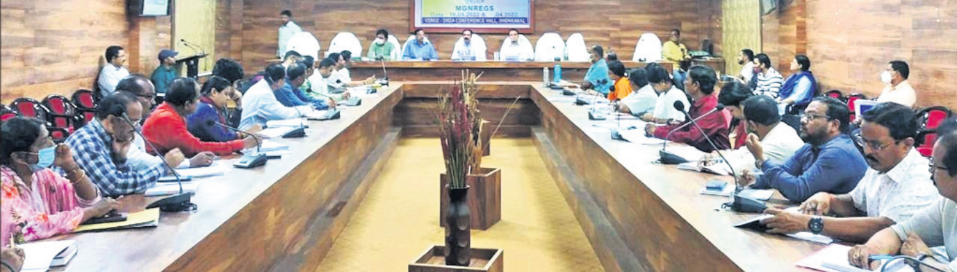
ବୈଠକରେ ଜିଲାପାଳଙ୍କ ସମେତ ବିଭିନ୍ନ ବିଭାଗର ସଦସ୍ୟ ଅଧିକାରୀମାନେ ।

■ ମାଲକୋ ପୁଲ ପ୍ରସ୍ତୁତ କରିବାକୁ ନିର୍ଦ୍ଦେଶ ■ ଅସମ୍ପୂର୍ଣ୍ଣ ଆବାସ କାମ ସାରିବାକୁ ଗୁରୁତ୍ଵ