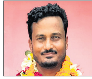
ଓସିମ ଏଜଦାନୀ କାଦ୍ରୀ ଦଖଲ କରିଥିଲା। ଉପାଧ୍ୟକ୍ଷ ଆସନ ମଧ୍ୟ ବିଜେତ ହାତେଇ ନେଇଛି।

ପ୍ରକାଶ ଯେ, ଗତ ମାର୍ଚ୍ଚ ୨୪ରେ ମତଦାନ ସମୟରେ ହିଂସାକାଣ୍ଡ ହୋଇ ଏନ୍ଏସି ନିର୍ବାଚନ ବାଧାପ୍ରାପ୍ତ ହୋଇଥିଲା। ପରେ ଏପ୍ରିଲ ୫ରେ ୨ଟି ବ୍ଲକ୍ରେ ସାନି ମତଦାନ ହୋଇଥିଲା। ଏନ୍ଏସି ଅଧ୍ୟକ୍ଷ ପଦବା ବିଜେତ ହାତକୁ ଯାଇଥିଲା। ସେହିପରି ୧୧ ଓଡ଼ିଶା ରାଜ୍ୟରୁ ୯ଟି ବିଜେତ ଓ ୨ଟି ଭାଜପା