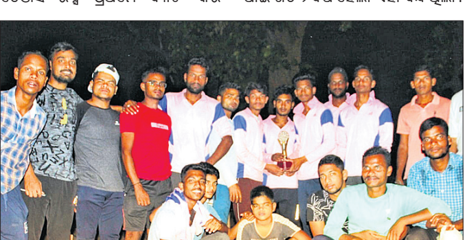
ଅତିଥିକ ଗହଣରେ ଚାକ୍ଷିୟନ ଦଳ।

କାମାକ୍ଷାନଗର, ୨୧୧୪(ଡି.ଏନ୍.ଏ.): ଦେଈନାଳ ଜିଲ୍ଲା କଳକାହାଡ଼ କଲେଜ ପଢ଼ିଆରେ ଚାଲିଥିବା କଳକାହାଡ଼ ପ୍ରତିଯୋଗିତା ଲିଟ୍ ଜୁକେଟ୍ ଉତ୍ସାହପାତ ହୋଇଯାଇଛି।