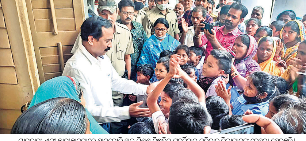
ଗ୍ରାମବାସୀ ଏବଂ ଛାତ୍ରାଛାତ୍ରୀମାନେ ହାତଯୋଡ଼ି ସ୍କୁଲ ମିଶ୍ରଣ ନିଷ୍ପତ୍ତିର ପୁନର୍ବିଚାର କରିବାକୁ ଜିଲାପାଳଙ୍କୁ ନେହୁରା ହେଉଛନ୍ତି।

ଦେଢ଼ାମାଲ ଜିଲା ଓଡ଼ାପଡ଼ା ବ୍ଲକ୍ ସଦାଶିବପୁର ପଞ୍ଚାୟତ ଅଧୀନ ପଶାସିଂହ ଗ୍ରାମ ପ୍ରାଥମିକ ବିଦ୍ୟାଳୟ ମିଶ୍ରଣକୁ ନେଇ ଗ୍ରାମବାସୀଙ୍କ ମଧ୍ୟରେ ପୁଞ୍ଜାତୁର ଅସନ୍ତୋଷ ଚାନ୍ଦୁ ରୂପ ଧାରଣ କରିଛି। ଛାତ୍ରାଛାତ୍ରୀଙ୍କୁ ଅକଳରେ ପକାଇଥିବା ଏଭଳି ନିଷ୍ପତ୍ତିକୁ ବିରୋଧ କରି ଗୁରୁବାର ଶତାଧିକ ଅଭିଭାବକ ଏବଂ ଛାତ୍ରାଛାତ୍ରୀ ଜିଲାପାଳଙ୍କୁ ପ୍ରକୋଷ୍ଟ ଆଗରେ ପ୍ରତିବାଦ କରିଛନ୍ତି। ଛୋଟଛୋଟ ପିଲାମାନେ ହାତଯୋଡ଼ି ‘ଆମକୁ ଆମ ସ୍କୁଲ ଫେରାଇଦିଅ’ ବୋଲି ଗୁହାରି କରିବା ଦୃଶ୍ୟ ସମସ୍ୟାର ଗମରତତା ଦର୍ଶାଉଥିବାବେଳେ ଏଥିପ୍ରତି ବିଳା ପ୍ରଶାସନ ଏବଂ ଶିକ୍ଷା ବିଭାଗ ସମାଜସେବା ନିର୍ଦ୍ଦେଶକଙ୍କୁ ଅଭିଭାବକମାନେ ଭୟରେ କରିବାକୁ ବୁଦ୍ଧିଜୀବୀମାନେ ଦାବି କରିଛନ୍ତି। ଅଭିଯୋଗ ଅନୁଯାୟୀ, ୨୦୨୦ରେ ଗଣଶିକ୍ଷା ବିଭାଗର ଯୋଷଣା ପରେ ପଶାସିଂହ ସରକାରୀ ପ୍ରାଥମିକ ବିଦ୍ୟାଳୟକୁ ଗ୍ରାମଠାରୁ ୨ କି.ମି. ଦୂର