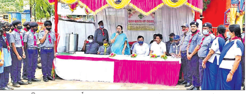
ଦହି ସରବତ ବଣ୍ଟନ କାର୍ଯ୍ୟକ୍ରମରେ ସ୍ୱାଭିଭୂ, ଗାଇଡ଼ର କର୍ମଚାରୀ ଏବଂ ଅନ୍ୟମାନେ।