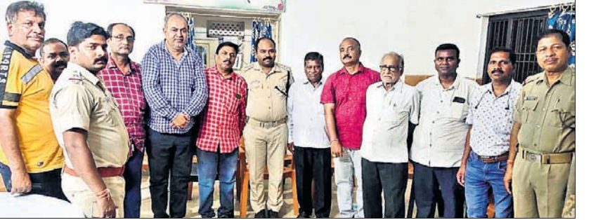
ବୈଠକରେ ପୋଲିସ୍ ଅଧିକାରୀ ଏବଂ ଅନ୍ୟମାନେ।