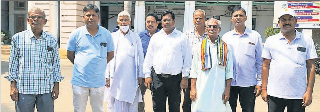
ପ୍ରଶାସନର ଦ୍ୱାରରୁ ହୋଇଥିବା ଜମିହରା କ୍ଷତିଗ୍ରସ୍ତ କର୍ମଚାରୀ।