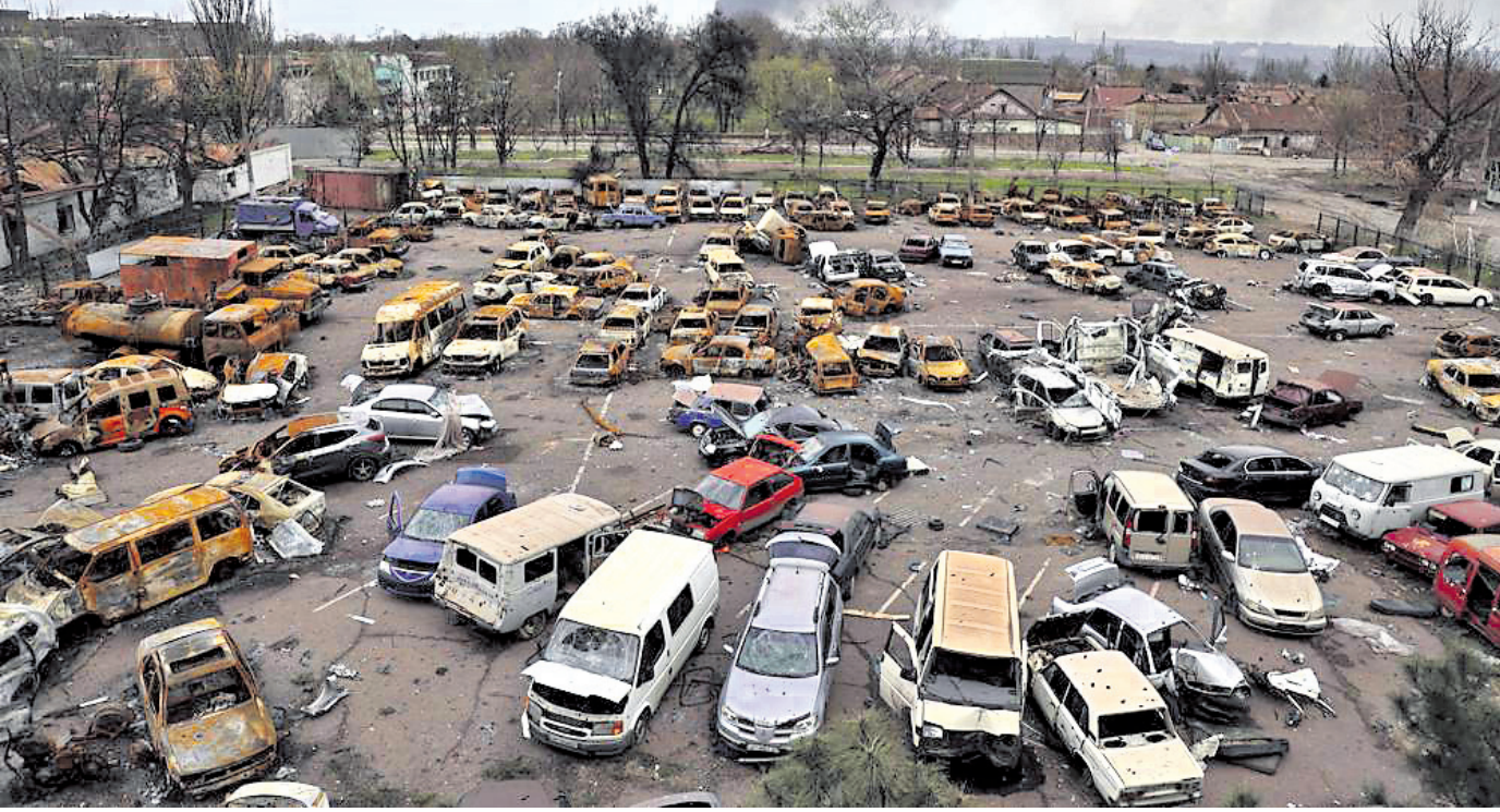
ମାରିଉପୋଲରେ ଏକ ଷ୍ଟିଲ୍ ପ୍ଲାଷ୍ଟରେ ରୁଷିଆ ସମର୍ଥକ ବିଚ୍ଛେଦବାଦୀମାନେ ଜାଲି ଦେଇଥିବା ଶତାଧିକ କାର୍।

ଫ୍ଲୋରିଡା, ୨୧୪: ଆମେରିକାର ପୂର୍ବତନ ରାଷ୍ଟ୍ରପତି ଡୋନାଲ୍ଡ ଟ୍ରମ୍ପଙ୍କ ଏକ ଭିଡିଓ ସୋସିଆଲ ମିଡିଆରେ ଉଠି ବୁଲୁଛି। ନିକଟରେ ତ୍ରିଟିଶ ବେଲିଜିକନ ପକ୍ଷରୁ ଆୟୋଜିତ ଏକ ସାକ୍ଷାତକାରରେ ଖବରଦେବା ଅବସରରେ ଉପସ୍ଥାପକ ମୋରଗାନଙ୍କ ପ୍ରଶ୍ନରେ ରାଗି ଯାଇ ଟ୍ରମ୍ପ୍ ଅଧାରୁ ଉଠିଆସିଥିବା ଦେଖିବାକୁ ମିଳିଛି। ମୋରଗାନ ଏହି ଶର୍ତ୍ତକୁ ରୁଧିର କରିବାକୁ ବୁଲୁଛନ୍ତି ବୋଲି କହିଥିଲେ। କାର୍ଯ୍ୟକ୍ରମ ରେକର୍ଡିଂ ଆରମ୍ଭରୁ ୨୦୨୦ ଆମେରିକା ରାଷ୍ଟ୍ରପତି ନିର୍ବାଚନରେ ଟ୍ରମ୍ପଙ୍କ ପ୍ରବର୍ତ୍ତନକୁ ପ୍ରଶଂସା କରିଥିଲେ। ବିକ୍ଷାପନ ବିରତି ପରେ ଆଲୋଚନା ଆରମ୍ଭ କରିଥିଲେ। ମୋରଗାନ କହିଥିଲେ, ରାଷ୍ଟ୍ରପତି ନିର୍ବାଚନ ନିରପେକ୍ଷ ଥିଲା। ବୋକା ବ୍ୟକ୍ତି ହିଁ ନିର୍ବାଚନ ହାରିଥିବା ସେ କହିଥିଲେ। ଟ୍ରମ୍ପ୍ ଉତ୍ତର ଦେଲେ ଶୋ: ଛାଡ଼ି ପଳାଇ ଆସିଥିବା ଦେଖିବାକୁ ମିଳିଥିଲା।