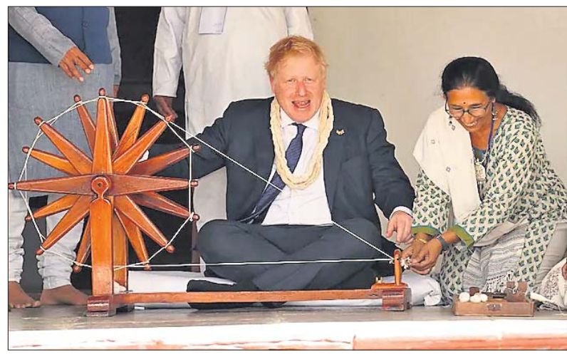
ସାବରମତି ଆଶ୍ରମରେ ବ୍ରିଟେନ ପ୍ରଧାନମନ୍ତ୍ରୀ ବୋରିସ୍ ଜନ୍ସନଙ୍କ ଉତ୍ସାହରେ ପୂଜା କାରୁଛନ୍ତି।