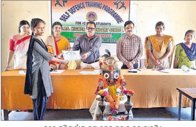
ଜଣେ ପ୍ରଶିକ୍ଷଣୀଙ୍କୁ ପ୍ରମାଣପତ୍ର ପ୍ରଦାନ କରାଯାଇଛି।

ଫକଳ ଲାଗିଲା, ସୂଚନା ନାହିଁ କାମାକ୍ଷାନଗର, ୨୧୧୪(ଡି.ଏନ୍.ଏ.)