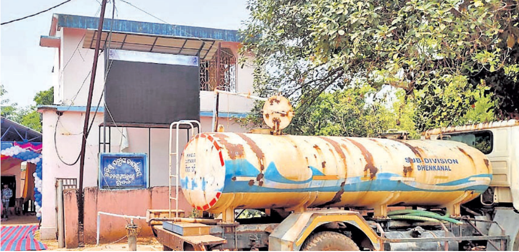
ଭୁବନ ଏନ୍-ଏସିରେ ଜନସ୍ୱାସ୍ଥ୍ୟ ବିଭାଗ କାର୍ଯ୍ୟାଳୟ।

ଭୁବନ ଏନ୍-ଏସିରେ ଜଳିକ ହେଉଛି ଜଳସଂକଟ ଅଭିଯୋଗ ଧରି ଜନସ୍ୱାସ୍ଥ୍ୟ ବିଭାଗକୁ ଲକ୍ଷ୍ୟ ଧାଡ଼ି