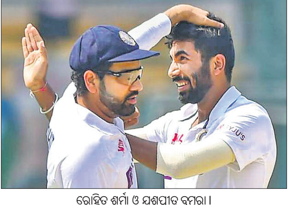
ରୋହିତ ଶର୍ମା ଓ ଯଶପ୍ରୀତ୍ ବୁମ୍ବରା।

ଭାରତର ସିଡିଆଇ ବିଜୟ ପକ୍ଷରେ ତାଙ୍କର ବିଶେଷ ଭୂମିକା ରହିଥିଲା। ପରେ ଦି ଓଭାଲରେ ତାଙ୍କ ମ୍ୟାଚ ବିଜୟୀ ବୋଲି ଯୋଗୁ ଗତ ବର୍ଷ ଜୁଲାଇରେ ଅନୁଷ୍ଠିତ ବିରିକରେ ଭାରତ ୨-୧ରେ ଅଗ୍ରଣୀ ଲାଭ କରିଥିଲା। ଗତ ଗ୍ରୀଷ୍ମଋତୁରେ ଚ୍ୟୁ ଅର୍ଡରରେ ରୋହିତଙ୍କ ବ୍ୟାଟି ଉଲ୍ଲେଖନୀୟ ଥିଲା। ସେ ୪ଟି ଚେଷ୍ଟା ମ୍ୟାଚରେ ୫୨.୫୭ ଆଭରେଜରେ ୩୬୮ ରନ କରିଥିଲେ। ଭାରତ ଅଧିନାୟକ ଓଭାଲରେ ମ୍ୟାଚ ବିଜୟୀ ହୋଇ ୧୨୭ ରନ କରିଥିଲେ।