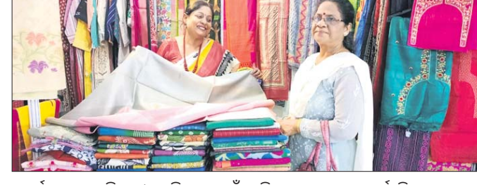
ପ୍ରଦର୍ଶନୀରେ ଏଥିକ୍ ଫ୍ରେଜ୍, ବିବାହ ପାଇଁ ପଡ଼ିଥିବା ଭିନ୍ନ-ଭିନ୍ନ ଫେୟାର ଉଭୟ ବ୍ୟବସାୟୀ ଏବଂ ଗ୍ରାହକଙ୍କ ମଧ୍ୟରେ ସମ୍ପର୍କ ସୃଷ୍ଟି କରିବାର ଏକ ମାଧ୍ୟମ ପାଲଟିବ ବୋଲି ସମ୍ପାଦକ ପକ୍ଷରୁ କୁହାଯାଇଛି।