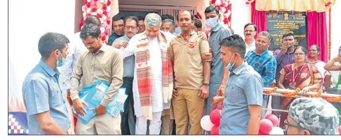
ମାଲକାନଗିରିରେ ରେଳମନ୍ତ୍ରୀ ଅଶ୍ୱିନୀ ଦେବଶ୍ୱରଙ୍କ ମୁଖ୍ୟ ଡାକଦ୍ୱାରା କୋରାପୁଟ ଉଦ୍‌ଘାଟନ କରୁଛନ୍ତି।

ରେଳ, ଯୋଗାଯୋଗ ଓ ଇଲେକ୍ଟ୍ରିକାଲିଟି, ସୂଚନା ଓ ପ୍ରଯୁକ୍ତିବିଦ୍ୟା ମନ୍ତ୍ରୀ ଅଶ୍ୱିନୀ ଦେବଶ୍ୱର ଶୁକ୍ରବାର ଦିନିଆଁ କୋରାପୁଟ-ମାଲକାନଗିରି ଜିଲ୍ଲା ଗସ୍ତକରି ବିଭିନ୍ନ କାର୍ଯ୍ୟକ୍ରମର ସମୀକ୍ଷା କରିଛନ୍ତି।