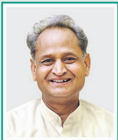
ASHOK GEHLOT Chief Minister, Rajasthan