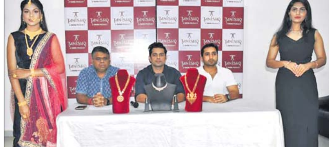
ଭୁବନେଶ୍ୱର ତନିଷ୍କ ପରିସରରେ 'ଅନୁପମା'ର ଉନ୍ନତଗତ ଅବସରରେ ସ୍ପୋର କର୍ତ୍ତୃପକ୍ଷ ଓ ଅନ୍ୟମାନେ ଯୋଗଦେଇଛନ୍ତି।

ଭୁବନେଶ୍ୱର, ୨୨୧୪ ଚଳିତ ବର୍ଷର ଅକ୍ଷୟ ତୃତୀୟା ଉପଲକ୍ଷେ ଗଣା ଗୁଡ଼ିଏ ଅକଳ୍ପୀତ ଦ୍ରାଘ 'ତନିଷ୍କ' ପକ୍ଷରୁ ଆକର୍ଷଣୀୟ ଅଫର ଓ ମନଲୋଭା ଡିଜାଇନର ସମ୍ପର୍କ ସହ 'ଅନୁପମା' ନାମରେ ନୂତନ ଉତ୍ପାଦର ଉନ୍ନତଗତ କରାଯାଇଛି।