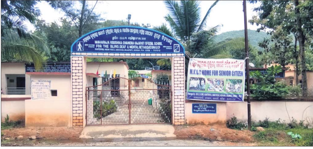
ଦୃଷ୍ଟିହୀନ ଓ ବଧୂର ବିଦ୍ୟାଳୟ ।