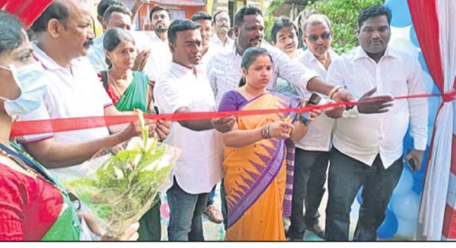
ସ୍ୱାସ୍ଥ୍ୟମେଳା ଉଦ୍‌ଘାଟନ କରୁଛନ୍ତି ବିଧାୟିକା ।

ଖଲିକୋଟ ବ୍ଲକ୍ କହେଇପୁର ମେଡିକାଲ ପରିସରରେ ଶୁକ୍ରବାର କୁଳସ୍ତରୀୟ ସ୍ୱାସ୍ଥ୍ୟମେଳା ଅନୁଷ୍ଠିତ ହୋଇଯାଇଛି ।