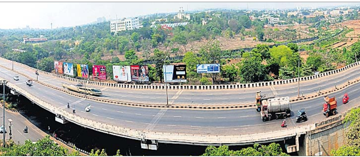
ପ୍ରଚଣ୍ଡ ଗୋଡ଼ାପାପ ଯୋଗୁ ଶନିବାର ଭୁବନେଶ୍ୱର ବାଣୀବିହାର ଏନ୍‌ଏଚ୍ ଓଭରବ୍ରିଜ୍ ଖାଁ ଖାଁ।

■ ରାସ୍ତା ନ ଥିବା ଖାଲୁଆ ଅଞ୍ଚଳରେ ଯାଉଥିଲେ ମଇଁଷି ଦଳି ତେବେ ଦୁର୍ଘଟଣା ଘଟିଥିବା ସ୍ଥାନ ପ୍ରାୟ ୧୨ ଫୁଟ ଖାଲୁଆ ଏବଂ ସେଠାରେ ରାସ୍ତା ନାହିଁ। ଏଠାକୁ ମଇଁଷି ଦଳି କିପରି ଆସିଲେ ଏବଂ ମଇଁଷିଗୁଡ଼ିକର ମାଲିକ କିଏ ତାହା ସ୍ପଷ୍ଟ ହୋଇ ନ ଥିବା ରାୟଗଡ଼ା ଆରପିଏସ୍ ଆଇଆଇସି ପକ୍ଷରୁ ଜଣାପଡ଼ିଛି। ଘଟଣାର ତଦନ୍ତ ଚାଲିଥିବା ସେ କହିଛନ୍ତି। ଅନ୍ୟପକ୍ଷରେ ଦୁର୍ଘଟଣା ପରେ ରେଳଧାରଣା ଉପରେ ଖଣ୍ଡବିଖଣ୍ଡିତ ମୃତଦେହ ପଡ଼ିଥିବାରୁ ରେଲୱେ କର୍ମଚାରୀମାନେ ପହଞ୍ଚି ସେଗୁଡ଼ିକୁ ବାହାର କରି ରେଳଧାରଣା ସମାପ୍ତ କରିଛନ୍ତି।