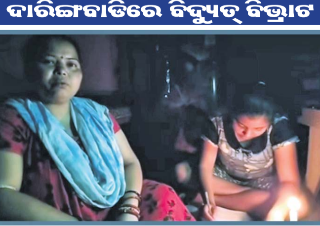
ମହମବତି ଆଲୁଅରେ ଜଣେ ମହିଳା ପଢ଼ାଉଛନ୍ତି ।

ଦାରିଙ୍ଗବାଡ଼ି ଅଞ୍ଚଳରେ ଘନଘନ ବିଦ୍ୟୁତ୍ କାର୍ଯ୍ୟ ନେଇ ଜନ ଅସନ୍ତୋଷ ବଢ଼ିବାରେ ଲାଗିଛି ।