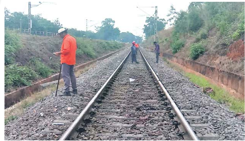
ଦୁର୍ଘଟଣା ପରେ ରେଲୱେ କର୍ମଚାରୀମାନେ ରେଳଧାରଣା ସମାପ୍ତ କରୁଛନ୍ତି।