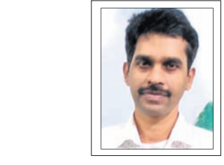
ପୁଣ୍ୟତୋୟା ବିଦ୍ୟାଳ, ଭଦ୍ରକ