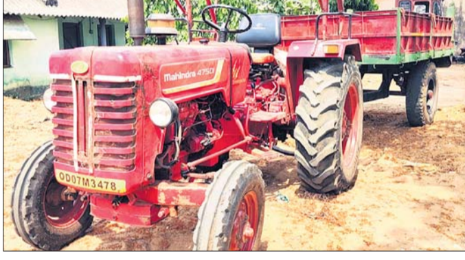
ଜବତ ଟ୍ରାକ୍ଟର ।

ପୁରୁଷୋତ୍ତମପୁର ଥାନା ହିଞ୍ଜିଳି ତହସିଲ ଅନ୍ତର୍ଗତ ଦୟାନିଧିପୁର ଗ୍ରାମରେ ୨ ଜଣ ଆରୁଆଇଲ୍ ଆକ୍ରମଣ ସହ ଗାଡ଼ି ଚଢ଼ାଇ ହତ୍ୟା ଉଦ୍ୟମ ଅଭିଯୋଗରେ ପୋଲିସ ଶନିବାର ବାଲି ବ୍ୟବସାୟୀ ୨ ଭାଇକୁ ଗିରଫ କରିଛି ।