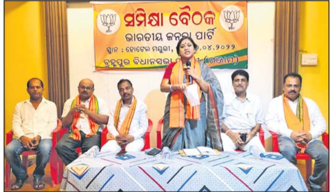
ସମୀକ୍ଷା ବୈଠକରେ ଉପସ୍ଥିତ ଭାଜପା ନେତୃବୃନ୍ଦ।

ବ୍ରହ୍ମପୁର ଅଫିସ, ୨୭।୪-ବ୍ରହ୍ମପୁର ମହାନଗର ପୌର ନିର୍ବାଚନରେ ଭୋଟ ଫଳାଫଳ ନେଇ ଭାଜପା ସମୀକ୍ଷା ବୈଠକ ମଙ୍ଗଳବାର ଅନୁଷ୍ଠିତ ହୋଇଥିଲା।