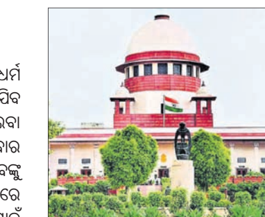
ଆଗାମୀ ଧର୍ମ ସଂସଦରେ କୌଣସି ପ୍ରତିକୂଳ ମନ୍ତବ୍ୟ ଦିଆଯିବ ନାହିଁ ବୋଲି କର୍ତ୍ତୃପକ୍ଷ ନିଶ୍ଚିତ ଥିବା

ରୁଚକାରେ ବୁଧବାର ହେବାକୁ ଥିବା ଧର୍ମ ସଂସଦରେ ପ୍ରତିକୂଳ ମନ୍ତବ୍ୟ ଦିଆଯିବ ନାହିଁ ବୋଲି ଲିଖିତ ଭାବେ ଜଣାଇବା ପାଇଁ ସୁପ୍ରିମକୋର୍ଟ ମଙ୍ଗଳବାର ନିର୍ଦ୍ଦେଶ ଦେଇଛନ୍ତି। ଧର୍ମ ସଂସଦରେ ଦୃଶିତ ମନ୍ତବ୍ୟ ଦିଆଗଲେ ଏଥିପାଇଁ ପକ୍ଷରୁ ୨ ହଜାର ଲୋକଙ୍କୁ ଚାକିରି ସୂଚିତ। ଯୋଗାଇଦିଆଯାଇଥିବା ଅବାଲତ ଚେତାବନୀ ଦେଇଛନ୍ତି।