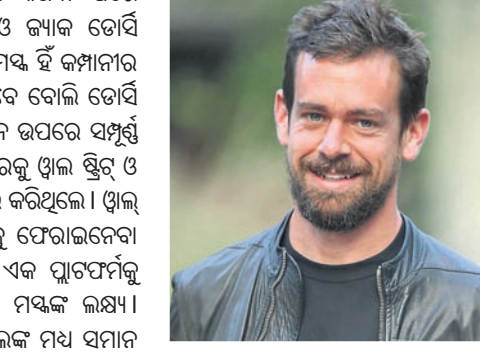
ଭୂମିକାରେ ସମ୍ମାନିତାଧିକାରୀ ଧ୍ୟାନବାଦ ବୋଲି ଡୋର୍ସି ବ୍ୟାକ୍‌ଟୁ ରୁଇଟର କରିଛନ୍ତି।

ଏଲନ୍ ମାସ୍କ ରୁଇଟର କିଣିବା ପରେ ଏହାର ପୂର୍ବତନ ସିଇଓ ଜ୍ୟାକ୍ ଡୋର୍ସି ଖୁସି ବ୍ୟକ୍ତ କରିଛନ୍ତି। ମାସ୍କ ହିଁ କମ୍ପାନୀର ସ୍ୱପ୍ନ ପୂରଣ କରିପାରିବେ ବୋଲି ଡୋର୍ସି କହିଛନ୍ତି। ମାସ୍କ ମିଶନ ଉପରେ ସମ୍ପୂର୍ଣ୍ଣ ଭରସା ରହିଛି। ରୁଇଟରକୁ ଫ୍ଲାଇ ଷ୍ଟ୍ରିଟ୍ ଓ ଆର୍ ମଡେଲ୍ ଆଣି ଆଣି କରିଥିଲେ। ଫ୍ଲାଇ ଷ୍ଟ୍ରିଟ୍ ହାତକୁ ରୁଇଟରକୁ ଫେରାଇନେବା ଉପଯୁକ୍ତ ପଦକ୍ଷେପ। ଏକ ପ୍ଲାଟଫର୍ମକୁ ବିଶ୍ୱାସଯୋଗ୍ୟ କରିବା ମାସ୍କଙ୍କ ଲକ୍ଷ୍ୟ। ସିଇଓ ପରାଗ ଅଗ୍ରୱାଲଙ୍କ ମଧ୍ୟ ସମାନ ଲକ୍ଷ୍ୟ ରହିଥିବା ଡୋର୍ସି କହିଛନ୍ତି। ଉଭୟେ କମ୍ପାନୀକୁ ଏକ କନ୍ୟକର ଭୂମିକାରେ ସମ୍ମାନିତାଧିକାରୀ ଧ୍ୟାନବାଦ ବୋଲି ଡୋର୍ସି ବ୍ୟାକ୍‌ଟୁ ରୁଇଟର କରିଛନ୍ତି।