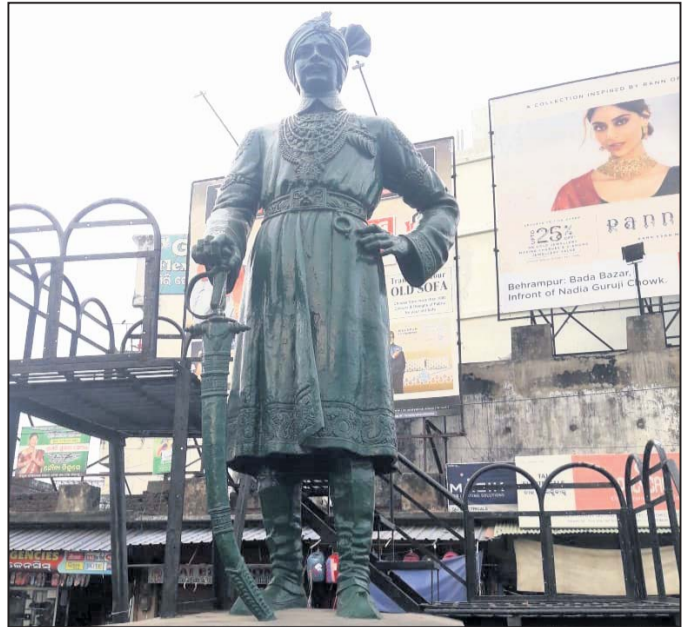
ବ୍ରହ୍ମପୁର କୃଷ୍ଣଚନ୍ଦ୍ର ଗଜପତିଙ୍କ ପ୍ରତିମୂର୍ତ୍ତି। ଗଠନ ହେଲା। ମହାରାଜାଙ୍କ ସ୍ମୃତିରେ ମଙ୍ଗଳବାର ନାମ ଗଜପତି ଯୋଷଣା କଲେଜ ପରିସରରେ ଗଜପତିଙ୍କ ସ୍ମୃତି

ବ୍ରହ୍ମପୁର ଅଫିସ, ୨୭।୪-ସେଣ୍ଟ୍ରାଲ୍ ସେକ୍ଟର ସଂଗଠନ ଆଶ୍ରମ ଓ ନାସିଡି ଆନୁକୂଲ୍ୟରେ ୨ ଦିନିଆ ଦକ୍ଷିଣ ଦିଗର ସମ୍ପର୍କିତ ଏକ ବୈଠକ ମଙ୍ଗଳବାର ଶେଷ ବଜାର ଏନଜିଓ ହଲରେ ଅନୁଷ୍ଠିତ ହୋଇଯାଇଛି। ଏଥିରେ ବ୍ରହ୍ମପୁର ସହରର ୧୦୦ଟି ଖାଦ୍ୟପେୟ ଉଠା ଦୋକାନୀମାନେ ଯୋଗ ଦେଇଥିଲେ।