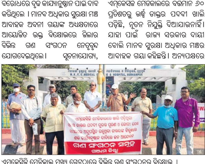
ଏମ୍.କେ.ସି.ଜି. ମେଡିକାଲ ମୁଖ୍ୟ ଗେଜେଟରେ ବିଭିନ୍ନ ଗଣ ସଂଗଠନର ବିରୋଧ।

ବିରୋଧରେ ଦୃଢ଼ କାର୍ଯ୍ୟାନୁଷ୍ଠାନ ପାଇଁ ଦାବି କରିଥିଲେ। ମାନବ ଅଧିକାର ପୁରକ୍ଷା ମଞ୍ଚ ଆବାହକ ଅବଦାନ ଗଣାଙ୍କ ଅଧ୍ୟକ୍ଷତାରେ