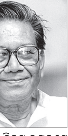
ପ୍ରଥମ ଶ୍ରୀକ୍ଷ ଦିବସ ଉପଲକ୍ଷେ

ଅବସ୍ଥାନ କଲାପରେ ତାଙ୍କ ଜୀବନରେ ସଂଘଟିତ ହୋଇଥିଲା ଏହି ଅଭୂତପୂର୍ବ ବିକଳନ। ମନୋଜୀୟ ସମ୍ବେଦନଶୀଳତା ଆଧୁନିକତାରେ ରୁପାନ୍ତରିତ ହୋଇଥିବାବେଳେ ତାଙ୍କ ସାମାଜିକତା ତନ୍ତା ଭିନ୍ନ ଏକ ସକାରାତ୍ମକ ଦୃଷ୍ଟିକୋଣରେ, ଏପରିକି ତାଙ୍କ ସଂଗ୍ରାମ ସମ୍ପର୍କରେ ପରିଣତ ହୋଇଥିଲା। ମନୋଜ ଦାସଙ୍କ କେତୋଟି ମାତ୍ର ଦୃଷ୍ଟାନ୍ତକାରୀ ଗଳ୍ପ ବା ଉପନ୍ୟାସର କଥା ପଢ଼ୁ। ‘ଲକ୍ଷ୍ମୀର ଅଭିସାର’ ତାଙ୍କର ଏକ ବିଶ୍ୱବିଦିତ ଗଳ୍ପ। ୧୯୮୩ ମସିହାରେ