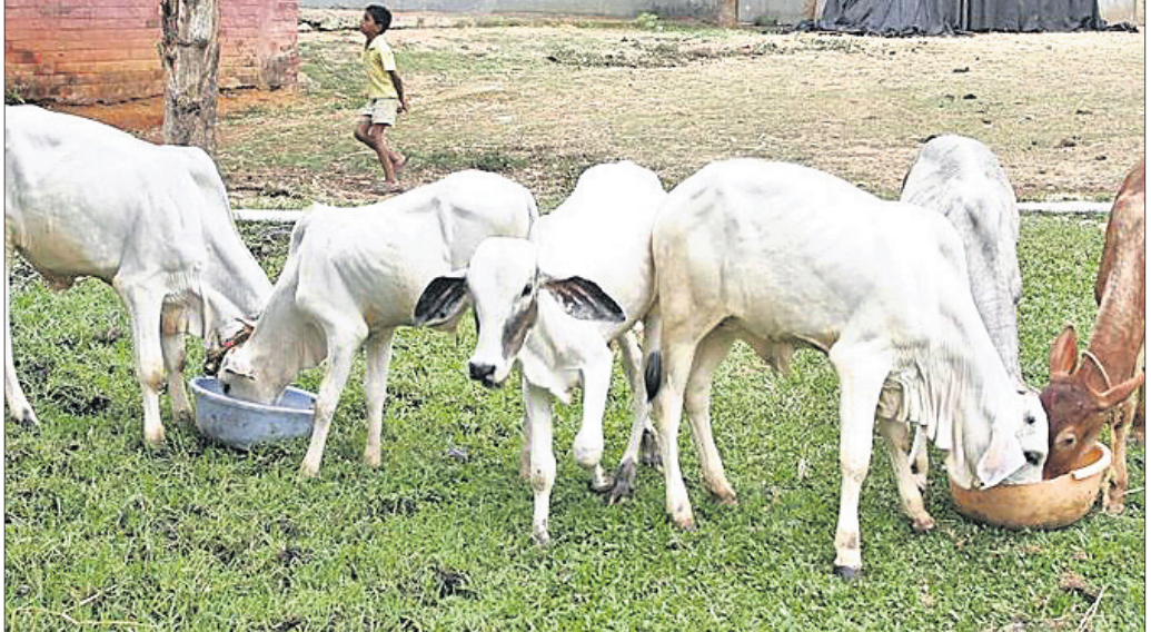
ପ୍ରାଣୀ ଚିକିତ୍ସା ଦିବସ ମୁଖ୍ୟ ବାର୍ତ୍ତା ହେଲା - ‘ପ୍ରାଣୀ ଚିକିତ୍ସା ସେବାର ସୁଦୃଢ଼ୀକରଣ’ । ଉତ୍ତମ ପ୍ରାଣୀ ଓ ମନୁଷ୍ୟର ସ୍ୱାସ୍ଥ୍ୟରକ୍ଷା

ପ୍ରାଣୀ ଚିକିତ୍ସକମାନଙ୍କ ଅବଦାନ ବେଶ୍ ଗୁରୁତ୍ୱପୂର୍ଣ୍ଣ । ରାଜ୍ୟରେ ପ୍ରାଣୀ ଚିକିତ୍ସକ ଓ ପ୍ରାଣୀ ଚିକିତ୍ସା ସେବାର ଗୁରୁତ୍ୱକୁ ଉପଲବ୍ଧି କରି ପ୍ରାଣୀ ଚିକିତ୍ସାଳୟ ଓ ପ୍ରାଣୀଧନ ନିରୀକ୍ଷକ କେନ୍ଦ୍ରଗୁଡ଼ିକର ଭିତ୍ତିଭୂମି ବିକାଶ ସହିତ ଏଗୁଡ଼ିକର ଆଧୁନିକୀକରଣ ନିମନ୍ତେ ସରକାର ସ୍ୱତନ୍ତ୍ର ପଦକ୍ଷେପ ଗ୍ରହଣ କରିଛନ୍ତି । ଏଥିସହିତ ପ୍ରତ୍ୟେକ ବ୍ଲକ ସ୍ତରରେ ବ୍ଲକ ପ୍ରାଣୀ ଚିକିତ୍ସା ଅଧିକାରୀ, ଅତିରିକ୍ତ ପ୍ରାଣୀ ଚିକିତ୍ସକ, ଭ୍ରାମ୍ୟମାଣ ପ୍ରାଣୀ ଚିକିତ୍ସକ, ପ୍ରାଣୀ ଚିକିତ୍ସା ଓ ପ୍ରାଣୀ ପାଳନ ସମ୍ବନ୍ଧୀୟ ସମସ୍ତ ସୂଚନା ବା ତଥ୍ୟ ଚିକିତ୍ସାଳୟ ପ୍ରାଣୀ ପାଳନରେ ଆଦାନ ପ୍ରଦାନ ନିମନ୍ତେ ବ୍ଲକ ପ୍ରାଣୀ ଚିକିତ୍ସକ ପଦବୀ ଆଦି ସୃଷ୍ଟି କରାଯାଇଛି । ଏହି ବିଶ୍ୱ ପ୍ରାଣୀ ଚିକିତ୍ସା ଦିବସ ପାଳନ ଅବସରରେ ପ୍ରତ୍ୟେକ ଜିଲ୍ଲା ଓ ରାଜ୍ୟ ସ୍ତରରେ ସରକାର ପ୍ରାଣୀପାଳକ ଏବଂ ପ୍ରାଣୀ ଚିକିତ୍ସକ ଓ ପ୍ରାଣୀଧନ ନିରୀକ୍ଷକମାନଙ୍କୁ ଉତ୍ସାହିତ କରିବା ନିମନ୍ତେ କୃତ୍ରିମ ପ୍ରଜନନ, ବିକାଶକରଣ ଓ ଅନ୍ୟାନ୍ୟ କାର୍ଯ୍ୟକ୍ରମକୁ ଆଧାରକରି ପୁରସ୍କୃତ ବା ସମ୍ବର୍ଦ୍ଧନା ଆଦି କାର୍ଯ୍ୟକ୍ରମ ଗ୍ରହଣ କରିଛନ୍ତି । ଫଳରେ ପ୍ରାଣୀ ସମ୍ପଦ ବିକାଶ କ୍ଷେତ୍ରରେ ନିୟୋଜିତ ପ୍ରାଣୀ ପାଳକ ଓ ବିଭାଗୀୟ ଡାକ୍ତରମାନେ ଅଧିକ ଉତ୍ସାହିତ ହେବା ସଙ୍ଗେ ସଙ୍ଗେ ଏହା ଆମ ରାଜ୍ୟକୁ ଦୁଗ୍ଧ, ମାଂସ ଓ ଅଣ୍ଡା ଉତ୍ପାଦନ କ୍ଷେତ୍ରରେ ସ୍ୱାବଲମ୍ବୀ କରିବା ସହିତ ଚାଷୀ ତଥା ପ୍ରାଣୀ ପାଳକମାନଙ୍କ ଆୟ ବୃଦ୍ଧିରେ ଆମ ରାଜ୍ୟରେ ଦୁଗ୍ଧ, ମାଂସ ଓ ଅଣ୍ଡା ଉତ୍ପାଦନ ଆଦି ବୃଦ୍ଧି ସହିତ ଚାଷୀ ତଥା ପ୍ରାଣୀପାଳକଙ୍କ ଆୟ ବୃଦ୍ଧିକୁ ବିଗୁଣିତ କରାଯାଇପାରିଛି । ସେଥିପାଇଁ